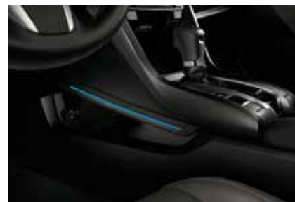
وحدة تحكم مركزية مضاءة Illuminated Central Console