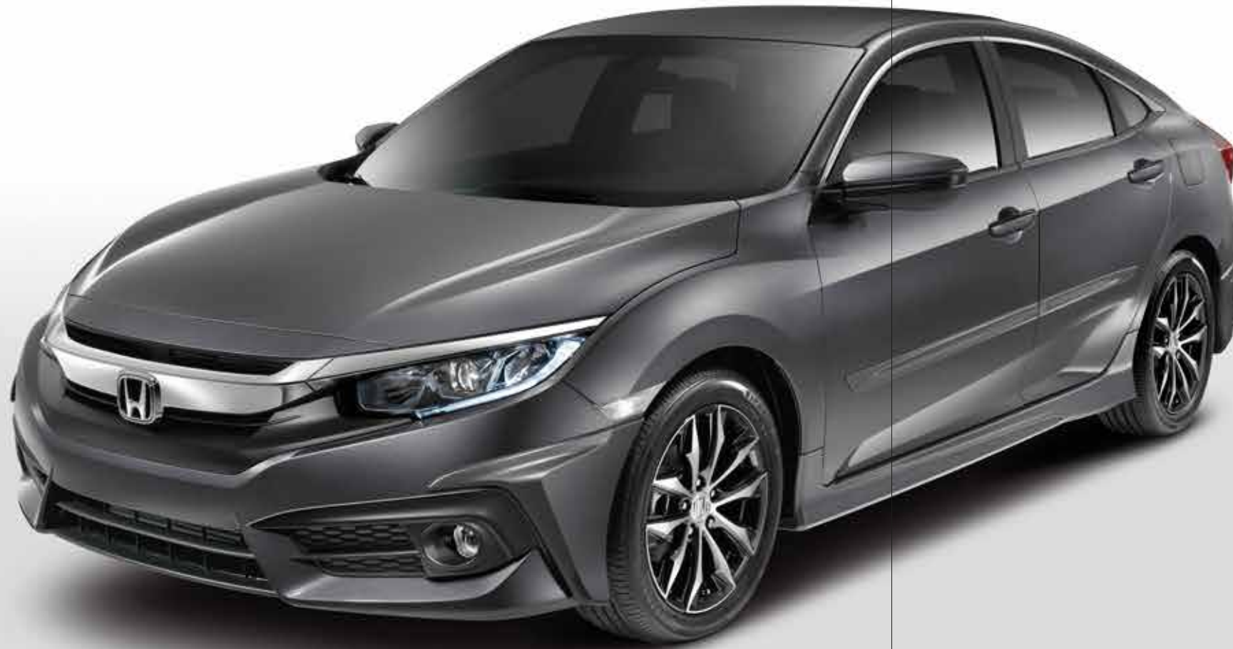
مصد أمامي سفلي Front Under Spoiler