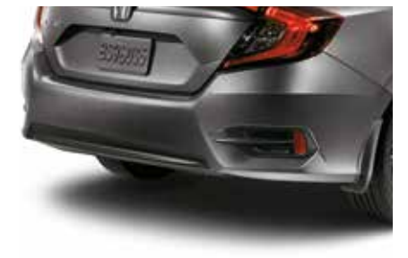
مصد خلفي سفلي Rear Under Spoiler