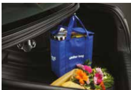
حمالة Cargo Hooks