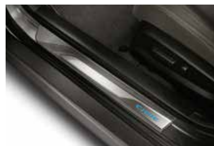
غطاء جانبي مضاء Illuminated Side Sill