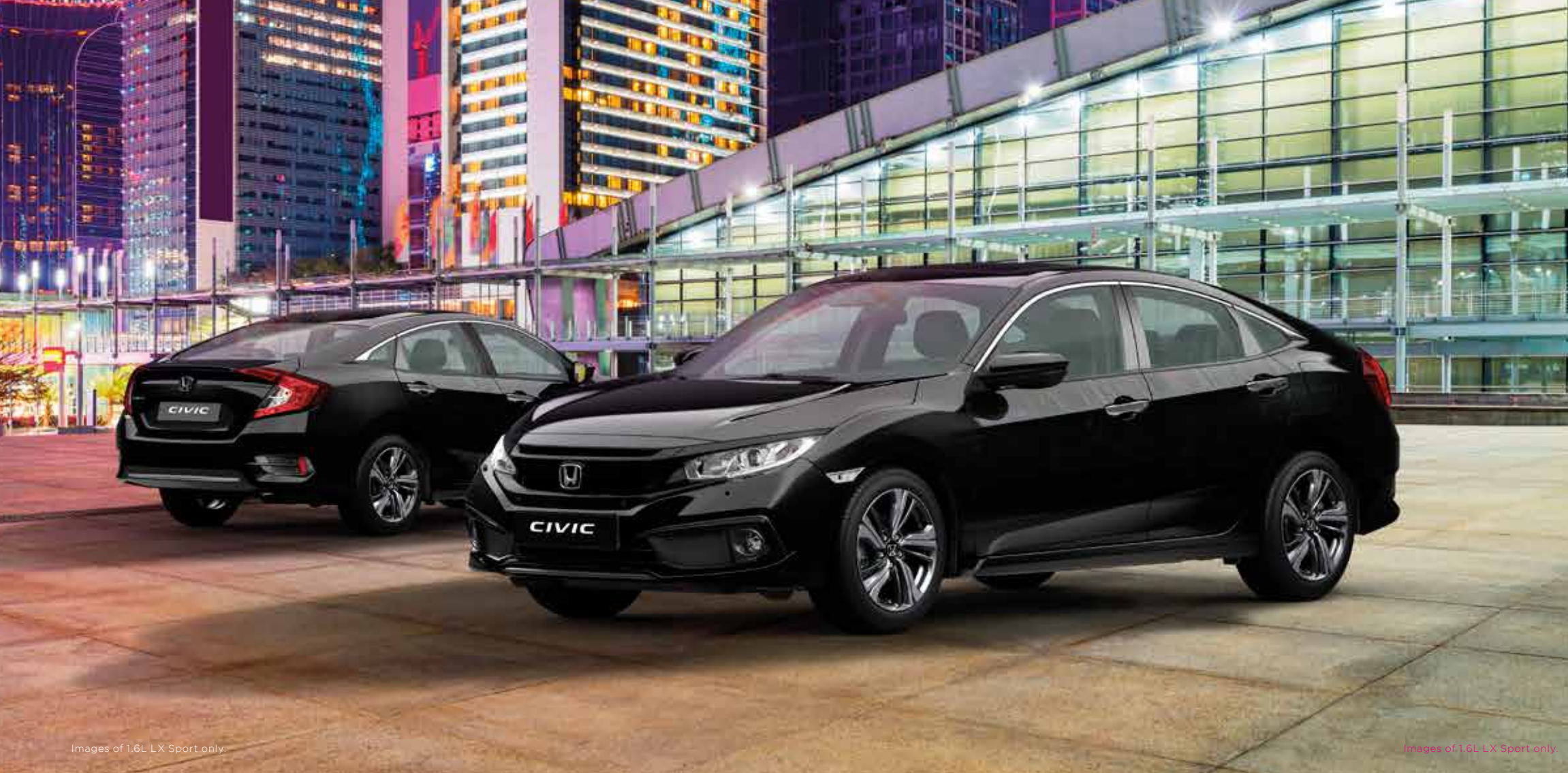
Images of 1.6L LX Sport only.

has the same dramatic sculptural lines and sporty design as the 2.0 litre and RS models. A product of innovative new engineering and construction techniques, it has lightweight and high rigidity body shell structure.