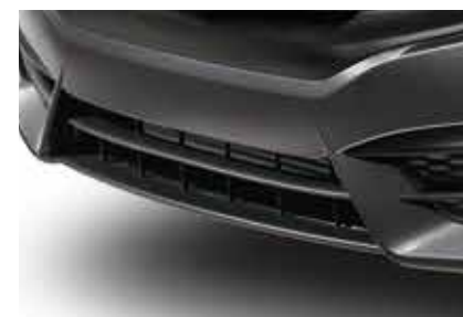
مصد أمامي سفلي Front Under Spoiler