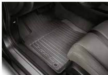
دعاسة لكل الفصول All Season Floor Mat