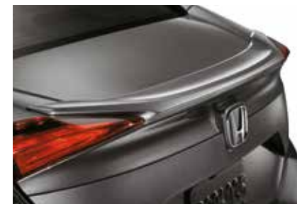
جناح خلفي نوغ دكلد Deck Lid Spoiler