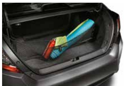
شبكة Cargo Net