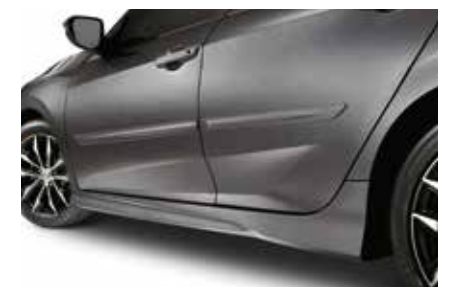
حزمة للأبواب الجانبية Body Side Molding