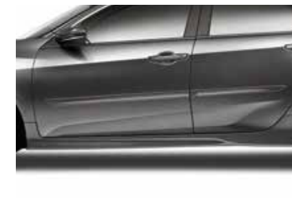
مصد جانبي سفلي Side Under Spoiler