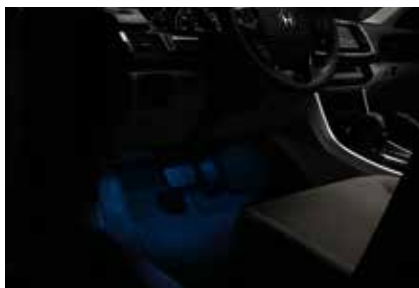
إضاءة الأجواء الداخلية Ambient Light