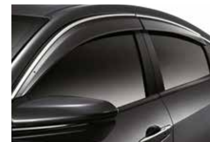
حاجب للباب Door Visor