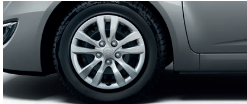
Llantas de acero de 15" con embellecedores