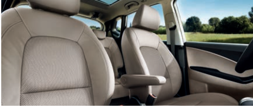
Tapicería Beige (dos tonos)