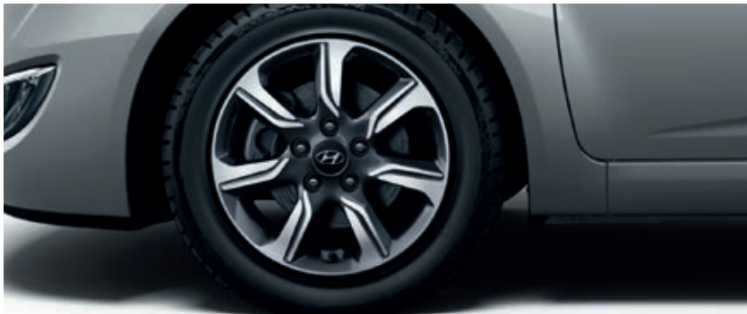
Llantas de aleación de 16"