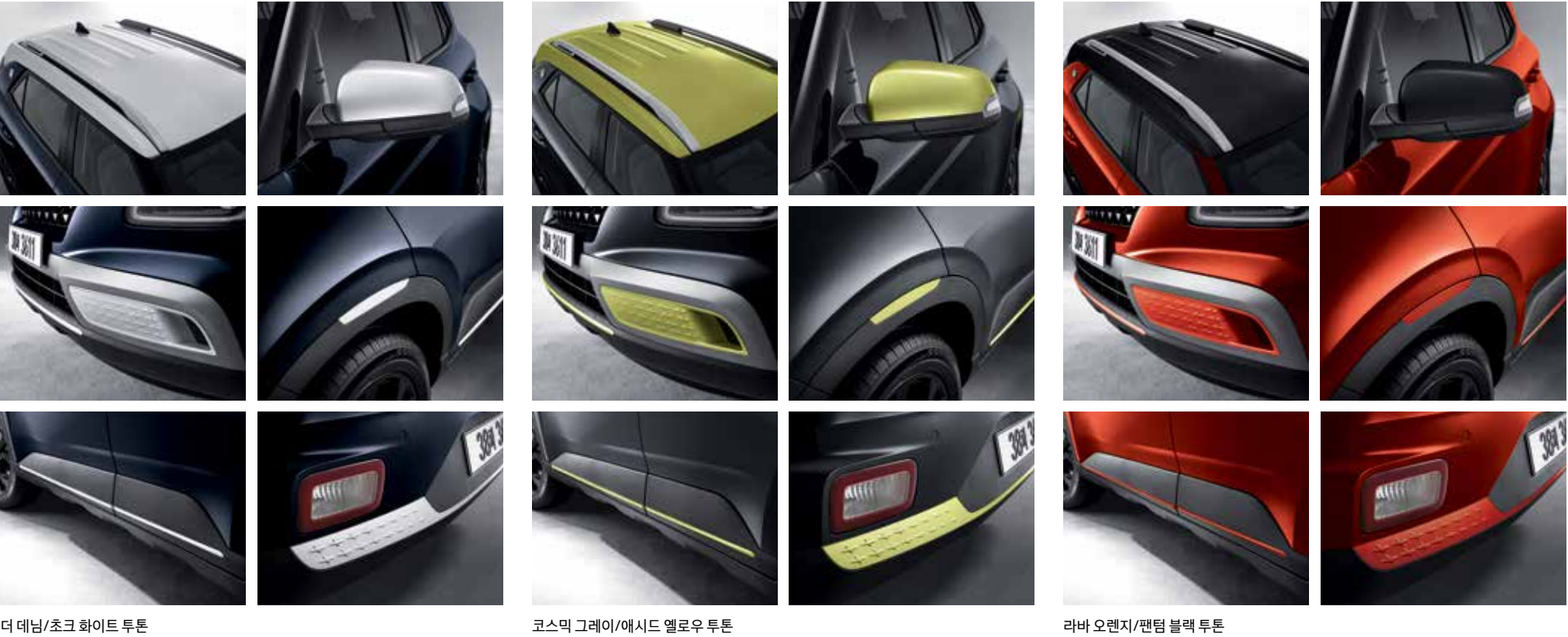
더 데님/초크 화이트 투톤

투톤 루프 컬러는 총 3종(초크 화이트 / 애시드 옐로우 / 팬텀블랙)입니다. 초크 화이트/애시드 옐로우 루프 선택 시, 컬러포인트는 해당 루프 컬러와 동일하게 적용됩니다. 팬텀 블랙 루프 선택 시, 아웃사이드 미러는 팬텀 블랙 컬러로 적용되며 그 외 컬러포인트는 바디 컬러로 적용됩니다.