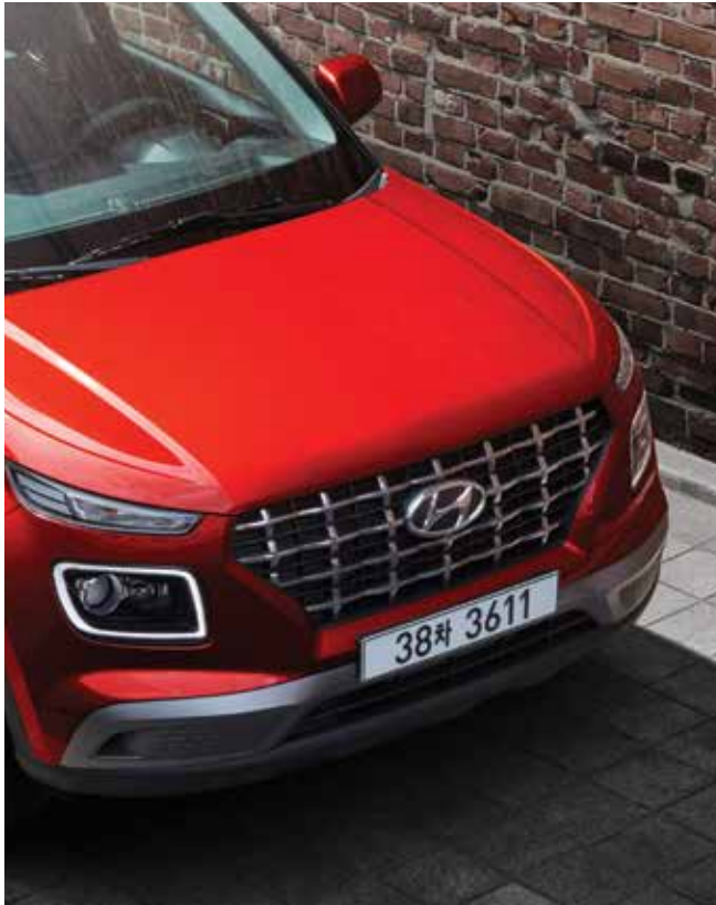
캐스케이딩 그릴 / LED 헤드램프