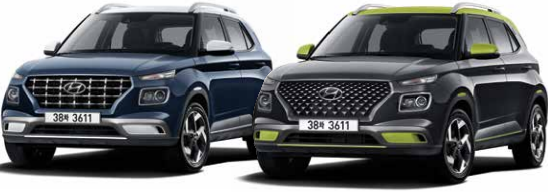
모던 풀옵션(더 데님/초크 화이트 투톤) / 플렉스 풀옵션(코스믹 그레이/애시드 옐로우 투톤)