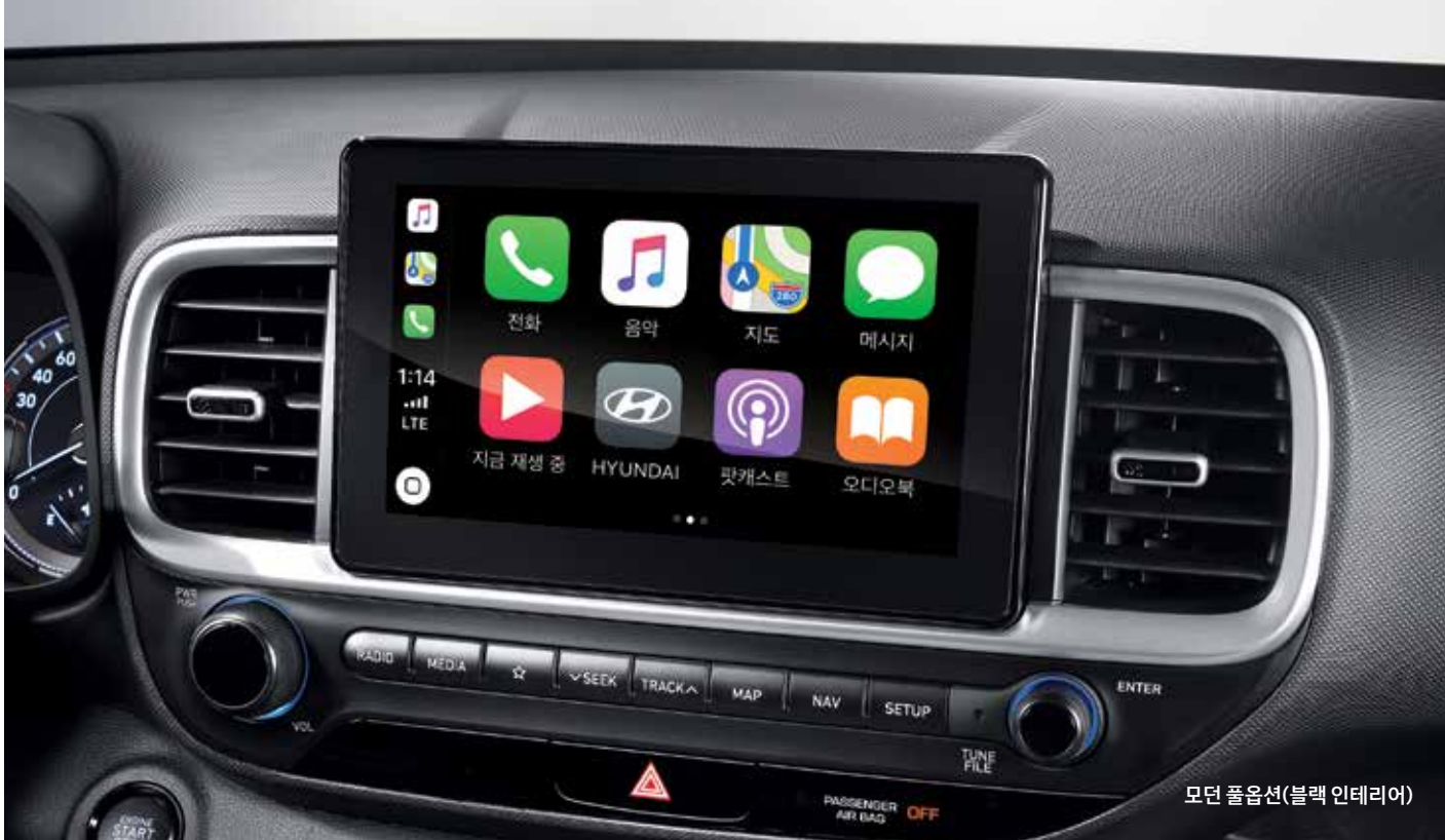
모던 풀옵선(블랙 인테리어)

8인치 내비게이션 8인치 심리스 디스플레이로 미래지향적 이미지와 시각적인 안정감을 전달합니다. 스마트폰의 주요 기능을 조작하고 디스플레이에 표시하는 폰 커넥티비티, 카카오톡 음성인식 시스템 등 최신 테크놀로지가 적용된 VENUE의 인포테인먼트 시스템은 새롭게 즐거운 경험을 제공합니다.