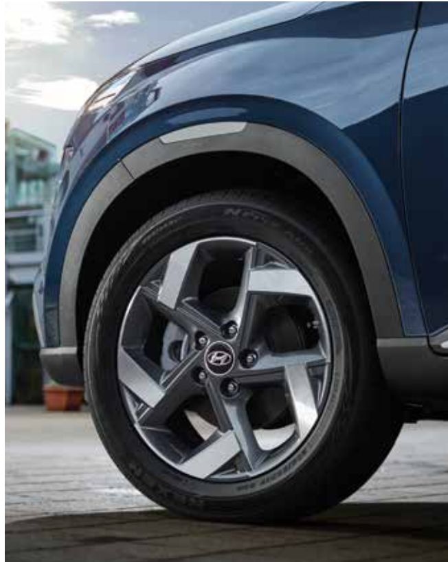
17인치 알로이 휠 & 타이어