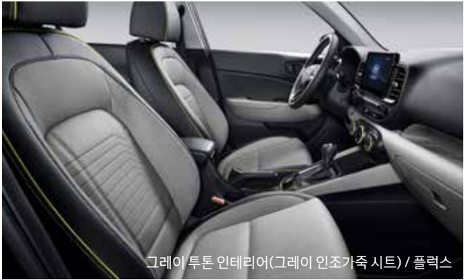
그레이 투톤 인테리어(그레이 인조가죽 시트) / 플렉스