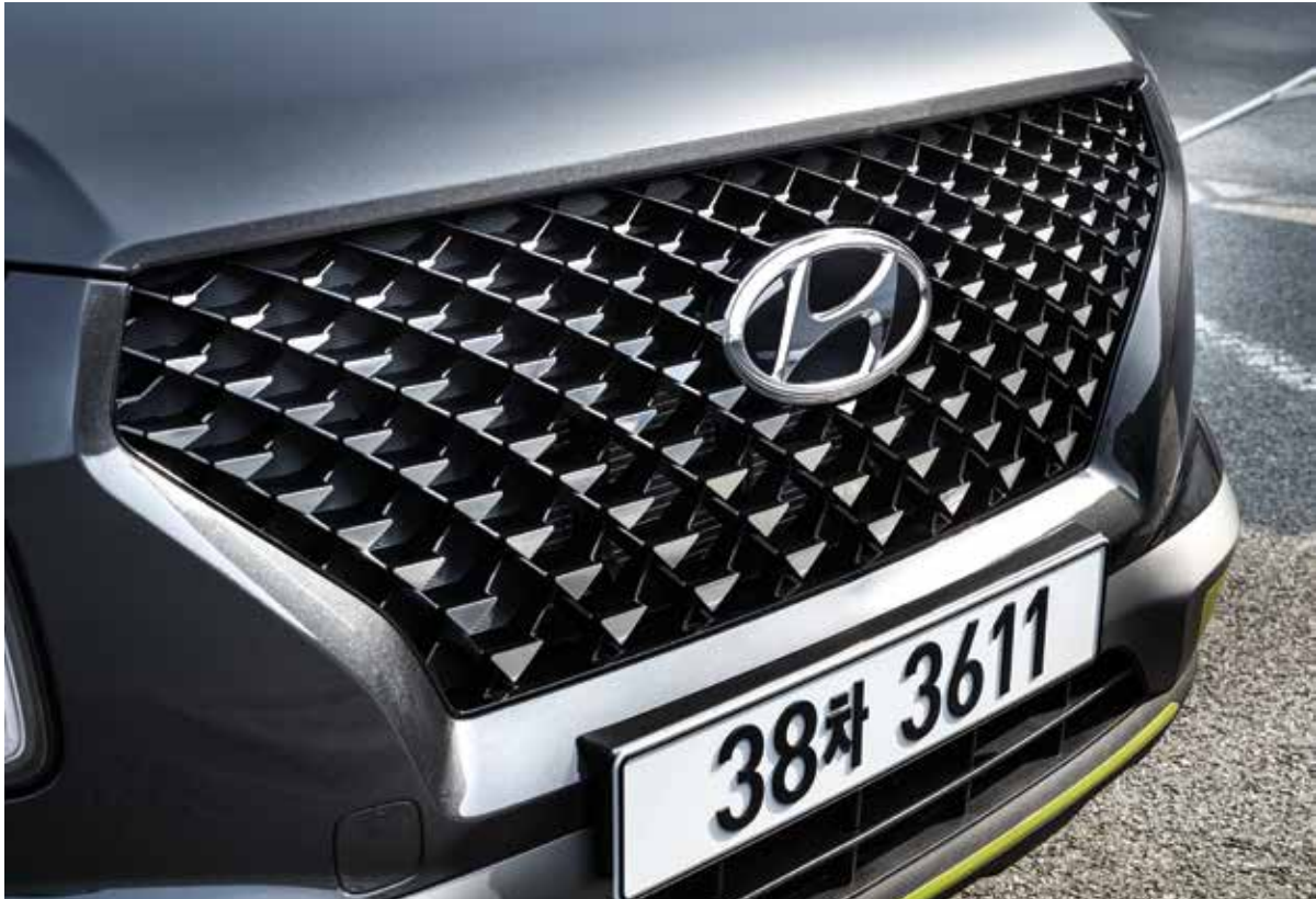
FLUX 전용 핫스탬핑 라디에이터 그릴