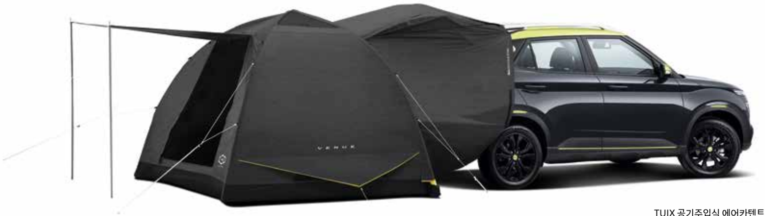
TUIX 공기주입식 에어카텐트

* TUIX 공기주입식 에어카텐트는 제드코리아(zedkorea.co.kr)를 통하여 구매 가능하며, 그 외 애프터마켓 상품은 블루앰버스 포인트몰 (hyundai.auton.kr) 및 튜익스몰(www.tuixmall.com)을 통하여 개별 품목 단위로 구매 가능합니다.