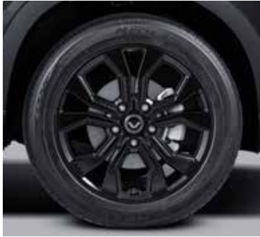
17인치 블랙 알로이 휠 스피닝 휠 캡(블랙/화이트/옐로우)