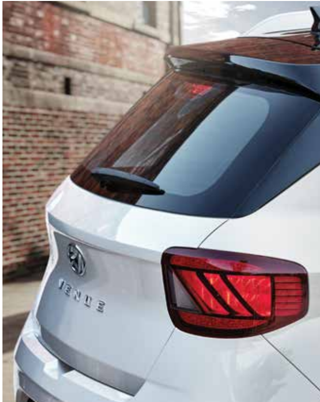
LED 리어 콤비램프