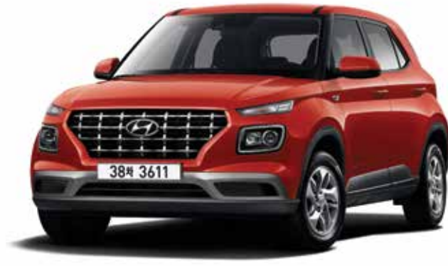
스마트 풀옵션(라바 오렌지)