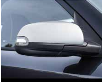
아웃사이드 미러 커버(메탈실버) C필러 뱃지(블랙/화이트/그레이/옐로우)

* TUIX 공기주입식 에어카텐트는 제드코리아(zedkorea.co.kr)를 통하여 구매 가능하며, 그 외 애프터마켓 상품은 블루앰버스 포인트몰 (hyundai.auton.kr) 및 튜익스몰(www.tuixmall.com)을 통하여 개별 품목 단위로 구매 가능합니다.