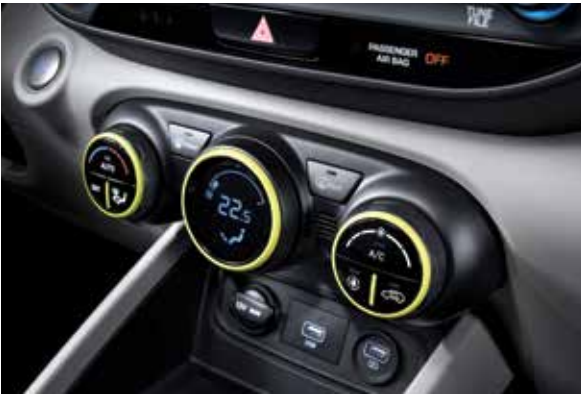
에어벤트 풀오토 에어컨