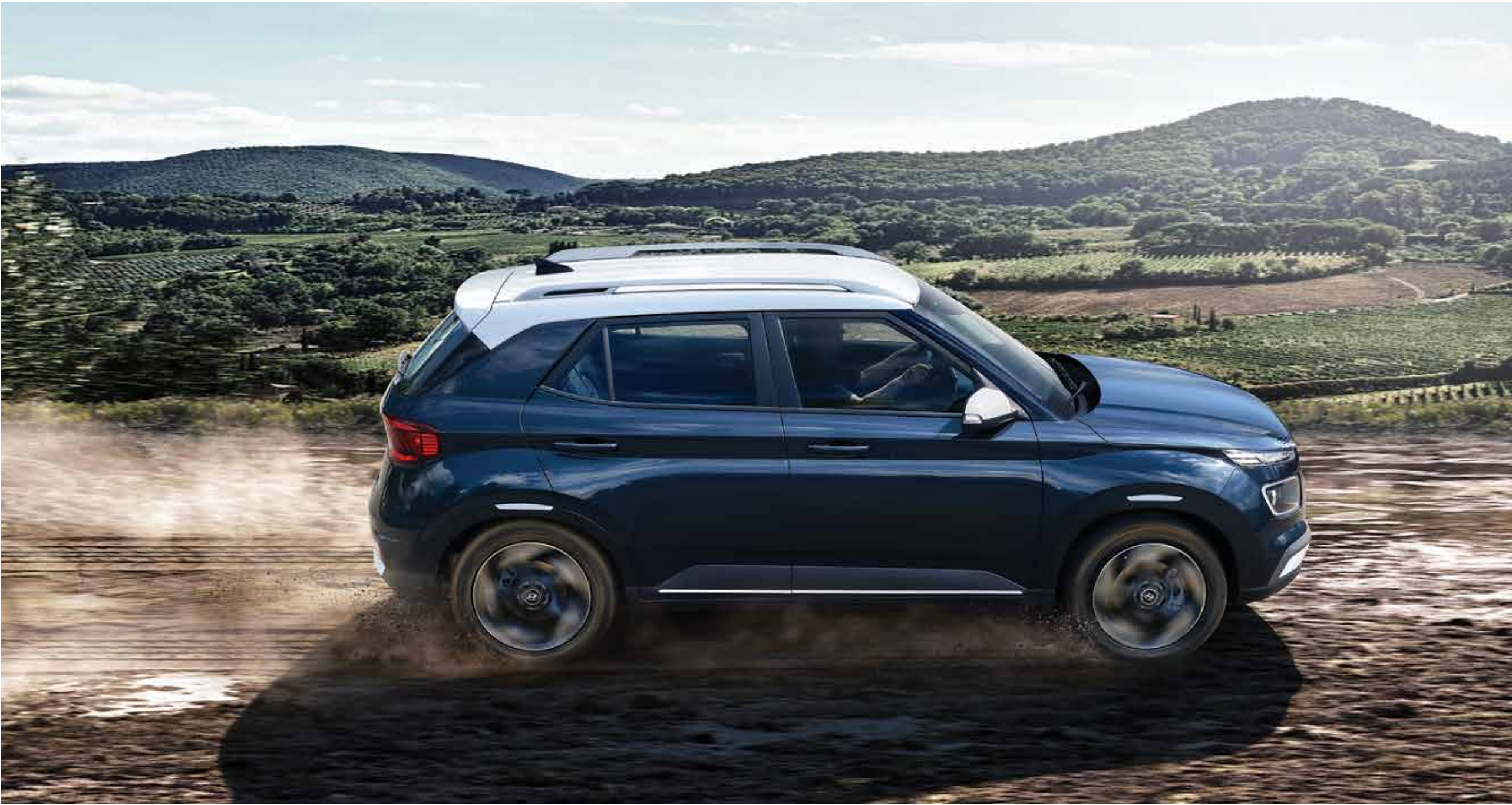
모던 풀옵션(더 데님/초크 화이트 투톤)