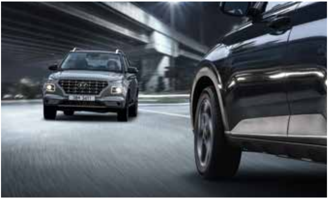
운전자 주의 경고 운전자의 피로나 부주의한 운전 패턴으로 판단되면 팝업 메시지와 경고음을 통해 휴식을 권유합니다.