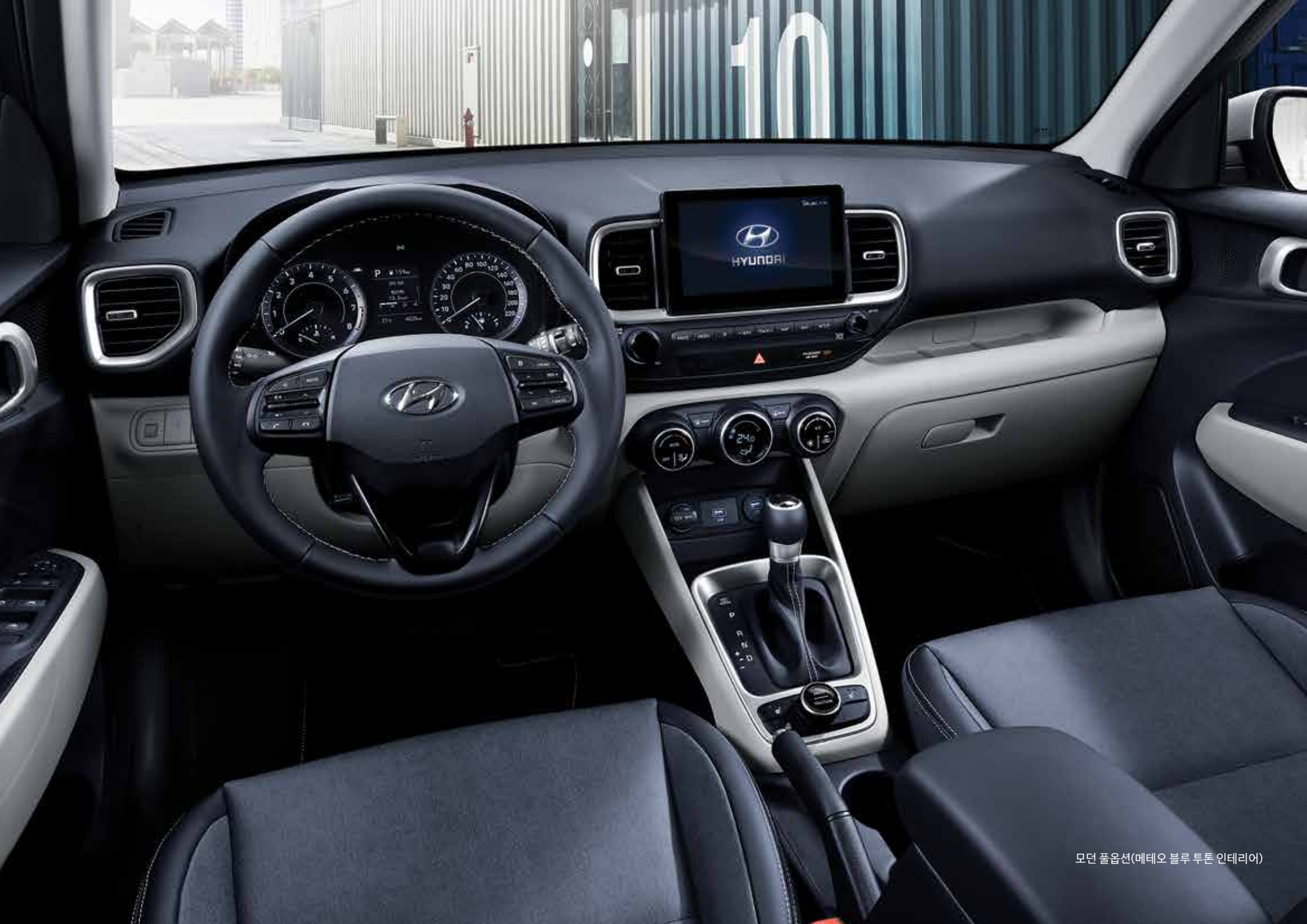
모던 폴옵션(메테오 블루 투톤 인테리어)