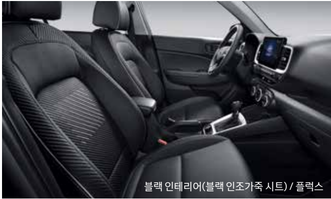
블랙 인테리어(블랙 인조가죽 시트) / 플렉스