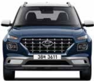
윤거 전 1,535