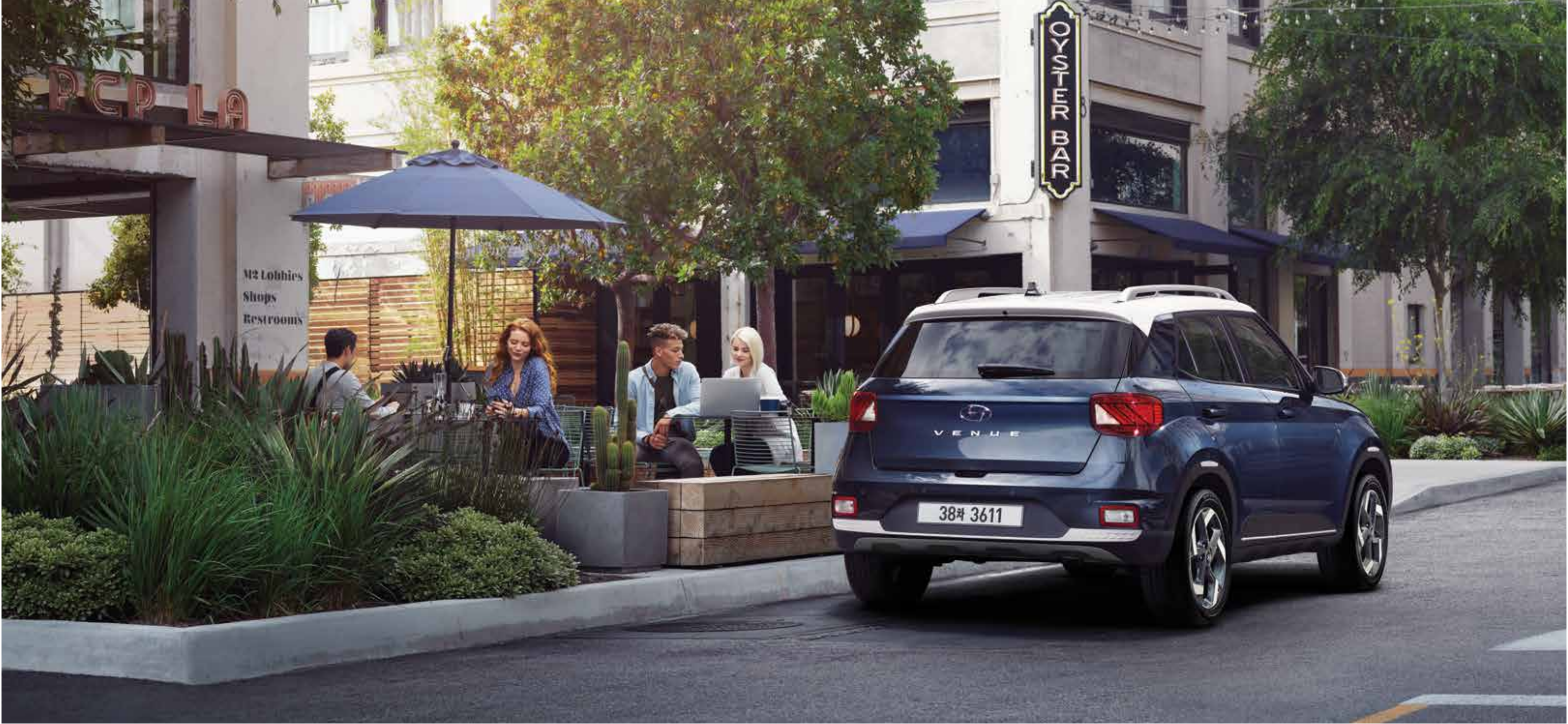
모던 풀옵션(더 데님/초크 화이트 투톤)