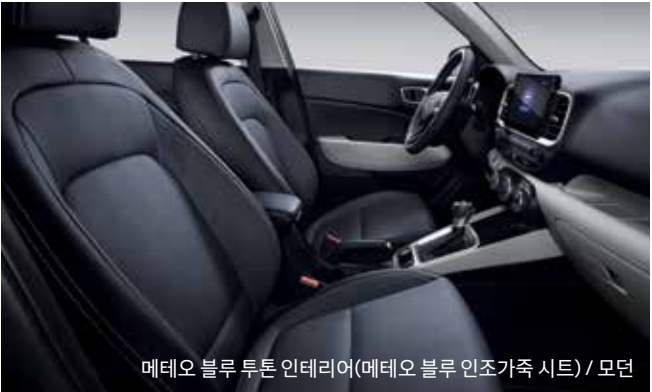
메테오 블루 투톤 인테리어(메테오 블루 인조가죽 시트) / 모던