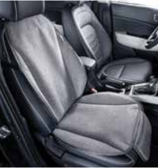
TUIX PET 동승석 시트 커버(1열) TUIX PET 방오 커버(2열)