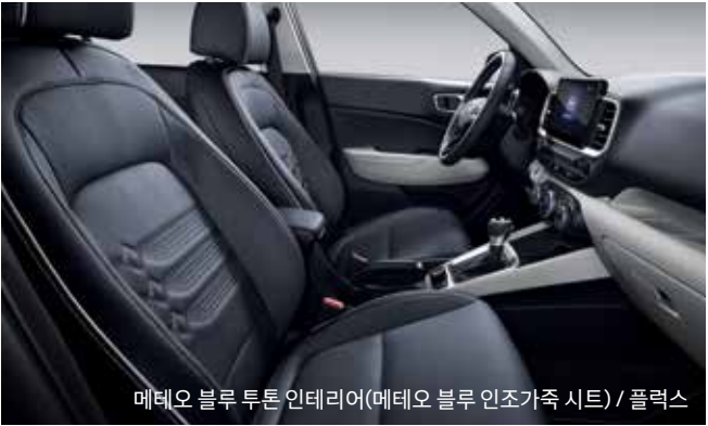
메테오 블루 투톤 인테리어(메테오 블루 인조가죽 시트) / 플렉스