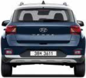
윤거 후 1,546