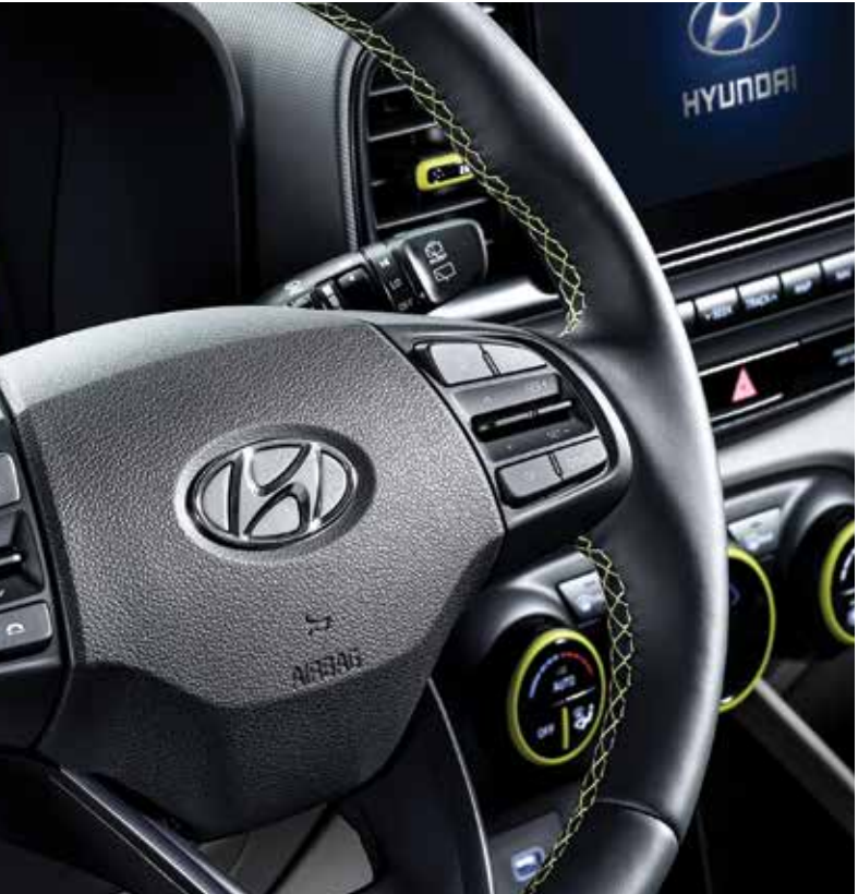
가죽 스티어링 휠(FLUX 전용 스티치 포함)

*그레이 투톤 선택 시 라임컬러 포인트 적용 예시 이미지입니다. (블랙 내장, 메테오 블루 내장 적용 시 화이트, 라이트 실버 컬러 포인트 적용)