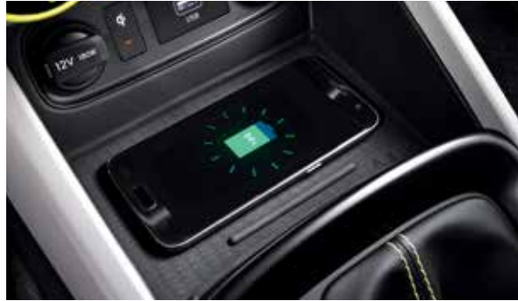
무선충전기 실내 LED 램프(오버헤드콘솔/룸/선바이저/풋무드/러기지)