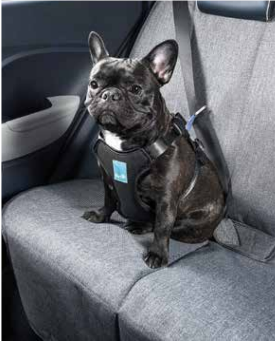
TUIX PET 헤네스

* 적외선 무릎 워머는 스마트키 & 버튼시동(원격시동 포함) 적용 시 가능합니다. * 휠 패키지는 17인치 휠 & 타이어 적용 시 가능합니다. * 컨비니언스 패키지는 모던 트림 이상 선택 가능합니다. * TUIX IoT 상품은 모던 트림 이상 (선루프 장착) 선택 가능합니다.