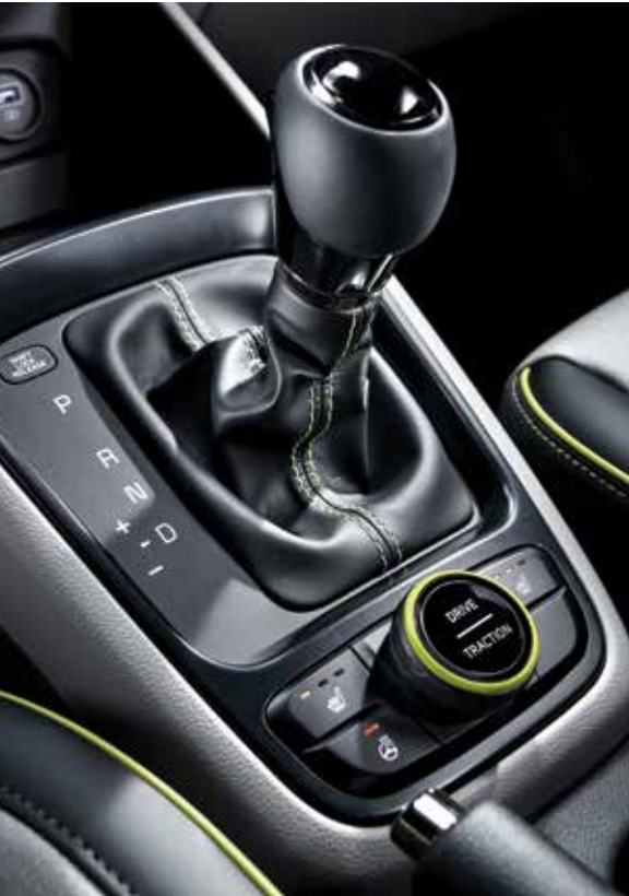
기어노브 & 2WD 험로 주행 모드 스위치