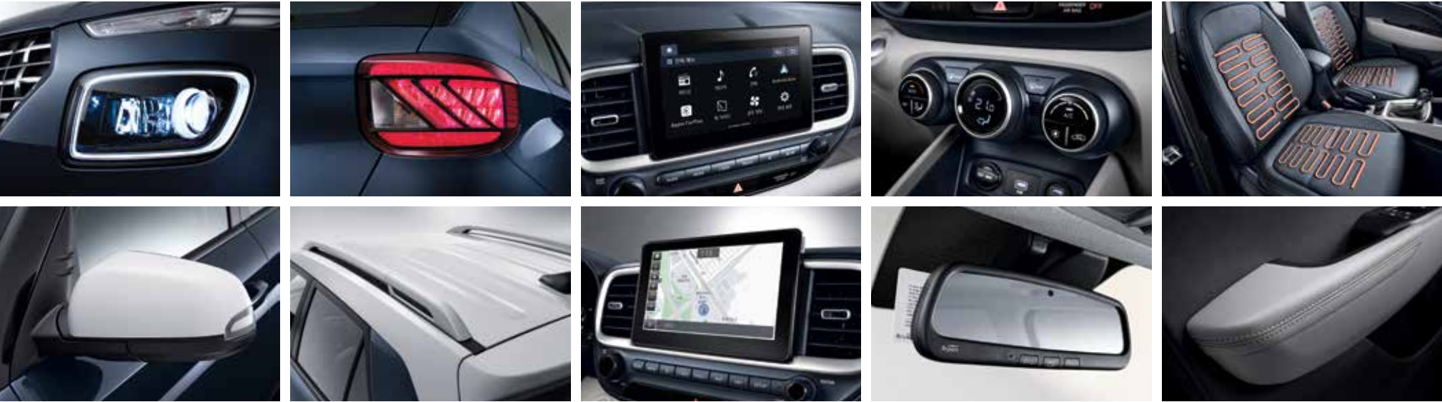
LED 헤드램프 LED 리어 콤비램프 8인치 디스플레이 오디오 풀오토 에어컨 앞좌석 열선 아웃사이드 미러(전동접이, LED방향지시등) 루프랙 8인치 내비게이션 하이패스 시스템(ECM 적용) 인조가죽 도어 암레스트 *플렉스 전용