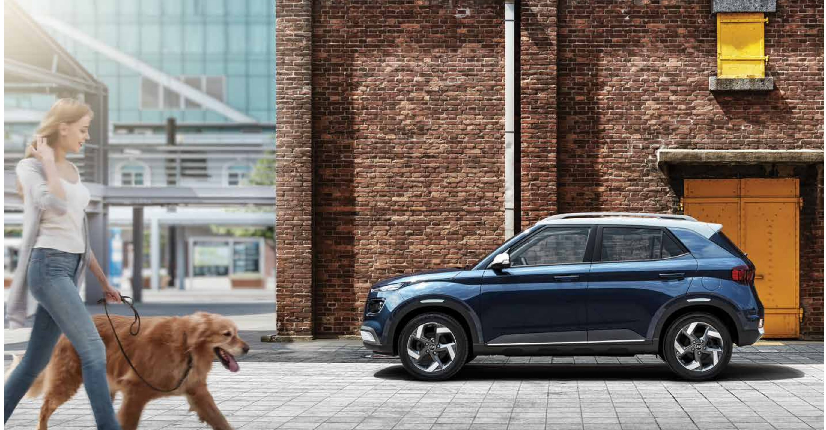
모던 풀옵션(더 데님/초크 화이트 투톤)