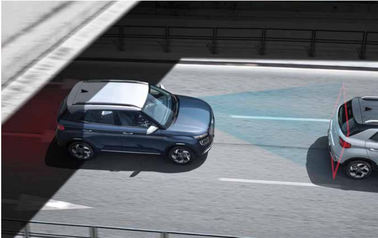
전방 충돌 방지 보조 전방 차량 또는 보행자와의 충돌 위험 상황이 감지될 경우 운전자에게 이를 경고하고, 자동제어를 통해 충돌 속도를 저감하거나 충돌을 방지합니다.