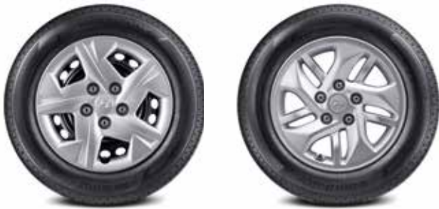
185/65R15 타이어 & 15인치 스틸 휠 185/65R15 타이어 & 15인치 알로이 휠