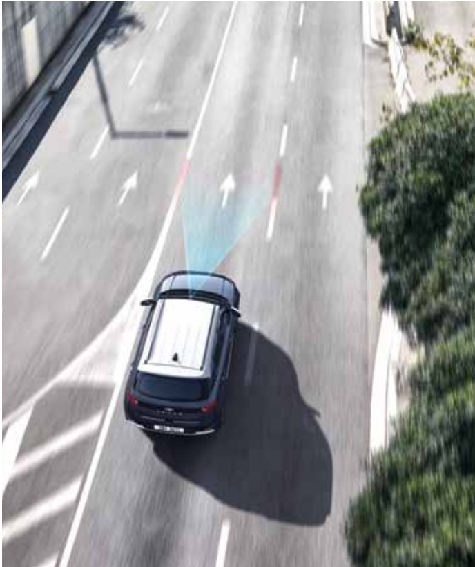
차로 이탈방지 보조 전방 카메라를 이용해 차선을 인식하고 방향지시등 조작 없이 차량이 차로를 이탈하려 할 경우 운전자의 주의 환기를 위해 경고해주며, 필요 시 조향을 보조하여 차로 이탈 상황을 방지해 줍니다.