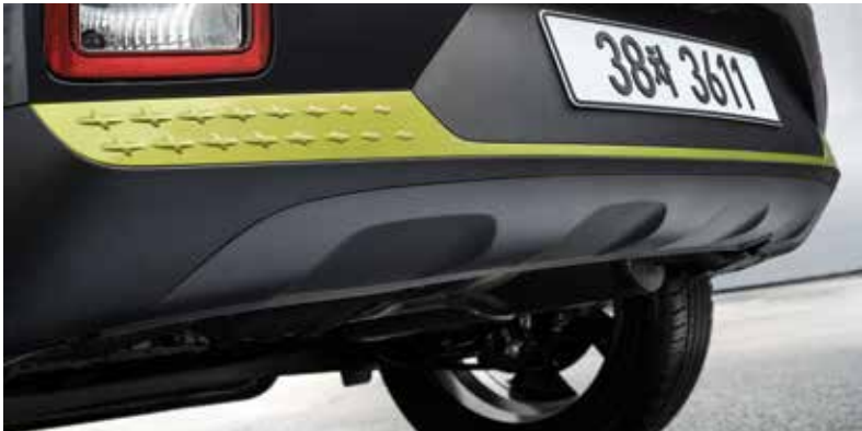
C필러 배지 FLUX 전용 리어스키드