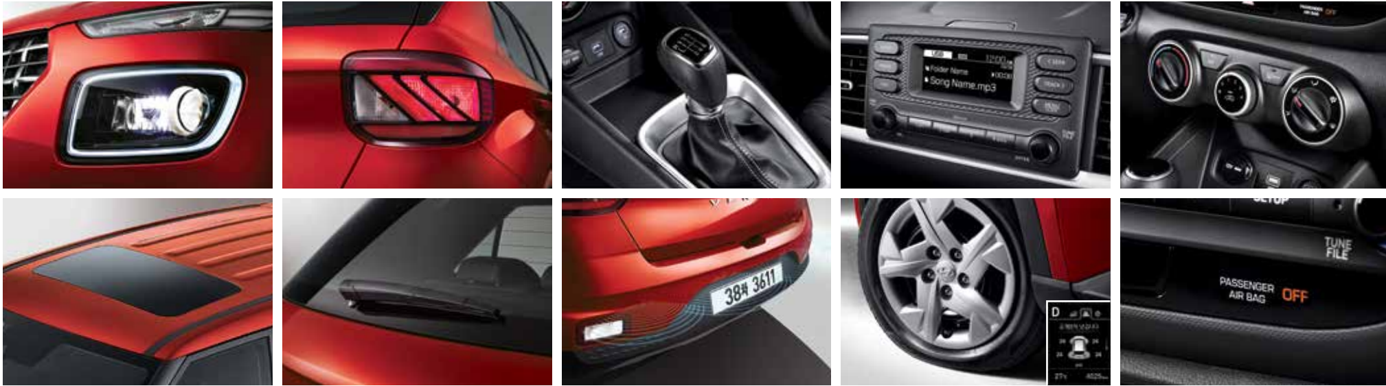
프로젝션 헤드램프(스태틱 벤딩 라이트 포함) & LED 주간주행등(DRL, 포지셔닝 기능 포함) 리어 콤비램프 선루프 *IVT 적용 시 선택가능 리어 와이퍼 6단 수동변속기 주차 거리 경고(후방) 오디오(라디오/MP3) 개별 타이어 공기압 경보장치 매뉴얼 에어컨 6에어백 시스템(앞좌석어드밴스드, 앞좌석사이드, 전복대응 커튼)