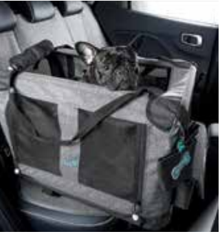
TUIX PET ISOFIX 카시트 TUIX PET 러기지 매트 커버