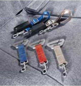
TUIX PET 안전벨트 테더(블루/레드/아이보리) TUIX PET 데칼