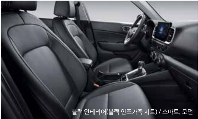
블랙 인테리어(블랙 인조가죽 시트) / 스마트, 모던