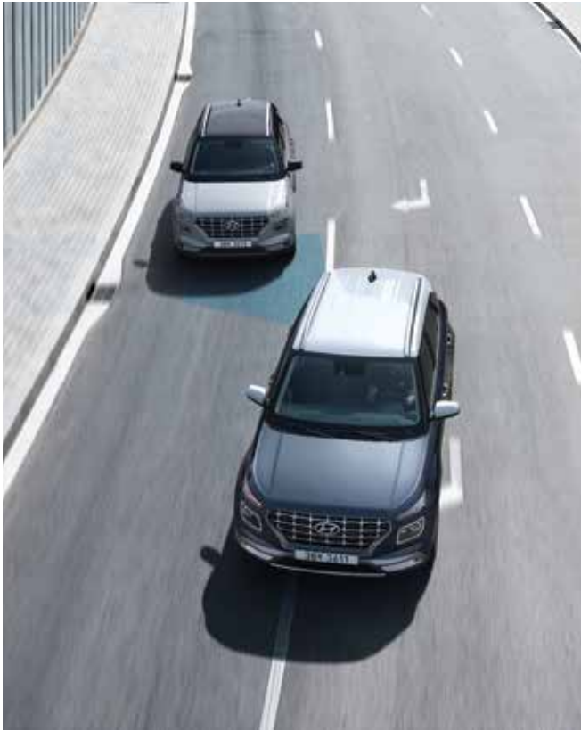
후측방 충돌 경고 아웃사이드 미러로 확인할 수 없는 사각지대 또는 후측방에서 접근하는 차량을 감지해 운전자에게 경고합니다.