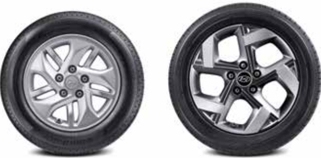
185/65R15 타이어 & 15인치 알로이 휠 205/55R17 타이어 & 17인치 알로이 휠