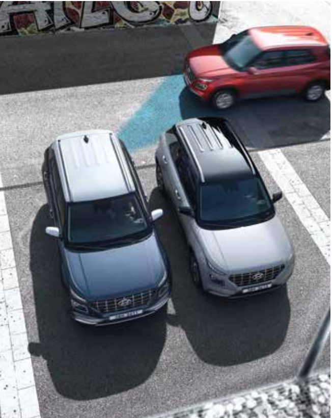
후방 교차 충돌 경고 후진 출차 시 후측방 사각지대에서 접근하는 차량을 감지하여 운전자에게 경고해줍니다.