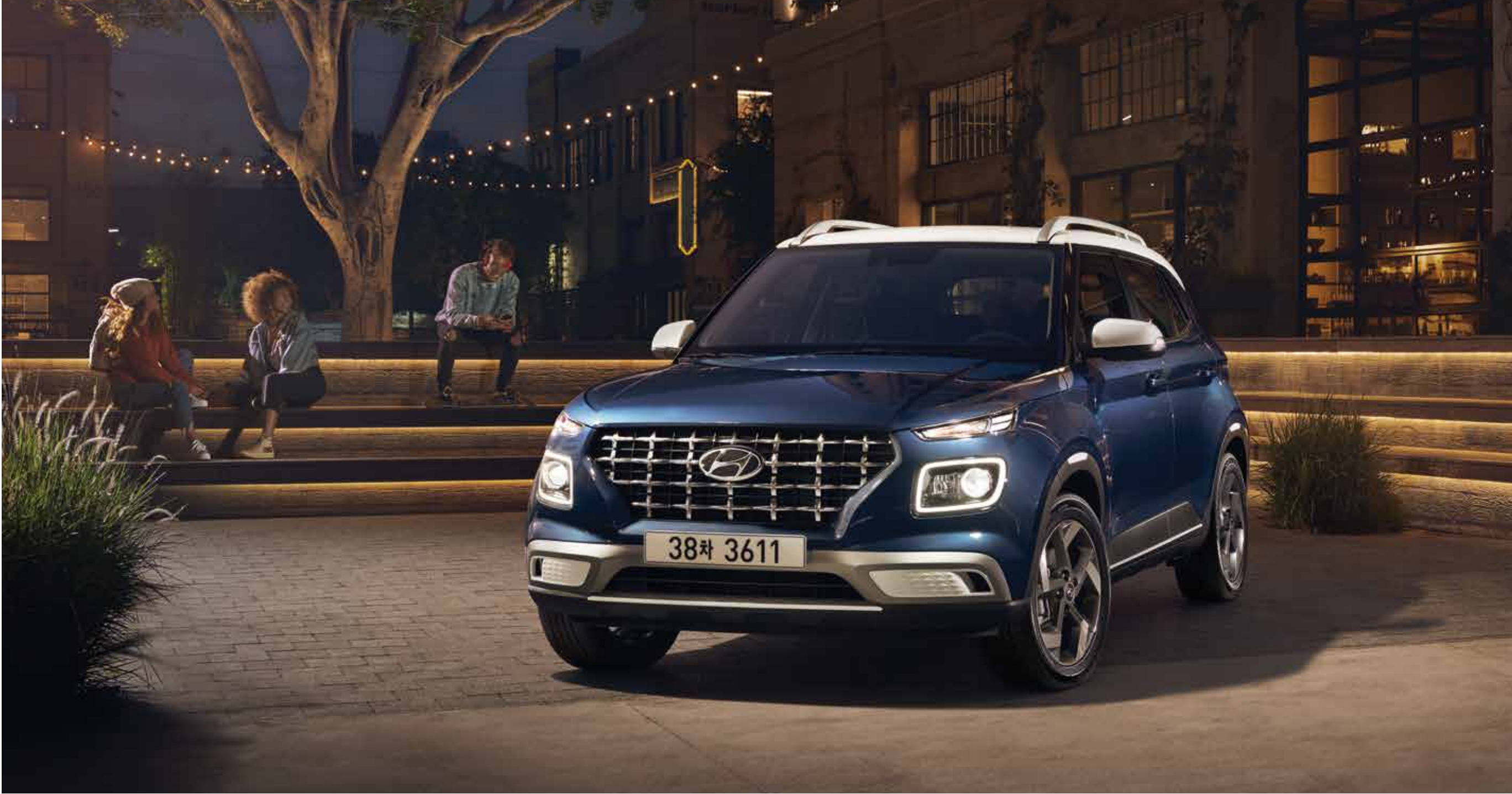
모던 풀옵션(더 데님/초크 화이트 투톤)