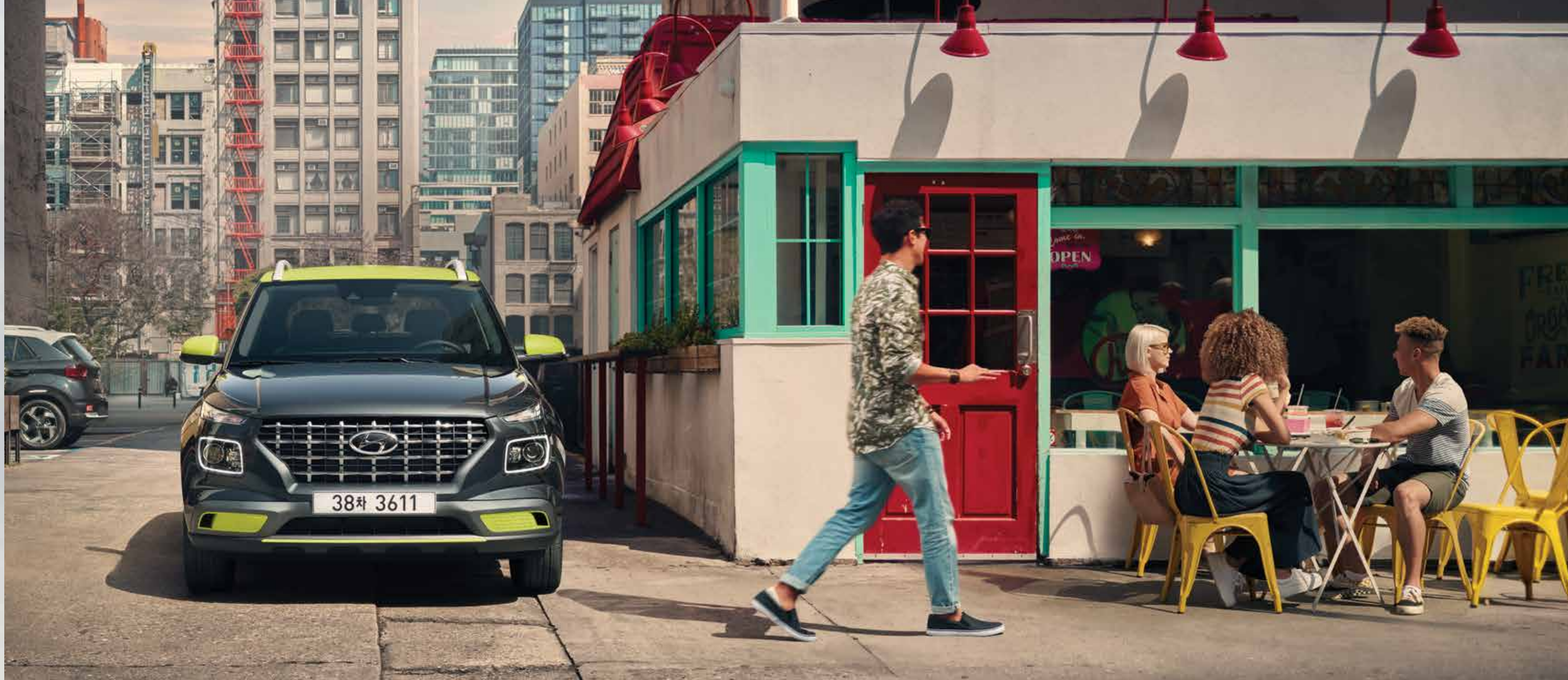
모던 풀옵션(코스믹 그레이/애시드 옐로우 투톤)