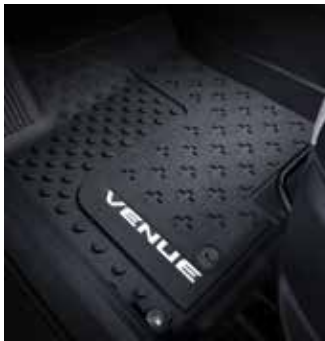
적외선 무릎 워머 프로텍션 매트 패키지(인테리어 매트, 러기지 매트)