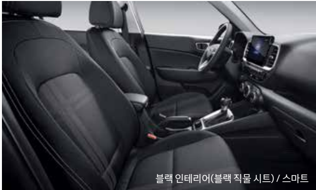
블랙 인테리어(블랙 직물 시트) / 스마트