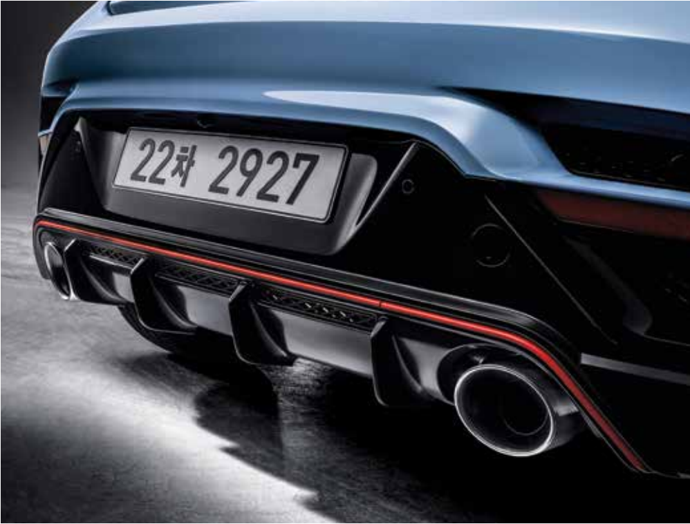
대형 에어핀 적용 리어 디퓨저 4개의 대형 에어핀이 적용된 리어 디퓨저로 공력을 개선하고, 더욱 스포티한 벨로스터 N만의 캐릭터를 구축했습니다.