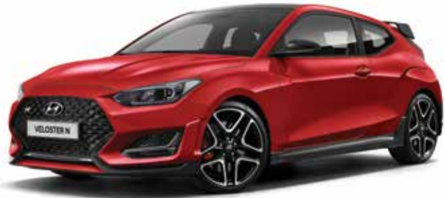
VELOSTER N 풀옵선 (이그나이트 플레임)