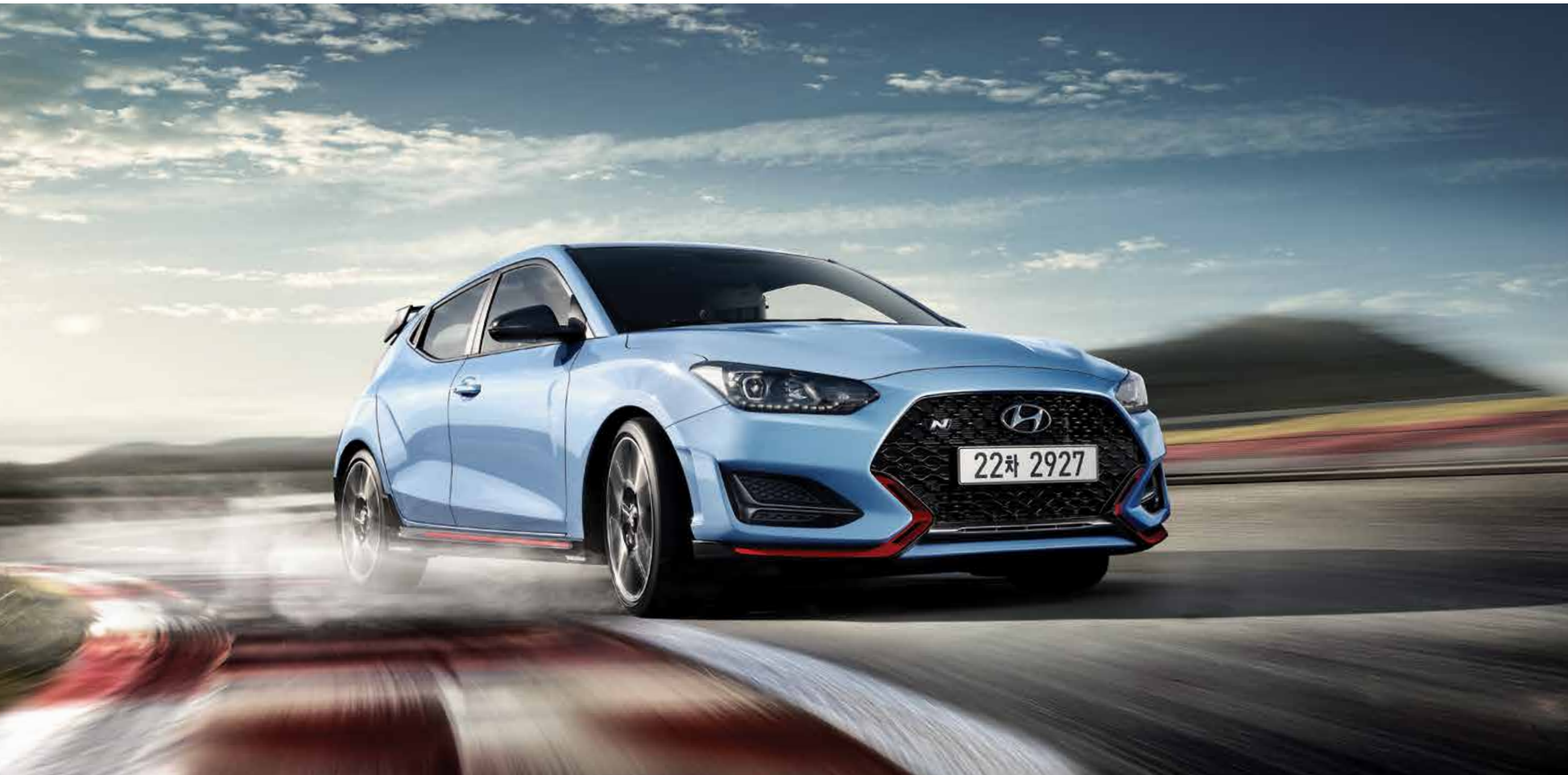
VELOSTER N 풀옵션 (퍼포먼스 블루, 와이드 선루프 제외)