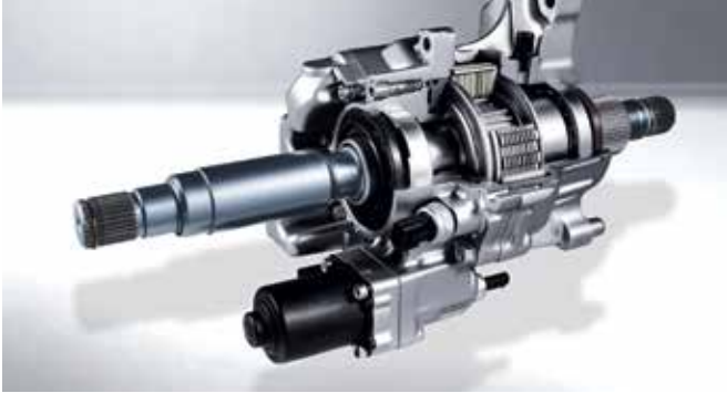
N 코너 카빙 디퍼렌셜 (N Corner Carving Differential) 코너링 주행 시 좌우 바퀴의 구동력을 전자적으로 제어/배분하여 미끄러짐 없는 가속이 가능합니다.