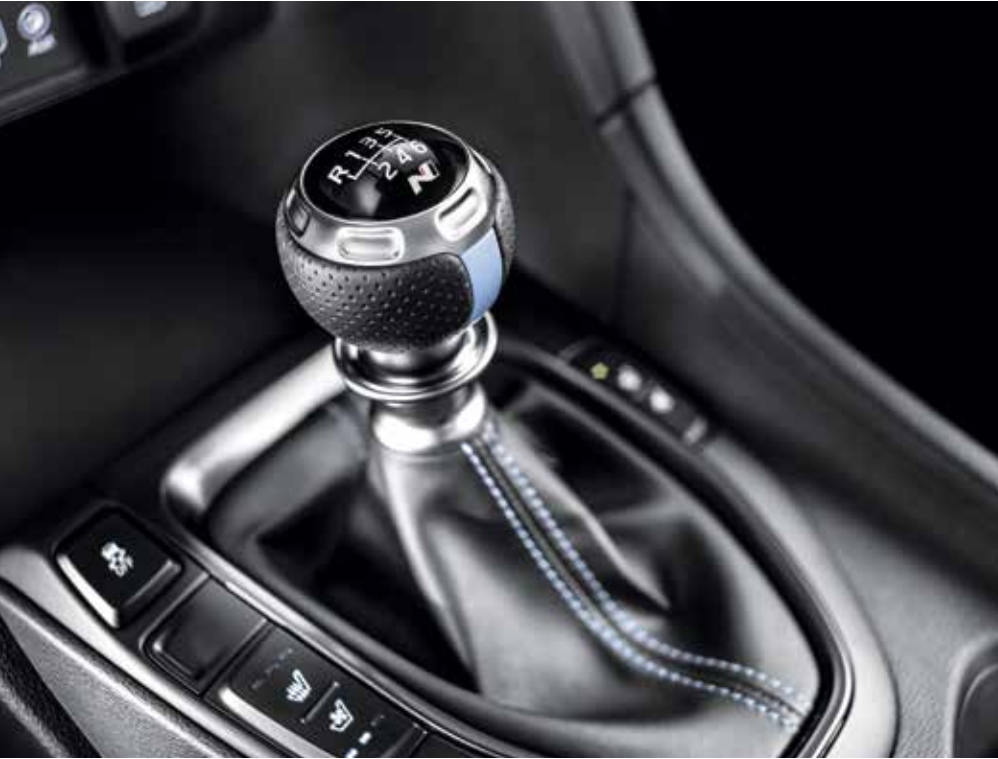
N 전용 6단 수동 변속기 & 레브매칭 변속 시 RPM을 동기화하는 레브매칭 시스템으로 변속충격을 최소화하고, 다이내믹한 변속감을 전달합니다.