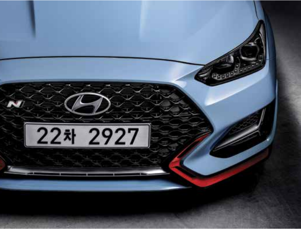
와이드 타입 라디에이터 그릴 & 에어커튼 유광 블랙이 적용된 와이드한 라디에이터 그릴로 스포티한 이미지와 냉각성능까지 만족시켰으며, 날개 형상의 외장형 에어커튼으로 공력을 개선했습니다.