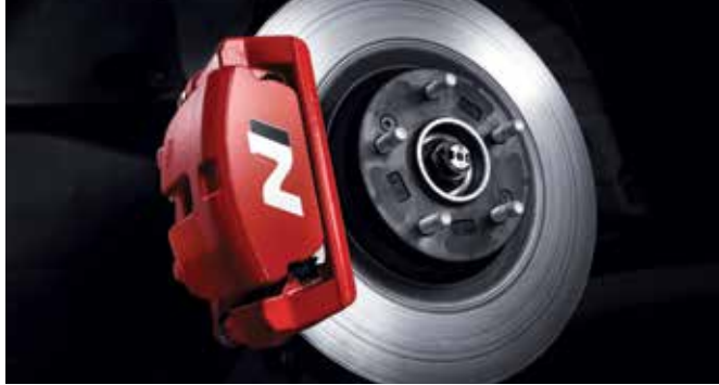
N 전용 대용량 고성능 브레이크 & 캘리퍼 N 로고 고성능 자동차에서는 달리는 것보다 멈추는 것이 더 중요하기에 대용량 고성능 브레이크로 다이내믹한 드라이빙에도 안정감을 전달합니다.

N 그린 컨트롤 시스템 (N Grin Control System) 벨로스터 N의 에코/노멀/스포츠/N/커스텀 드라이빙 모드를 이용하여 상황에 따른 주행특성 컨트롤이 가능합니다.