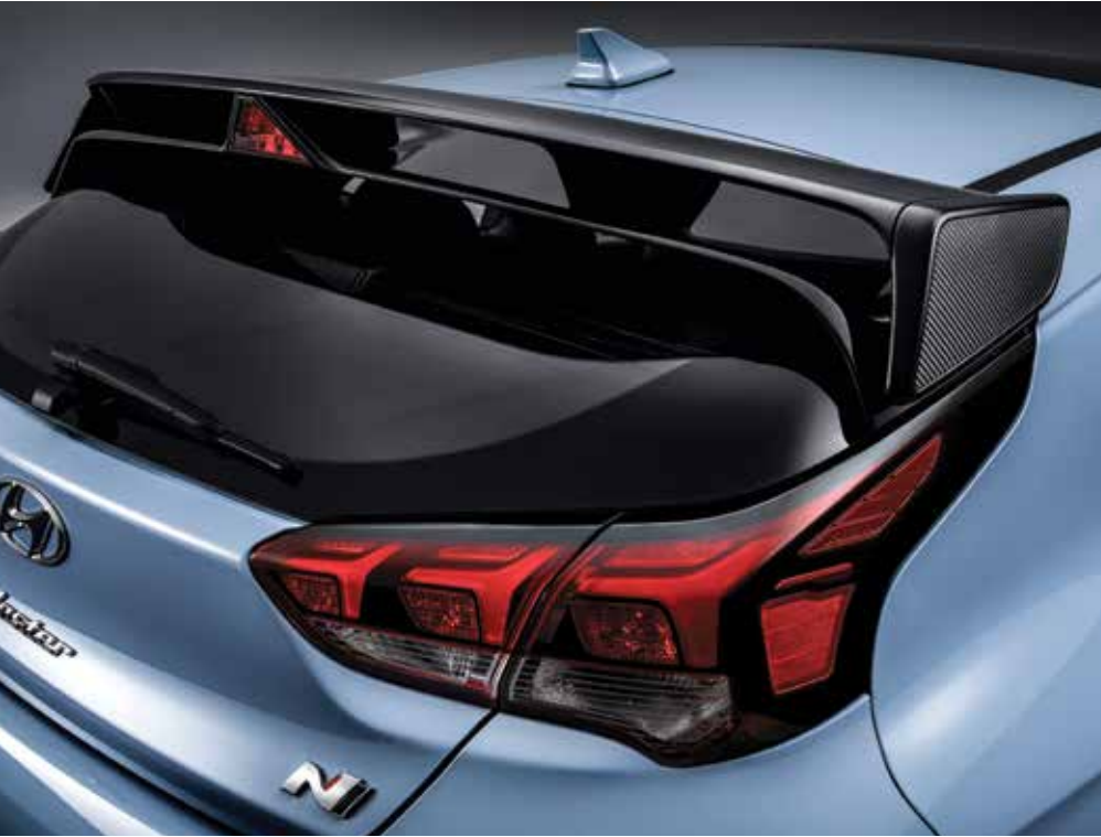
윙타입 리어 스포일러 윙타입 리어 스포일러를 적용하여 고성능 핫해치의 공력성능을 향상시켰으며, 리어 스포일러 중앙에 보조제동등을 적용하여 안전한 드라이빙을 돕습니다.