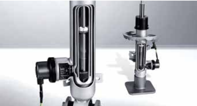
전자 제어 서스펜션 (ECS, Electronic Control Suspension) 운전상황에 맞게 각 휠의 속업소버 감쇠력을 제어하여 주행안정성능과 승차감을 향상시켜 트랙과 일상, 모든 주행 조건에서 차별화된 성능을 구현합니다.