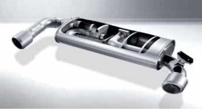
능동 가변 배기 시스템 (Variable Exhaust Valve) 배기 파이프의 형상과 전자식 가변 밸브를 이용하여 운전상황에 맞게 정속하거나 스포티한 배기음을 선사합니다.