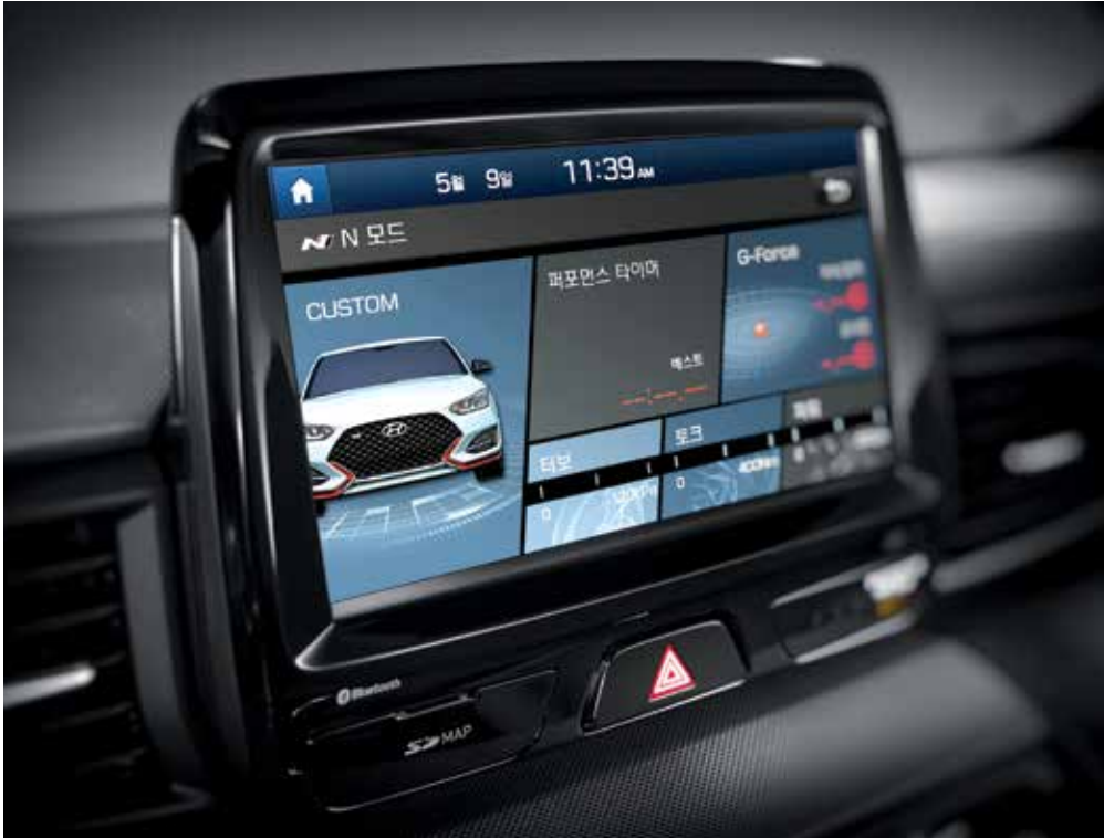
N 그린 컨트롤 시스템 주행 특성을 파워트레인/샤시 항목별로 설정하고, 출력/토크/중력가속도 등의 정보를 실시간으로 인지할 수 있습니다.