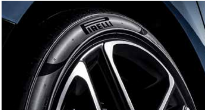
피렐리 P Zero 타이어 N의 파워풀한 성능을 완벽하게 구현하기 위해 피렐리의 고성능 타이어인 P Zero를 적용하였습니다.