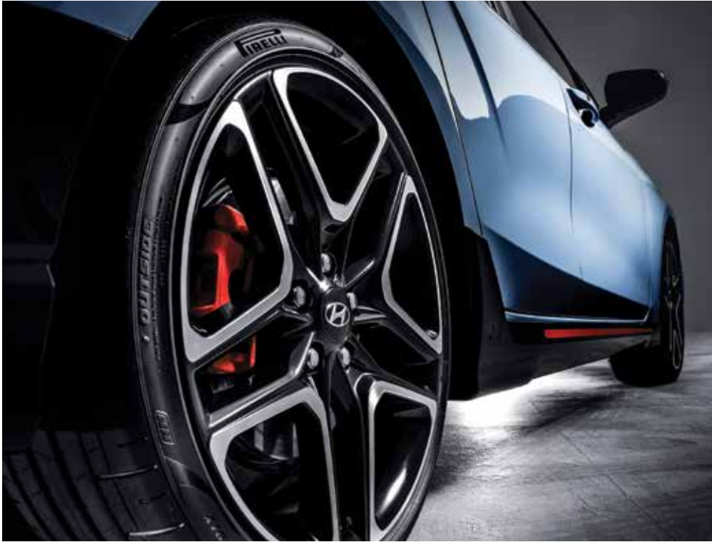
19인치 알로이 휠 & 사이드 실 과감한 디자인의 전용 휠과 레드 캘리퍼를 적용하고, 레드 포인트 사이드 실로 강인한 인상을 드러냅니다.