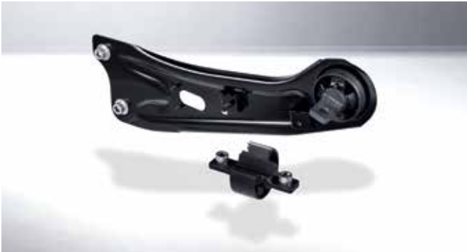
이중 재질 부시 (DCB, Dual Compound Bush) 서스펜션과 차량을 연결하는 고무를 전후/상하 방향에 따라 다른 재질을 사용하여 조종안정성과 소음진동 성능을 동시에 만족시킵니다.