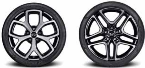
225/40ZR18 미쉐린 PSS 타이어 & 18인치 알로이 휠 235/35R19 피렐리 P Zero 타이어 & 19인치 알로이 휠