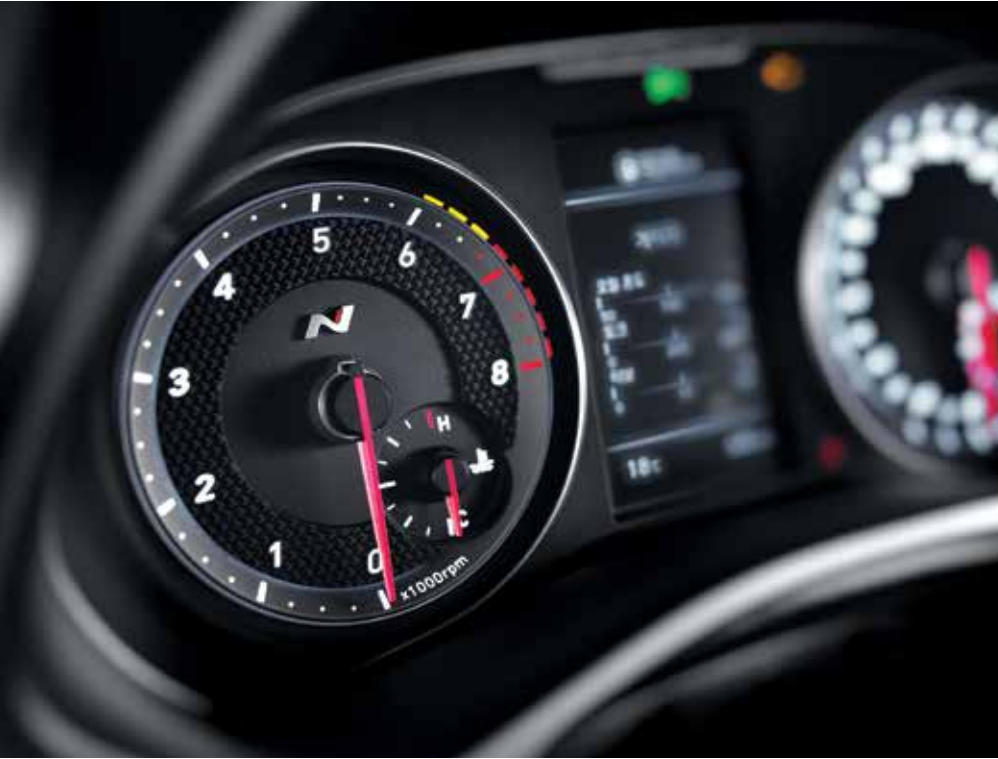
4.2인치 슈퍼비전 클러스터 N 로고가 새겨진 슈퍼비전 클러스터로 드라이빙의 재미는 물론, 정확한 변속 타이밍까지 알려줍니다.