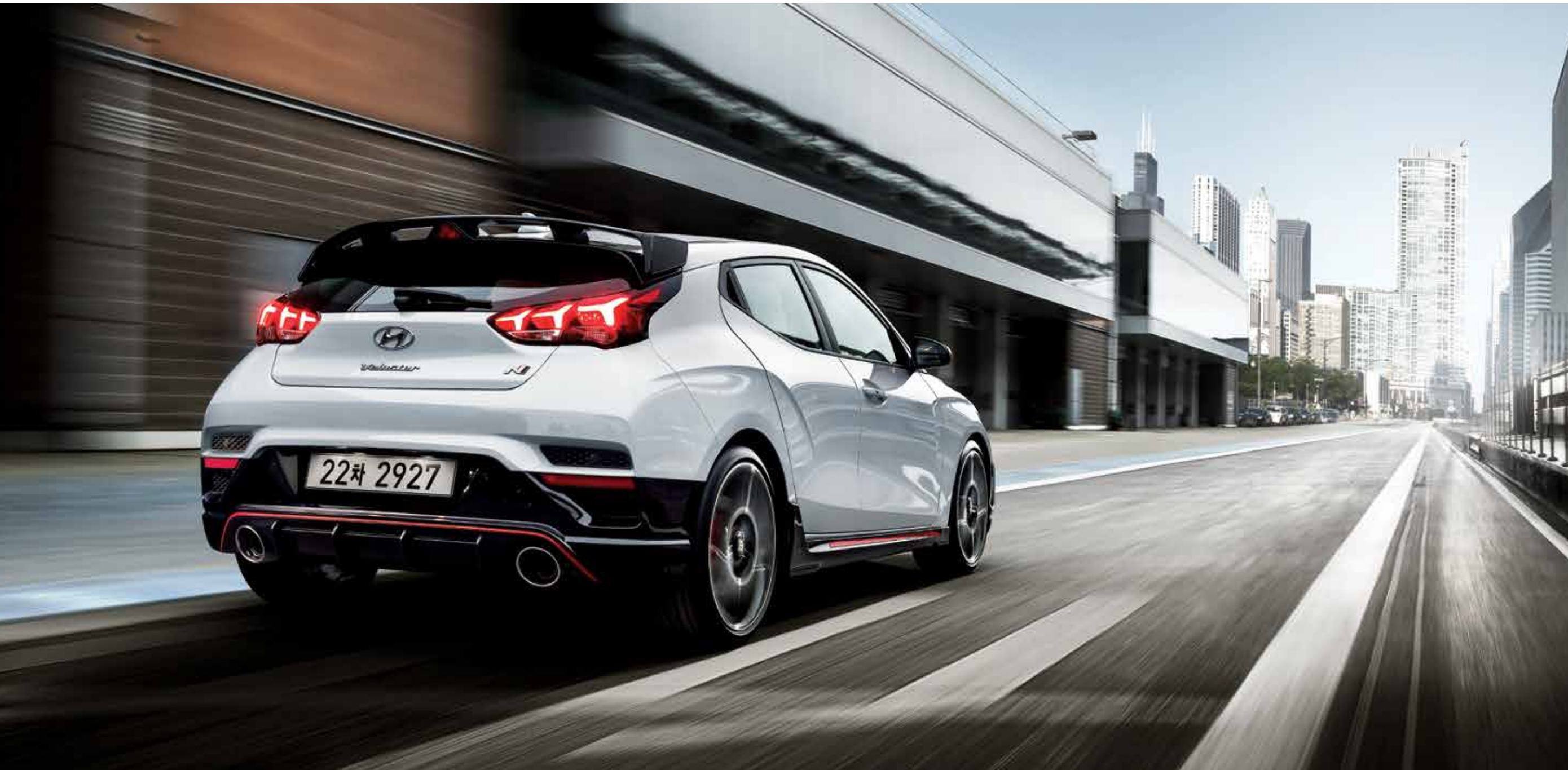
VELOSTER N 풀옵션 (초크 화이트)