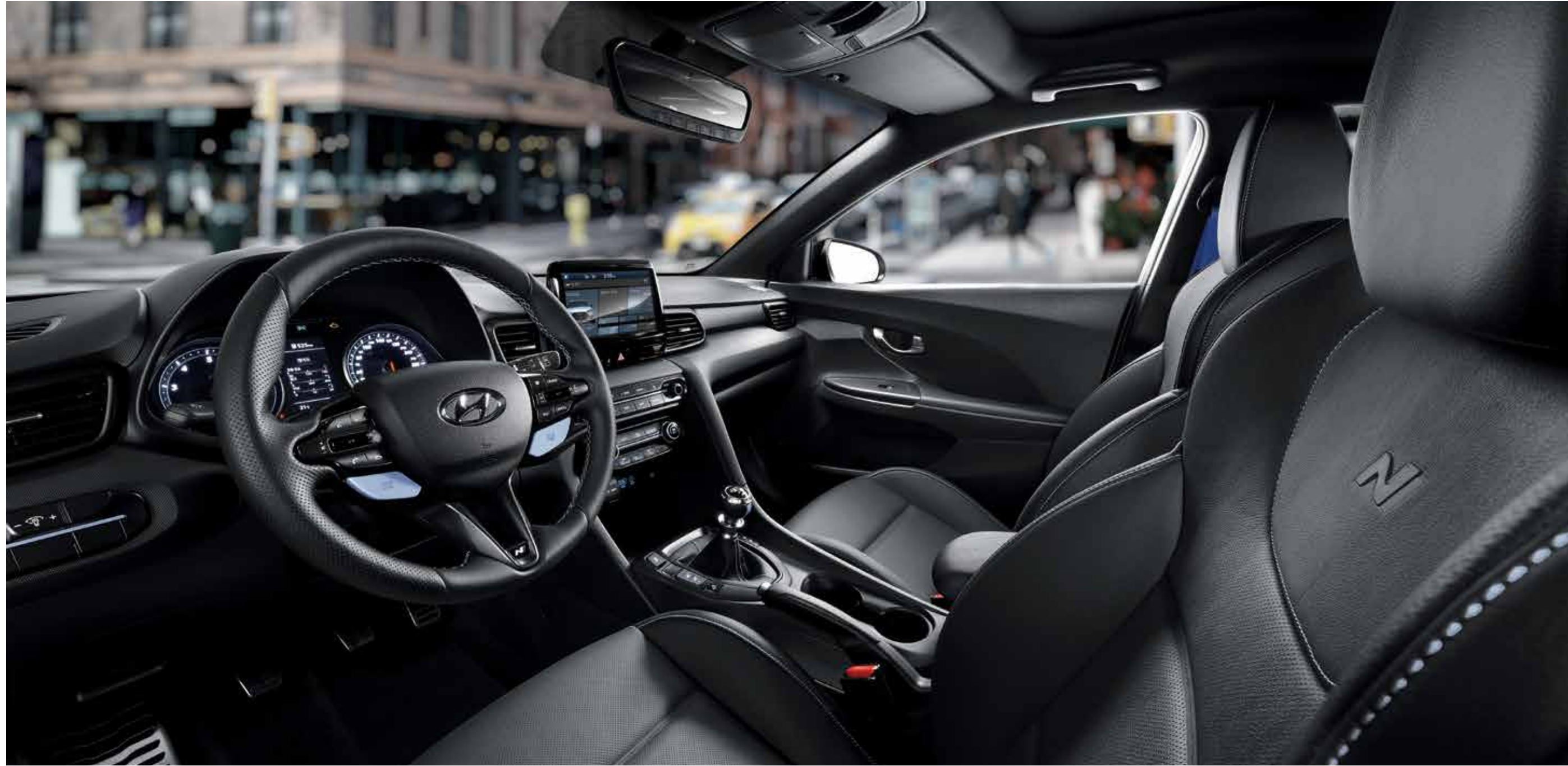
VELOSTER N 풀옵션 (블랙 / 블루 인테리어)