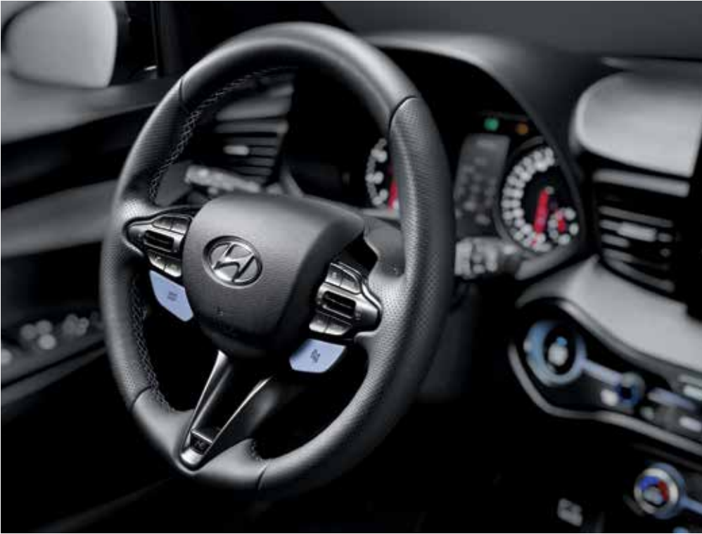
스포츠 스티어링 휠 그립감을 높여주는 스티어링 휠 설계로 다이내믹한 드라이빙에 적합하며, 스티어링 휠에서 즉각적인 드라이브 모드 변경이 가능합니다.