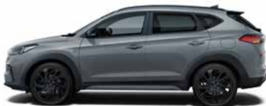
Shadow Grey Uni 1,4