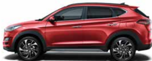
Fiery Red Metallic 1