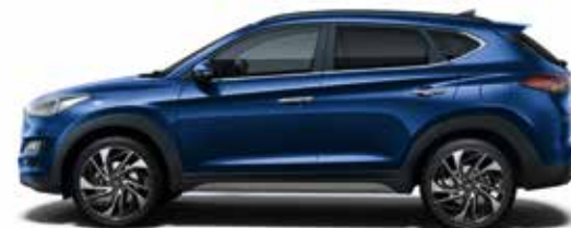
Stellar Blue Metallic 1,3