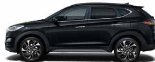
Phantom Black Mineraleffekt 1