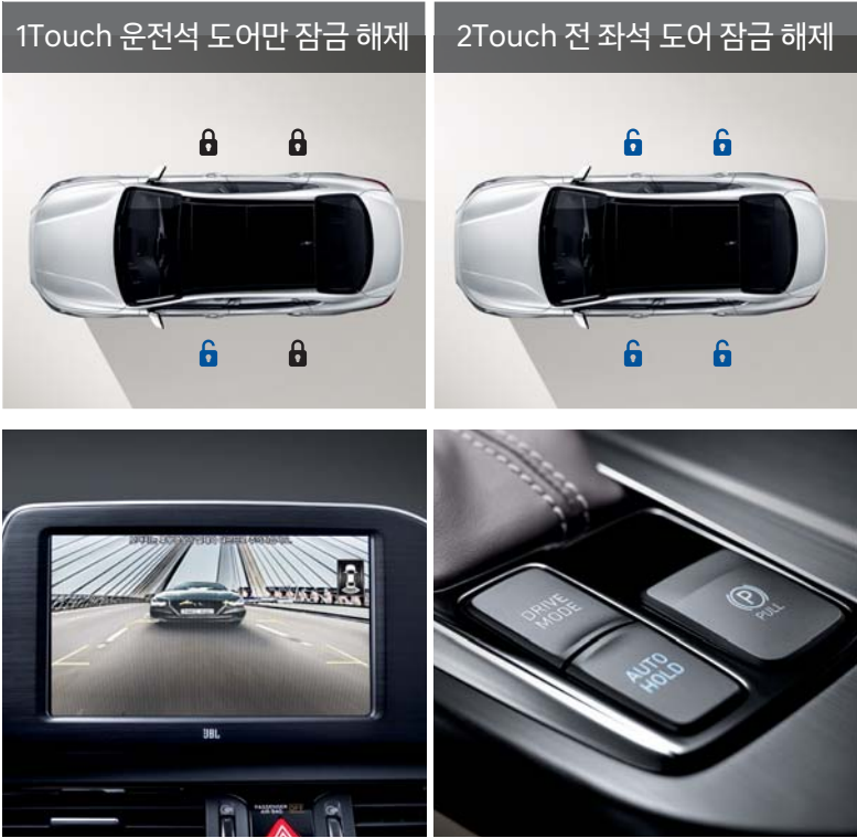
세이프티 언락 후방모니터 (조향 연동, DRM) / 전동식 파킹 브레이크 (오토홀드 포함)