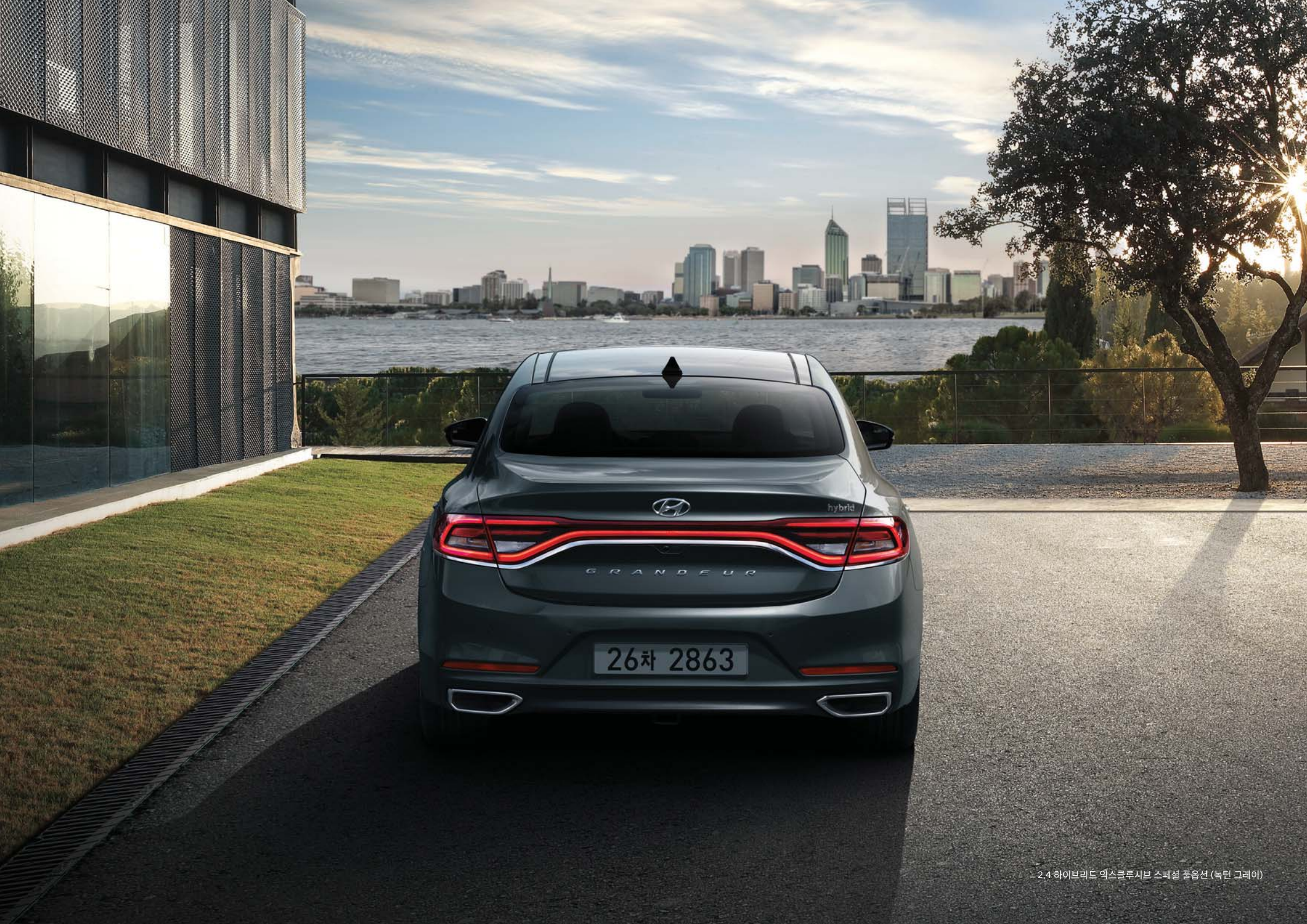
2.4 하이브리드 엑스클루시브 스페셜 풀옵션 (녹턴 그레이)

*기본 서비스(최초 가입 시 5년 무료 제공) : 원격제어, 안전보안, 차량관리, 길안내 *문의 : 블루링크 카카오톡 고객센터(카카오톡 검색창에서 '블루링크' 입력 후 친구추가)