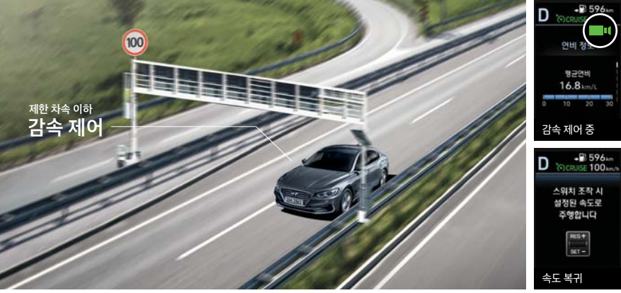
하이브리드 전용 콘텐츠

고속도로에서 크루즈 컨트롤 사용 시 내비게이션으로부터 수신하는 과속카메라 정보를 이용하여, 별도의 조작 없이 제한 차속 이하로 감속시켜주는 기능입니다.