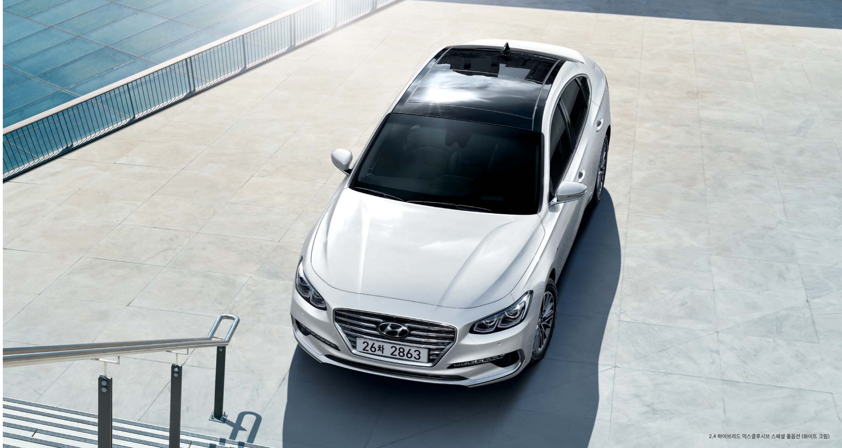
2.4 하이브리드 익스클루시브 스페셜 풀옵션 (화이트 크림)