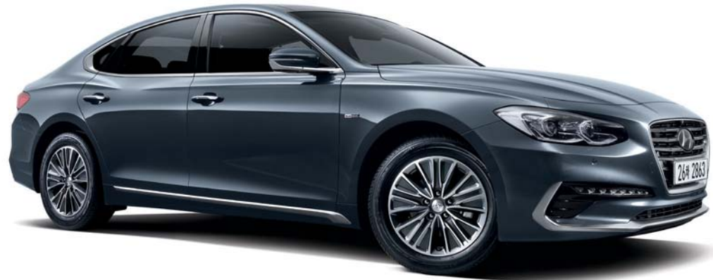
2.4 하이브리드 익스클루시브 (녹턴 그레이)