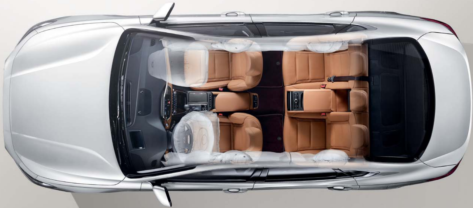
9 에어백 시스템

운전석 & 동승석에는 충돌상황과 탑승객(동승석에 승객구분센서 적용)을 동시에 감지해 전개 압력을 제어하는 어드밴스드 에어백이 적용되었습니다. 운전석 무릎 에어백, 앞 / 뒷좌석 사이드 에어백, 전복 대응 커튼 에어백까지 총 9개의 에어백이 탑승객의 안전을 지켜드립니다.