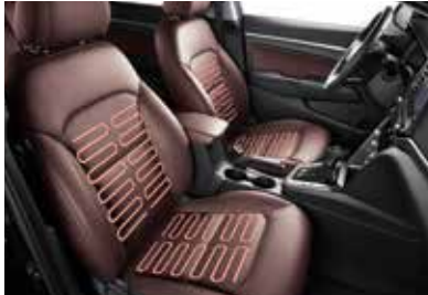
7인치 디스플레이 오디오 앞좌석 열선시트