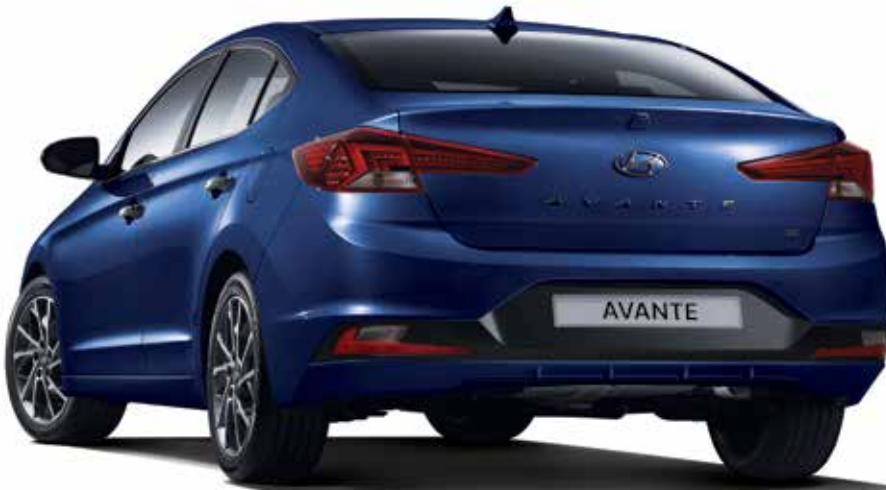
가솔린 1.6 프리미엄 풀옵션(인텐스 블루)