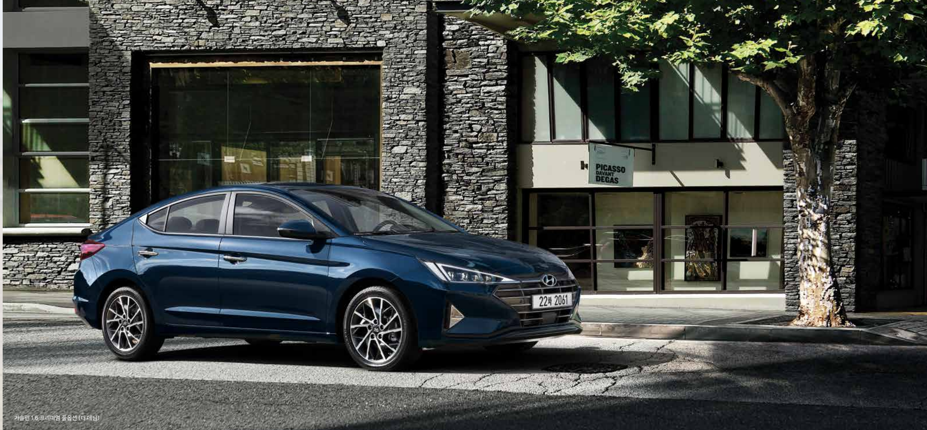
가솔린 1.6 프리미엄 풀옵션 (더 데님)