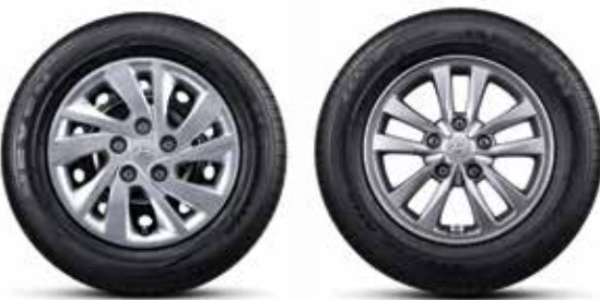
195/65R15 타이어 & 15인치 스틸 휠 / 195/65R15 타이어 & 15인치 알로이 휠