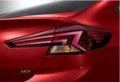
스포츠 전용 라디에이터 그릴 LED 리어 콤비램프