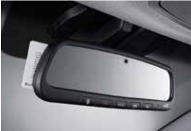
8인치 내비게이션(폰 커넥티비티 포함) 하이프레스 시스템(ECM를미러)