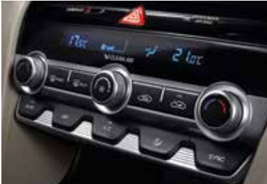
4.2인치 컬러 LCD(슈퍼비전 클러스터) 듀얼폴로 에어컨(공기청정모드, 오토디포그, 클러스터 이온라이저 포함)