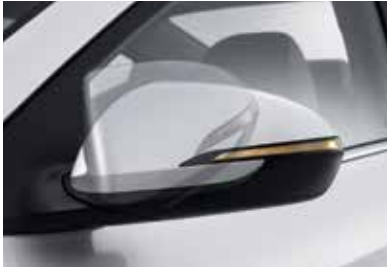
리어 콤비램프 아웃사이드 미러(열선, 전동 조절, LED 방향지시등)