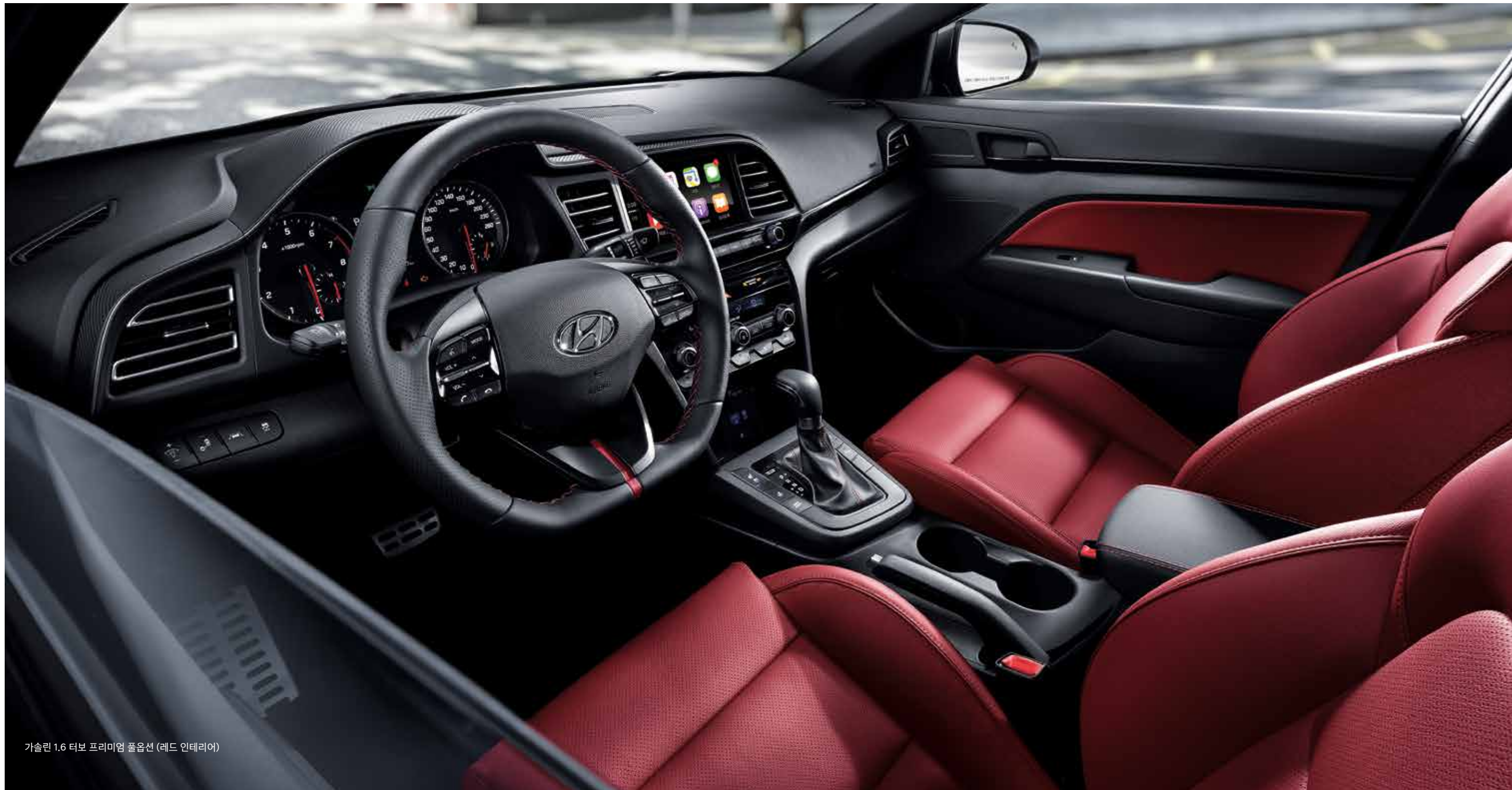
가솔린 1.6 터보 프리미엄 풀옵선 (레드 인테리어)

스포츠 모델만의 전용 버킷시트와 클러스터가 완성하는 인테리어로 파워풀한 드라이빙 감성을 느끼실 수 있습니다.