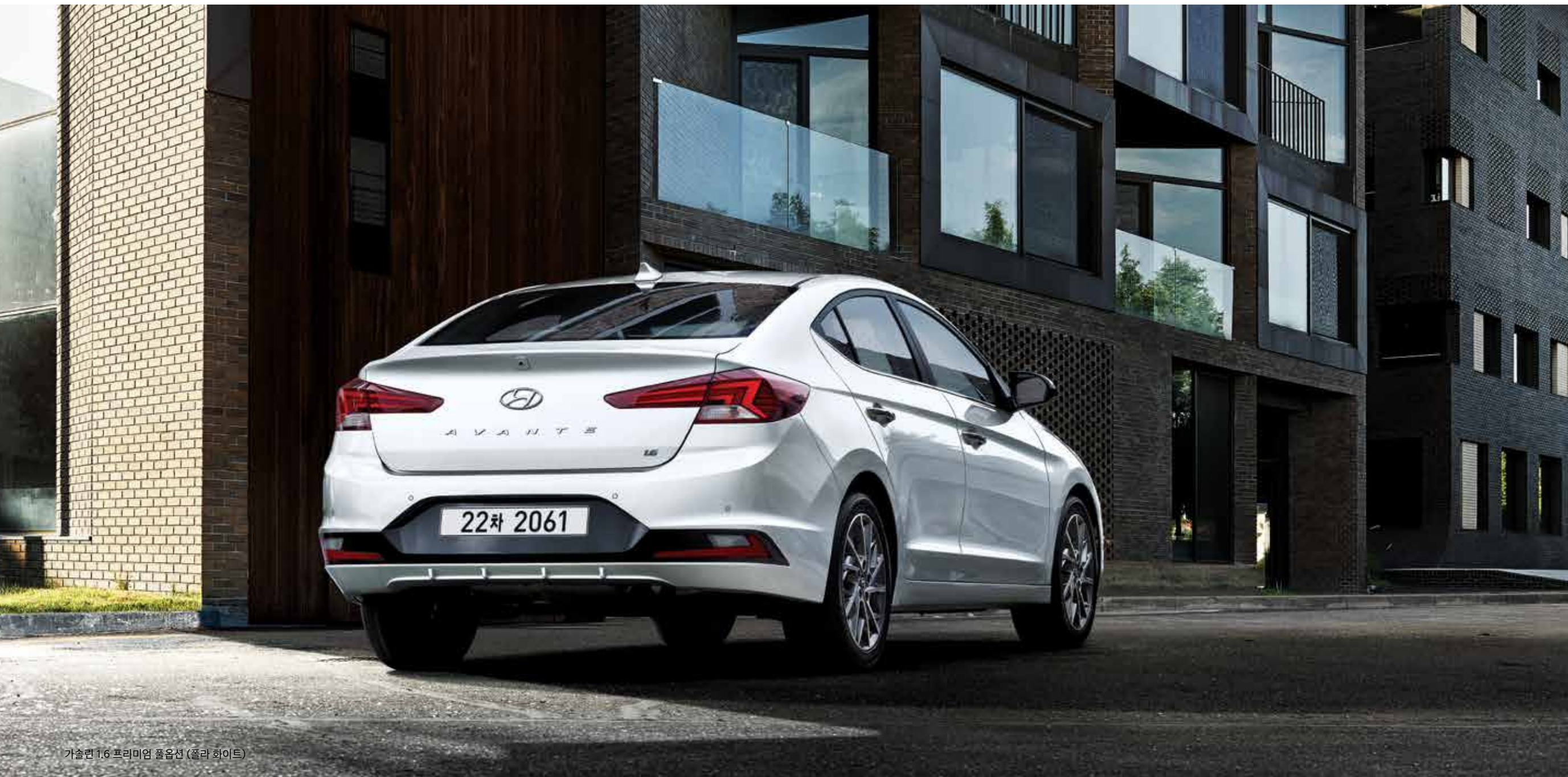
가솔린 1.6 프리미엄 풀옵션 (풀라 화이트)

탄탄한 자세가 주는 안정감과 변화가 느껴지는 디테일의 조화로움은 당신의 섬세한 취향을 말해줍니다.