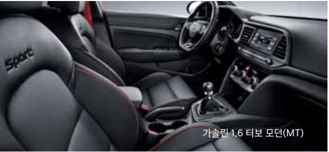
가솔린 1.6 터보 모던(MT)