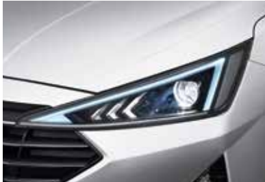
프로젝션 헤드램프 & 벌브 주간주행등 LED 주간주행등(DRL, 포지셔닝 포함)