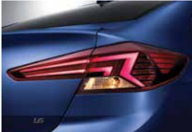
LED 헤드램프 LED 리어 콤비램프