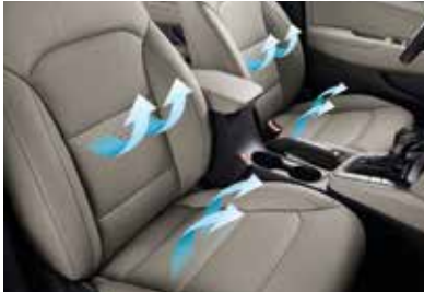
선루프 앞좌석 통풍시트