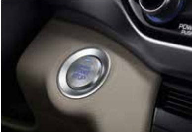
오디오 버튼시동 & 스마트키