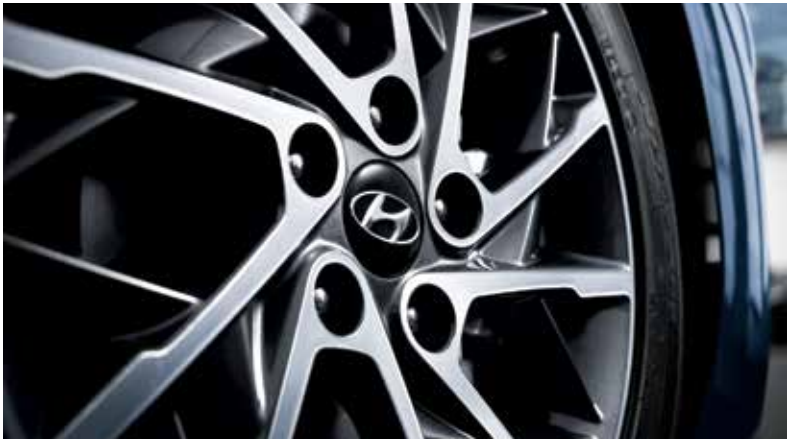
LED 리어 콤비램프 17인치 알로이 휠