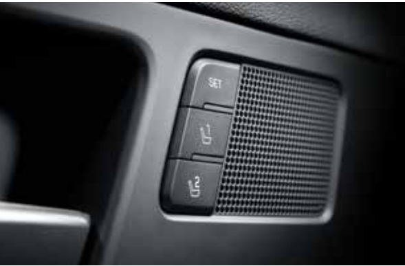
스마트폰 무선 충전 / 운전석 자세 메모리 시스템