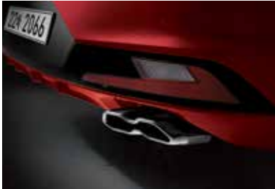
사이드실 몰딩 싱글 트윈 머플러 팁