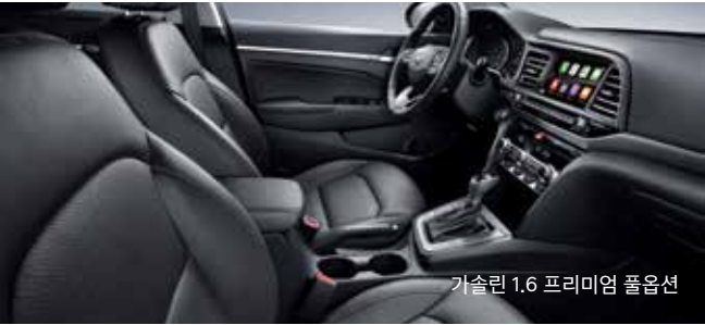
가솔린 1.6 프리미엄 풀옵션