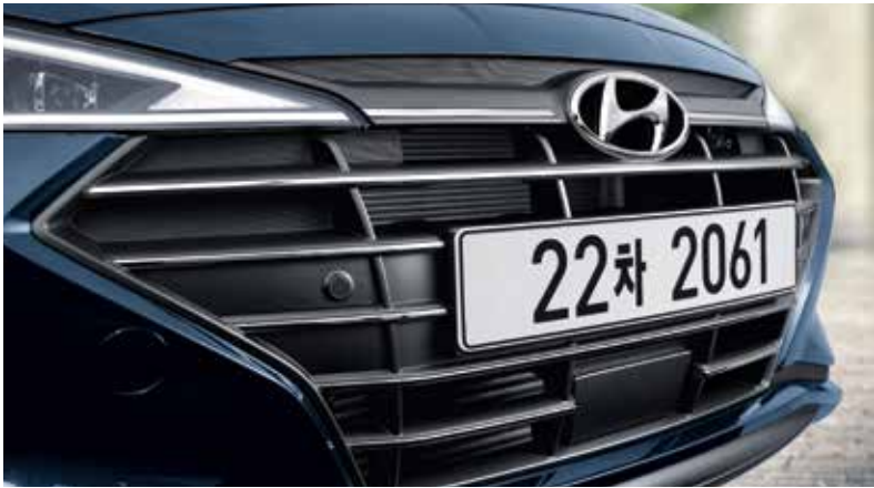
LED 헤드램프 크롬 라디에이터 그릴