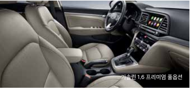
가솔린 1.6 프리미엄 풀옵션