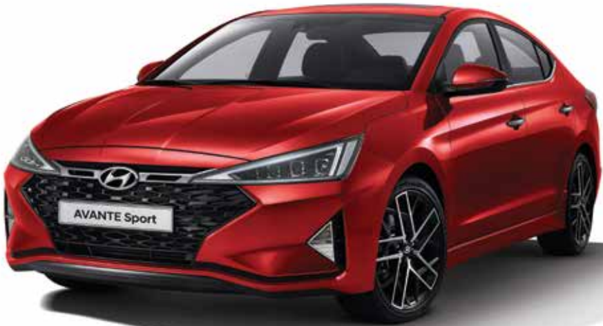
가솔린 1.6 터보 프리미엄 풀옵션(파이어리 레드)