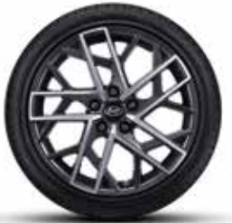
225/40R18 타이어 & 18인치 알로이 휠