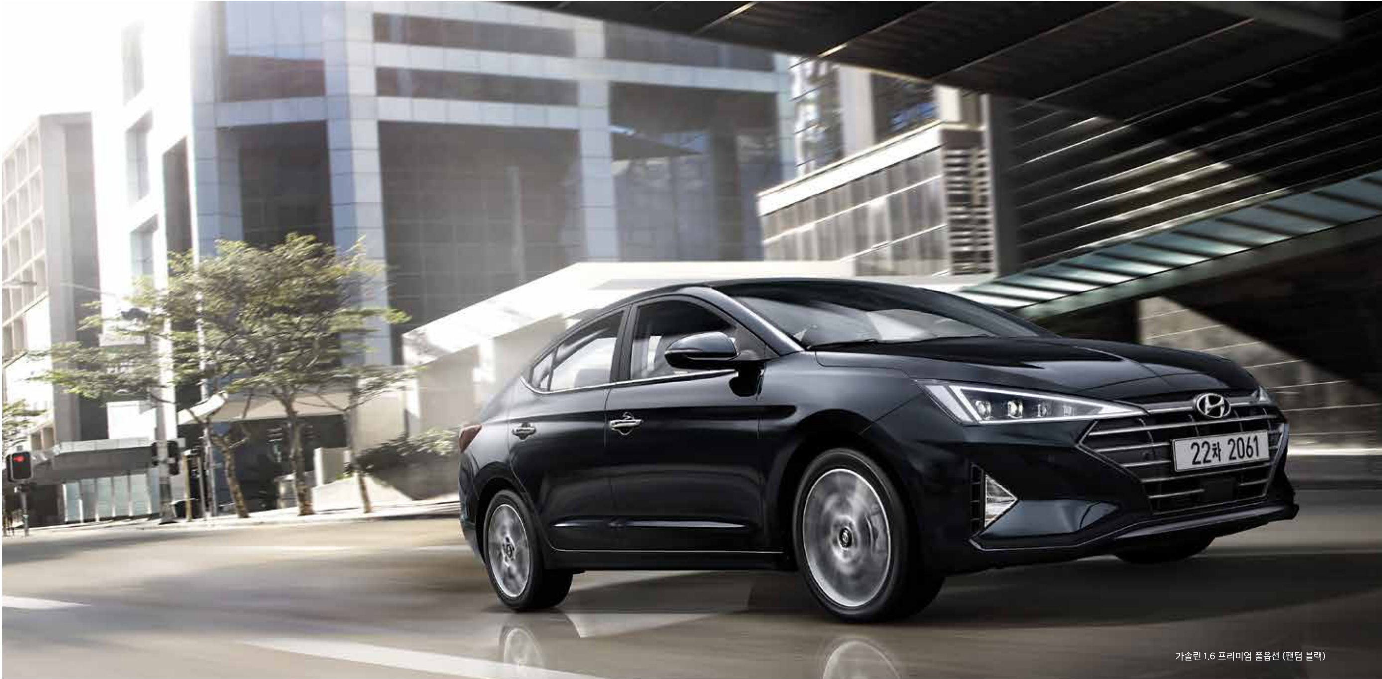
가솔린 1.6 프리미엄 풀옵션 (팬텀 블랙)