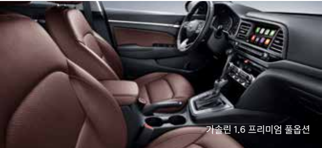
가솔린 1.6 프리미엄 풀옵션