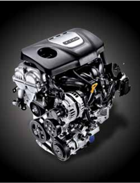
가솔린 1.6 터보 엔진(204마력)

고마력 가솔린 1.6 터보 엔진의 파워와 후륜 멀티링크 서스펜션의 안정감, 대용량 디스크 브레이크의 제동력이 선사하는 퍼포먼스로 당신의 드라이빙은 더욱 완벽해집니다.