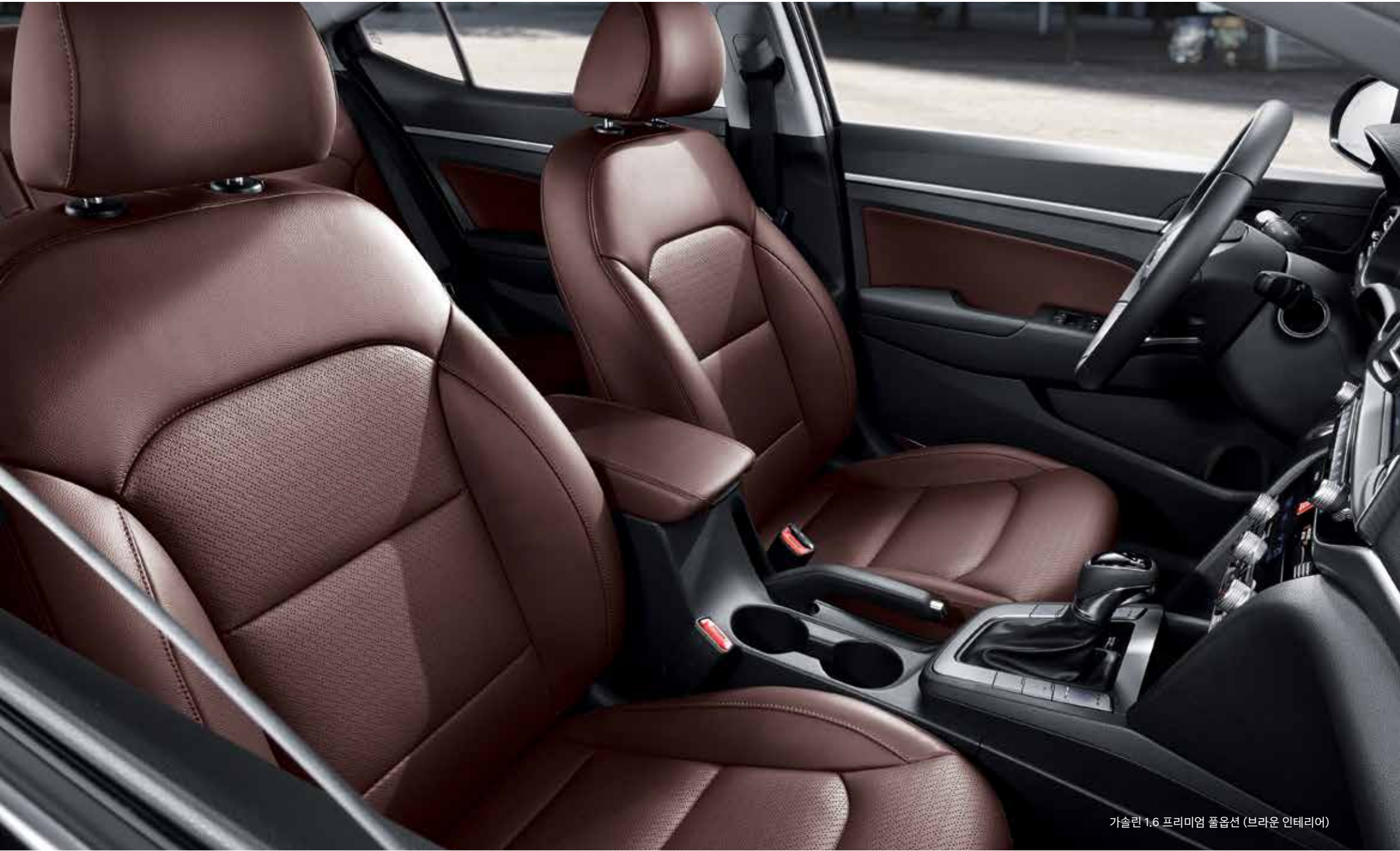
가솔린 1.6 프리미엄 풀옵션 (브라운 인테리어)