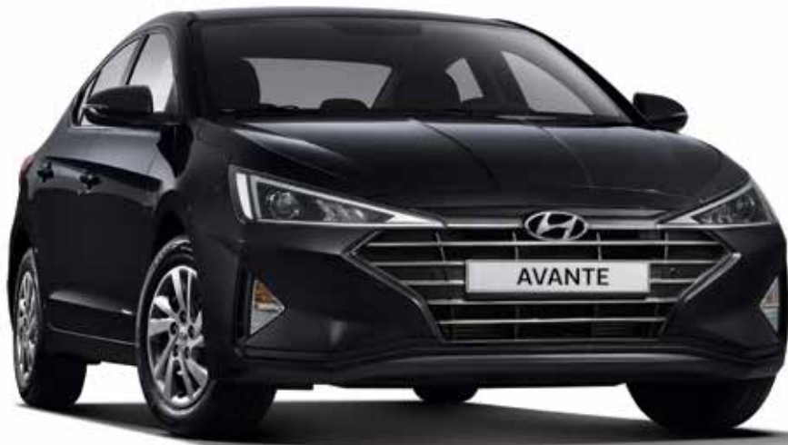
가솔린 1.6 스타일(팬텀 블랙)