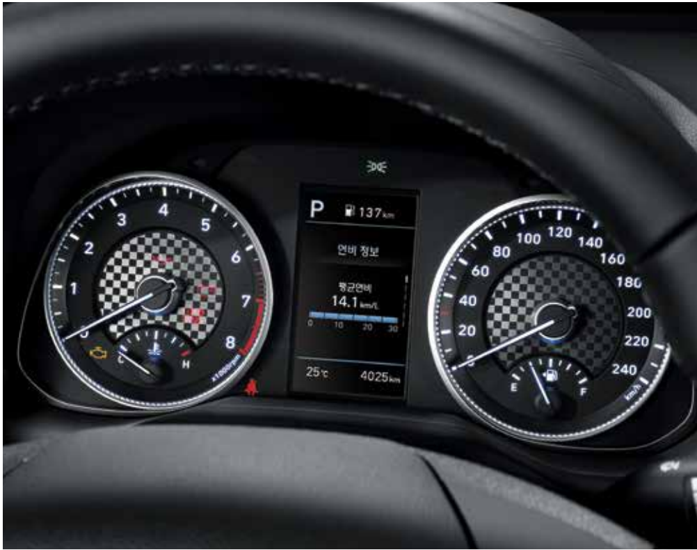
4.2인치 컬러 LCD 슈퍼비전 클러스터

섬세하게 설계된 편의사양을 통해 당신의 드라이빙이 더욱 쉽고 편안해집니다.