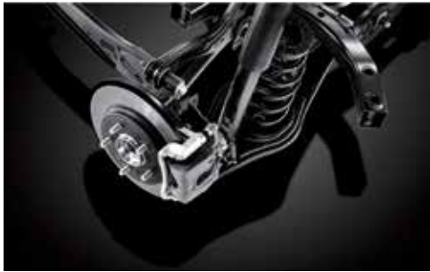
대용량 디스크 브레이크 / 후륜 멀티링크 서스펜션