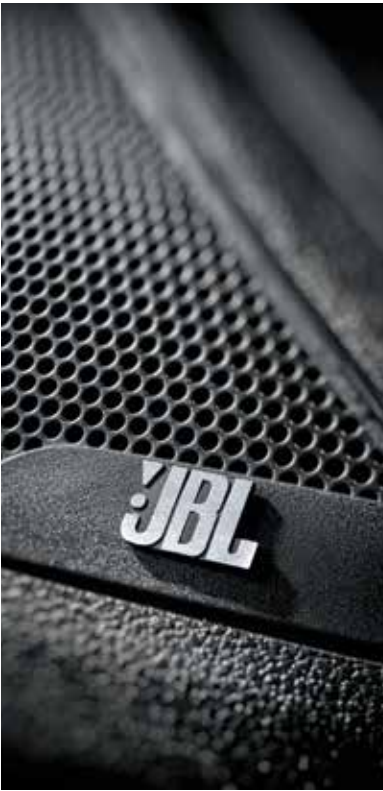
JBL프리미엄사운드(8스피커, 외장앰프 포함)