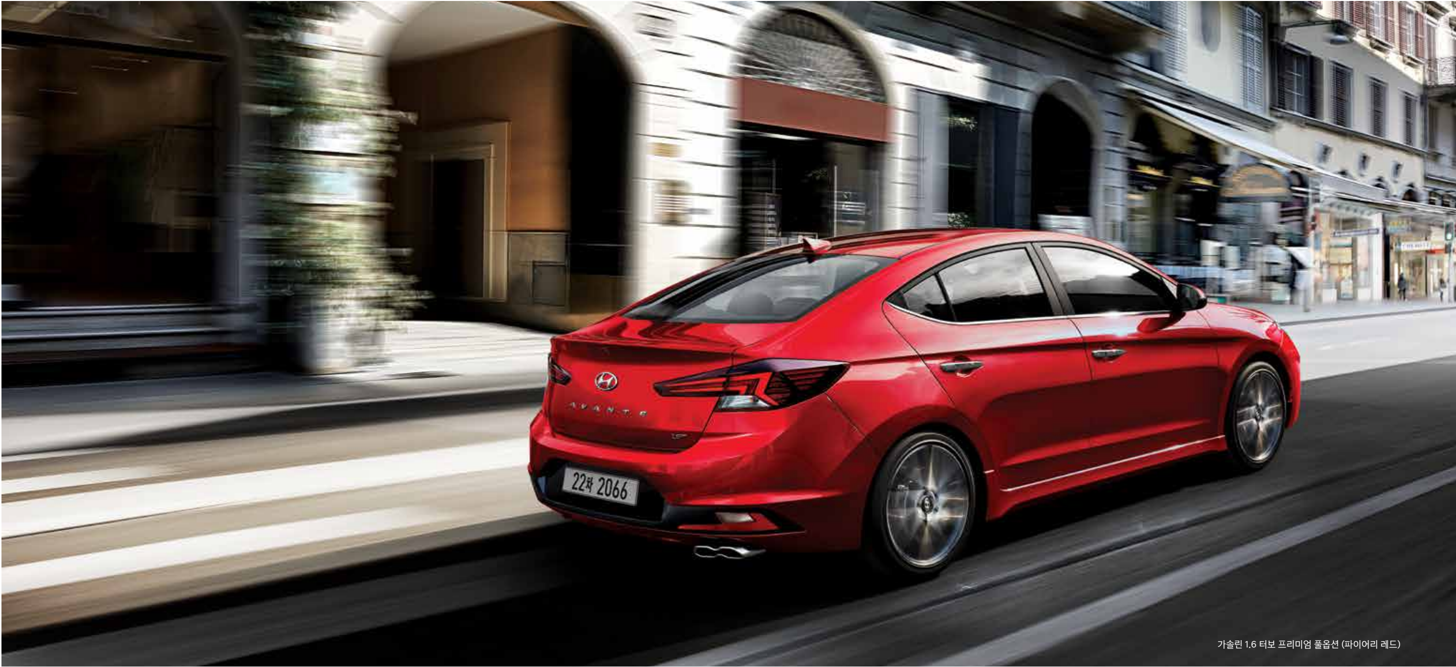
가솔린 1.6 터보 프리미엄 풀옵션 (파이어리 레드)