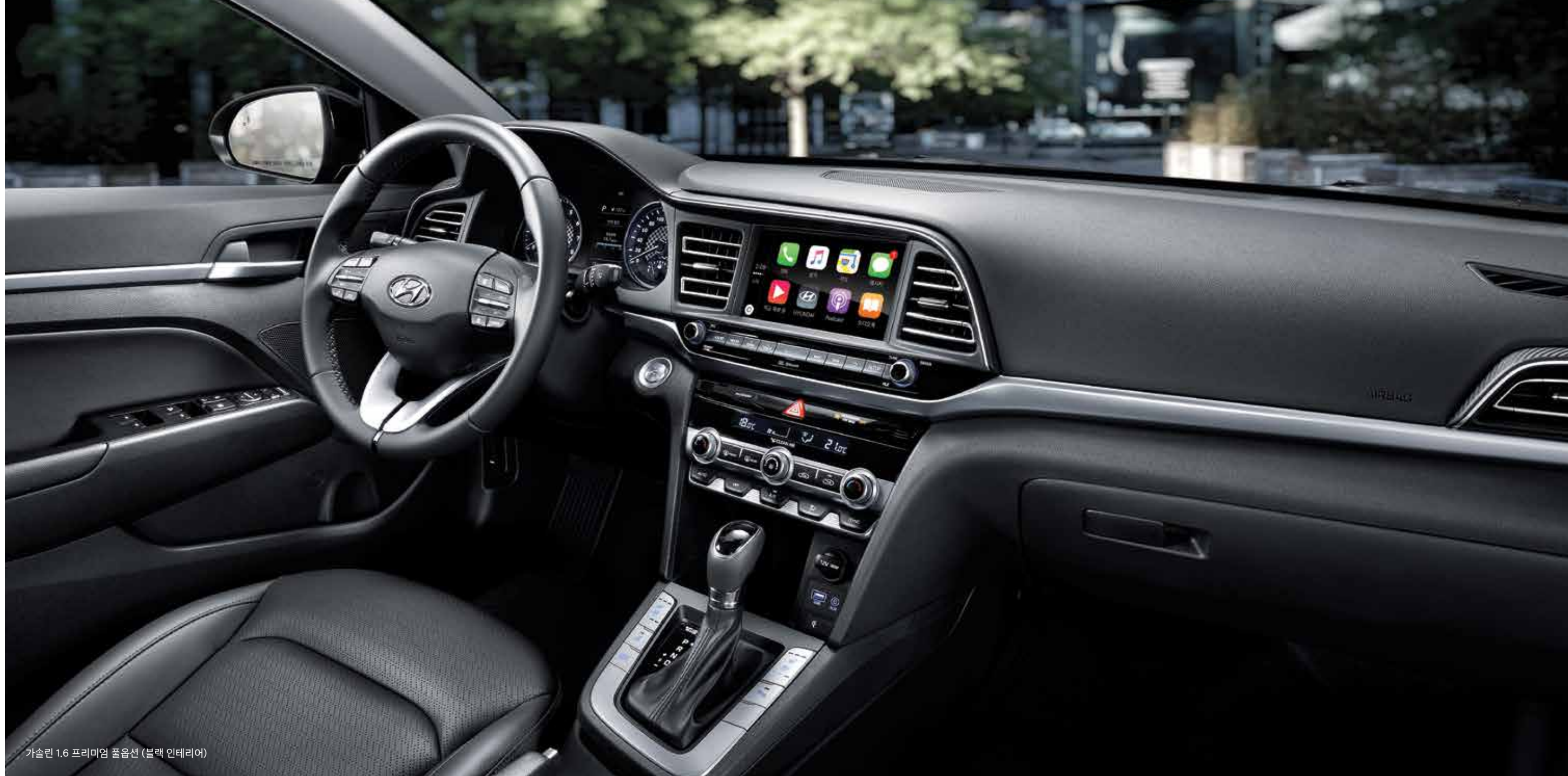
가솔린 1.6 프리미엄 풀옵션 (블랙 인테리어)