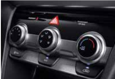
슈퍼비전 클러스터(3.5인치 단색 LCD) 매뉴얼 에어컨