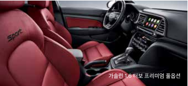
가솔린 1.6 터보 프리미엄 풀옵션