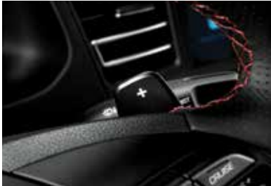
6단 수동변속기 패들 쉬프트