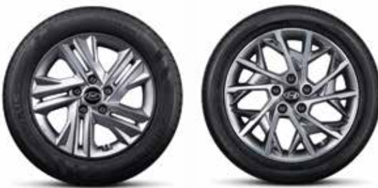
205/55R16 타이어 & 16인치 알로이 휠 / 225/45R17 타이어 & 17인치 알로이 휠