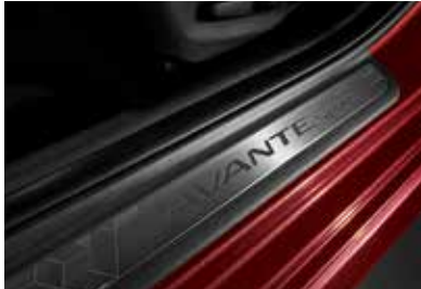
메탈 페달 메탈 도어스커프