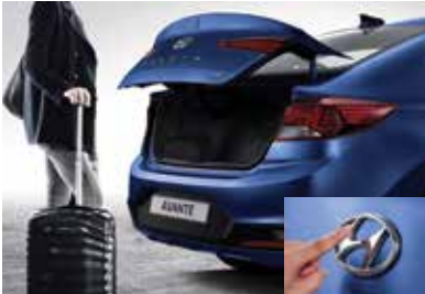
열선 스티어링 휠 스마트 트렁크 & 히든 타입 트렁크 버튼