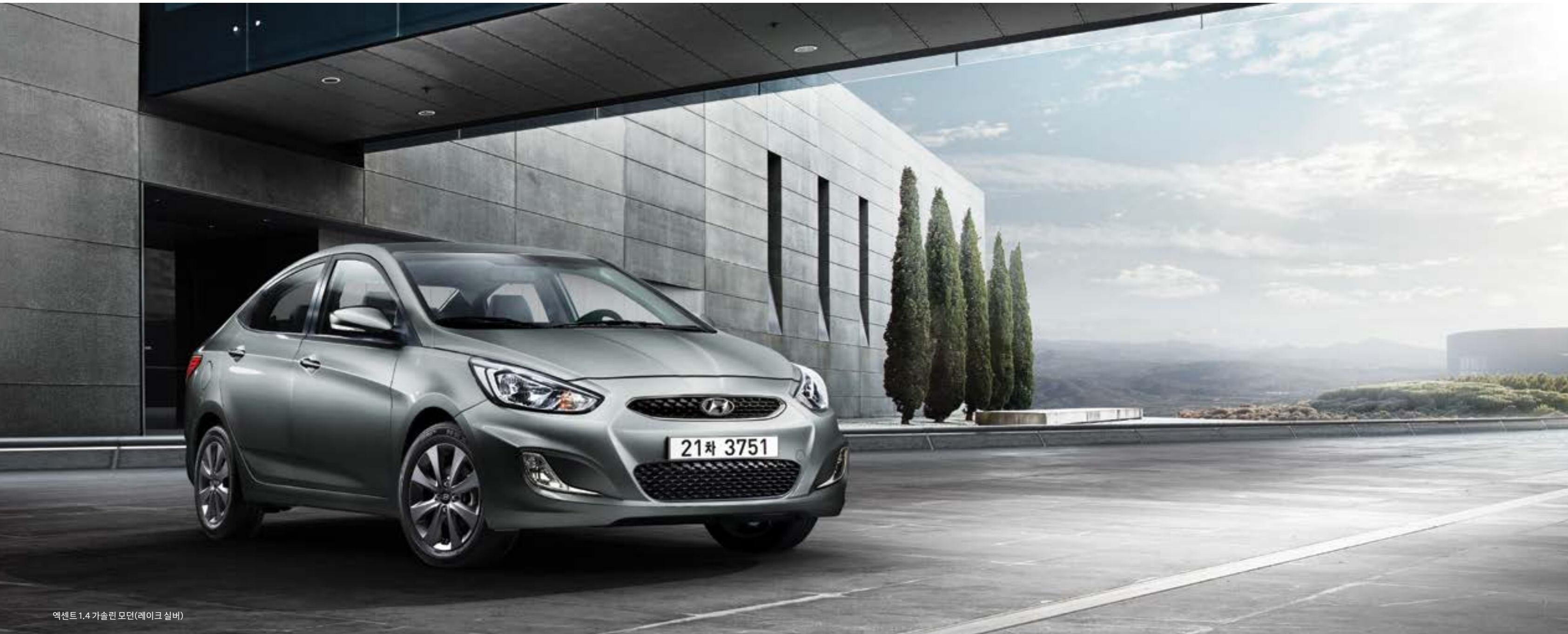
엑센트 1.4 가솔린 모던(레이크 실버)