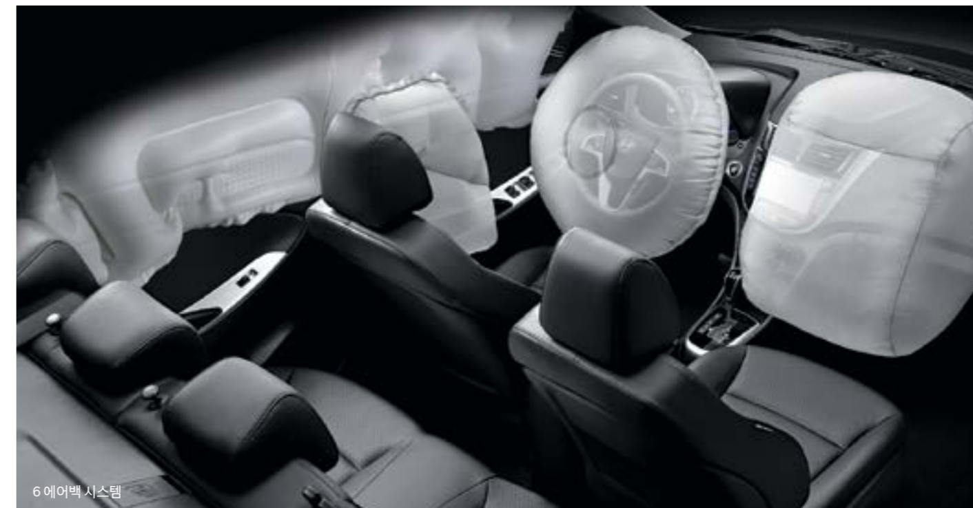
6 에어백 시스템