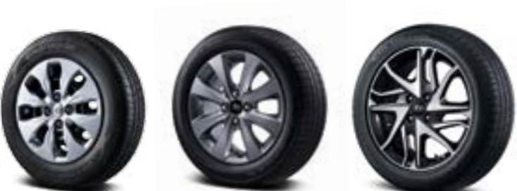
175/70 R14 타이어 & 14인치 스틸 휠 185/60 R15 타이어 & 15인치 알로이 휠 195/50 R16 타이어 & 16인치 알로이 휠