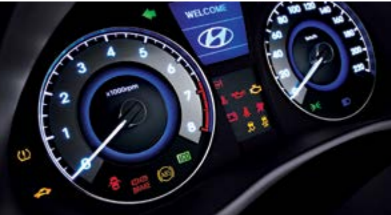
스마트키 & 버튼시동 시스템 슈퍼비전 클러스터