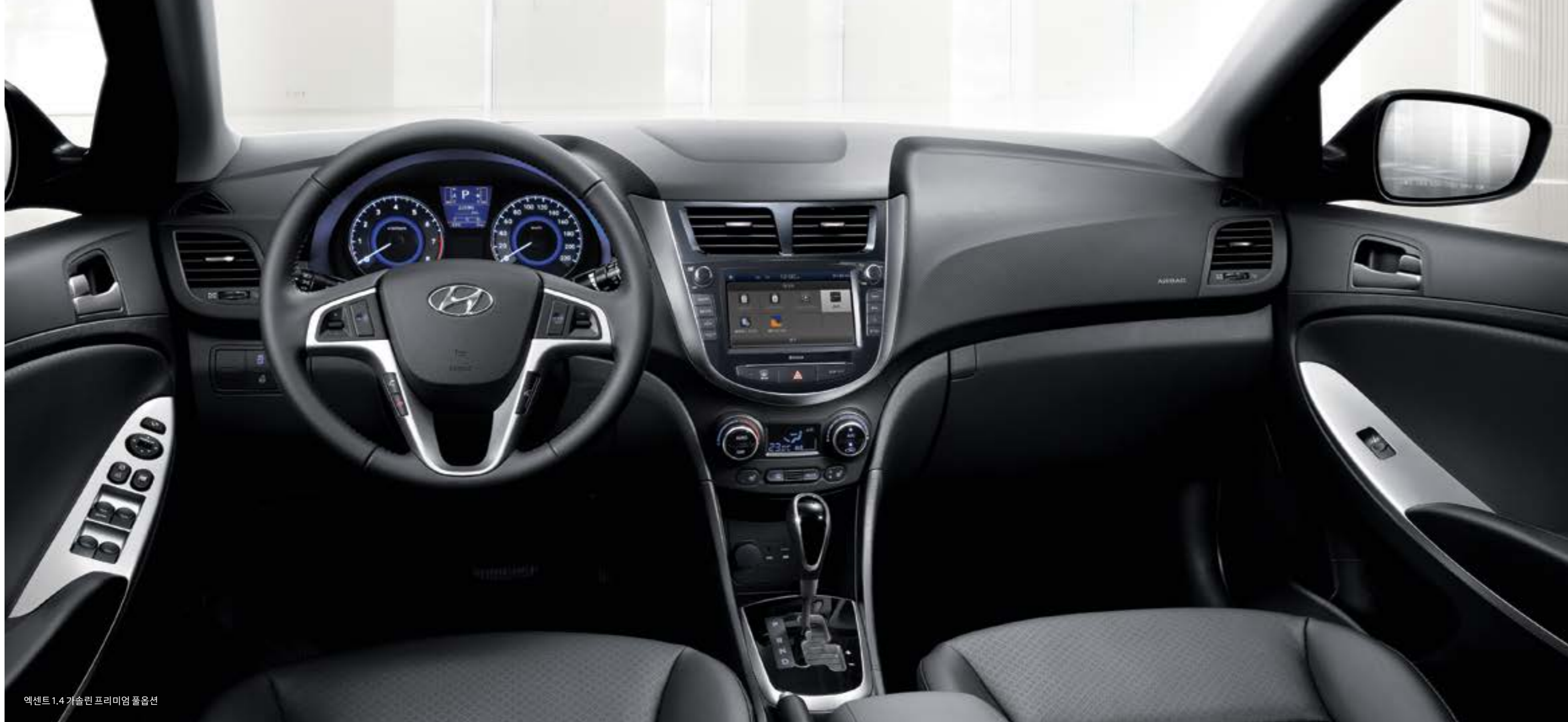
엑센트 1.4 가솔린 프리미엄 풀옵션