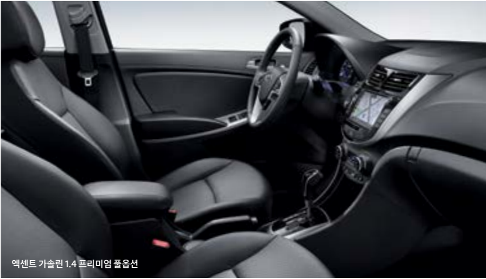
엑센트 가솔린 1.4 프리미엄 풀옵션