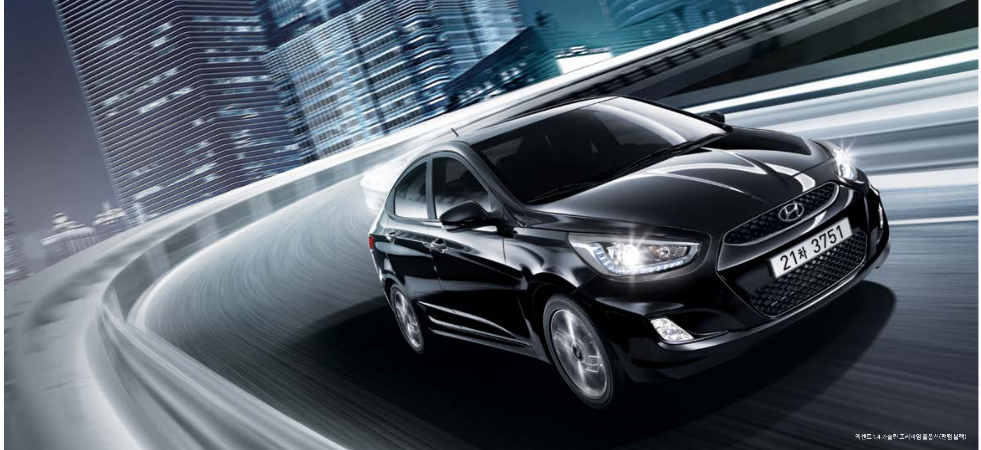
엑센트 1.4 가솔린 프리미엄 풀옵션(팬텀 블랙)