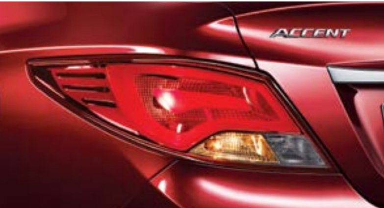
LED 리어콤비램프 별브 리어콤비램프