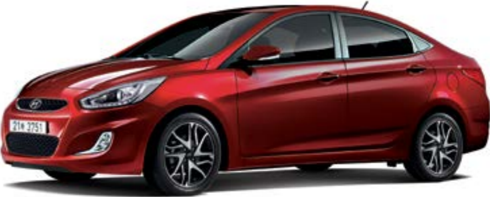
엑센트 1.4 가솔린 프리미엄 풀옵션(펄스 레드)