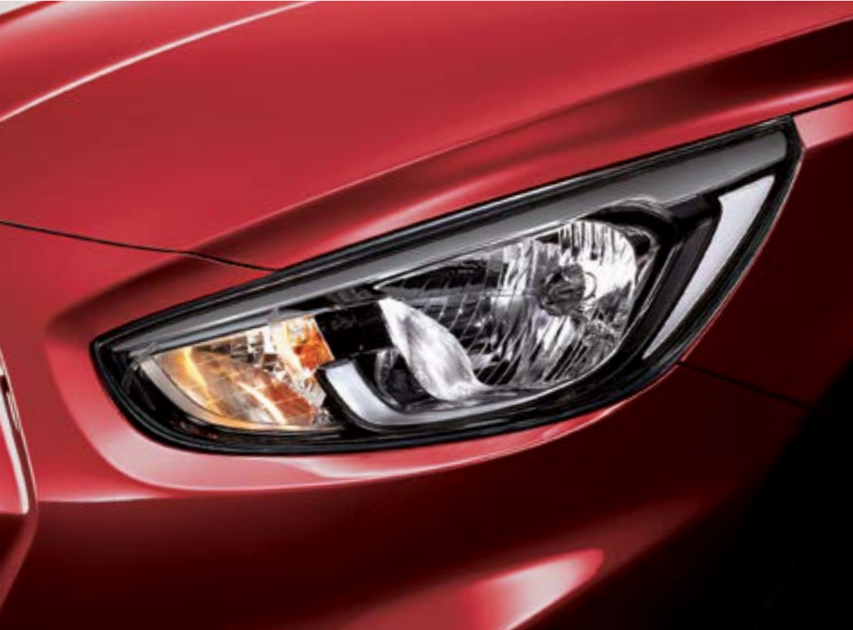
클리어 타입 헤드램프

세련된 디자인과 볼륨감 속에 날렵한 헤드램프와 고급스러운 LED 리어 콤비램프, 신형 16인치 알로이 휠의 스타일리시한 디테일이 다이내믹함을 전달합니다. 이것이 바로 엑센트의 스타일.