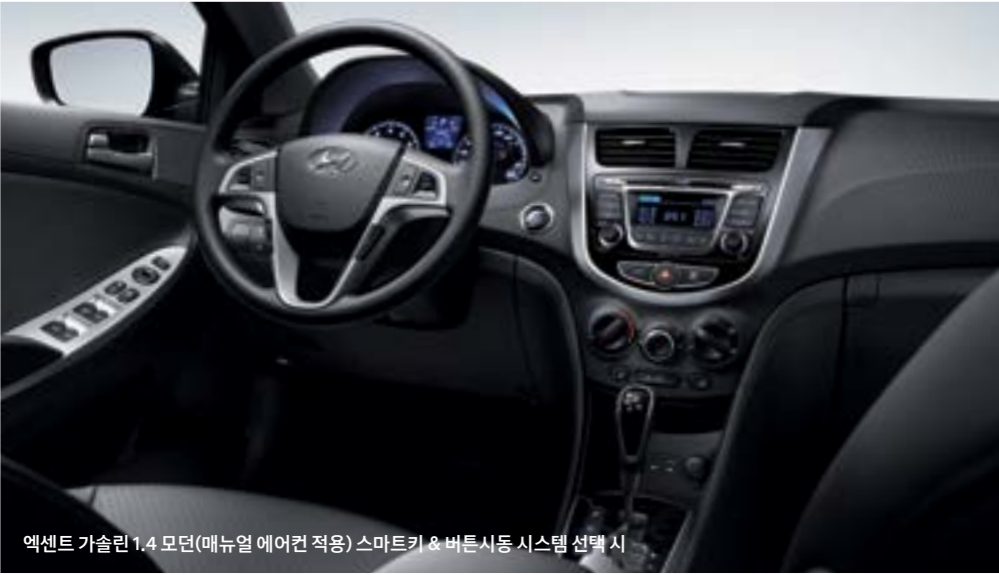
엑센트 가솔린 1.4 모던(매뉴얼 에어컨 적용) 스마트키 & 버튼시동 시스템 선택 시

본 인쇄물은 고객의 이해를 돕기 위해 연출된 것으로 최상위 모델 및 옵션을 중심으로 제작되었습니다. 본 인쇄물의 사양은 트림, 패키지, 파워트레인, 외장 색상 등에 따라 다르게 적용되며, 모델별 자세한 사양은 해당 월의 가격표를 참고하시기 바랍니다.