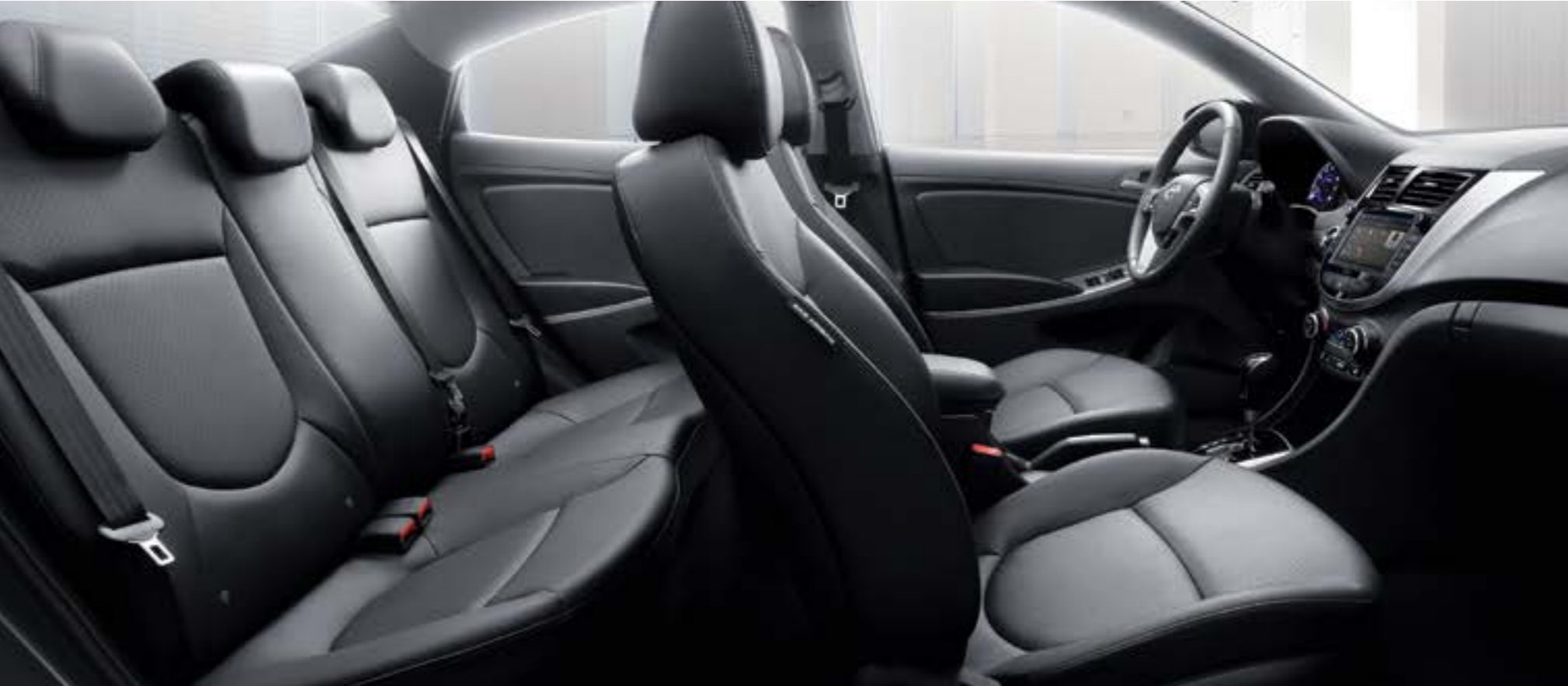
엑센트 1.4 가솔린 프리미엄 풀옵션