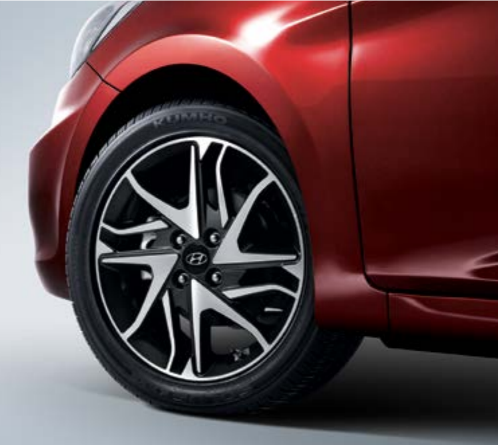
16인치 알로이 휠