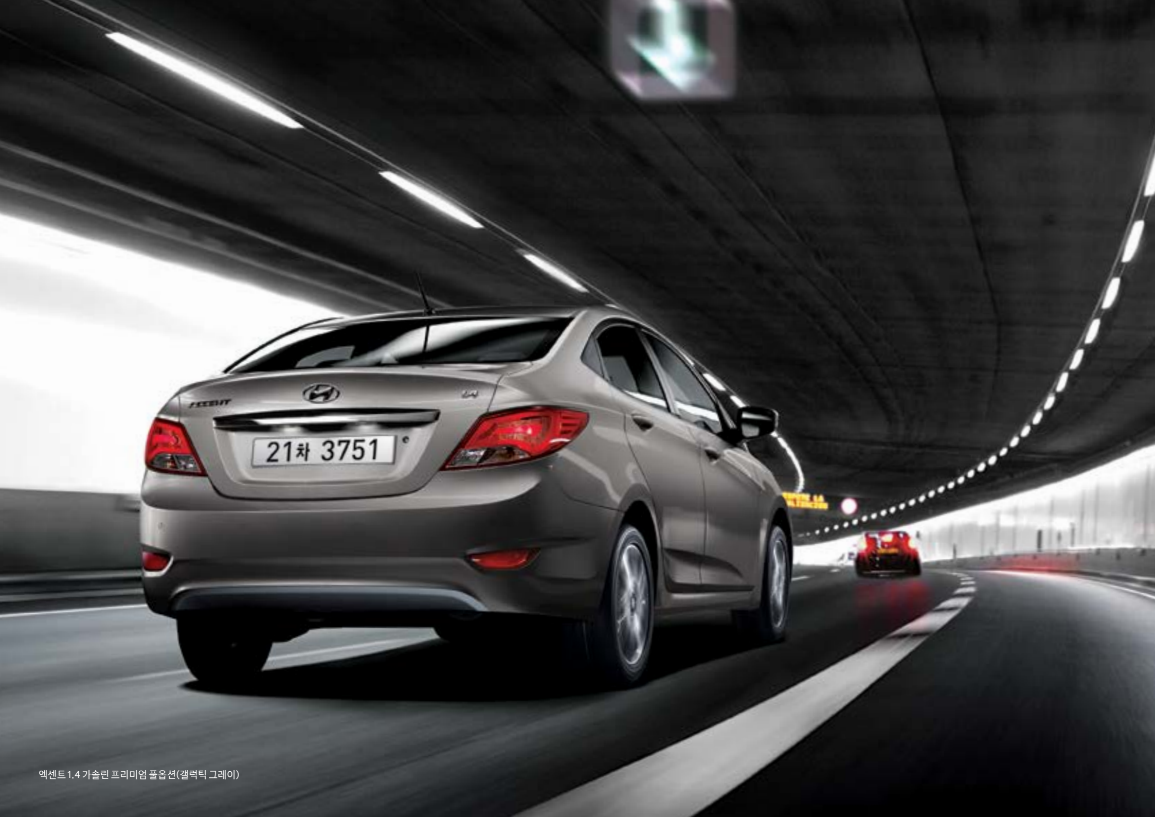
엑센트 1.4 가솔린 프리미엄 풀옵션(갤럭시 그레이)