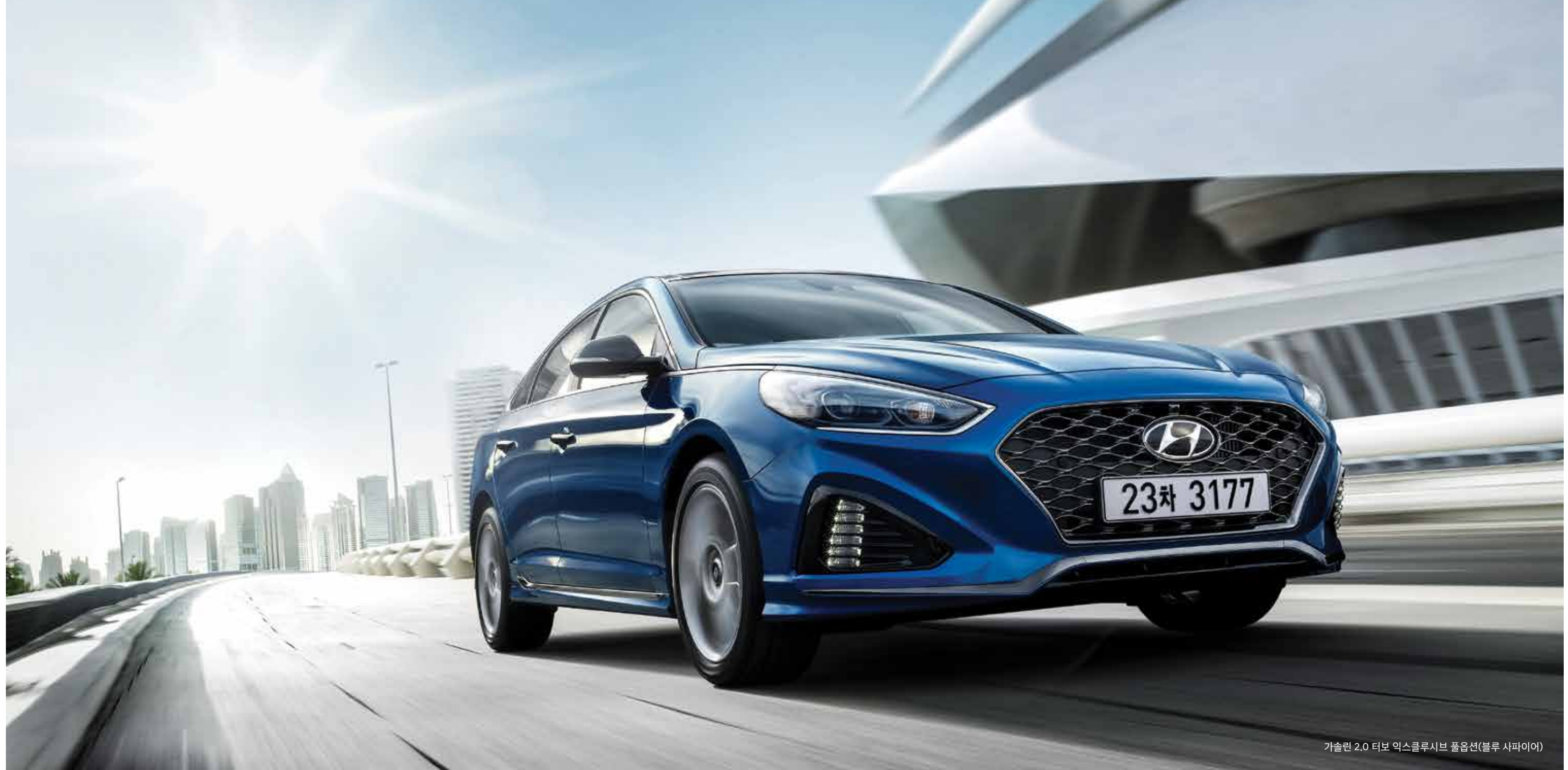
가솔린 2.0 터보 엑스클루시브 풀옵션(블루 사파이어)