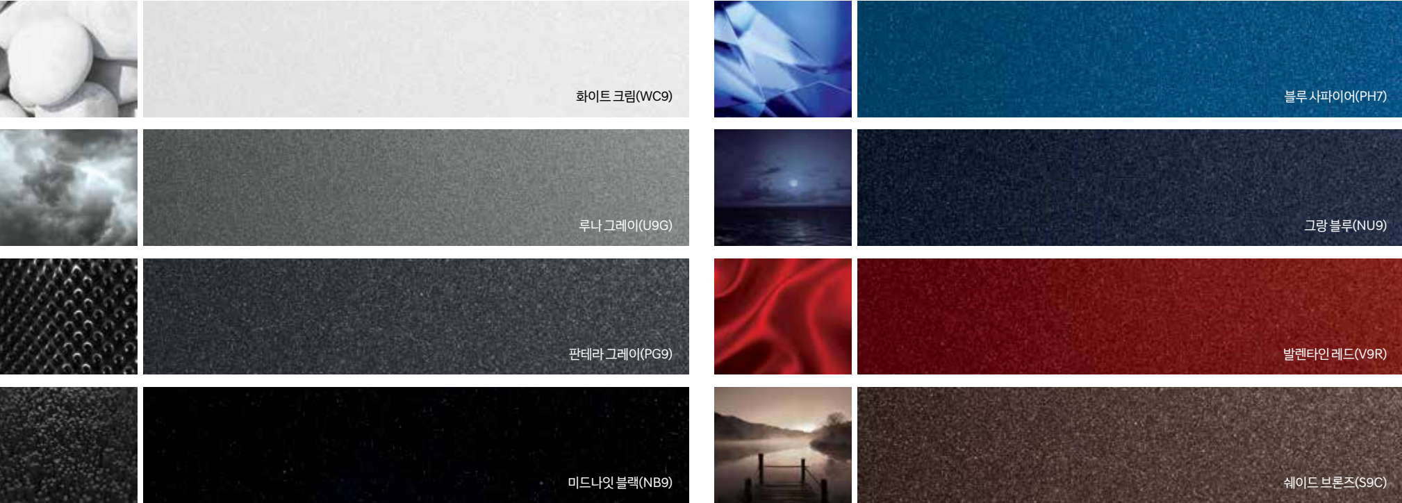
Color combination chart