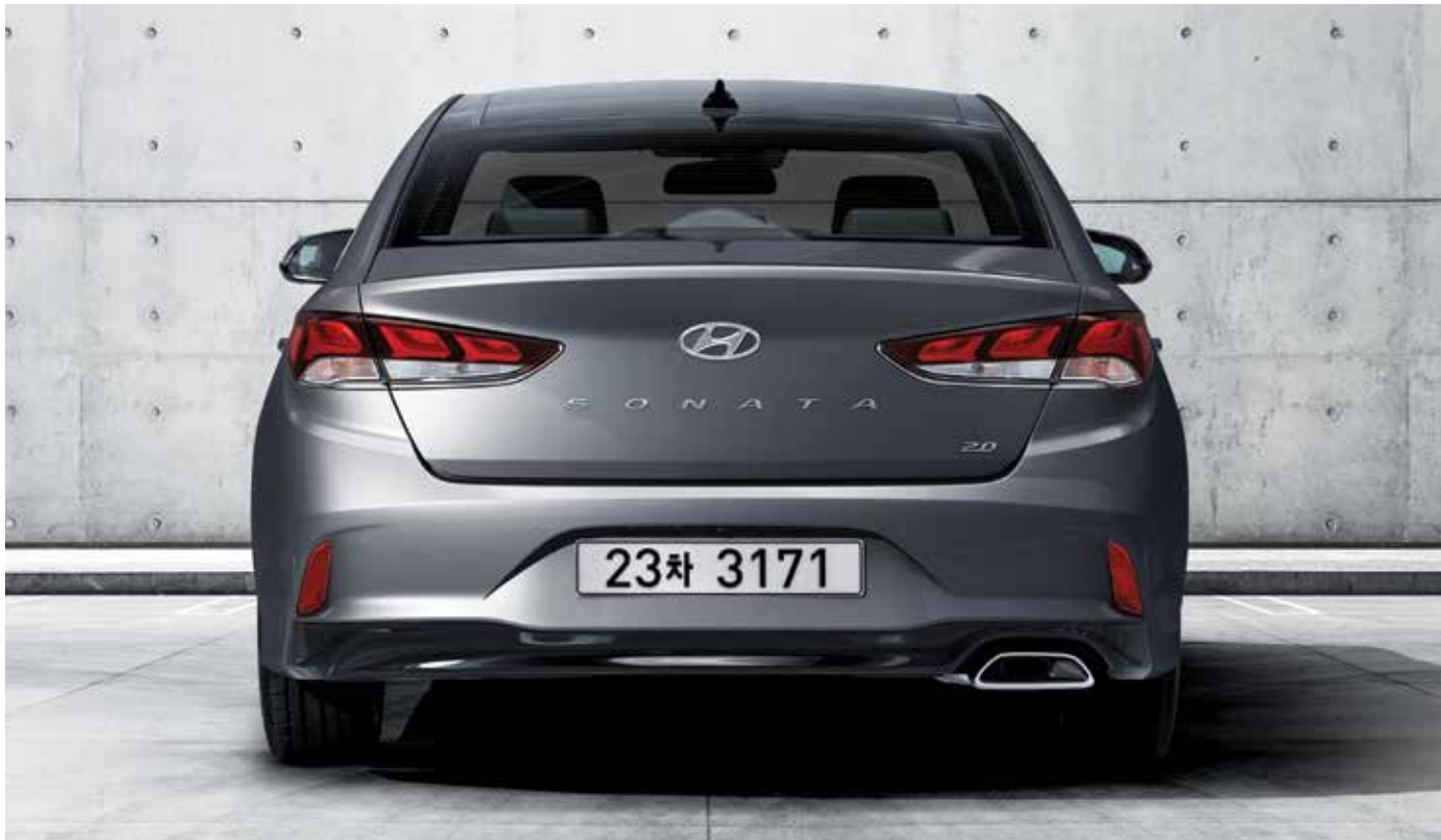
입체적이고 와이드한 감성의 범퍼 볼륨/히든 타입 트렁크 버튼 적용