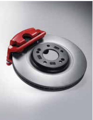
레드 캘리퍼&대구경 디스크 (프론트 18인치/리어 17인치)&로우스틸 패드