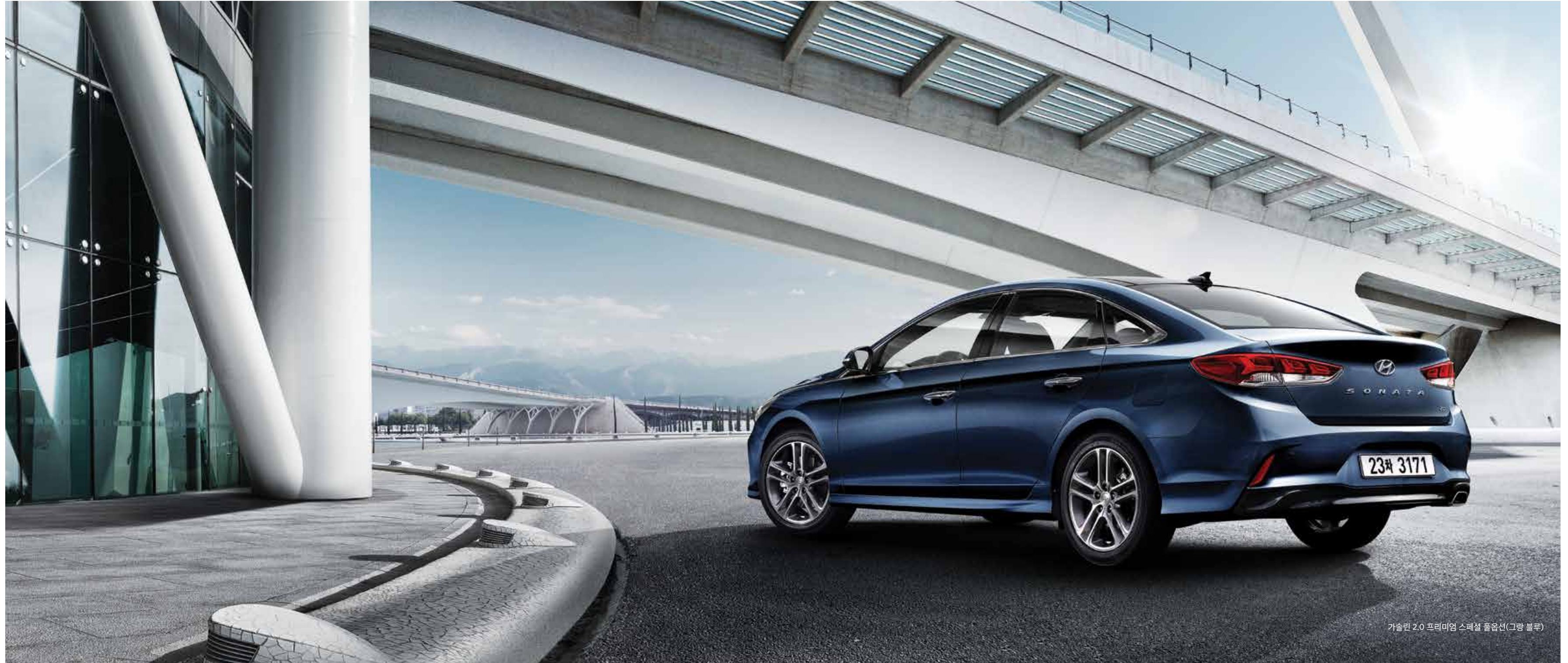
가솔린 2.0 프리미엄 스페셜 풀옵션(그랑 블루)