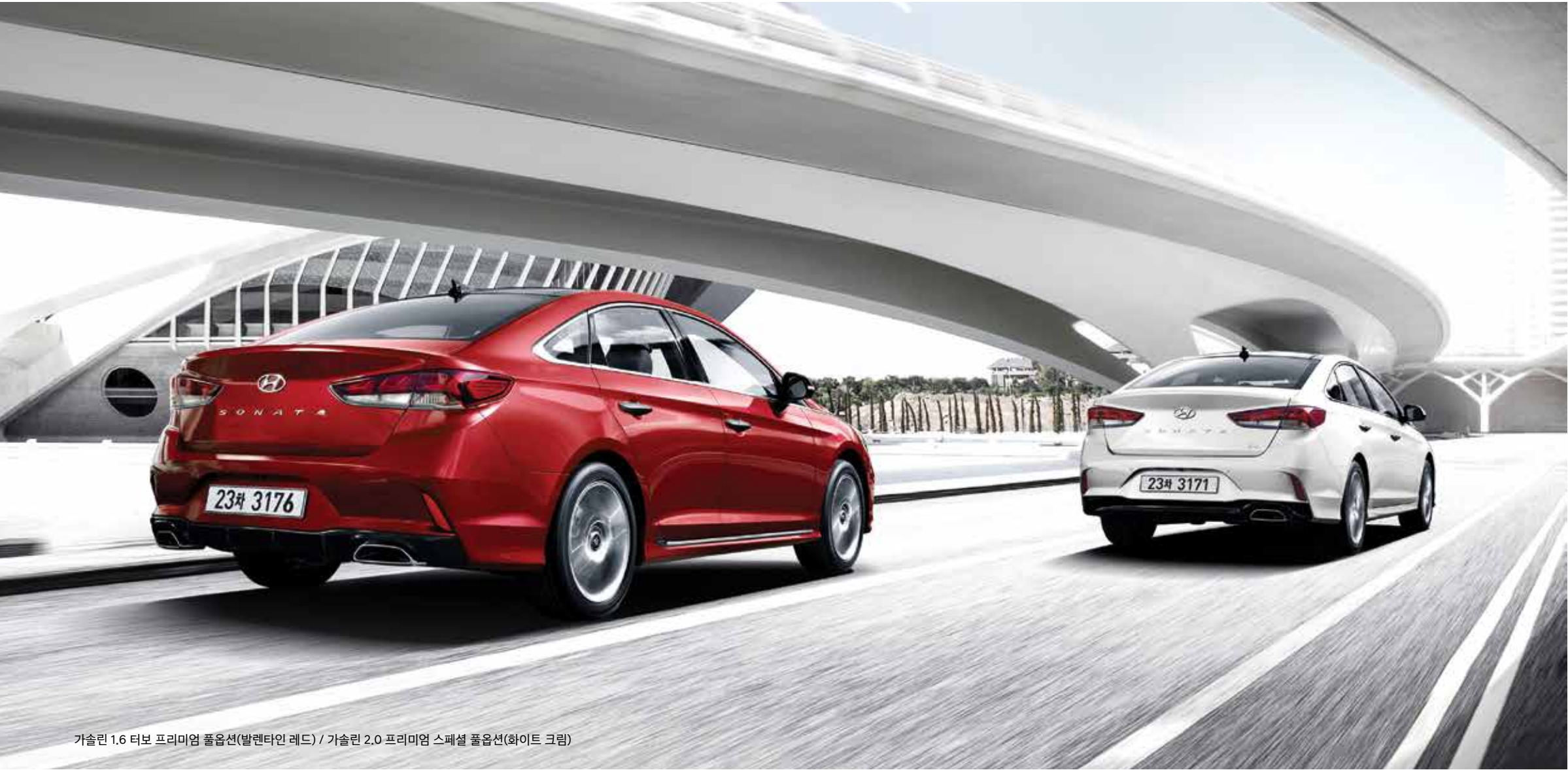
가솔린 1.6 터보 프리미엄 풀옵션(발렌타인 레드) / 가솔린 2.0 프리미엄 스페셜 풀옵션(화이트 크림)

01 주행 조향보조 시스템 윈드실드 글래스 상단에 장착된 카메라를 통하여 차선을 인식하고 차선이탈이 예상되면 조향을 보조하여 차선이탈 상황을 방지해 줍니다. 차선 이탈경보 기능, 차선 유지보조 기능, 능동 조향보조 기능 중 하나를 선택하여 사용할 수 있습니다.