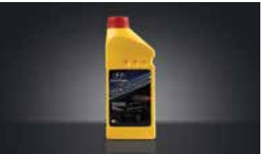
고성능 브레이크 액