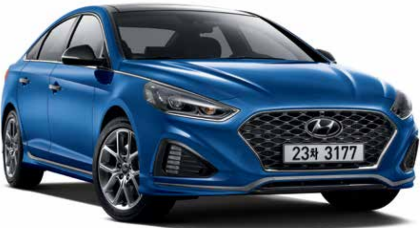
가솔린 2.0 터보 익스클루시브 풀옵션(블루 사파이어)