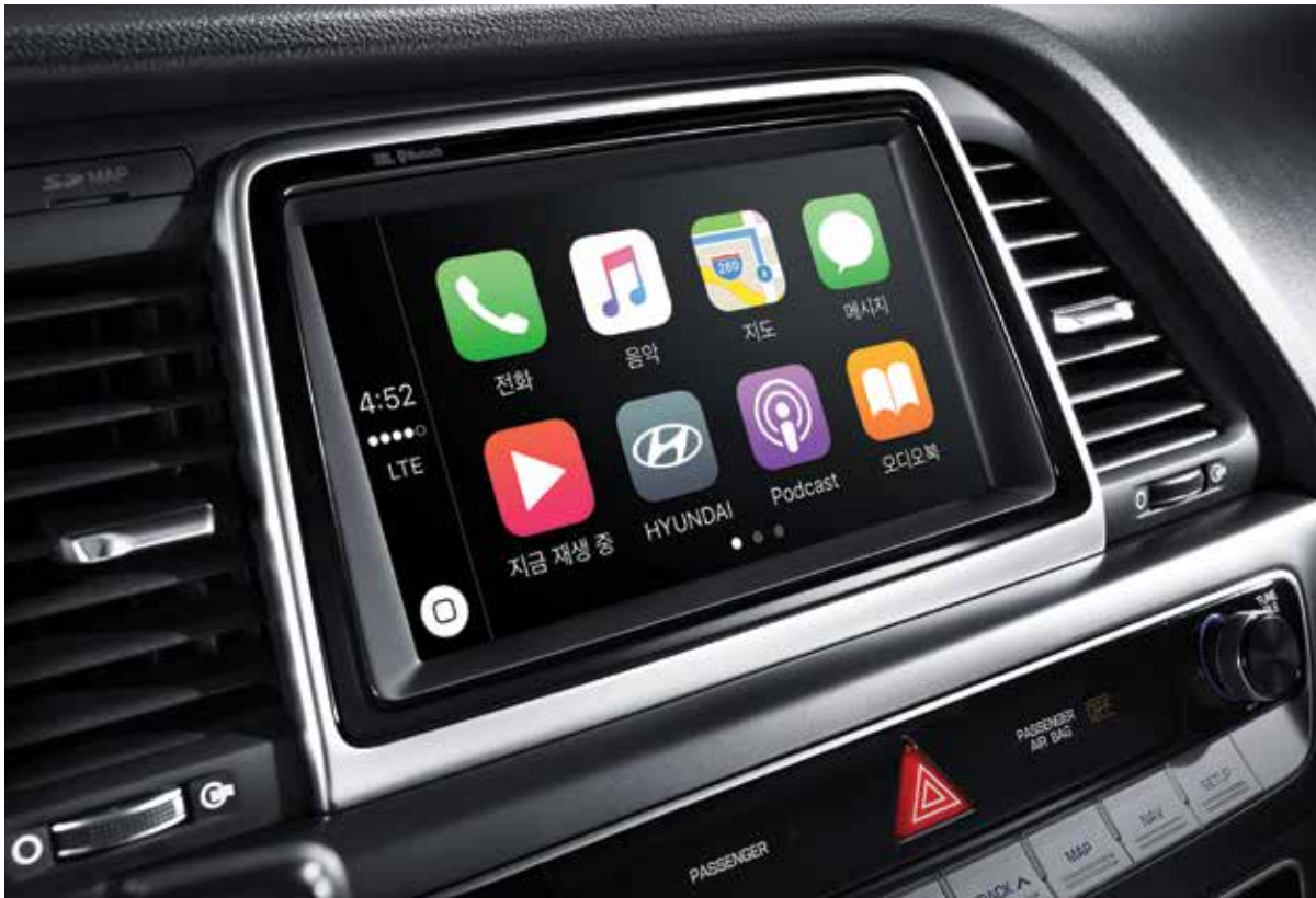
8인치 내비게이션 & 폰 커넥티비티 기능 적용(Apple CarPlay, 미러링크)

※ 지상파 DMB는 320X240 해상도를 지원하는 사양으로, DMB 사업자가 고화질 DMB(해상도 1,280X720)방송으로 전환 등 송출방식 변경 또는 방송정책에 따라 지상파 DMB 수신이 불가할 수 있음. ※ 내비게이션 지도 업데이트 서비스는 차량 구매 후 8년까지 보장되며, 이후 당사 사정에 의해 만료될 수 있습니다.