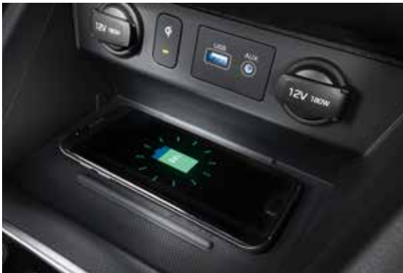
듀얼 폴 오토 에어컨/공기 청정 모드 스마트폰 무선충전 시스템