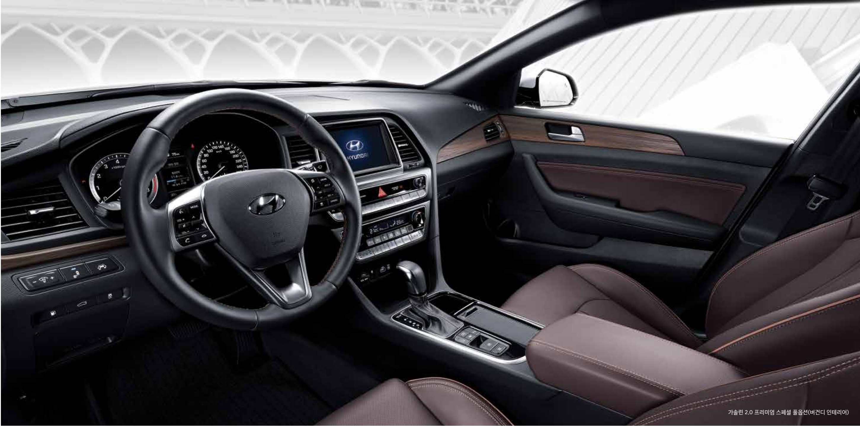
가솔린 2.0 프리미엄 스페셜 풀옵션(버건디 인테리어)