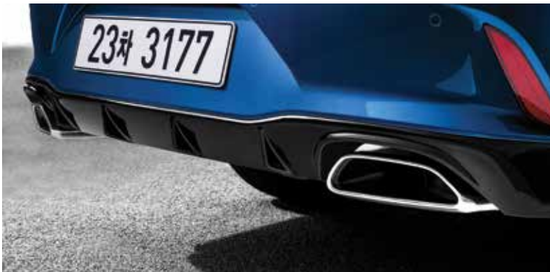
터보 전용 18인치 스포츠 알로이 휠 & 미쉐린 타이어 터보 전용 듀얼 싱글팁 머플러