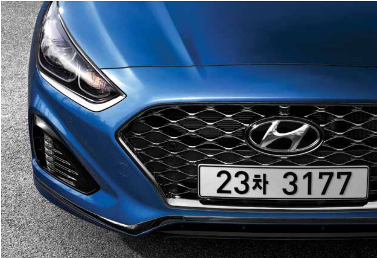
터보 전용 외장 컬러와 디자인이 적용된 전면부