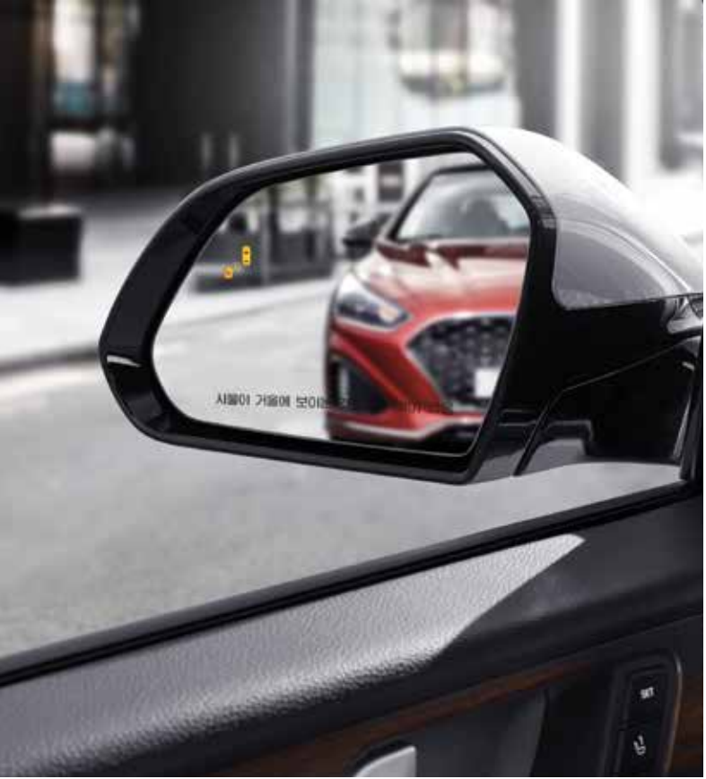
스마트 후측방 경보시스템(BSD)