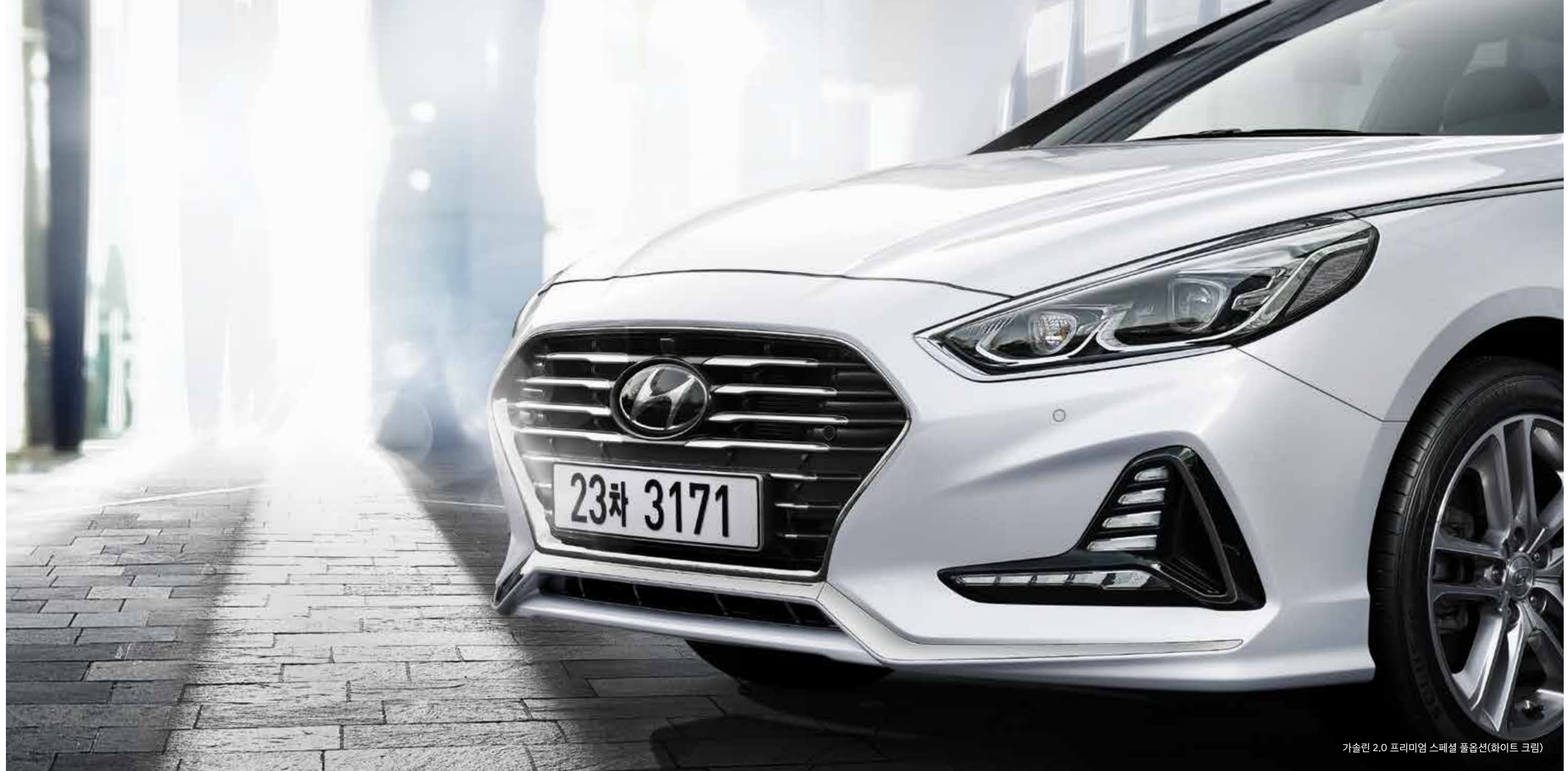
가솔린 2.0 프리미엄 스페셜 풀옵션(화이트 크림)