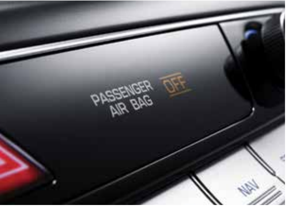
7에어백 시스템 (운전석/동승석 어드밴스드 에어백, 운전석 무릎, 운전석/동승석 사이드, 전복 대응 커튼) 운전석/동승석 어드밴스드 에어백