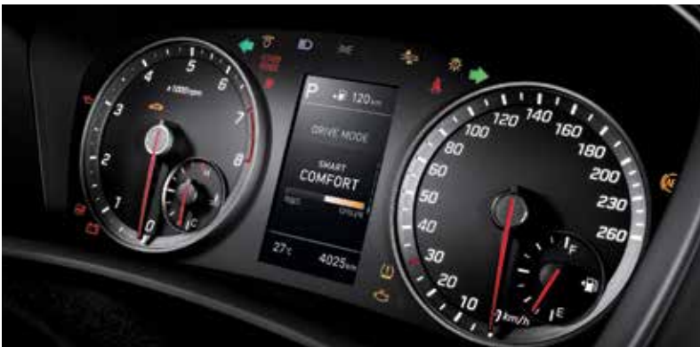
8단 자동 변속기(가솔린 2.0 터보 전용) 슈퍼비전 클러스터(가솔린 2.0 터보 전용)