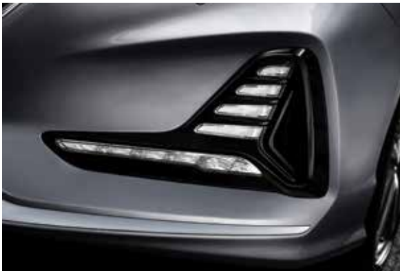
LED 헤드램프(바이펑션) LED 주간주행등(DRL, 포지셔닝 기능 포함)