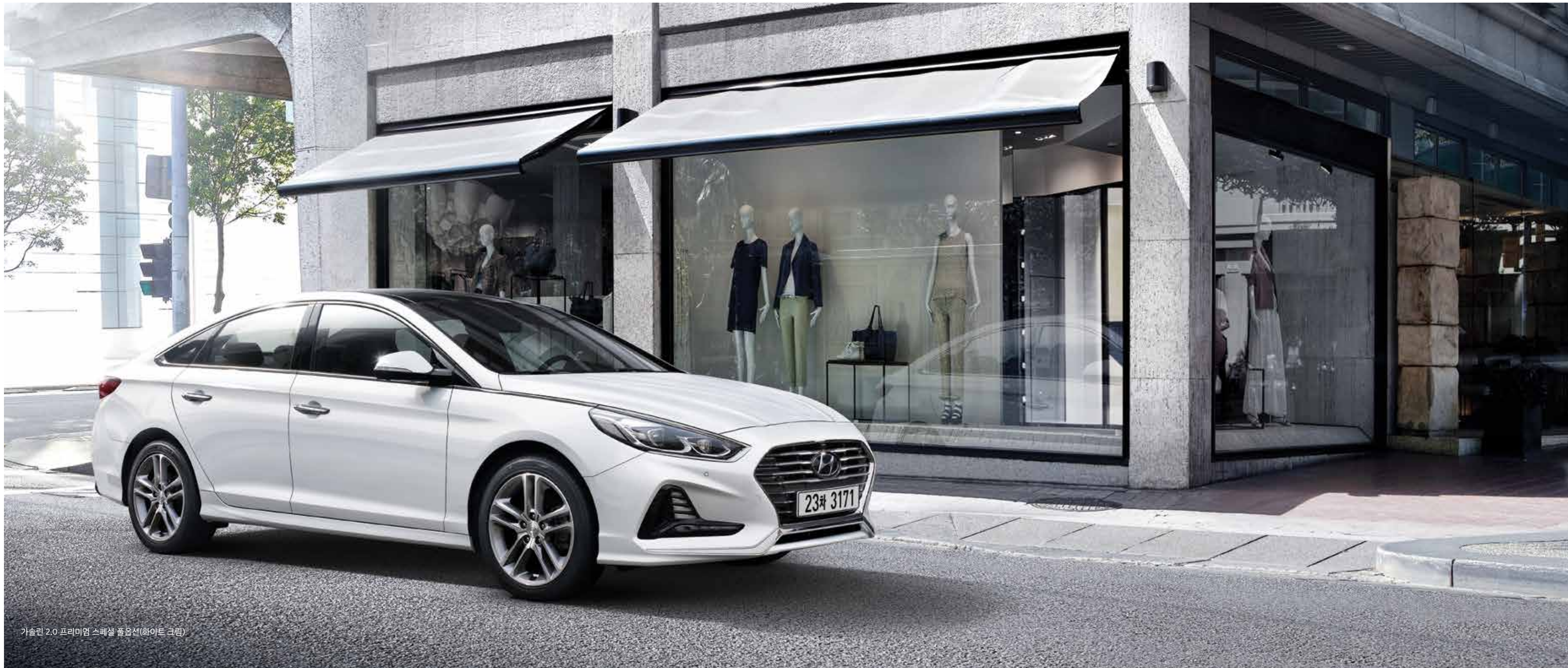
가솔린 2.0 프리미엄 스페셜 풀옵션(화이트 크림)