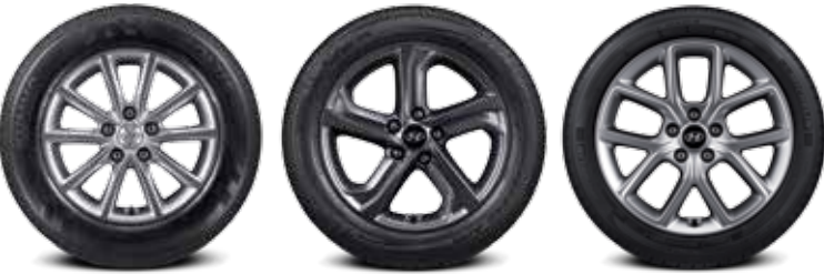
205/65 R16 타이어 & 16인치 알로이 휠 215/55 R17 타이어 & 17인치 알로이 휠 235/45 R18 미쉐린 타이어 & 18인치 알로이 휠(가솔린 1.6 터보는 일반 타이어 적용)