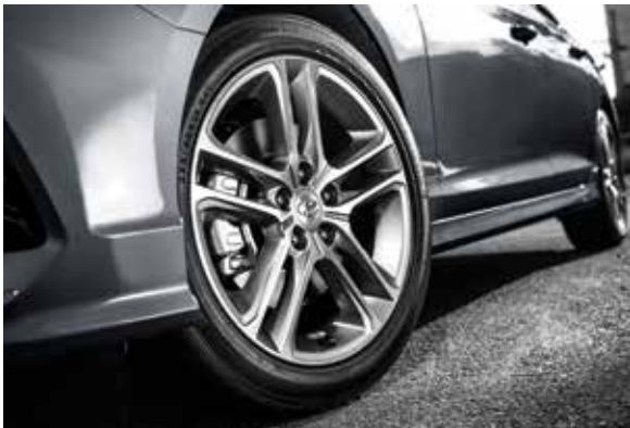
LED 리어 콤비램프(제동등, 후미등 적용) 18인치 알루미늄 휠 & 타이어