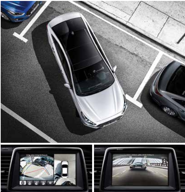
서라운드 뷰 모니터/주행 중 후방영상 디스플레이(DRM)

※ 지상파 DMB는 320X240 해상도를 지원하는 사양으로, DMB 사업자가 고화질 DMB(해상도 1,280X720)방송으로 전환 등 송출방식 변경 또는 방송정책에 따라 지상파 DMB 수신이 불가할 수 있음. ※ 내비게이션 지도 업데이트 서비스는 차량 구매 후 8년까지 보장되며, 이후 당사 사정에 의해 만료될 수 있습니다.