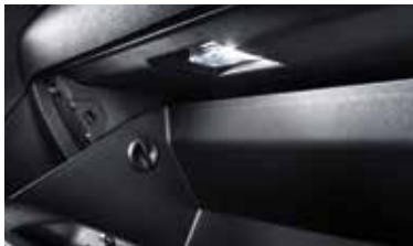
글로벌 박스 램프