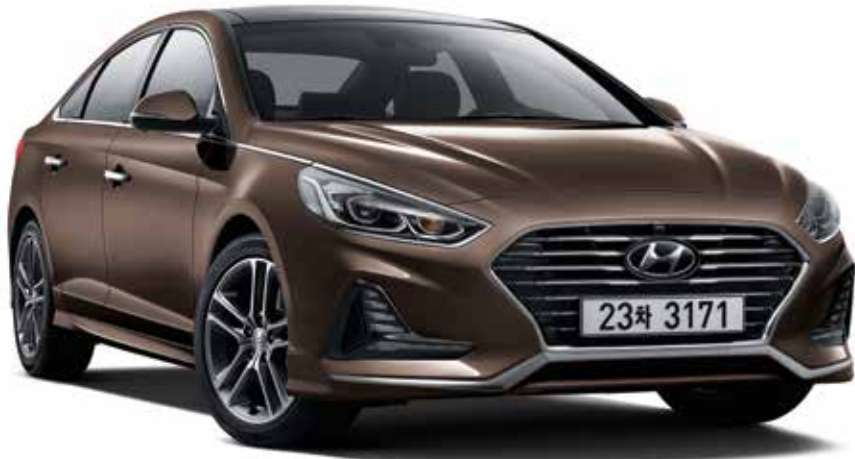
가솔린 2.0 프리미엄 스페셜 풀옵션(쉐이드 브론즈)