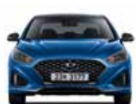
윤거 전 전폭