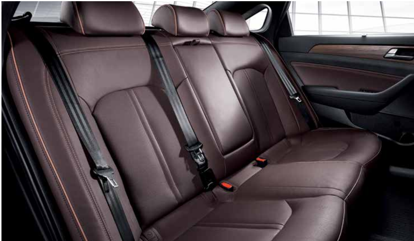
세련된 컬러의 여유롭고 안락한 실내 공간