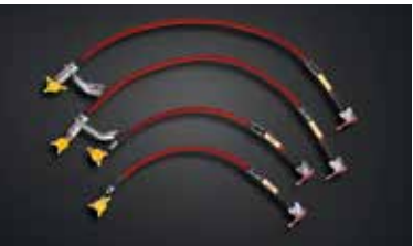
강화 브레이크 호스