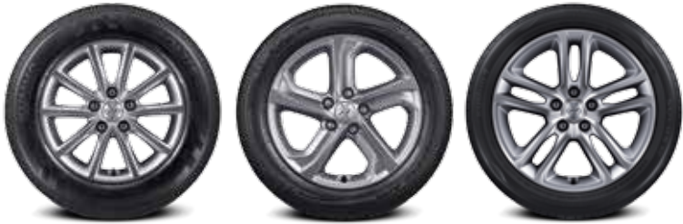
205/65 R16 타이어 & 16인치 알로이 휠 215/55 R17 타이어 & 17인치 알로이 휠 235/45 R18 타이어 & 18인치 알로이 휠(LPi 2.0 미적용)