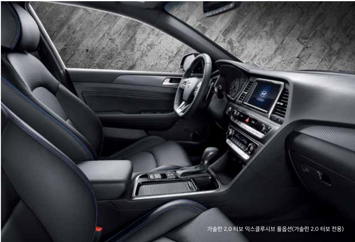
가솔린 2.0 터보 익스클루시브 풀옵션(가솔린 2.0 터보 전용)