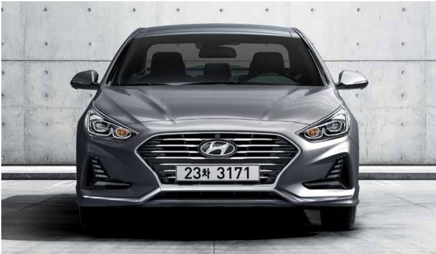
다이나믹하고 스포티한 감성의 캐스캐이딩 그릴