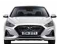
윤거 전 전폭