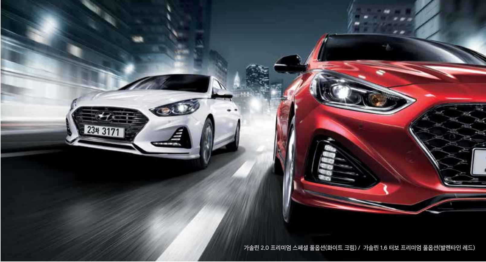
가솔린 2.0 프리미엄 스페셜 풀옵션(화이트 크림) / 가솔린 1.6 터보 프리미엄 풀옵션(발렌타인 레드)

* 복합연비는 205/65 R16 타이어 기준(가솔린 2.0 터보는 235/45 R18 타이어 기준)