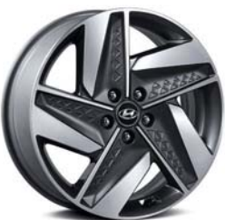
19인치 알로이 휠