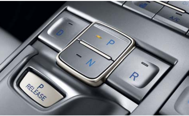
전자식 변속 버튼 일반적인 형태의 기어노브가 아닌 버튼을 누르는 방식을 적용해 직관적이면서도 미래지향적인 이미지를 구현합니다.