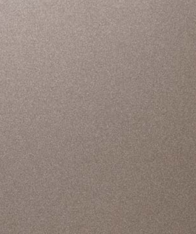
카퍼 메탈릭 (R3C)