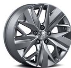
17인치 알로이 휠