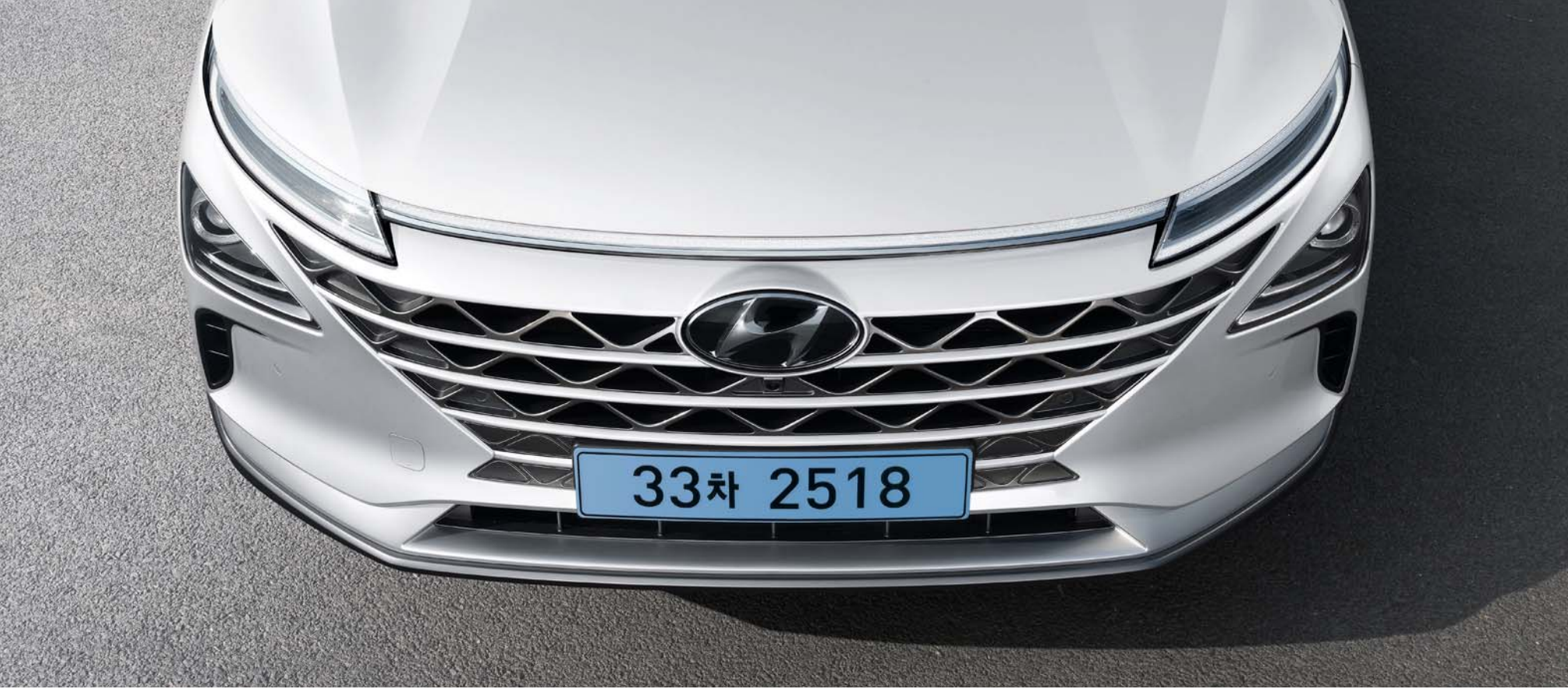
호라이즌 포지셔닝 램프 / 분리형 컴포지트 LED 헤드램프 / 캐스캐이딩 그릴

좌우를 연결하는 호라이즌 포지셔닝 램프와 공기역학을 고려해 설계된 오토폴러시 도어 핸들이 미래지향적인 이미지를 완성해줍니다.