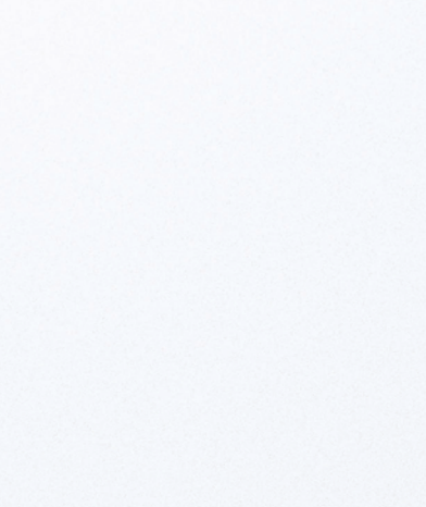
화이트 크림 | 펄 (TW3)