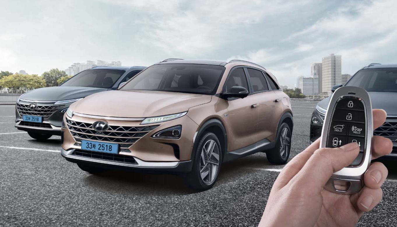
원격 스마트 주차 보조 주차 보조 기능을 활성화 한 후 주차공간을 발견하게 되면 차량 내 안내에 따라 하차한 다음, 스마트키의 작동 버튼을 누르고만 있으면 차가 스스로 주차합니다. 직각주차 및 평행주차 모두 가능하며, 운전자 탑승 시에도 차량 내부의 작동 버튼을 누르고 있으면 자동 주차 보조를 지원합니다.

머릿속으로만 그려왔던 미래가 혁신적인 모빌리티의 모습으로 눈앞에서 펼쳐집니다. 다가올 미래를 일상에서 먼저 누리는 특별함, 그 중심에 NEXO가 있습니다.