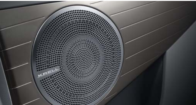
KRELL 프리미엄 사운드 (8스피커, 외장앰프) 스마트 파워 테일게이트