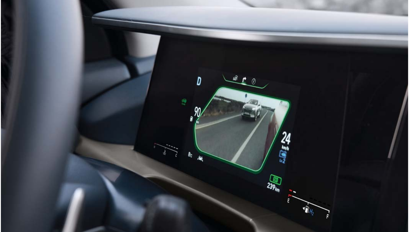
후측방 모니터 방향지시등 점등 시 아웃사이드 미러 하단에 장착된 카메라를 통해 좌/우 후측방 영상이 클러스터 화면에 표시됩니다. 우전 시 주행, 사각지대 등 후측방 시야에 제약이 따를 때 선명하고 와이드한 뷰를 제공하여 보다 안전한 주행을 도와줍니다.