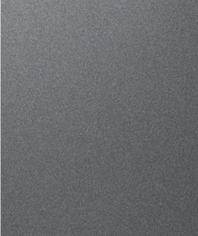
티타늄 그레이 | 무광컬러 (Y3G)