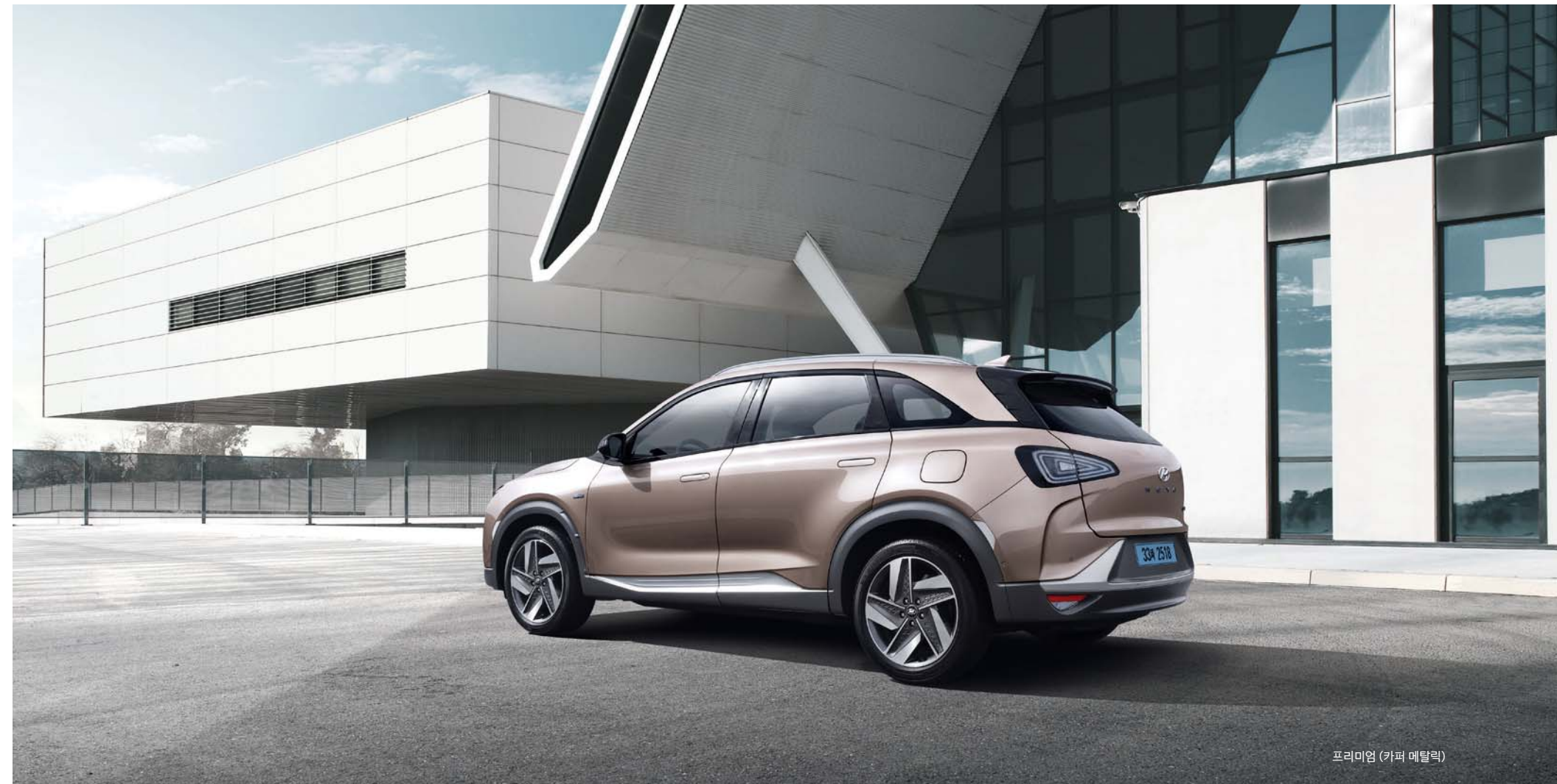
프리미엄 (카퍼 메탈릭)