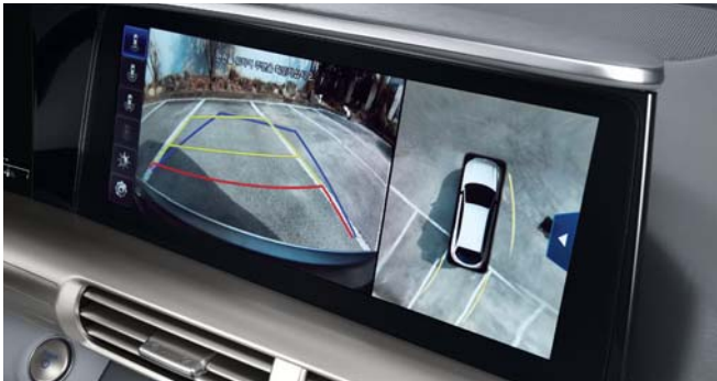
서라운드 뷰 모니터 220V 인버터