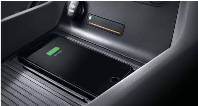
휴대폰 무선충전 와이드 선루프