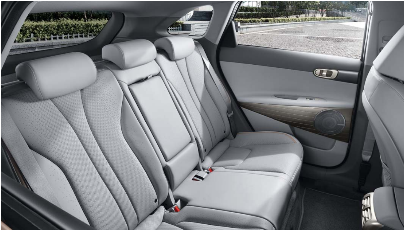
친환경 내장재 (바이오 소재) 식물성 인조가죽, 플라스틱, 패브릭 등 인테리어에 사용된 내장재 대부분은 UL 인증 바이오 소재 (UL Certified BIO Materials)를 사용하여 고급스러움과 친환경성을 더했습니다.