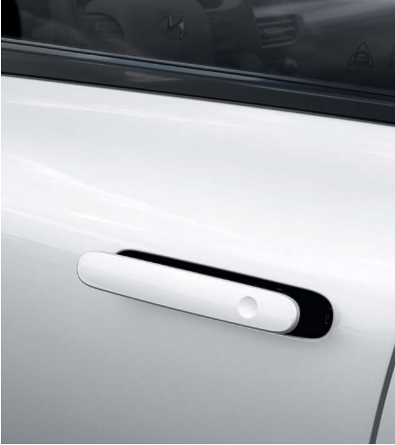
오토폴러시 도어 핸들