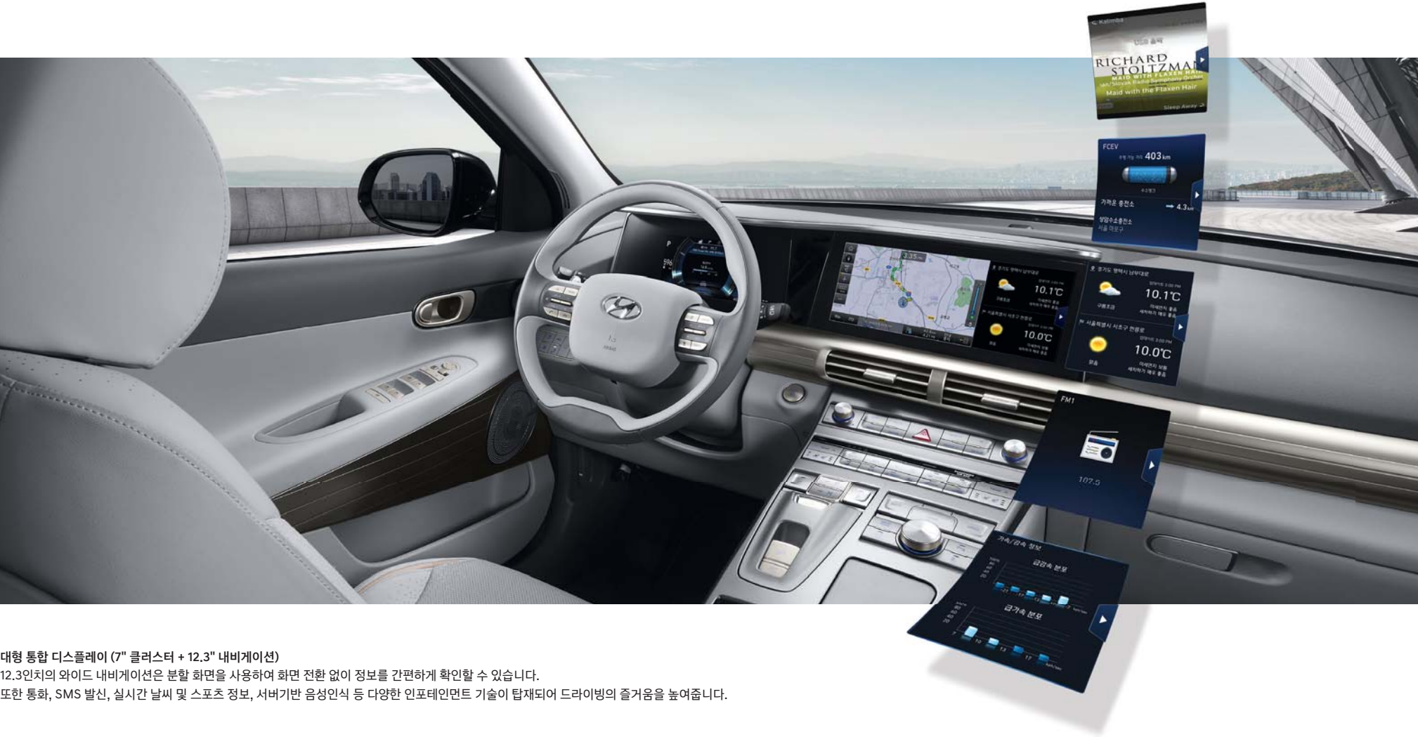
대형 통합 디스플레이 (7" 클러스터 + 12.3" 내비게이션) 12.3인치와이드 내비게이션은 분할 화면을 사용하여 화면 전환 없이 정보를 간편하게 확인할 수 있습니다. 또한 통화, SMS 발신, 실시간 날씨 및 스포츠 정보, 서버기반 음성인식 등 다양한 인포테인먼트 기술이 탑재되어 드라이빙의 즐거움을 높여줍니다.

슬림하게 디자인된 대시보드의 통합형 디스플레이는 차세대 특화 UX 콘텐츠를 제공하는 한편, 브릿지 타입의 센터콘솔을 적용하여 운전자의 편의성은 물론 하이테크 이미지를 더해줍니다.