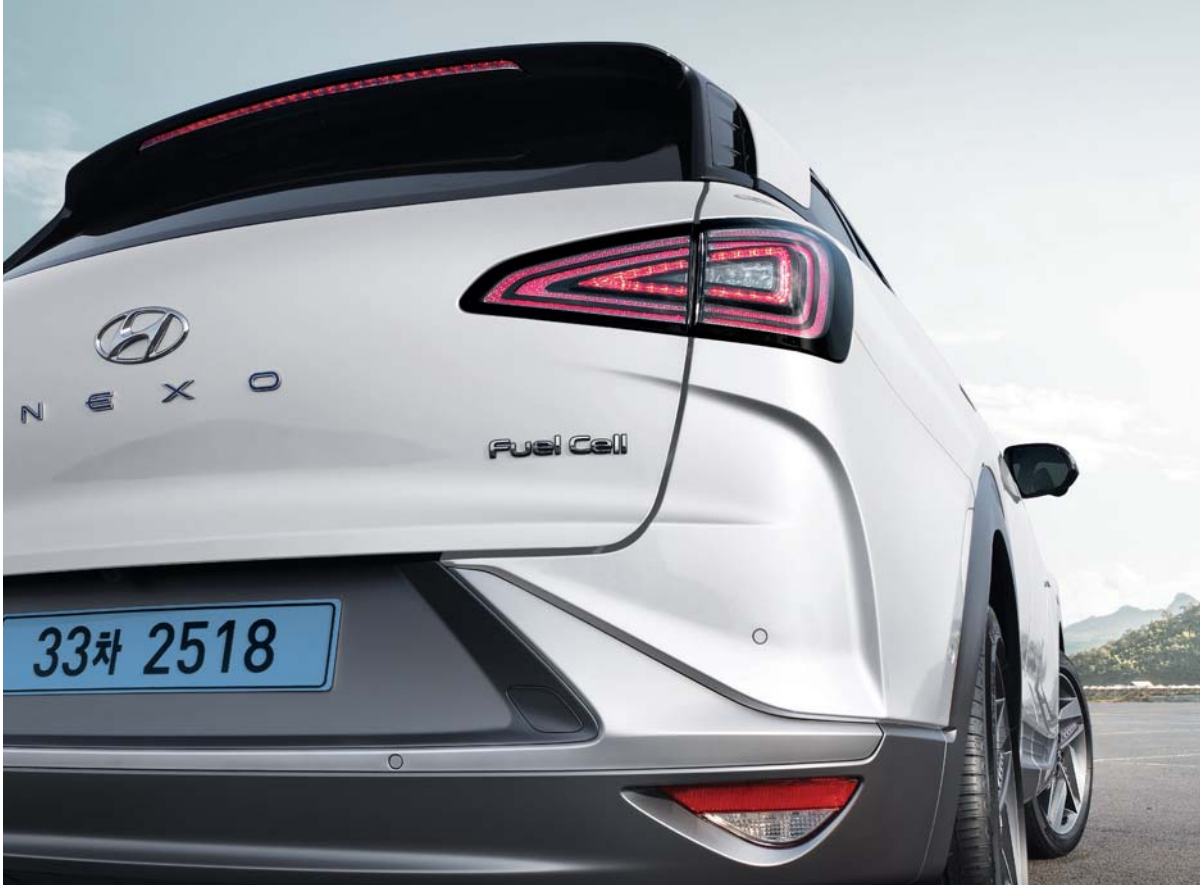
LED 하이 마운트 스톱 램프 / LED 리어 콤비 램프