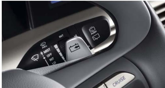
패들쉬프트 (회생제동 컨트롤) 히든 리어 와이퍼