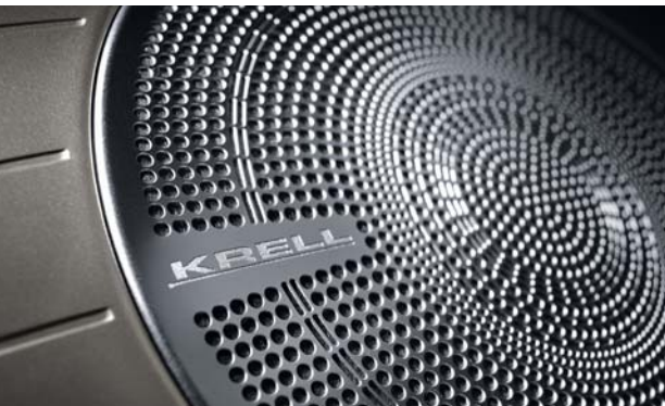
KRELL 프리미엄 사운드 시스템 (8스피커, 외장앰프) 미국 최상급 오디오 브랜드인 크렐 (KRELL) 프리미엄 사운드 시스템을 장착하여 8개의 스피커와 1개의 외장앰프를 통해 최상의 입체 사운드를 제공합니다.