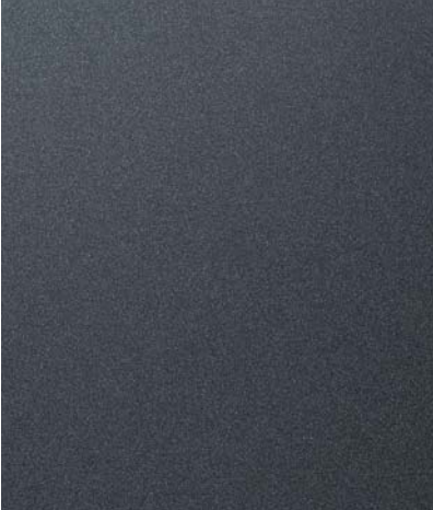
더스크 블루 (XB3)