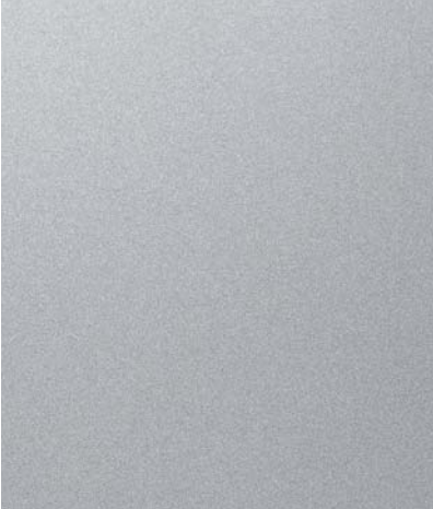
코쿤 실버 (V3S)