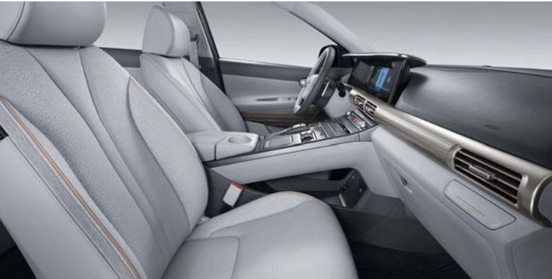
그레이 투톤 인테리어