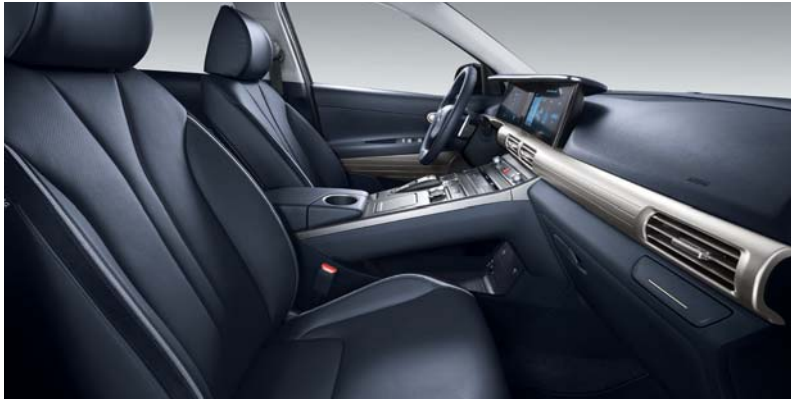
블루 원톤 인테리어