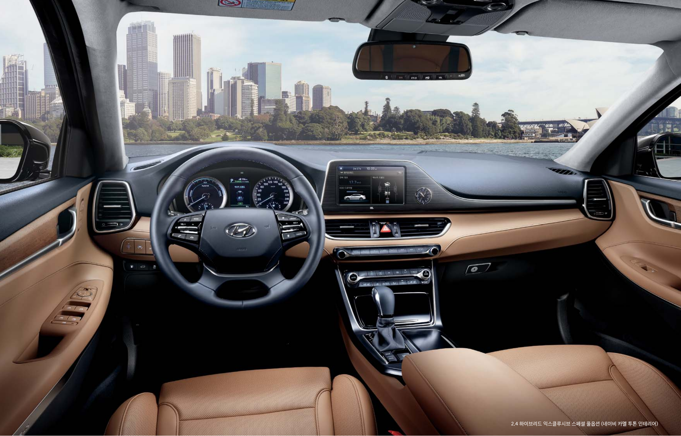
2.4 하이브리드 익스클루시브 스페셜 풀옵션 (네이비 카멜 투톤 인테리어)