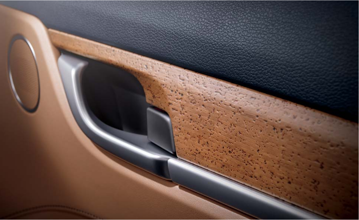
하이브리드 전용 리얼 코르크 가니쉬

코르크 리얼우드의 친환경 도어트림 가니쉬를 세계 최초로 적용하였으며, 시인성이 우수한 클러스터는 최적화된 하이브리드 시스템 정보를 직관적으로 표현합니다. 기하학적이고 세련된 느낌의 17인치 에어로 다이내믹 휠은 공기 저항을 최소화 합니다.