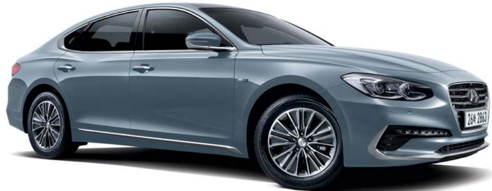
2.4 하이브리드 엑스클루시브 (하버 시티)