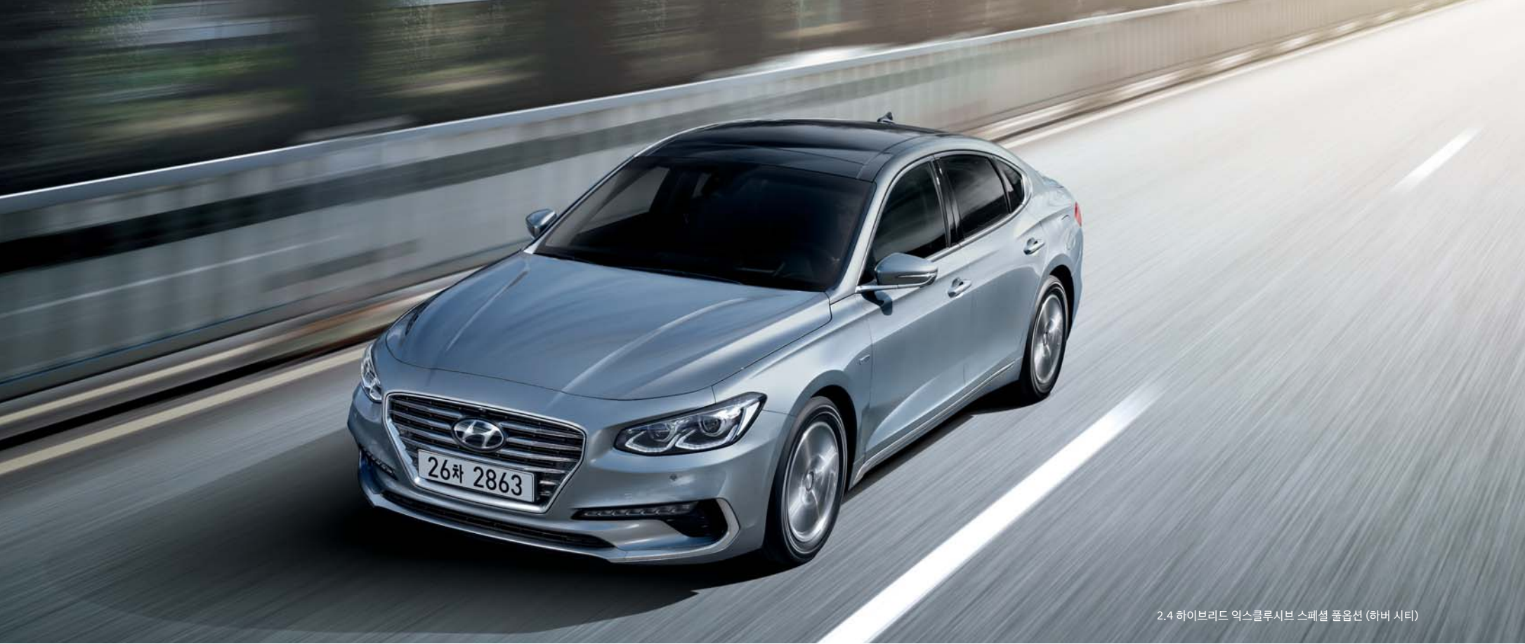
2.4 하이브리드 엑스클루시브 스페셜 풀옵션 (하버 시티)