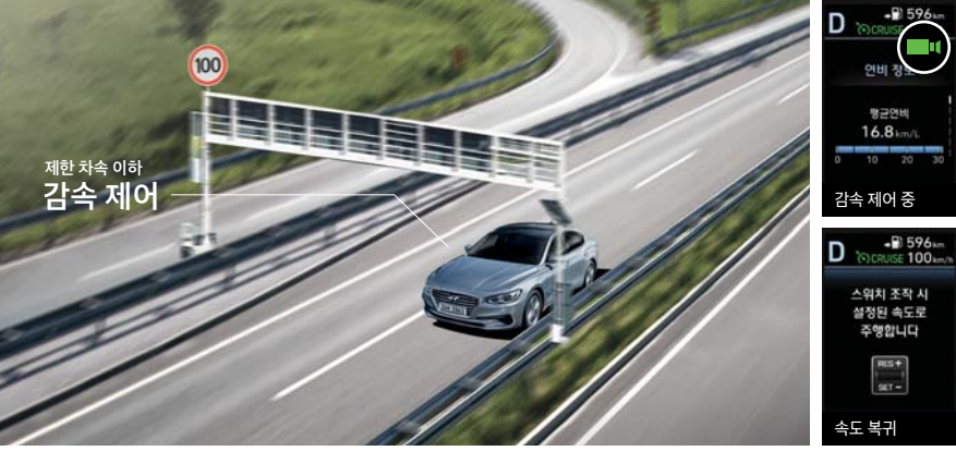
하이브리드 전용 콘텐츠

고속도로에서 크루즈 컨트롤 사용 시 내비게이션으로부터 수신하는 과속카메라 정보를 이용하여, 별도의 조작 없이 제한 차속 이하로 감속시켜주는 기능입니다.