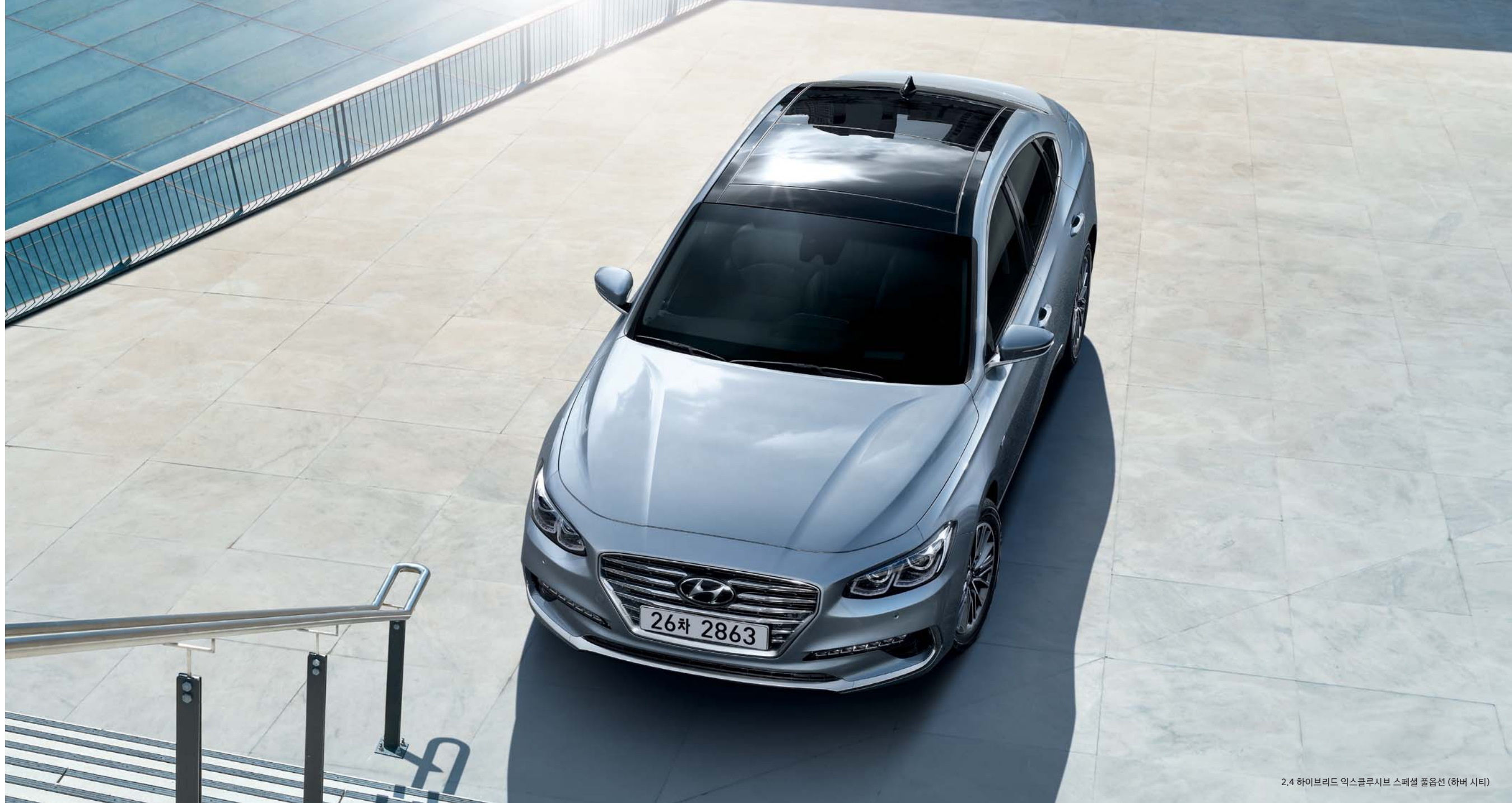
2.4 하이브리드 익스클루시브 스페셜 풀옵션 (하버 시티)