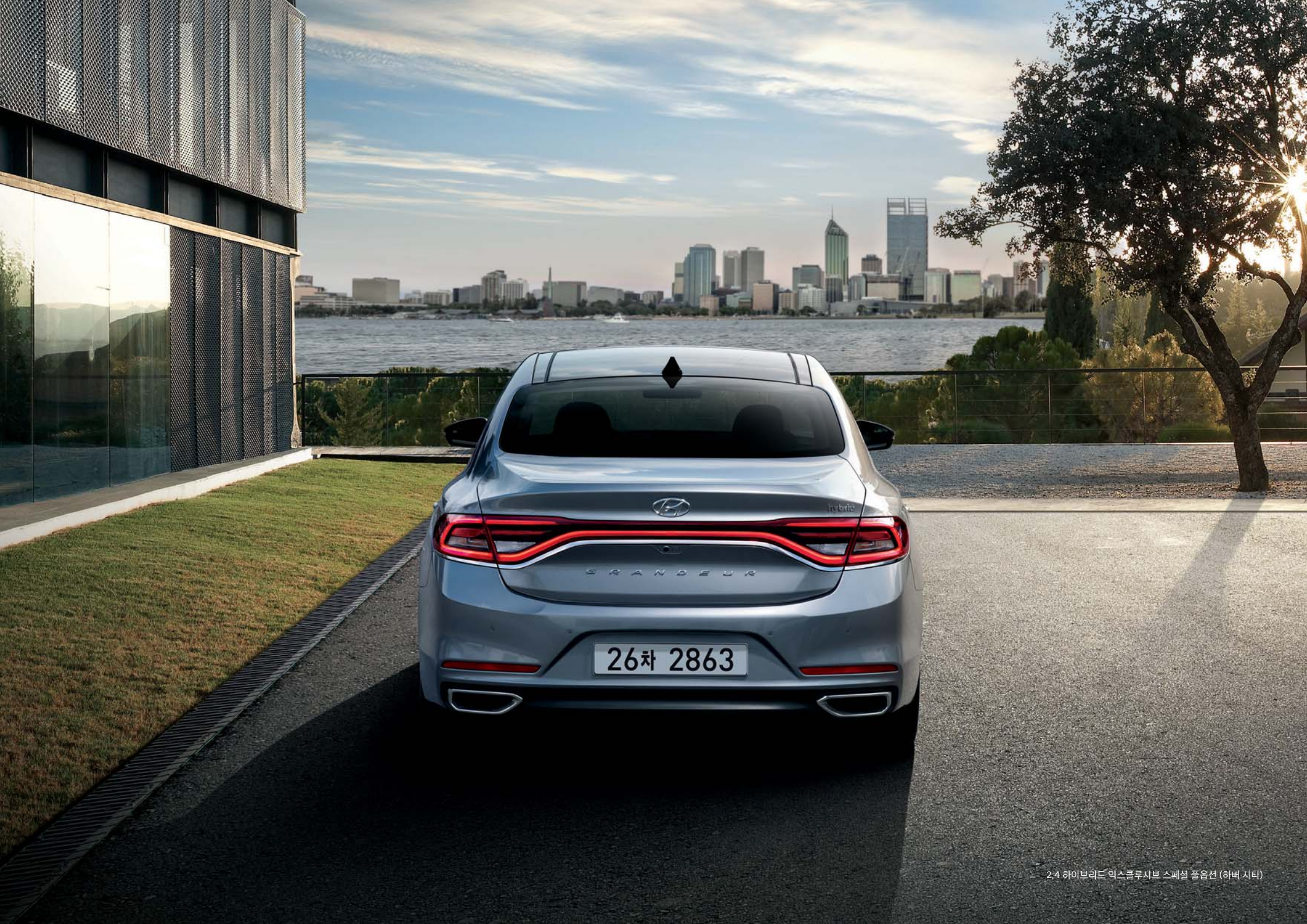
2.4 하이브리드 익스클루시브 스페셜 풀옵션 (하버 시티)

*기본 서비스(5년 무료 제공) : 원격제어, 안전보안, 차량관리, 길안내 *유료 부가 서비스 : 컨시어지 (9,900원/월) *기본 서비스 무료 제공 기간 만료 후 고객 동의를 거쳐 유료로 제공 (11,000원/월) *자세한 사항은 1899-0606 또는 블루링크 홈페이지(bluelink.hyundai.com)를 확인하시기 바랍니다.