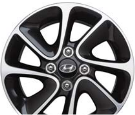
Aluminio de 14"