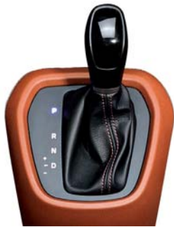
Transmisión automática de 4 velocidades.