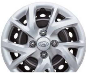
Acero de 14"