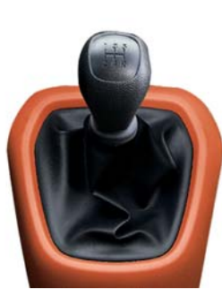
Transmisión manual de 6 velocidades.