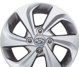
Aluminio de 14"

• Cinturón de seguridad ajustable en altura.