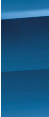
Azul Marino Hatchback solamente