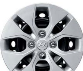
Acero de 14"