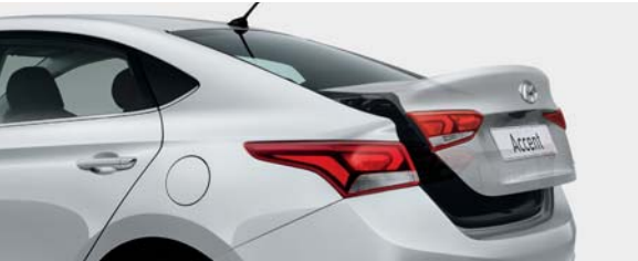
• Cajuela con apertura inteligente.