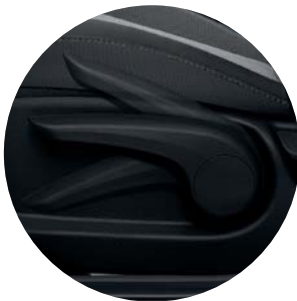
Asiento del conductor ajustable.

Hyundai Accent demuestra que un vehículo cómodo y espacioso, no tiene que ser grande y pesado. Además el color de la cabina, sus texturas y su forma, le imprimen un atractivo único.