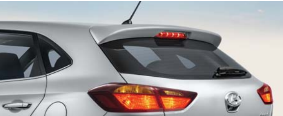
• Spoiler trasero.