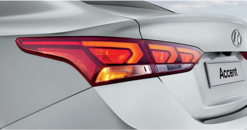
• Faros traseros tipo LED.