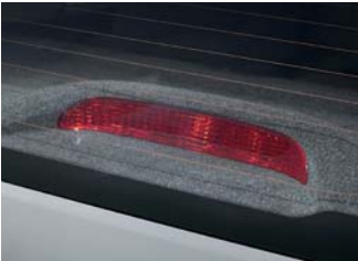
• Luz de freno alta.