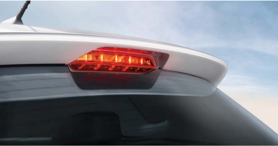
• Luz de freno alta.