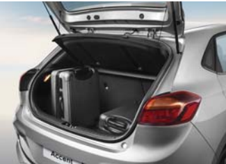
• Cajuela con cubierta.