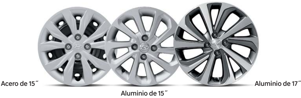
Acero de 15"