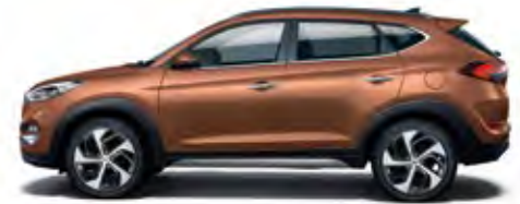
Intense Copper Metallic 1