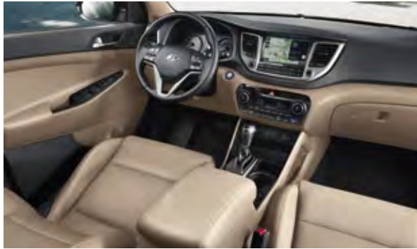
Beige + Schwarz, Leder 2 Beige