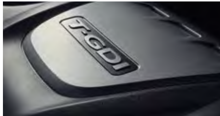
1.6 Turbo GDI.

Der Hyundai Tucson bietet eine Vielzahl von innovativen Technologien zur Verbesserung der Leistung, des Fahrverhaltens und des Fahrkomforts. Angeboten werden drei Dieselmotoren und zwei Benzinern mit einer Leistung zwischen 116 und 185 PS. Sie haben die Wahl zwischen einem Sechs-Gang-Schalt- oder Automatikgetriebe und einem Sieben-Gang-Doppelkupplungsgetriebe (DCT). Der zuschaltbare Allrad-Antrieb und die weiterentwickelte Traktionskontrolle (ATCC) halten Sie auch in ganz scharfen Kurven in der Spur.