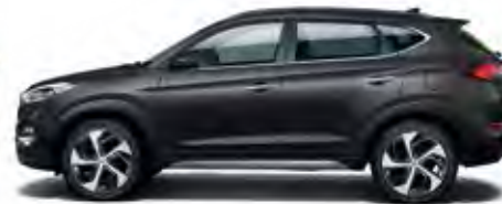
Phantom Black Mineraleffekt 1

Kraftstoffverbrauch kombiniert: 7,6–4,6 l/100 km; CO 2 -Emission kombiniert: 177–119 g/km; Effizienzklasse D–A.