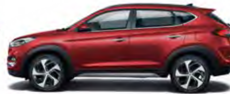
Fiery Red Mineraleffekt 1