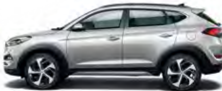
Platinum Silver Metallic 1