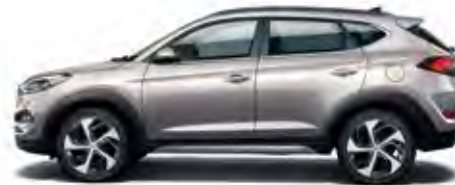
White Sand Metallic 1