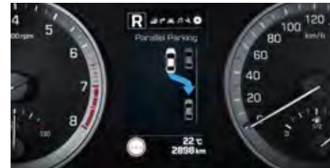
Automatischer Einparkassistent. 1