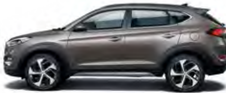
Moon Rock Mineraleffekt 1