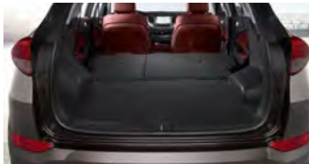
Bis zu 1.503 Liter Laderaum.