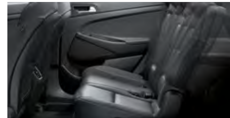
Beheizbare Rücksitze. 1