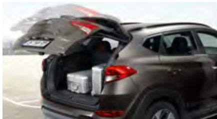
Automatische Heckklappe. 1

Es fällt nicht schwer, sich für den Hyundai Tucson zu begeistern. Wir haben auch dafür gesorgt, dass es einfach ist, mit ihm umzugehen. Neben dem außergewöhnlich geräumigen Innenraum verfügt er über einen der größten Laderäume in seinem Segment. Der Ladebereich ist über die große Heckklappe mit optionaler Heckklappenautomatik problemlos zugänglich. Für Flexibilität sorgen die 60 : 40 geteilten, umklappbaren Rücksitze. Und wenn Sie unterwegs sind, werden Sie die Vorzüge des Automatischen Einparkassistenten 1 und der LIVE Services 1 zu schätzen wissen.