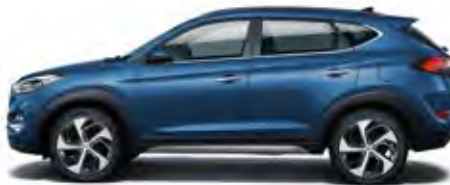
Stargazing Blue Mineraleffekt 1