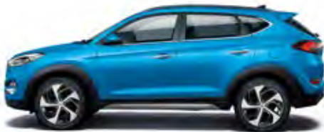
Ara Blue Metallic 1