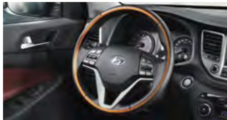
Beheizte Sitze und beheiztes Lenkrad. 1