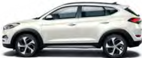
Polar White Uni

Der Hyundai Tucson ist in den verschiedensten Außenfarben und in Kombination mit drei Interieur-Farben erhältlich. In jedem Fall können Sie Ihrer Wahl mit Zusatzausstattungen und Zubehör eine noch persönlichere Note verleihen. Der Hyundai Händler in Ihrer Nähe wird Sie gern zu den möglichen Kombinationen beraten.