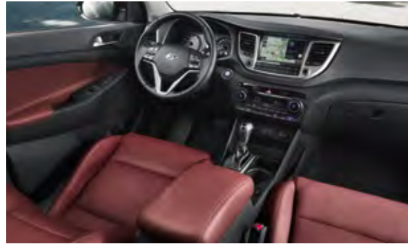
Weinrot + Schwarz, Leder 2 Weinrot