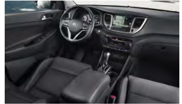
Schwarz, für Leder 2 oder Stoff erhältlich