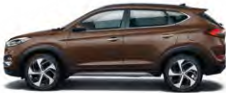
Mocca Brown Mineraleffekt 1