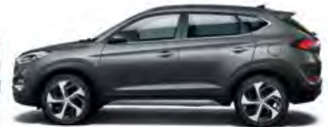
Micron Grey Mineraleffekt 1