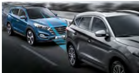
Autonomer Notbremsassistent. 1

Der Hyundai Tucson ist mit einer Vielzahl von aktiven wie passiven Sicherheitstechnologien erhältlich. Zu den Highlights gehört der Cross-Traffic-Assistent, der in Ausparksituationen bei eingeschränkter Sicht den rückwärtigen Bereich des Fahrzeugs per Radar in einem 180-Grad-Winkel überwacht. Nähert sich ein Fahrzeug, werden akustische und optische Warnsignale ausgelöst.