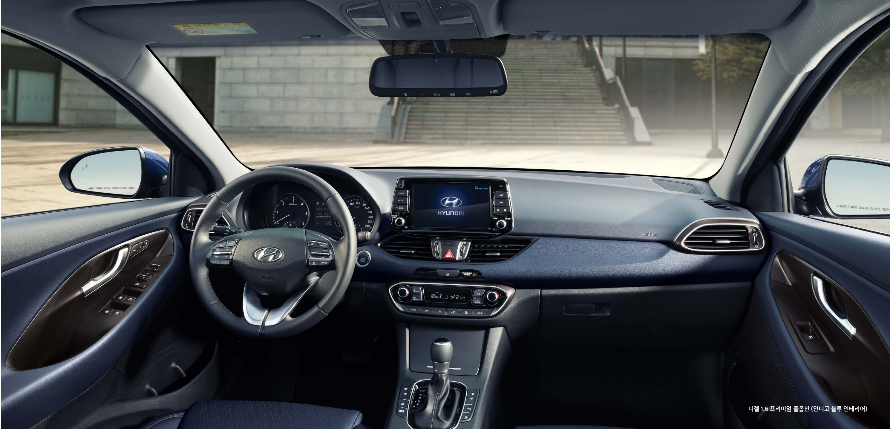
디젤 1.6 프리미엄 풀옵션 (인디고 블루 인테리어)