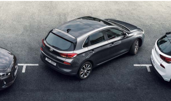
전/후방 주차 보조 시스템