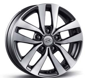
16인치 알루미늄 휠