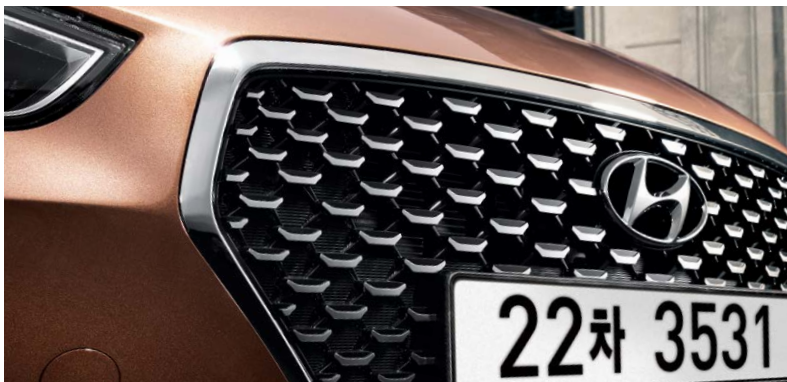
Full LED 헤드램프 고급형 라디에이터 그릴(하트스탬핑)