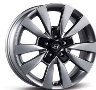
18인치 알루미늄 휠