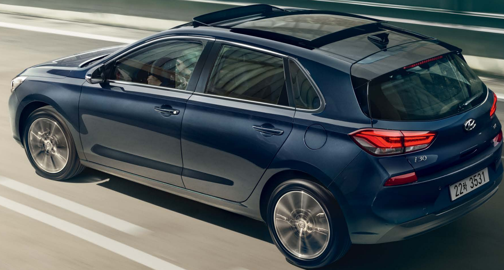
가솔린 1.4 터보 프리미엄 풀옵션 (스타게이징 블루)