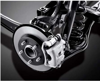
후륜 멀티링크 서스펜션

후륜 멀티링크 서스펜션, 대용량 브레이크, 7단 DCT, 통합주행모드로 향상된 주행성능을 통해 운전의 재미를 높여 드립니다.