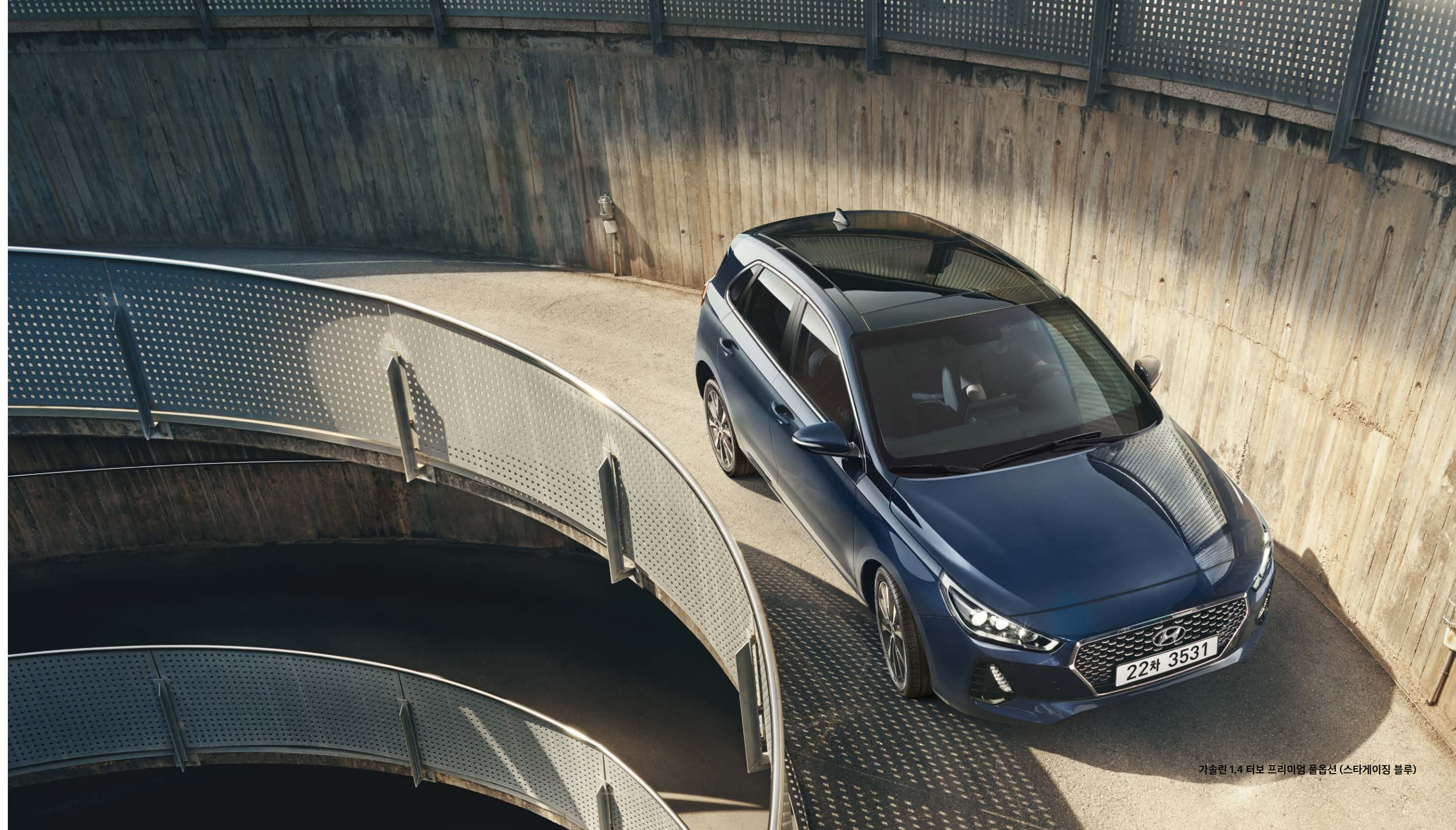
가솔린 1.4 터보 프리미엄 풀옵션 (스타게이징 블루)