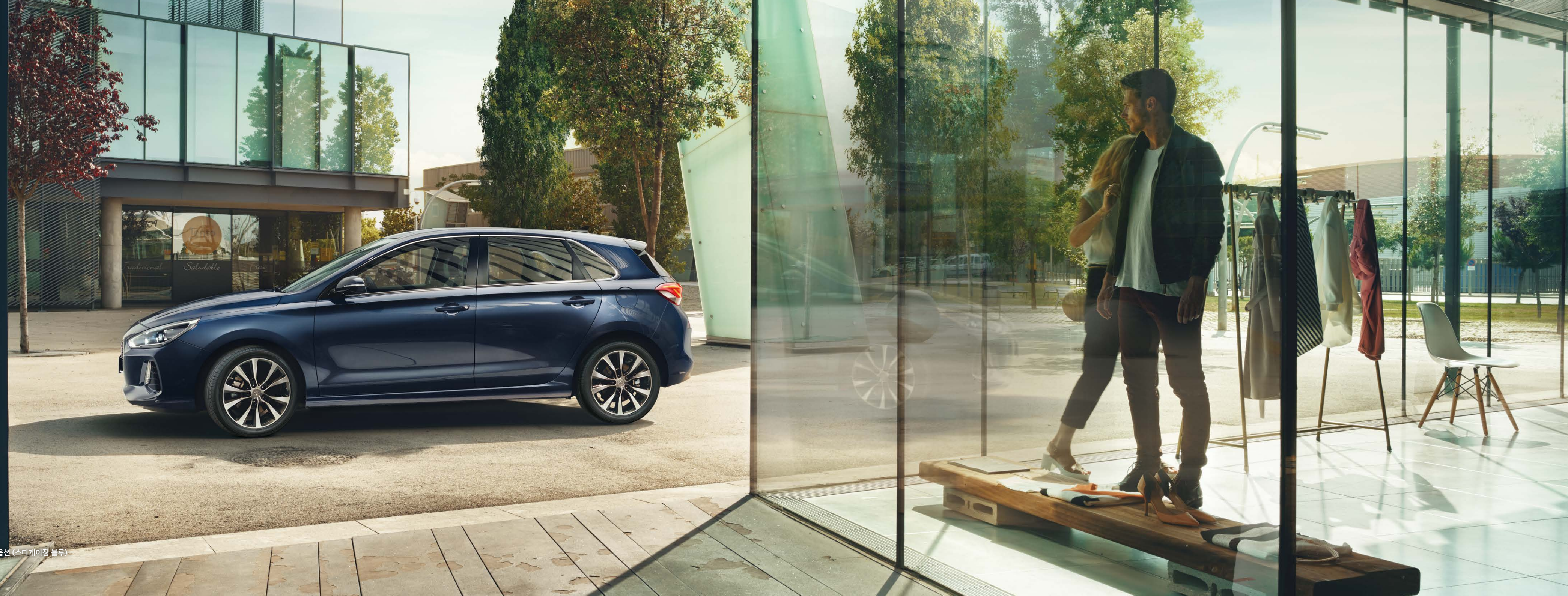
가솔린 1.4 터보 프리미엄 풀옵션 (스타게이징 블루)