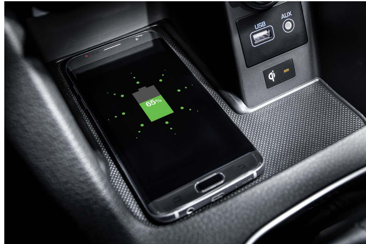
스마트폰 무선충전 시스템

플로팅 타입 디스플레이가 적용되어 혁신적인 이미지를 전달하는 새로운 i30는 스마트폰 무선충전 시스템과 전자식 파킹 브레이크 등의 실용성, 2열 6:4 폴딩의 활용성, 시동 OFF시에도 스마트키를 이용해 열려있는 윈도우를 닫을 수 있는 리모트 윈도우 컨트롤의 편의성을 통해 진보된 해치백의 가치를 전달해 드립니다.