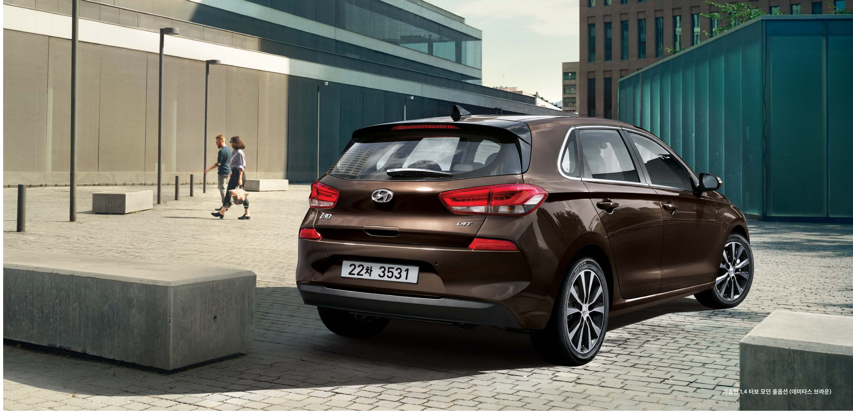
가솔린 1.4 터보 모던 풀옵션 (데미타스 브라운)