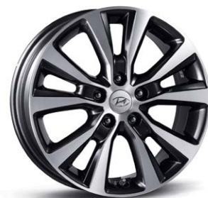
17인치 알루미늄 휠