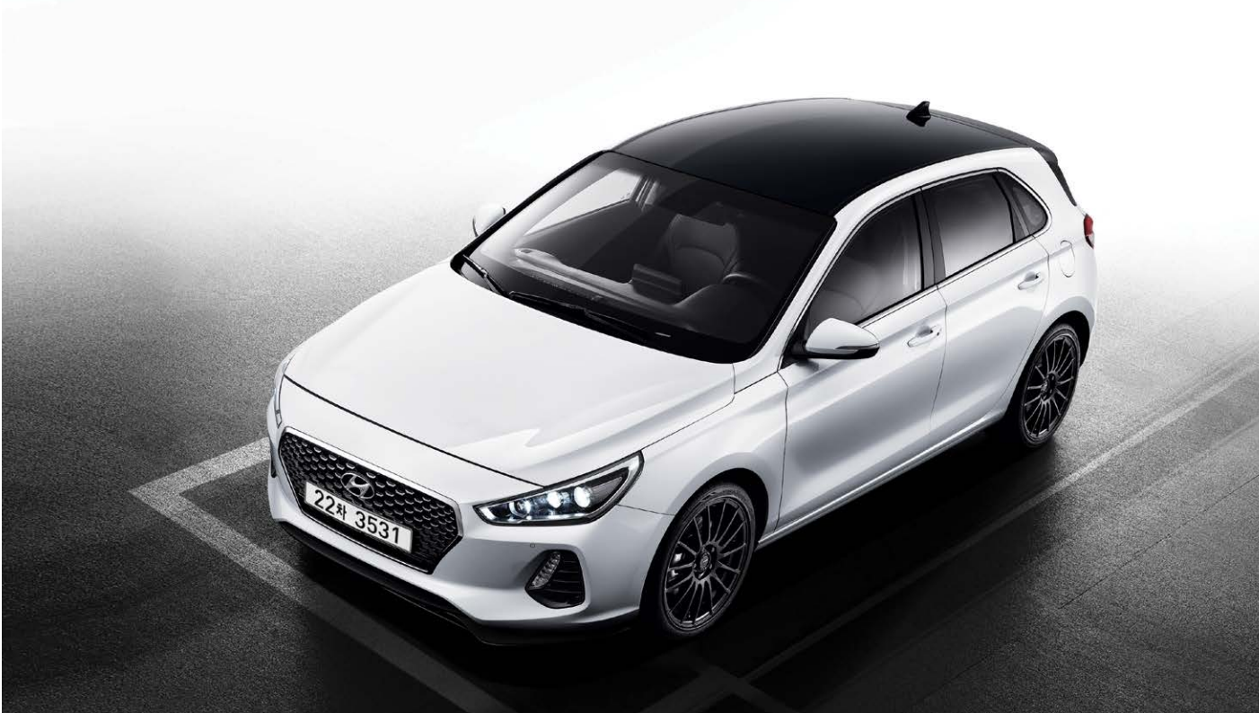
18인치 RAYS 휠