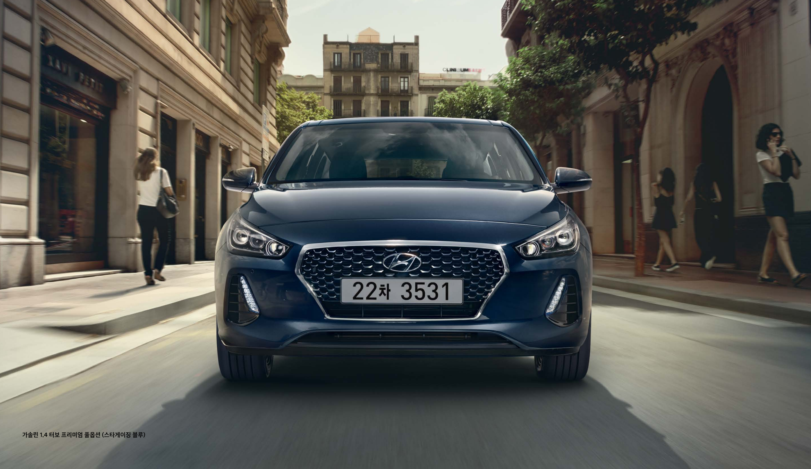
가솔린 1.4 터보 프리미엄 풀옵션 (스타게이징 블루)