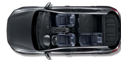
2열 6:4 폴딩 시