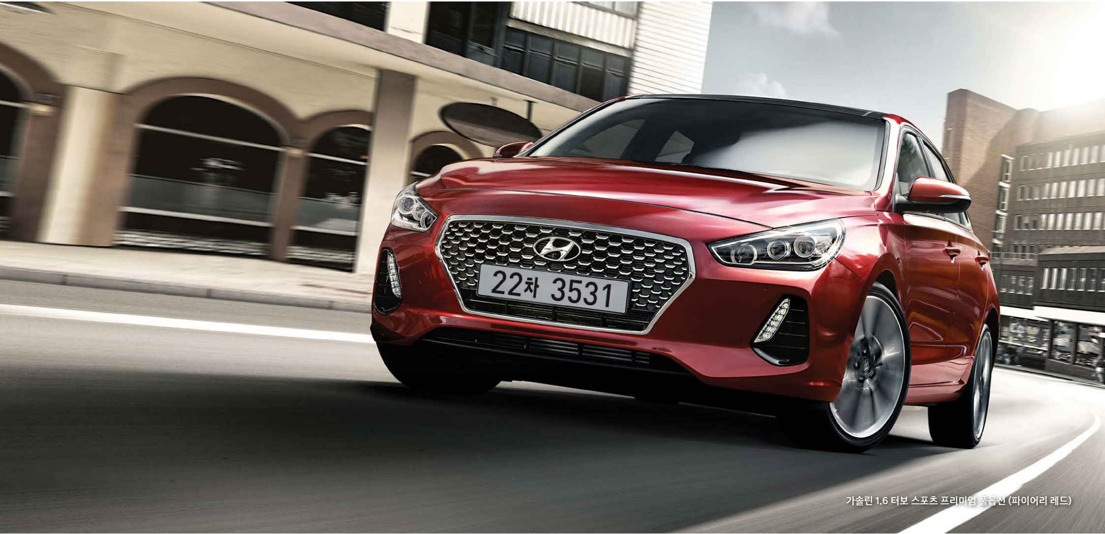
가솔린 1.6 터보 스포츠 프리미엄 풀옵션 (파이어리 레드)