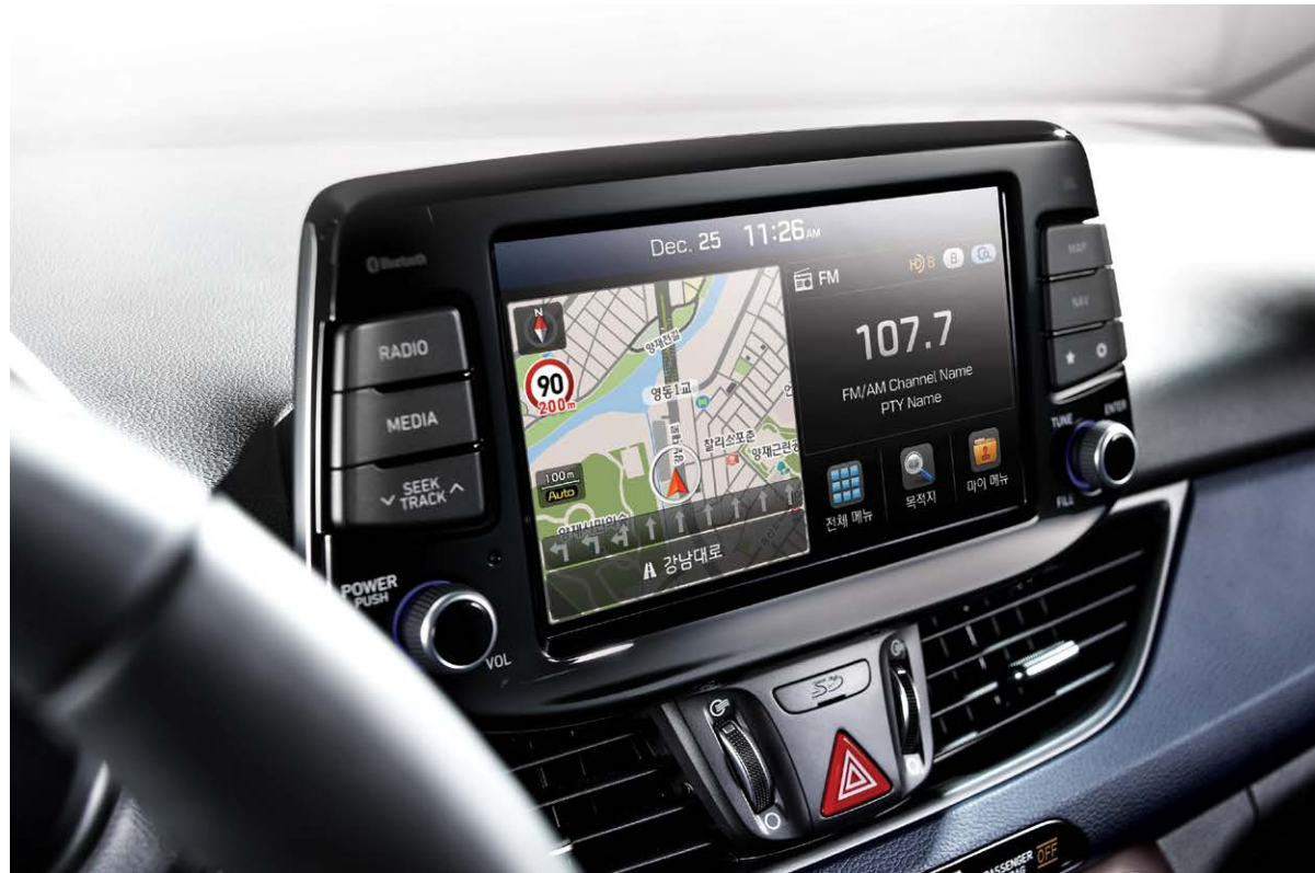
플로팅 타입 디스플레이