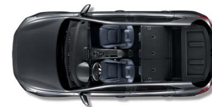
2열 전체 폴딩 시