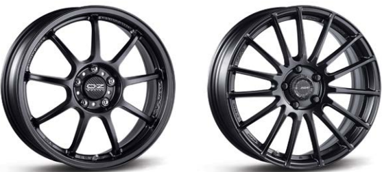
18인치 OZ 휠