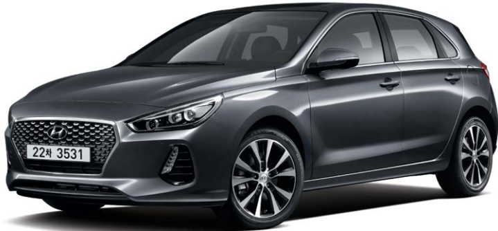
가솔린 1.4 터보 프리미엄 풀옵션 (아이언 그레이)

프리미엄 트림은 전용 인테리어 컬러와 고급 사양들로 편의성을 높인 모델입니다.