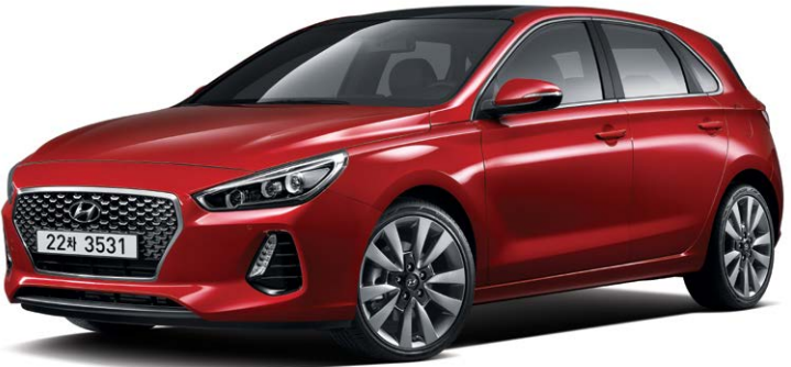
가솔린 1.6 터보 스포츠 프리미엄 풀옵션 (파이어리 레드)

스포츠 트림은 강렬한 컬러 포인트와 스포티한 사양들로 퍼포먼스를 강조한 모델입니다.