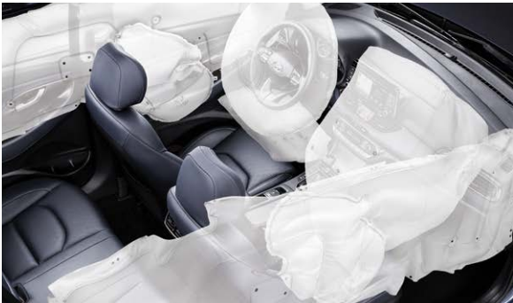
7에어백 시스템(앞좌석 어드밴스드, 운전석 무릎, 앞좌석 사이드, 전복대응 커튼)

*초고장력강 : Advanced High Strength Steels 분류 기준