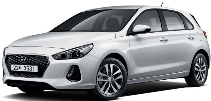
가솔린 1.4 터보 스마트 (폴라 화이트)

스마트 트림은 i30의 핵심 디자인 요소와 필수 편의 사양으로 구성된 기본기에 충실한 모델입니다.