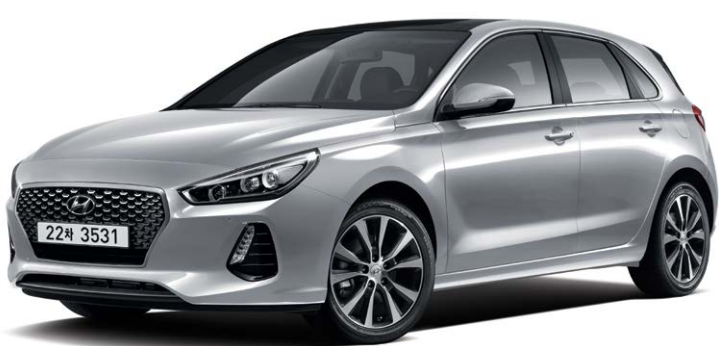
디젤 1.6 모던 풀옵선 (플래티넘 실버)

모던 트림은 디자인 완성도를 높인 사양으로 i30의 다이내믹함을 시각적으로 강화한 모델입니다.