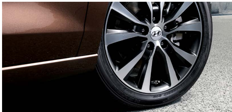
LED 리어 콤비램프(제동등, 후미등 적용) 17인치 알루미늄 휠 & 타이어

용광로에서 녹아내리는 쇳물의 웅장한 흐름과 우리 도자기의 우아한 곡선을 표현한 캐스캐이딩 라디에이터 그릴이 현대자동차 최초로 적용되었습니다.