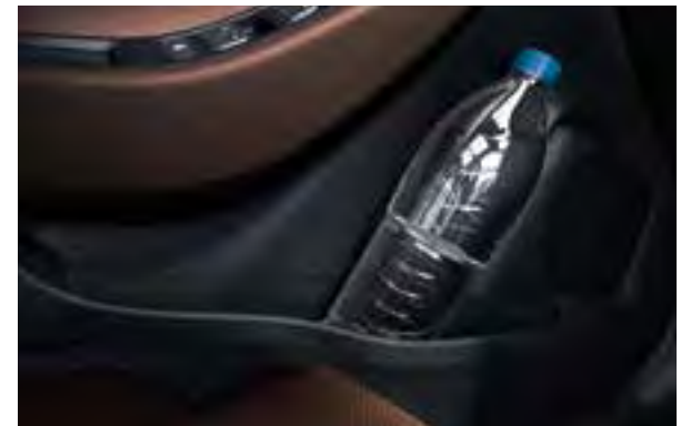
Flaschenhalter in den Türen. In den Flaschenhaltern in den Vordertüren können bis zu 1,5-Liter-Flaschen und in den Hecktüren 1-Liter-Flaschen sicher untergebracht werden.