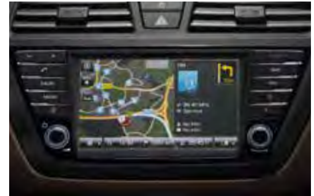
Neues Navigationssystem mit LIVE® Services 1 . Es beinhaltet ein kostenloses 7-Jahres-Abonnement der LIVE Services und liefert genaue Informationen über Verkehr, Wetter und lokale Einrichtungen auf einem 7-Zoll-Touchscreen.