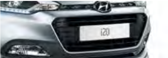
Kühlergrill bei 1.0 T-GDI