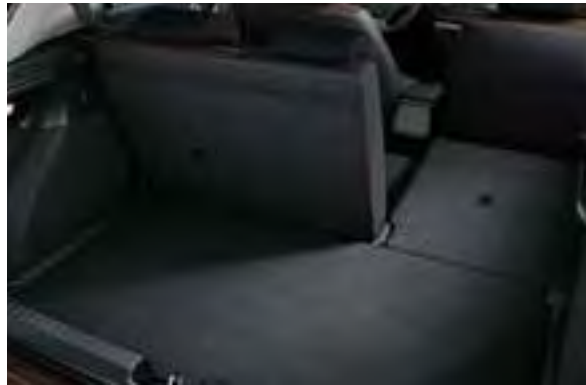
Geteilte Rücksitzlehne. Die Rücksitzlehnen lassen sich im Verhältnis 60:40 umklappen, sodass ein variabler zusätzlicher Laderaum entsteht.

Was der Tag auch für Sie bereithalten mag – mit Ihrem Hyundai i20 sind Sie für alles gerüstet. Durch das Umklappen der Rücklehnen lässt sich das schon sehr geräumige Kofferraumvolumen von 326 Litern auf 1.042 Liter erweitern. Die Bodenplatte 1 kann nach Bedarf nach oben oder unten verstellt werden, und es bieten sich an geeigneten Stellen im gesamten Innenraum zahlreiche Möglichkeiten an, Gegenstände zu verstauen.