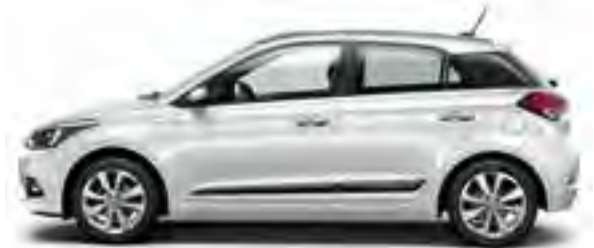
Polar White Uni