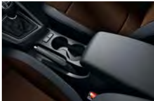
Getränkehalter. Bequem zwischen den Vordersitzen angebracht.