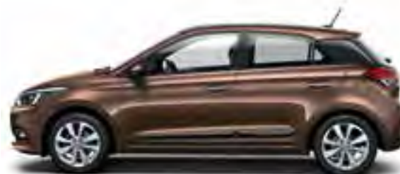
Iced Coffee Metallic