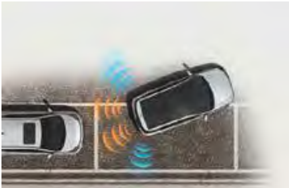
Einparkhilfe hinten 1 . Die Einparksensoren erleichtern das Einparken auf engem Raum.

Viele Technologien heben den Komfort des Hyundai i20. Nur ein Beispiel: das statische Kurvenlicht, um die Ausleuchtung in Kurven zu verbessern. Wird das Lenkrad um mehr als 25 Grad gedreht, leuchtet das Scheinwerferlicht die Fahrbahnseite zusätzlich aus. Sie werden überrascht sein, wie viele Funktionen und Ausstattungen der Hyundai i20 bietet, die Sie sonst kaum in dieser Fahrzeugklasse finden.