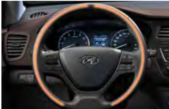
Beheiztes Lenkrad 1 . Ein wohliges Gefühl beim Start an kalten Wintertagen.

Im gesamten Innenraum finden sich sorgfältig ausgewählte Stoffe und Materialien, die Sie mit ihrem perfekten Sitz und der hohen Qualität beeindrucken werden. Das so entstandene Ambiente in Kombination mit der hochwertigen Ausstattung macht den Hyundai i20 herausragend in seiner Klasse. Zu den Highlights gehören Panorama-Glas-Schiebedach 1 , Ledersitzbezüge 1 , ein beheiztes Lenkrad 1 und ein 7-Zoll-Navigationssystem mit integrierter Rückfahrkamera 1 . Je nach Modell sind die Ausstattungsmerkmale serienmäßig oder als Zusatzausstattung erhältlich.