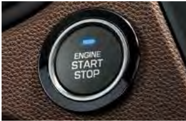
Start-/Stopp-Knopf 1 Ohne Schlüssel starten, wenn Sie den Smart Key bei sich tragen.