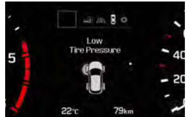
Reifendruckkontrollsystem (TPMS). Stellt Druckverlust in den einzelnen Reifen fest und zeigt ihn an.