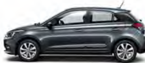
Star Dust Metallic