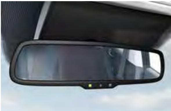
Automatisch abblendender Innenspiegel 1 . Bei Dunkelheit wird ein Blenden durch andere Fahrer automatisch verhindert.