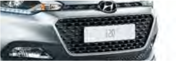
Kühlergrill, ab STYLE mit Chromumrandung