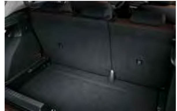
Variabler Gepäckraumboden 1 . Der Gepäckraumboden des Kofferraums kann auf zwei unterschiedliche Höhen eingestellt werden, um je nach Bedarf entweder eine glatte Ladefläche (bei umgeklappten Rücklehnen) oder einen tieferen Laderaum zu erhalten.