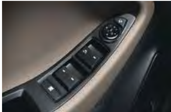
Elektrische Fensterheber vorn und hinten 1 . Alle Türfenster können per Knopfdruck gehoben und gesenkt werden. Das Fahrerfenster ist mit einer Tippfunktion für das automatische Heben und Senken ausgestattet.