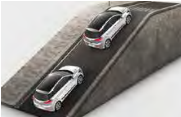
Berganfahrassistent (HSA). Verhindert das unbeabsichtigte Zurückrollen beim Anfahren an Steigungen.