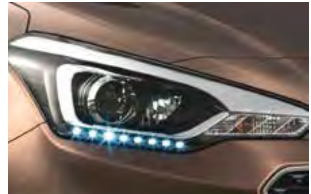
Hochleistungs-Projektionsscheinwerfer 1 . Kombiniert mit LED-Tagfahrlicht und statischem Kurvenlicht.