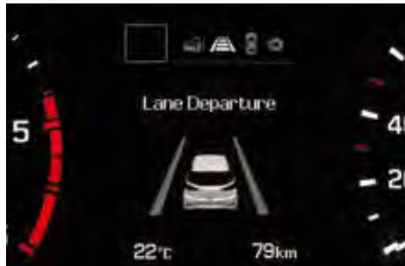
Spurhaltewarnsystem 1 . Gibt zuerst ein optisches, dann ein akustisches Warnsignal beim Spurwechsel ohne Blinkerbetätigung.