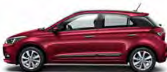
Red Passion Mineraleffekt