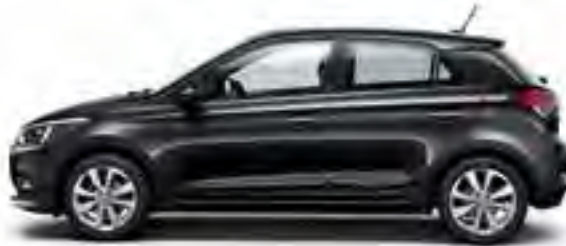
Phantom Black Mineraleffekt

So individuell wie Ihr Geschmack und Ihre Vorlieben, so vielfältig ist die Auswahl an Lackierungen in Kombination mit vier verschiedenen Interieur-Farbvarianten. Verleihen Sie Ihrem Hyundai i20 mit Sonderausstattung und -zubehör Ihre ganz persönliche Note. Ihr Hyundai Händler vor Ort hilft Ihnen und berät Sie gern zu den möglichen Kombinationen.