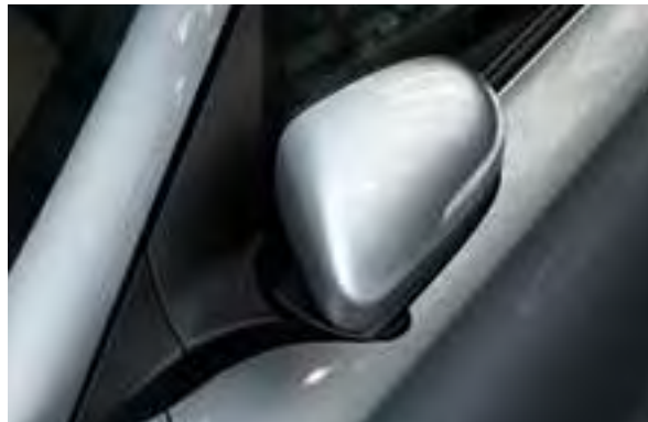
Elektrisch anklappbare Außenspiegel 1 . Die Außenspiegel können elektrisch zur Tür hin eingeklappt werden. Sehr nützlich, wenn es beim Parken einmal eng wird.