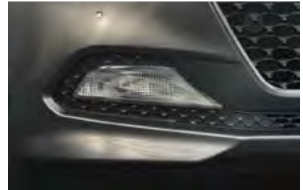
Nebelscheinwerfer 1 . Die zusätzlichen Nebelscheinwerfer erleichtern das Fahren bei dichtem Nebel und starkem Regen.