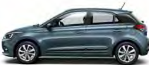
Aqua Sparkling Metallic