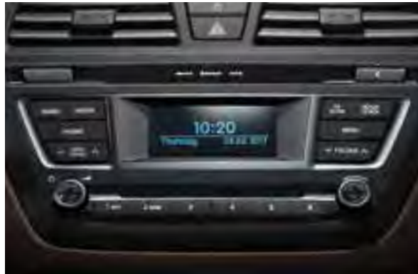
RDS-Radio sowie Bluetooth®. Das System ist auch bequem über die Tasten am Lenkrad zu bedienen 2 .