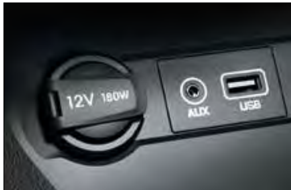
AUX-Anschluss und USB-Schnittstelle 1 . Bereit für Ihr Smartphone oder Ihren MP3-Player. Einfach einstecken und los.