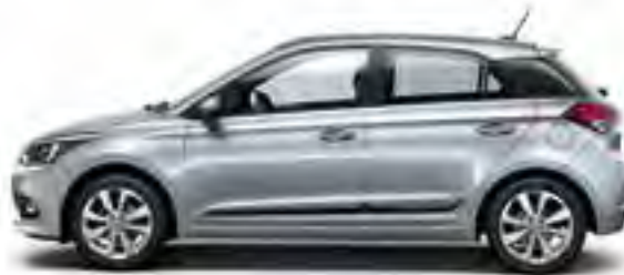
Sleek Silver Metallic