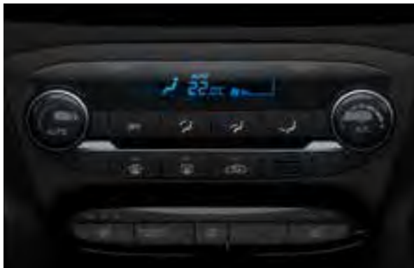
Klimaautomatik 1 . Wohlfühltemperatur einstellen, und die Automatik übernimmt den Rest. Diese bietet auch eine Kondensschutzfunktion, die das Beschlagen der Scheiben verhindert.