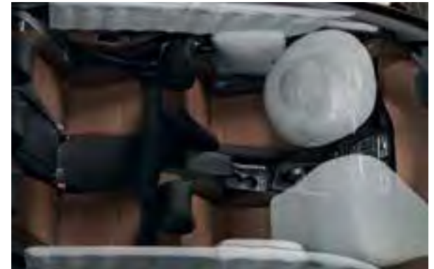
6 Airbags. Sicher geschützt durch zwei vordere, zwei seitliche und zwei Vorhang-Airbags für einen Rundumschutz.