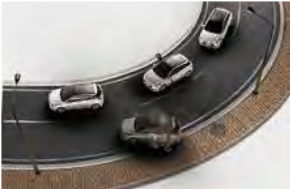
Elektronische Stabilitätskontrolle. Arbeitet automatisch in Kombination mit dem fahrdynamischen Stabilitätsmanagement, um besonders auf glatten Straßen die Haftung und Kontrolle zu gewährleisten.

Uns liegt viel daran, dass Sie im Hyundai i20 sicher fahren – daher wird im Fahrwerk und in der Karosseriestruktur hochfester Stahl eingesetzt. Neben Regen- 1 und Lichtsensoren 1 bietet der Hyundai i20 auch ein Spurhaltewarnsystem 1 und natürlich ein Reifendruckkontrollsystem.