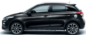
Negro Phantom (X5B)