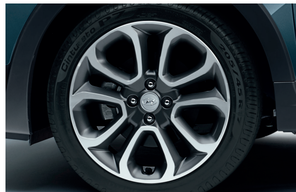
Llantas de aleación de 17". Exclusivas para el i20 Active, añaden un toque extra de aventura y dinamicidad al diseño.