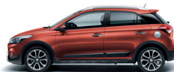
Naranja Tangerine (Y2A)