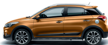
Naranja Mandarin (T5A)