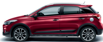
Rojo Passion (X2R)