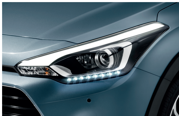
Faros dinámicos. Los eficientes faros bi-función incorporan unas llamativas luces LED de posición y elegantes luces LED de conducción diurna.

La vida es una aventura y es tan grande como tú la quieras hacer. El nuevo i20 Active es el nuevo crossover compacto de Hyundai que llega para enriquecer tu vida. Su aspecto robusto, pero atractivo, ha sido logrado dándole mayor altura y un llamativo diseño que incluye la parrilla hexagonal, nuevos paragolpes plateados, molduras en los pasos de rueda, llamativos faros antiniebla y unas nuevas llantas de aleación exclusivas de 17". El nuevo i20 Active abre un nuevo mundo lleno de posibilidades. ¿A qué estás esperando?