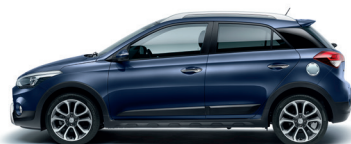
Azul Morning (X3U)

Todos somos diferentes y tenemos nuestros propios gustos y prioridades. El i20 Active está disponible en una amplia variedad de colores que refuerzan su dinamismo y espíritu aventurero. Puedes combinar a tu elección el color exterior e interior para que tu compañero de viaje luzca exactamente como quieres.