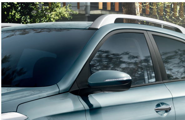
Barras del techo. Las robustas barras del techo facilitan el transporte de todo lo que necesitas. Son perfectos para transportar objetos de deporte como tu tabla de surf, tu bicicleta o tu kayak.