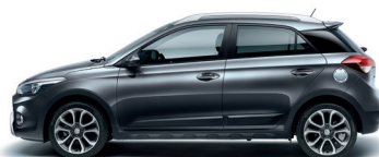
Gris Star Dust (V3G)