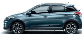
Azul Aqua (W3U)