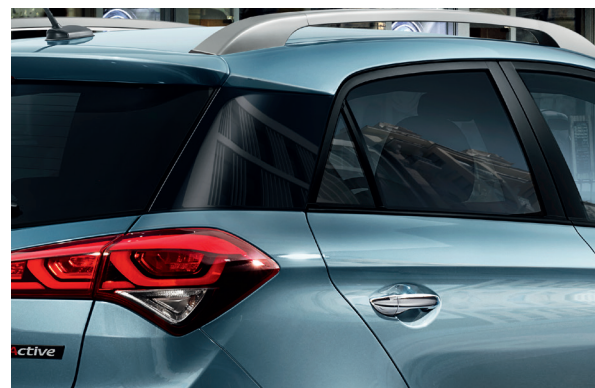
Pilar C en negro brillante. Este elegante añadido aporta la sensación de techo flotante al conjunto.