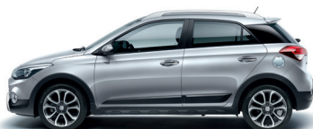
Plata Sleek (RYS)