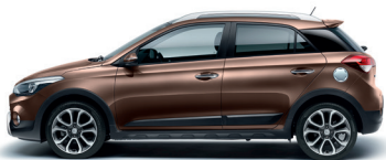
Marrón Cashmere (X9F)