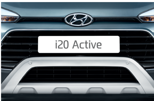
Paragolpes frontal y trasero. El robusto carácter crossover del i20 Active se acentúa por los atractivos paragolpes frontal y trasero en plateado.