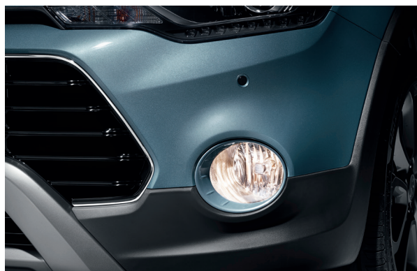
Faros antiniebla delanteros. Los llamativos faros antiniebla delanteros enfatizan el carácter atrevido del i20 Active e iluminan el camino hacia tu próxima aventura.