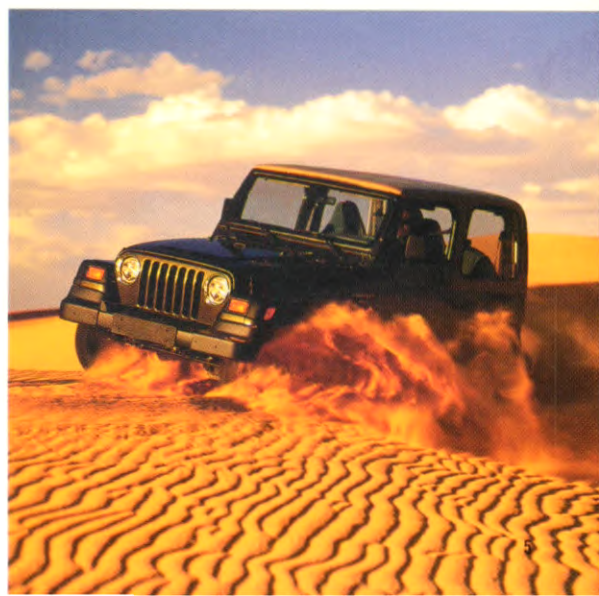
Der Jeep Wrangler verfügt über das zuschaltbare Allradsystem Command-Trac® (Abb.: Wrangler Sahara).