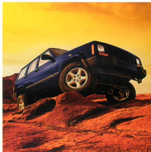
Quadra-Link-Radaufhängung und Schraubenfedern an der Vorderachse verleihen dem Jeep Cherokee exakte Richtungsstabilität und hohen Fahrkomfort (Leichtmetallräder Zubehör).

JEEP CHEROKEE LIMITED 4.0; INNENAUSSTATTUNG CAMEL.