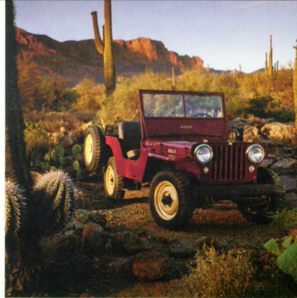
Mit dem „Ur“-Jeep (Willys CJ-2A, von 1947) wurde vor über 50 Jahren der Grundstein für die Geländewagenklasse gelegt.