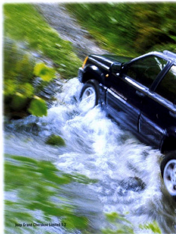
Jeep Grand Cherokee Limited 5.2

SOUVERÄNITÄT IST, wenn Hindernisse an Bedeutung verlieren.