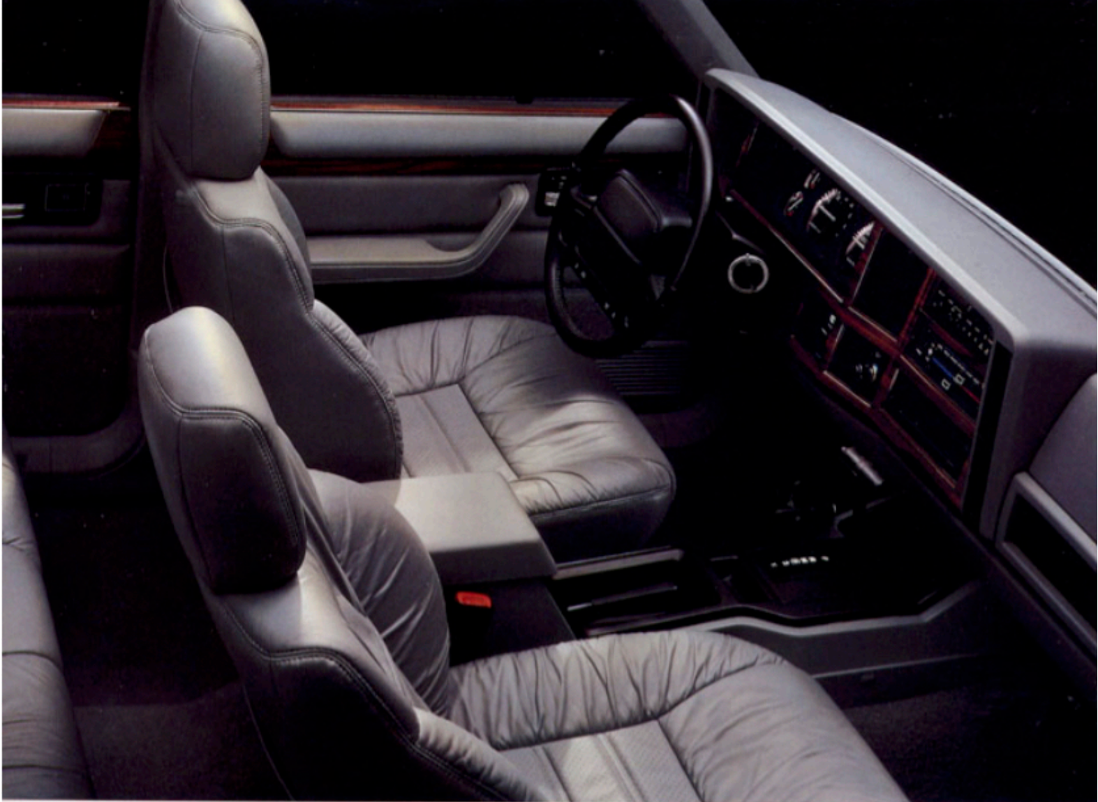
Beim Jeep Cherokee Limited ist die Lederausstattung der Sitze serienmäßig.

Der Jeep Cherokee Limited bietet serienmäßig noch mehr Komfort. Eine hochwertige Lederausstattung der Sitze, eine Klimaanlage sowie eine elektronische Geschwindigkeitsregelung entsprechen Ihren individuellen Wünschen nach kultiviertem Fahren.