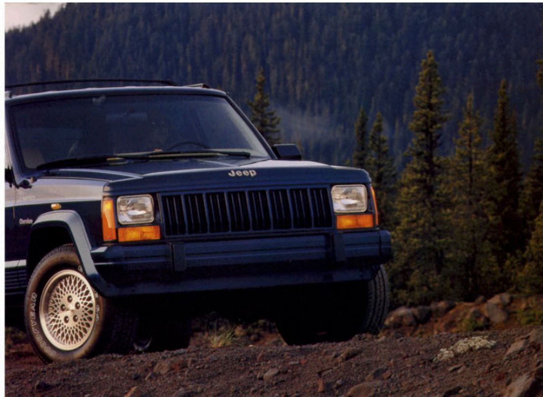
Jeep Cherokee Limited