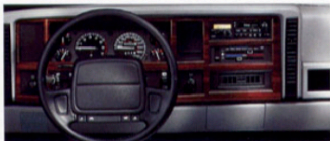
Klar und übersichtlich: das Armaturenbrett des Jeep Cherokee.

Viel Raum und Komfort. Im Jeep Cherokee genießen Sie serienmäßig, was das Fahren luxuriöser und angenehmer macht. Wie beispielsweise elektrische Fensterheber und elektrisch einstellbare Außenspiegel, getönte Scheiben, eine höhenverstellbare Lenksäule, Servolenkung sowie eine Fernbedienung für die Zentralverriegelung.