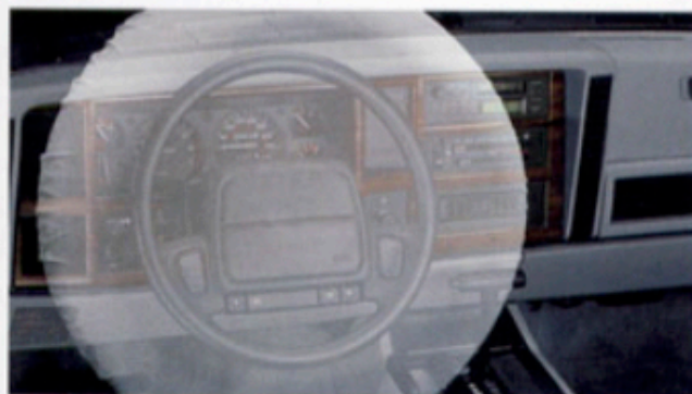
Serienmäßig in jedem Jeep Cherokee: der große US-Fahrerairbag.

Kein Komfort, sondern eine Selbstverständlichkeit bei jedem Jeep Cherokee: die Sicherheitsausstattung. Neben einem großen US-Airbag auf der Fahrerseite und Seitenaufprallschutz verfügt jeder Jeep Cherokee über ein Antiblockiersystem, das sowohl bei Hinterrad- als auch bei Allradantrieb wirksam ist.