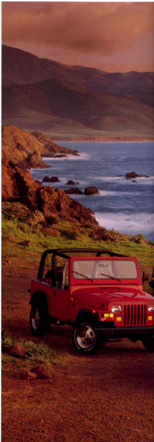
Jeep Wrangler, Jeep Cherokee und Jeep Grand Cherokee

Im Chrysler Technology Center betreuen Ingenieure, Designer, Finanz- und Marketingexperten die Entwicklung neuer Automobile von den ersten Entwürfen bis hin zur Serienreife – was letztlich das Qualitätsniveau der Fahrzeuge prägt. Qualität hat aber auch mit Verantwortung zu tun: beispielsweise wenn es um Ihre Sicherheit geht. So sind Fortschritt und Technik bei Chrysler kein Selbstzweck, sondern stehen immer im Dienst des Menschen.