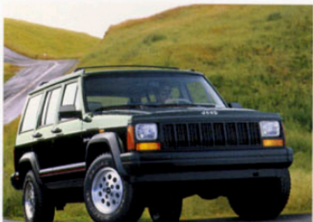
Jeep Cherokee LX 2.5 TD

Klassisch in der Form – sportlich in der Dynamik: der Jeep Cherokee. Mit seinem legendären Allradantrieb macht er Sie unabhängig – jederzeit und überall. Diese Vielseitigkeit macht den Cherokee zu einem besonderen Automobil: zu einem Fahrzeug mit Charakter. Eben ein echter Jeep.