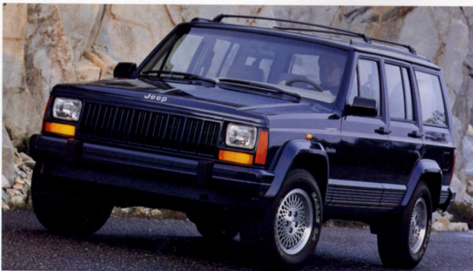
Jeep Cherokee Limited

Was immer Sie wünschen – der Jeep Cherokee wird Ihren individuellen Ansprüchen gerecht werden. Zum Beispiel mit dem seidenweich laufenden 4,0-l-Sechszylinder-Triebwerk. Oder Sie wählen den kräftigen 2,5-l-Vierzylinder-Turbodiesel, der eine spontane Kraftentfaltung bei zeitgemäßer Wirtschaftlichkeit verspricht.