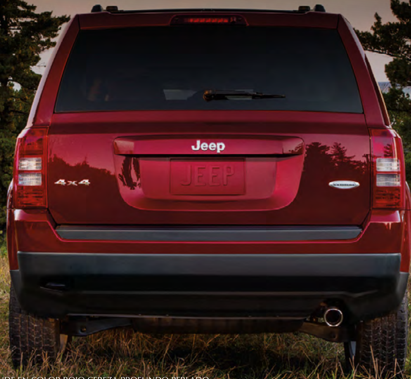
MODELO LATITUDE EN COLOR ROJO CEREZA PROFUNDO PERLADO

LAS PROFUNDAS RAÍCES DEL DISEÑO DE PATRIOT ESTÁN INSPIRADAS TANTO POR LOS PEQUEÑOS Y LINDOS DETALLES DE LA NATURALEZA COMO POR LAS MARCADAS Y GRANDES FORMACIONES QUE CREAN LA TOPOGRAFÍA. DESDE LA COMPLEJIDAD DE LAS PLANTAS MÁS PEQUEÑAS HASTA LAS COMPLEJIDADES DE LOS ECOSISTEMAS EFICIENTES, PATRIOT ESCUCHA LO QUE LE DICE LA TIERRA. PUEDE QUE ESTA SEA UNA DE LAS RAZONES POR LAS QUE PATRIOT SE SIENTE TAN CÓMODO SUBIENDO MONTAÑAS, SURCANDO BOSQUES Y ATRAVESANDO RIACHUELOS.