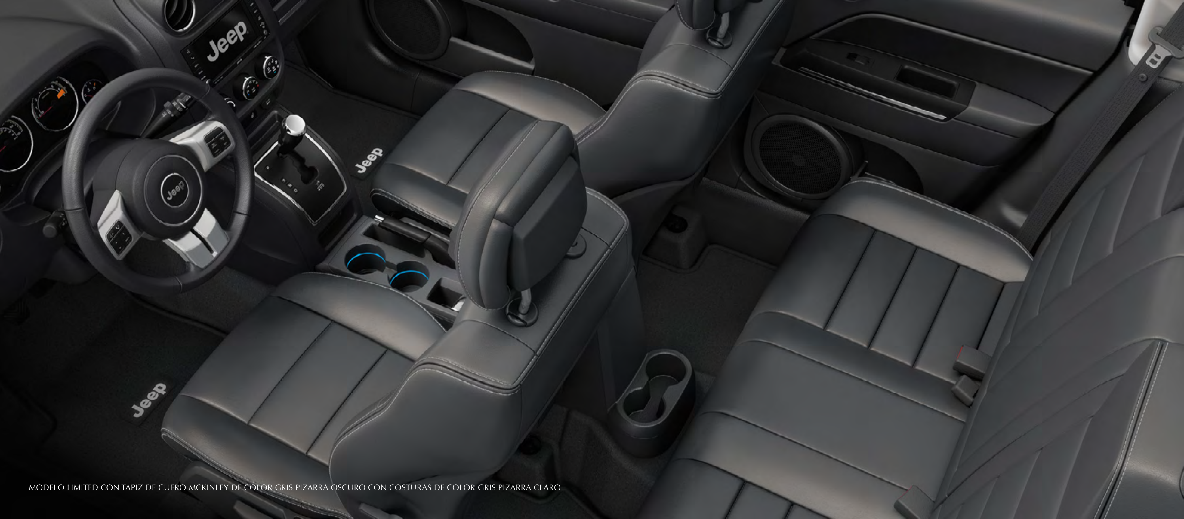
MODELO LIMITED CON TAPIZ DE CUERO MCKINLEY DE COLOR GRIS PIZARRA OSCURO CON COSTURAS DE COLOR GRIS PIZARRA CLARO