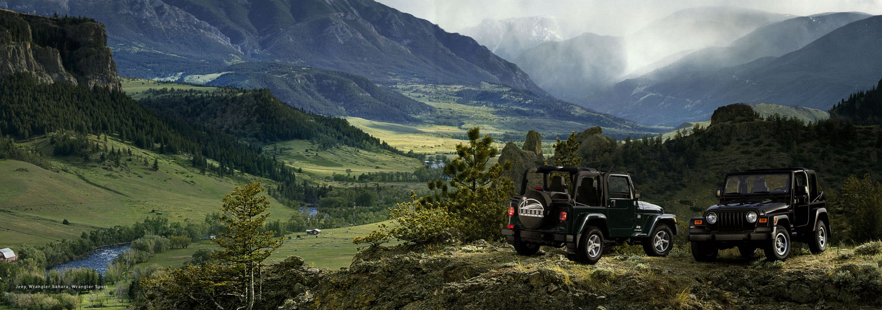
Jeep Wrangler Sahara, Wrangler Sport