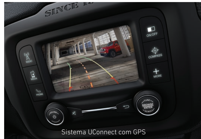
Sistema UConnect com GPS