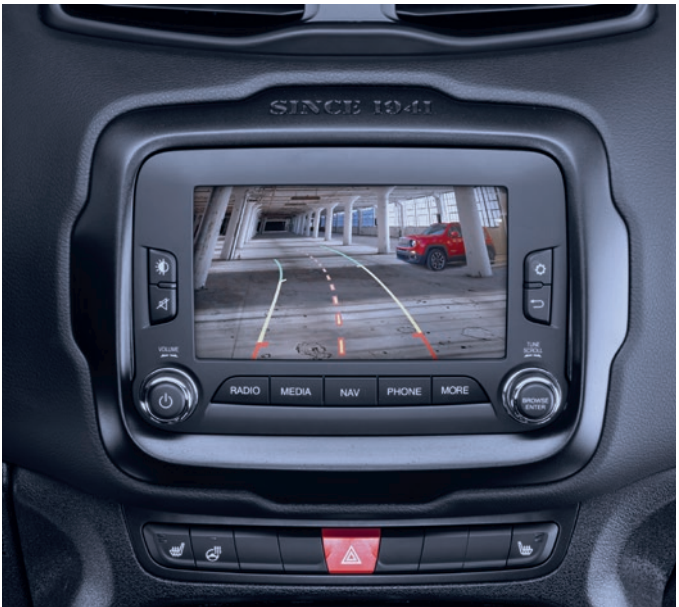
Câmera de marcha a ré