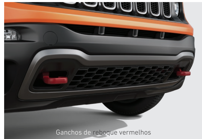
Ganchos de reboque vermelhos