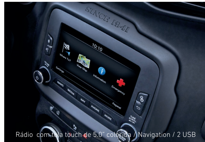
Rádio com tela touch de 5.0" colorida / Navigation / 2 USB