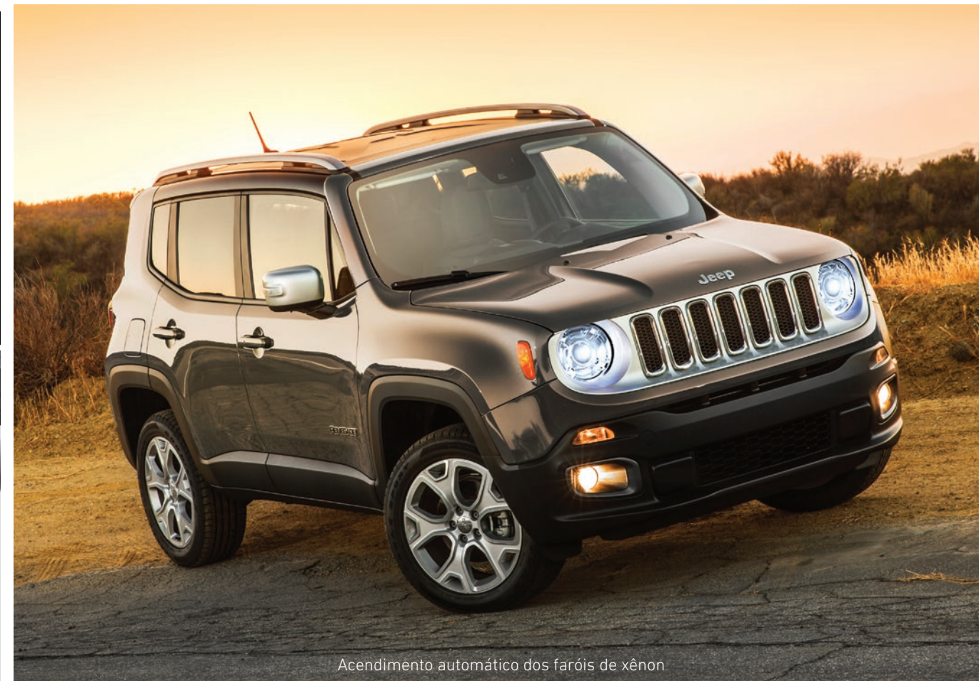
Acendimento automático dos faróis de xênon