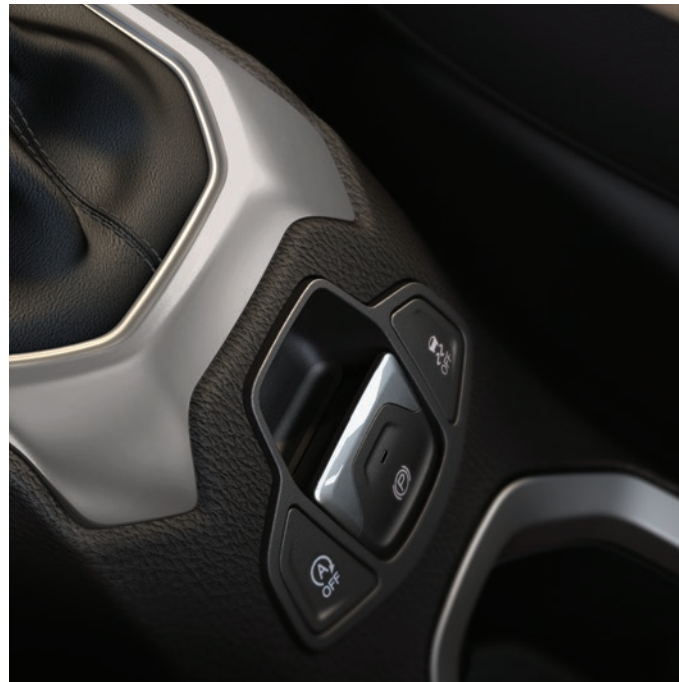
Freio de estacionamento elétrico