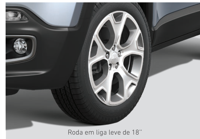
Roda em liga leve de 18"