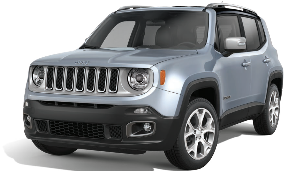
Motor 1.8L Flex de 139 cv (E) e câmbio manual de cinco marchas ou automático de seis

O Jeep Renegade dispõe de duas opções de motores, elaborados com uma arquitetura moderna e repleta de tecnologia, além de diversos recursos que proporcionam melhor performance e economia de combustível.