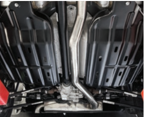
Protetor de tanque