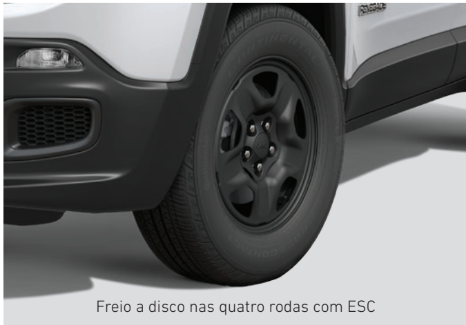
Freio a disco nas quatro rodas com ESC