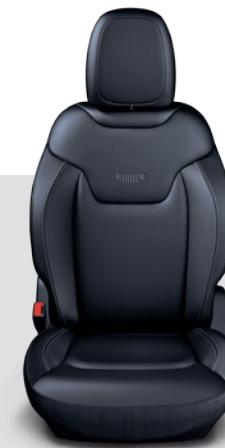
Longitude / Limited