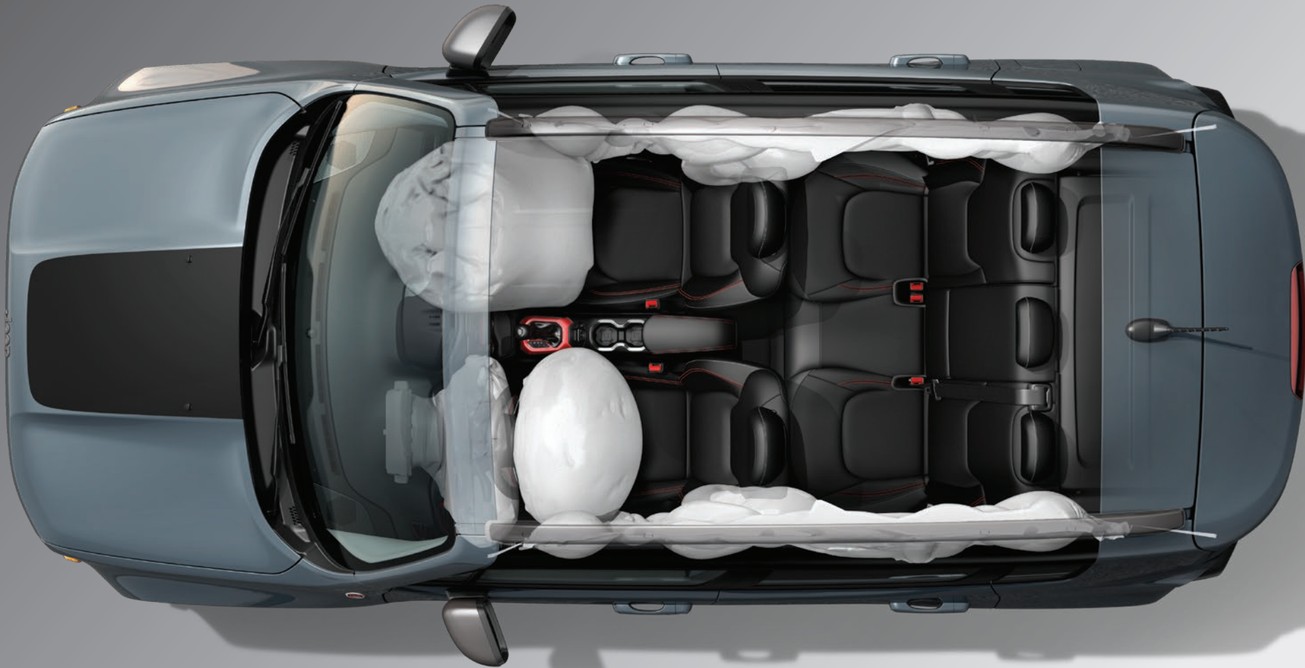
O único da categoria com sete airbags, incluindo os laterais de cortina, que vão até o assento traseiro, e o de joelhos do motorista

Por isso, são 60 itens para você dirigir com muito mais tranquilidade.