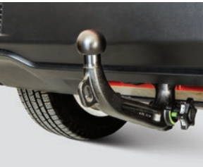
Engate para reboque