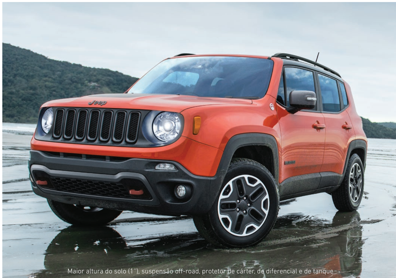
Maior altura do solo (1"), suspensão off-road, protetor de cárter, de diferencial e de tanque