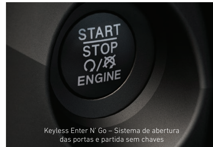
Keyless Enter N' Go – Sistema de abertura das portas e partida sem chaves