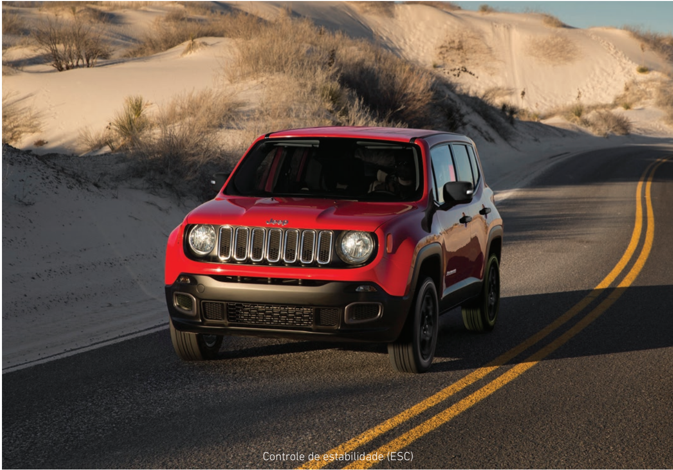
Controle de estabilidade (ESC)