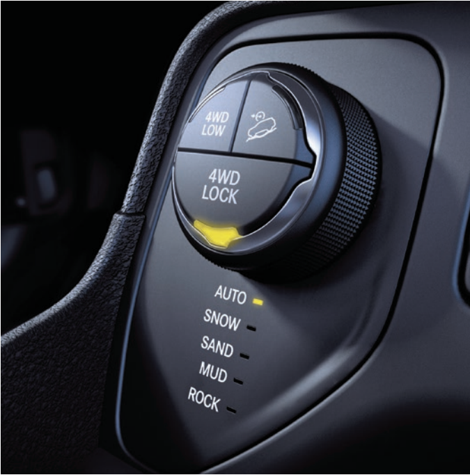
Sistema de tração 4x4 – Selec-Terrain