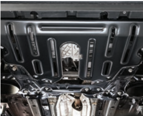
Protetor de cárter