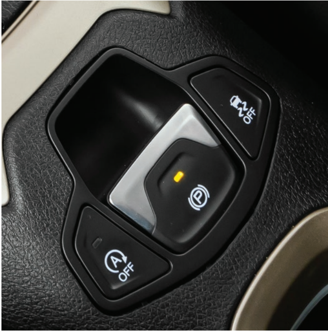
Stop&Start – sistema que desliga o motor durante o período de parada do veículo e o liga novamente de forma automática