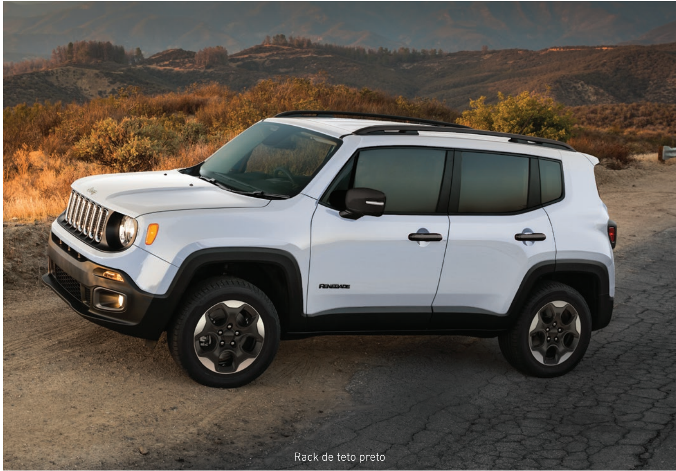
Rack de teto preto