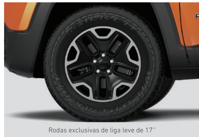
Rodas exclusivas de liga leve de 17"