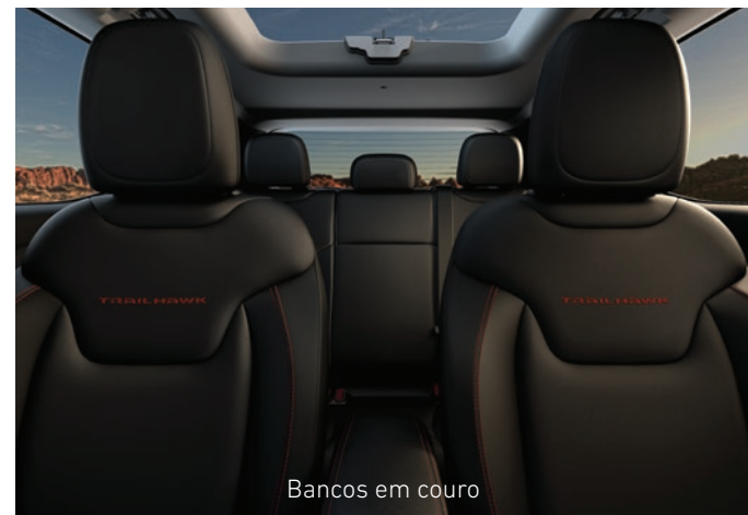
Bancos em couro