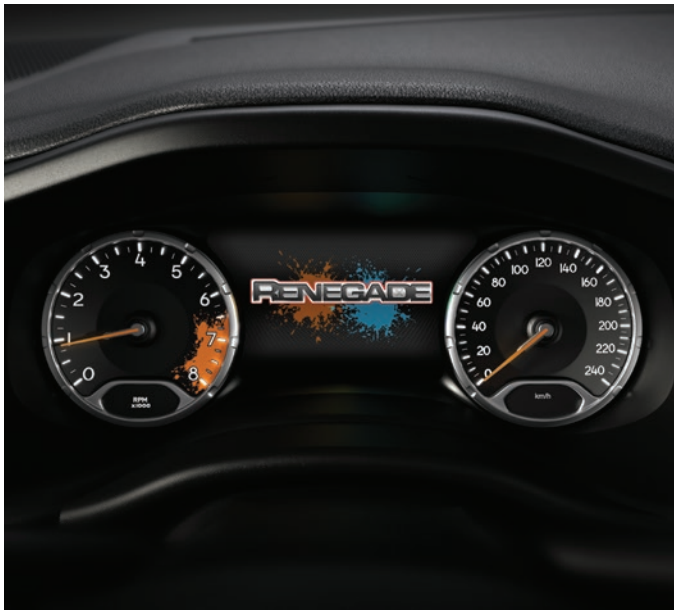
Quatro de instrumentos com tela de 3,5" ou 7" (colorida) reconfigurável