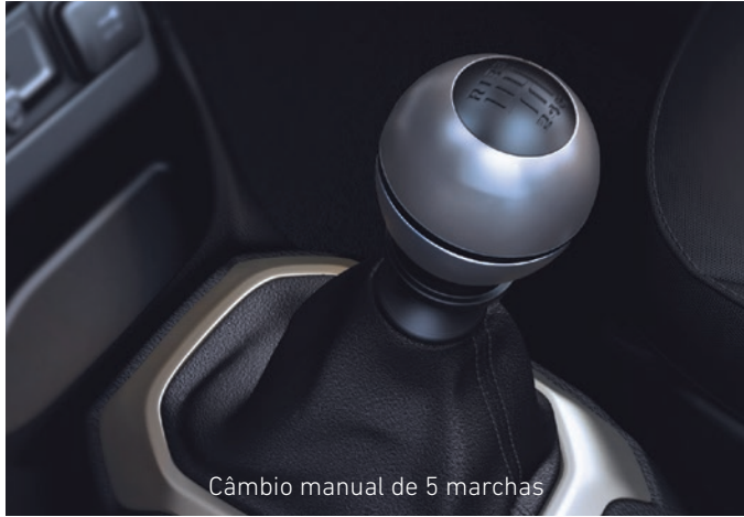
Câmbio manual de 5 marchas