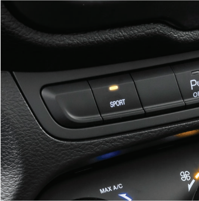
Modo de condução Sport