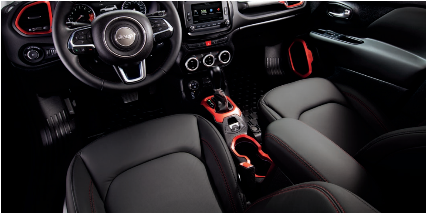
Posição de dirigir elevada