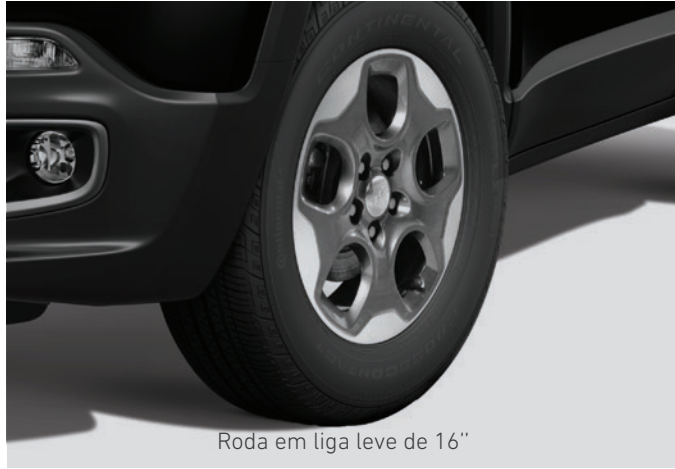
Roda em liga leve de 16"