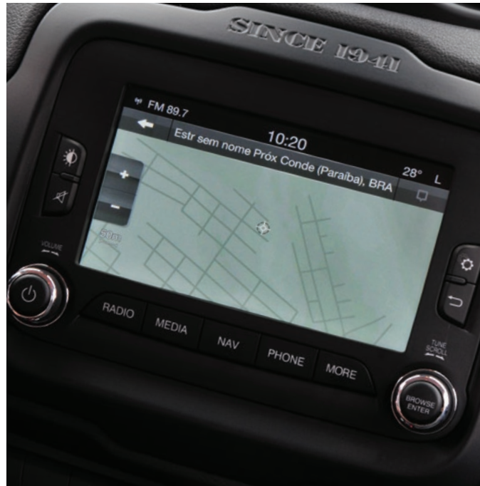
GPS e câmera de ré