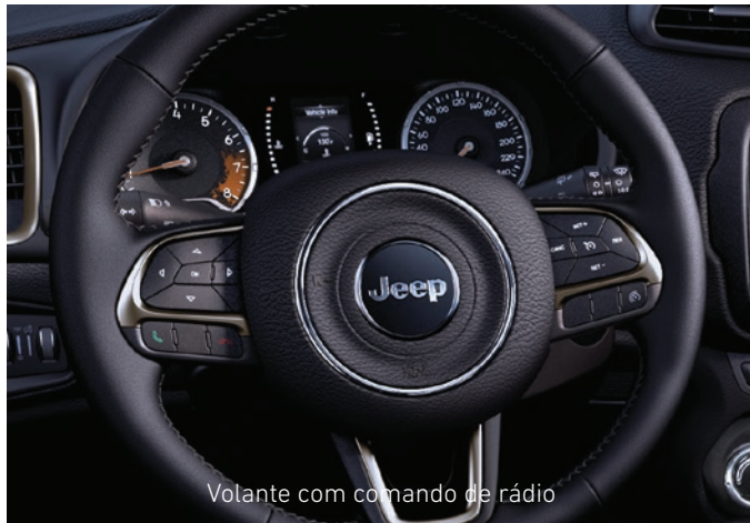
Volante com comando de rádio