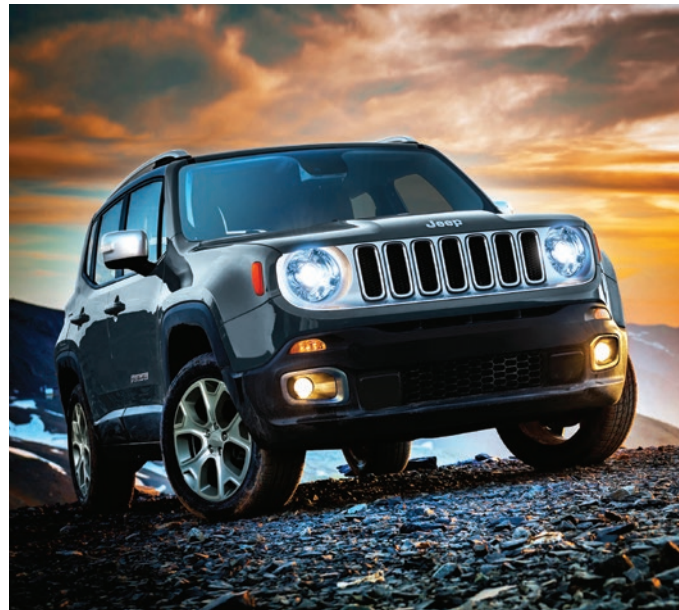
Faróis de xênon