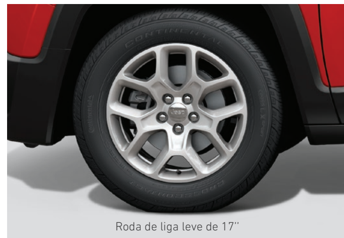
Roda de liga leve de 17"