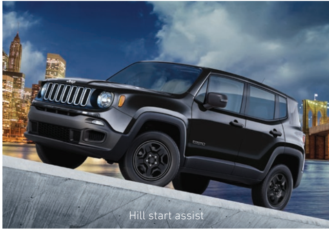
Hill start assist