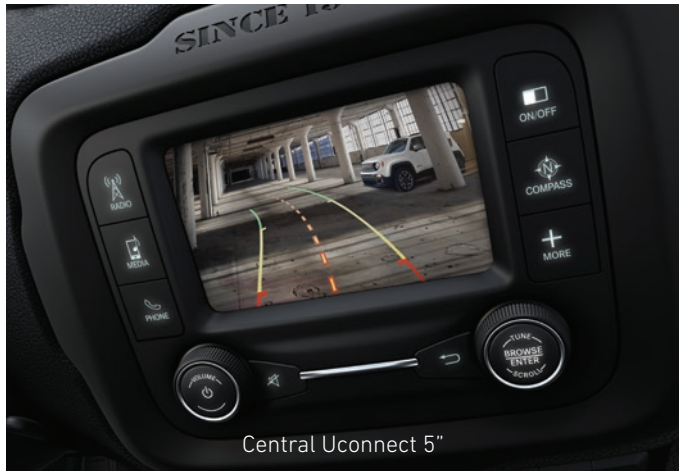
Central Uconnect 5"