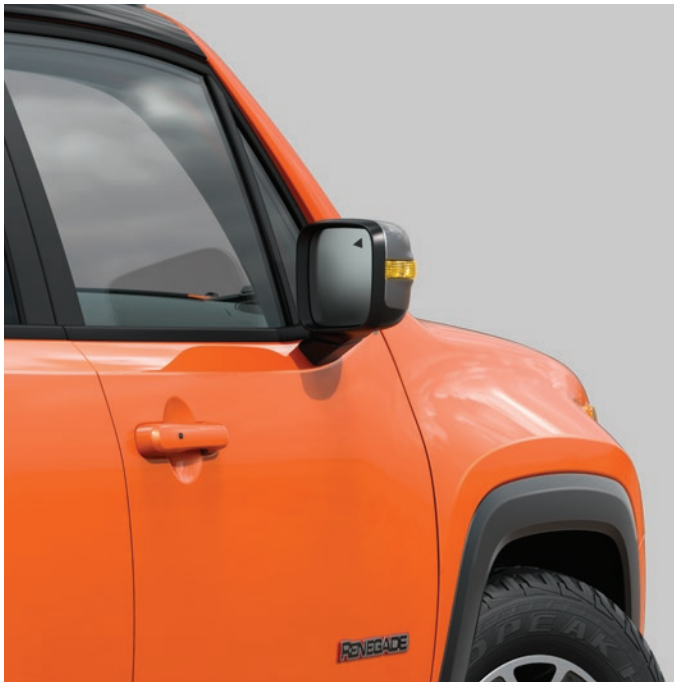
Detecores de pontos cegos