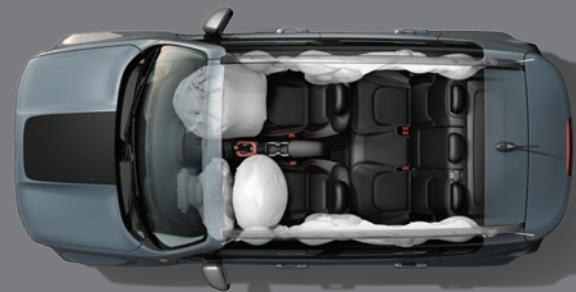
Sete airbags, incluindo os laterais de cortina e o de joelhos do motorista