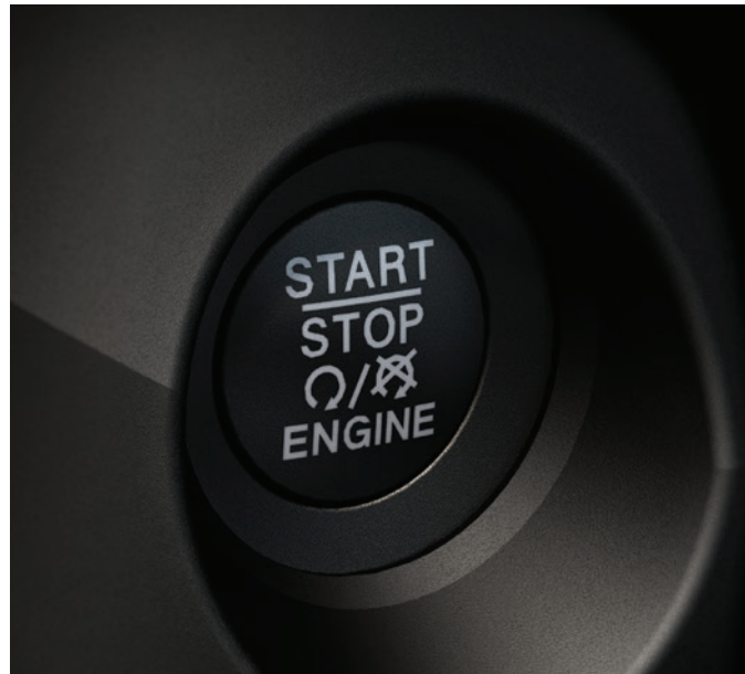
Keyless Enter N' Go – sistema de abertura das portas e partida sem chaves