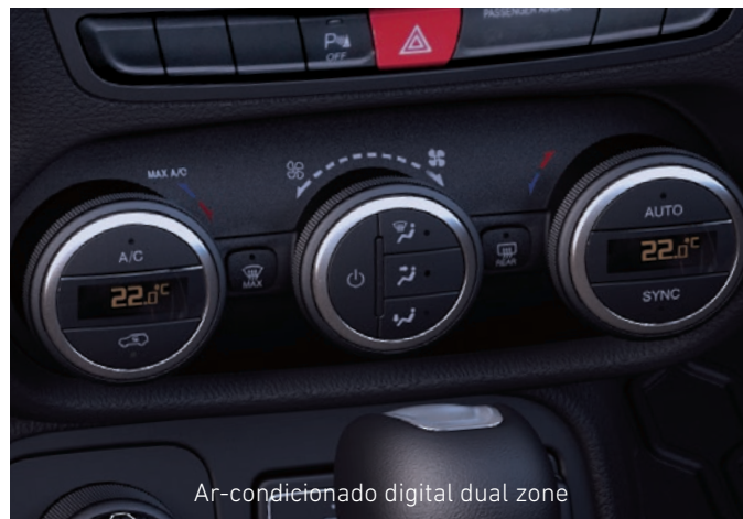
Ar-condicionado digital dual zone