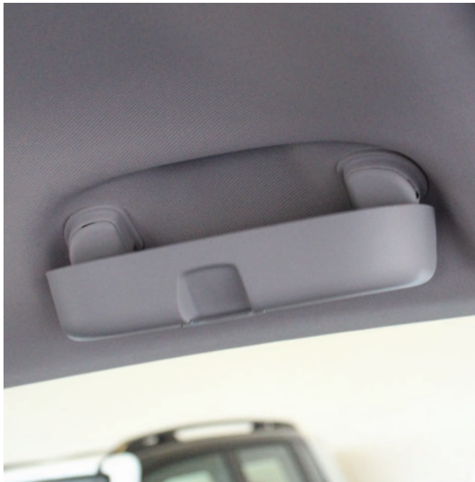
Porta-óculos para todas as versões