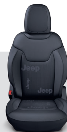
Sport / Longitude