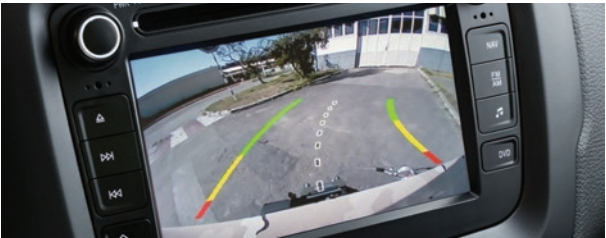
Central multimídia com câmera de ré