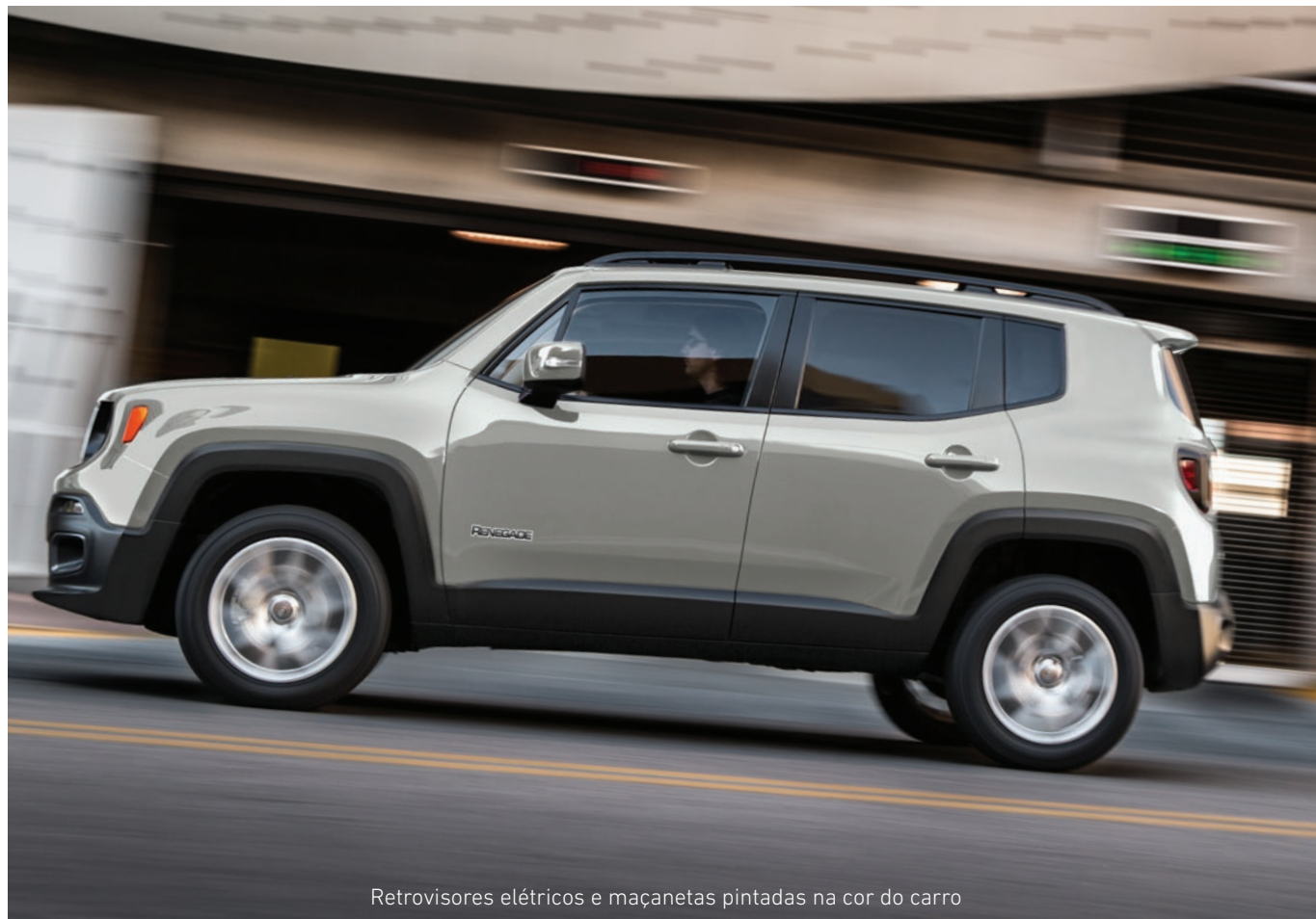
Retrovisores elétricos e maçanetas pintadas na cor do carro

A NOVA VERSÃO DO JEPP RENEGADE QUE JÁ NASCEU COMPLETA E COM MUITA SOFISTICAÇÃO