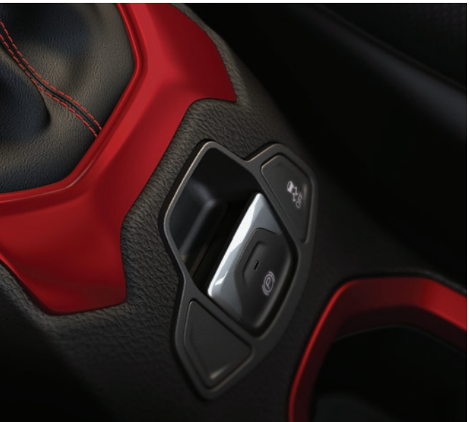
ESC – Controle Eletrônico de Estabilidade