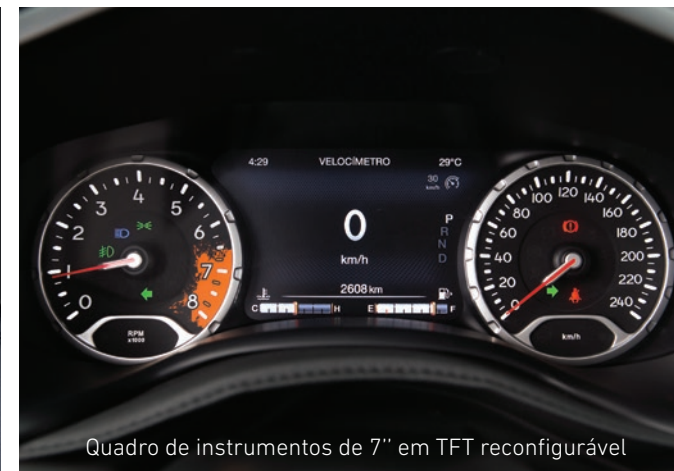
Quadro de instrumentos de 7" em TFT reconfigurável