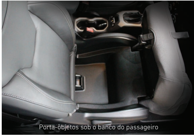
Porta-objetos sob o banco do passageiro