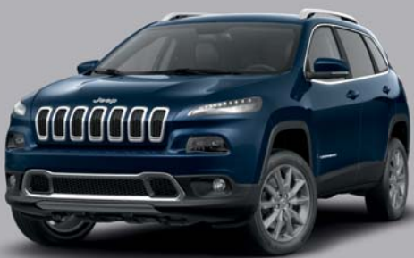
Patriot Blue **