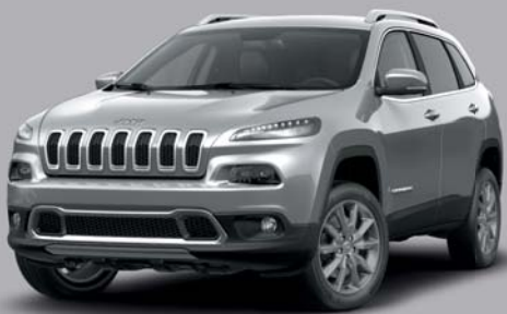
Billet Silver 1