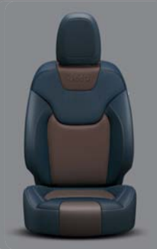
Vesuvio Nappaleder* Indigo Blue/JEEP, Brown