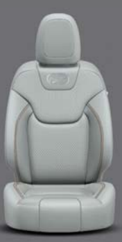
Panama Nappaleder* Pearl