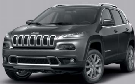
Granite Crystal ***