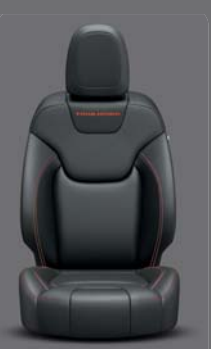
Morocco Nappaleder* Black mit roten Akzentnähten