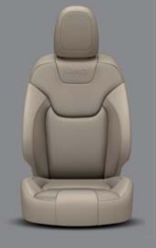
Nepal Nappaleder* Beige