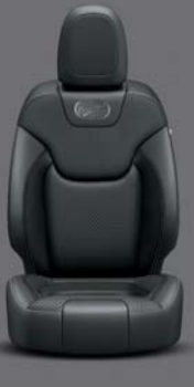
Panama Nappaleder* Black