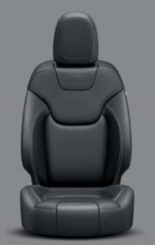
Morocco Nappaleder* Black