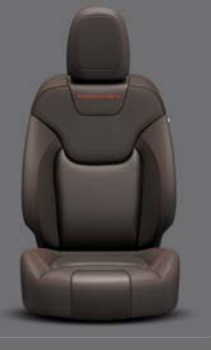
Grand Canyon Nappaleder* JEEP, Brown mit roten Akzentnähten