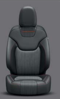
Morocco Stoff/Nappaleder* Black mit roten Akzentnähten