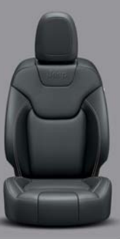
Morocco Stoff Black