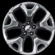
Jantes en alliage 18"