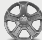
Rines de aluminio "Tech Silver" de 17"