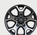
Rines de aluminio con acentos en negro de 17"