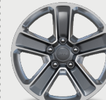
Rines de aluminio pulido con brazos en color gris de 18"