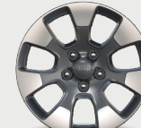
Rines de aluminio con facetas maquinadas de 18"