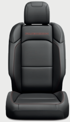
Asientos Rubicon con tela negra