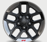
Rines de aluminio con contorno maquinado de 17"