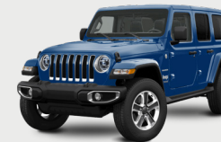
AZUL OCEANO METÁLICO