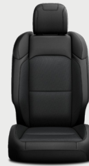
Asientos con tela negra