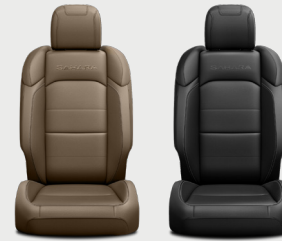
Asientos Sahara color café Montura Oscura