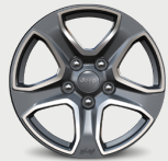
Rines de Aluminio en Granito de 17"