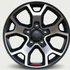
Rines de aluminio con acentos en negro de 17"