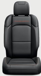
Asientos Rubicon con tela negra