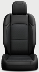
Asientos con tela negra