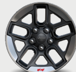
Rines de aluminio con contorno maquinado de 17"