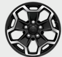
Rines de aluminio 17"

Toldo rígido en negro o al color de la carrocería, verifique disponibilidad con su distribuidor.