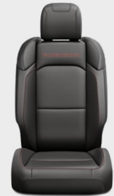
Asientos Rubicon con piel negra