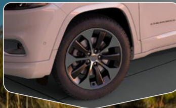
Rines de aluminio pulido de 19" versión Overland