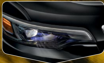
Lámparas de LED