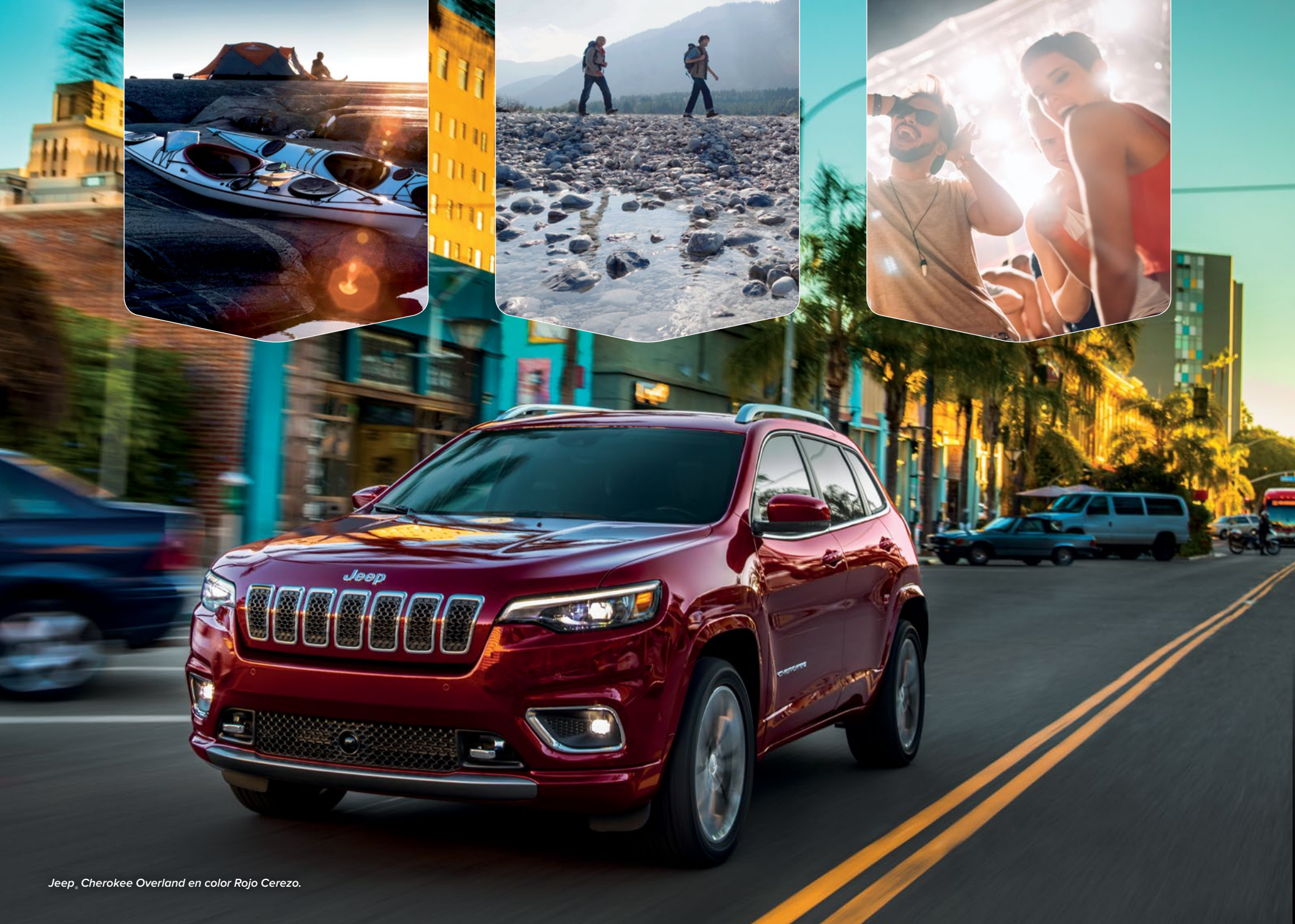
Jeep® Cherokee Overland en color Rojo Cerezo.