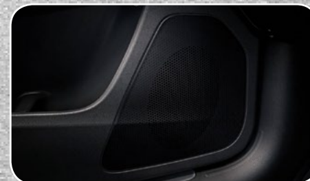
Sistema de audio premium Alpine® de 9 bocinas con subwoofer y amplificador de 506 W