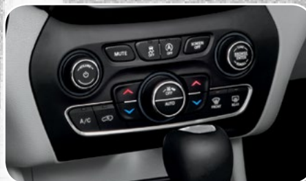
Aire acondicionado automático de doble zona