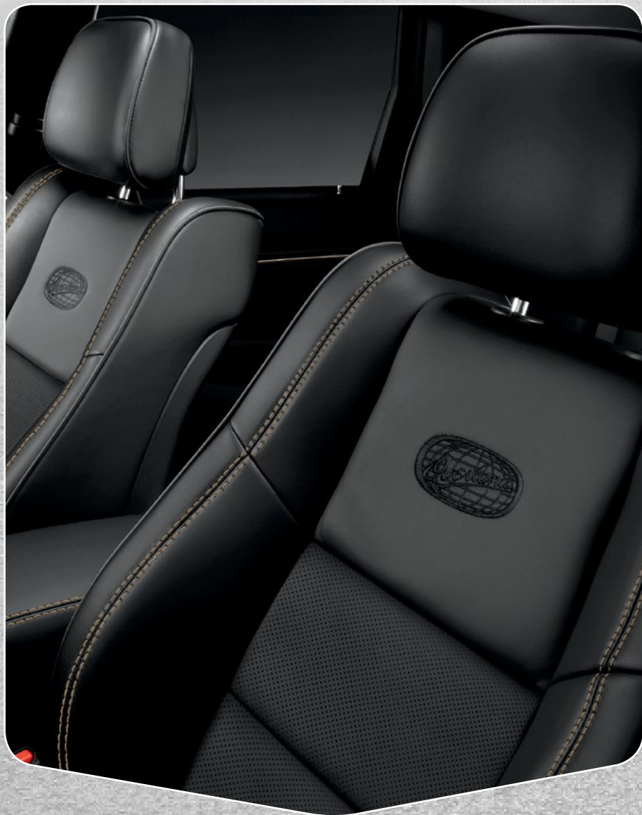
Asientos delanteros calefactables y ventilados