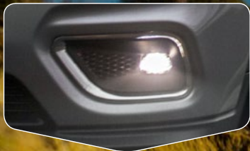
Lámparas de niebla