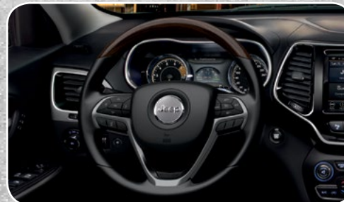
Volante calefactable y forrado con piel, con controles de audio, ajuste telescópico y de altura con insertos de madera