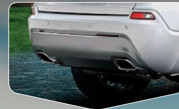
Sistema de escape dual con puntas cromadas