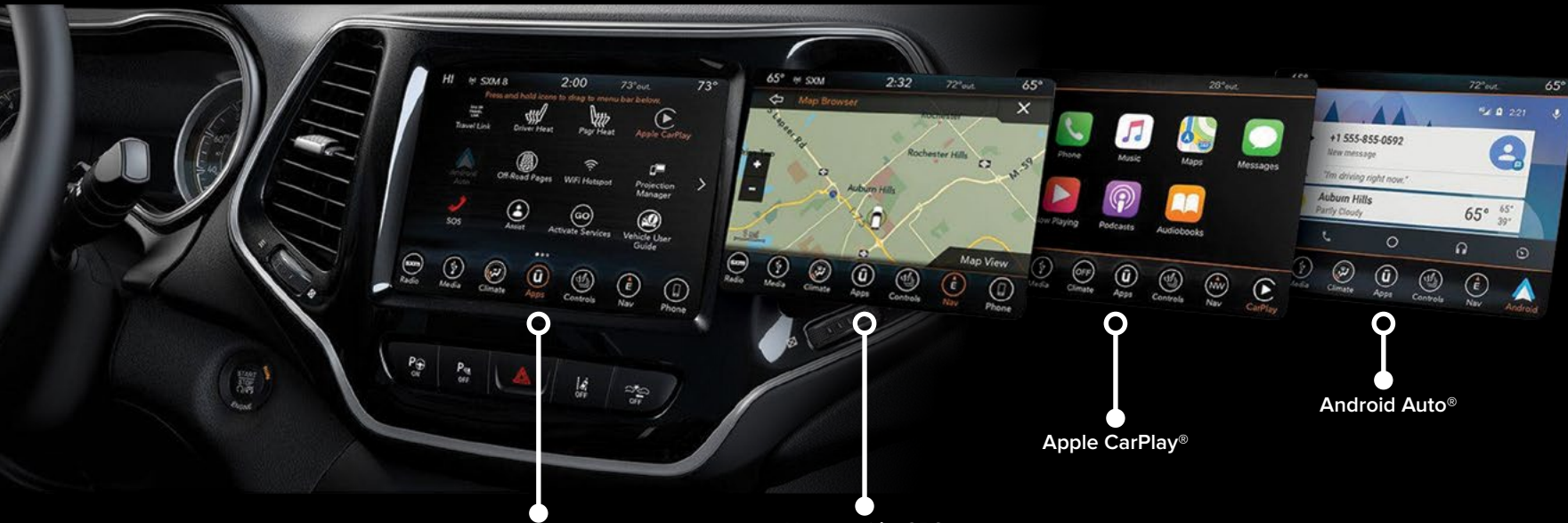
Pantalla táctil de 8.4" con sistema multimedia Uconnect®

Elige la mejor ruta con el sistema de navegación GPS para llegar a tu destino. Y olvídate de maniobras complicadas para estacionarte con el sistema de asistencia de estacionamiento de última generación ParkSense®, con advertencia de distancia lateral (SDW) y cámara de reversa ParkView® integrados.