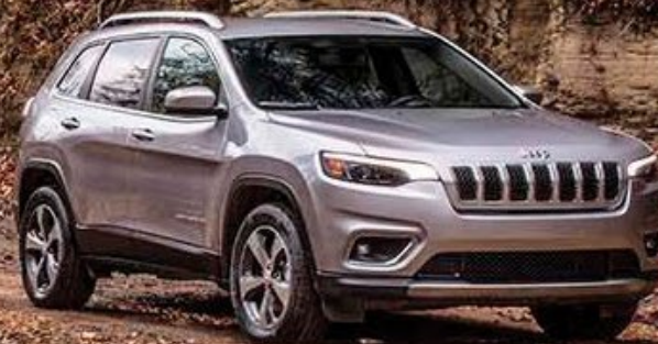
Jeep Cherokee® Limited.