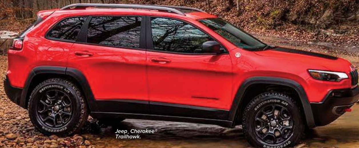
Jeep Cherokee® Trailhawk.