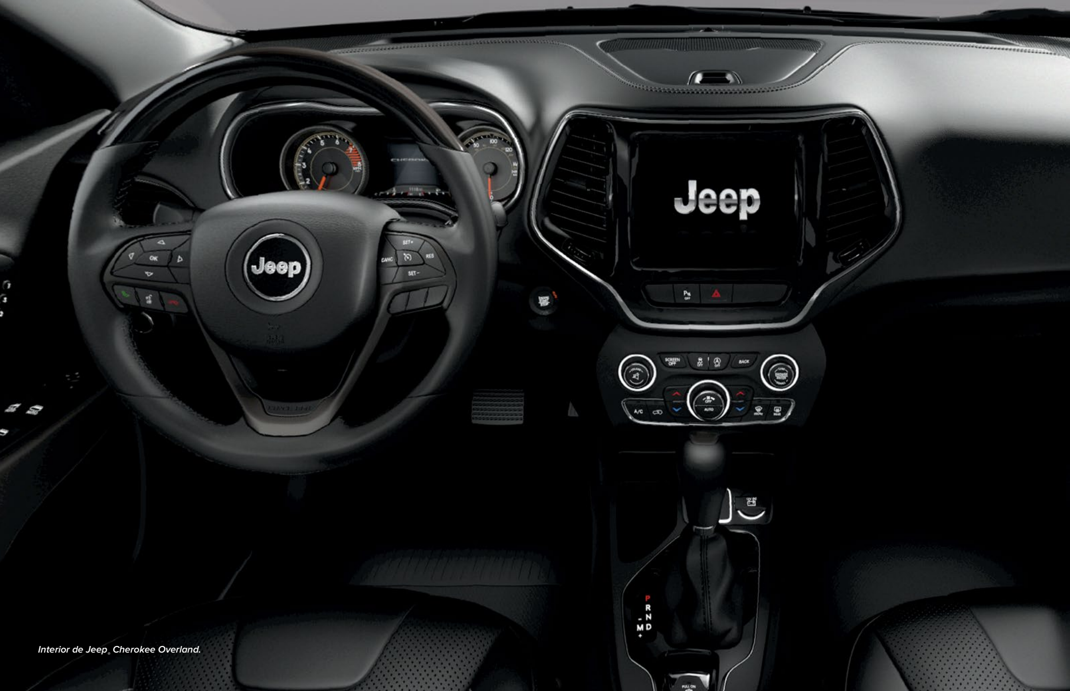
Interior de Jeep Cherokee Overland.