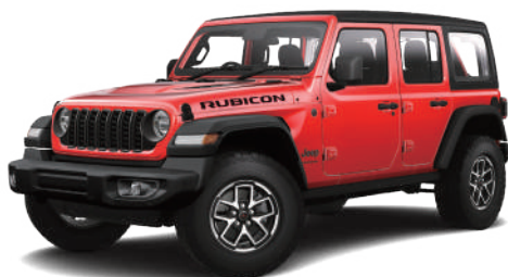
3 ファイヤークラッカーレッド C/C