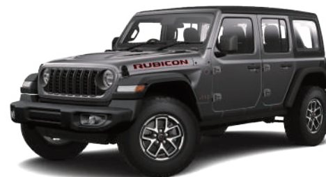
4 グラナイトクリスタルメタリック C/C