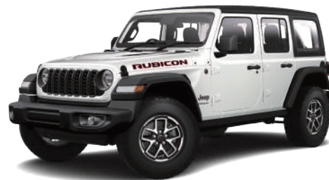
2 ブライトホワイト C/C