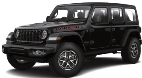
1 ブラック C/C