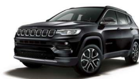
4. ブリリアントブラッククリスタル P/C*