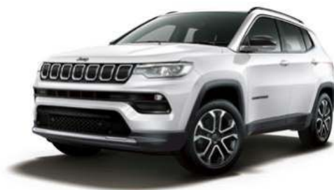
3. パールホワイトトライコート*