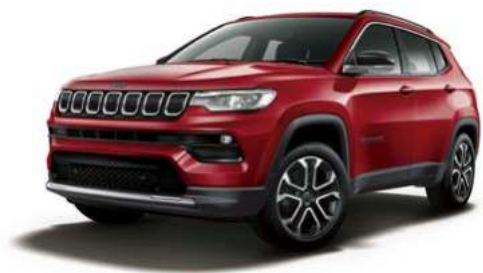
1. エグゾティカ レッド C/C