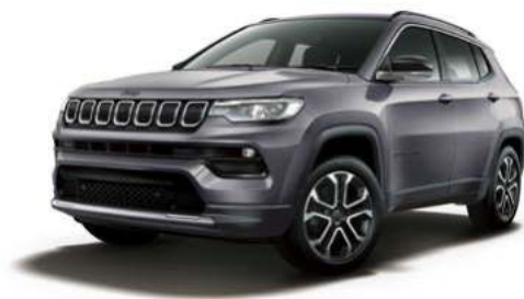
2. グレーマグネシオ メタリック C/C