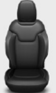
Piel con costuras acentuadas