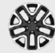
Aluminio de 18"