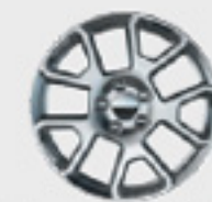
Aluminio de 17"