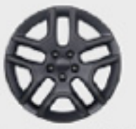
Aluminio de 19"