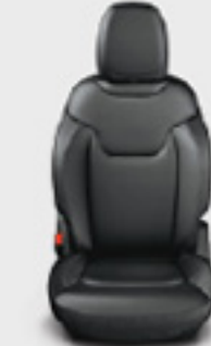
Piel con costuras acentuadas