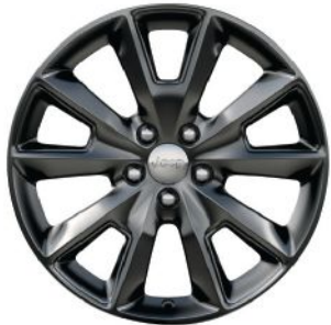
عجلة بلون أسود داكن قياس ١٨ إنش 18-inch Hyper Black Wheel

SHOWN WITH BLACK HOOD GRAPHIC, ROOF RACK CROSSRAILS, KAYAK CARRIER, 17-INCH SEMI-GLOSS BLACK WHEELS AND ROCK RAILS.