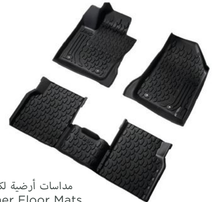
مداسات أرضية لكل المواسم All-Weather Floor Mats