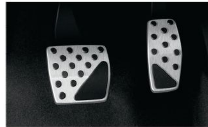
مجموعة عدة الدواسات لامعة Bright Pedal Kit