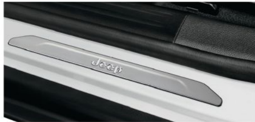
مصدات عتبة الباب Door Sill Guards