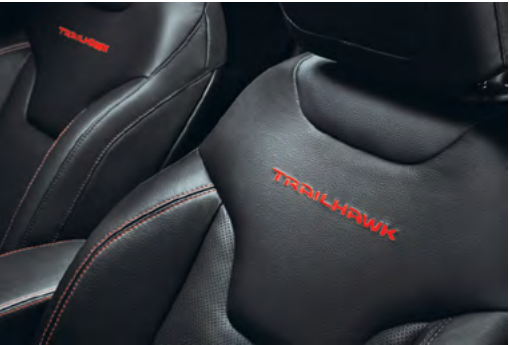
Vestiduras de versión Trailhawk con costuras rojas

La versatilidad interior se alinea a su imagen totalmente renovada; la cabina posee iluminación ambiental en LED y los colores y texturas son diferentes en cada versión. Los asientos traseros plegables 60/40 te permitirán adaptar el espacio de carga para que puedas acomodar todo lo que necesites en tu próxima aventura.