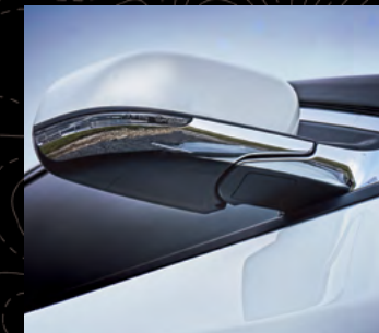
Acentos cromados en fascias y espejos