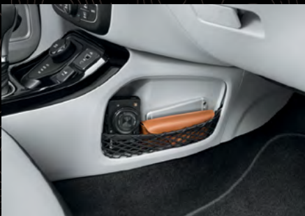
Compartimiento delantero para tableta