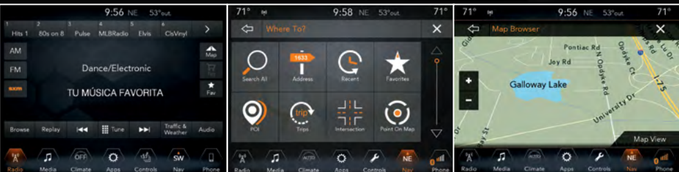
Tablero de versión Trailhawk