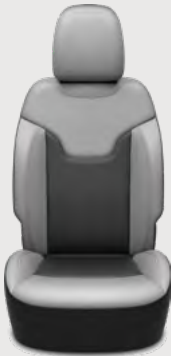
Asientos con piel color Ski Gray