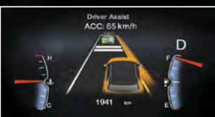
ADVERTENCIA DE CAMBIO DE CARRIL