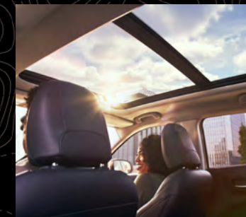
Quemacocos dual panorámico