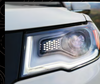
Faros bixenón con Auto High Beam