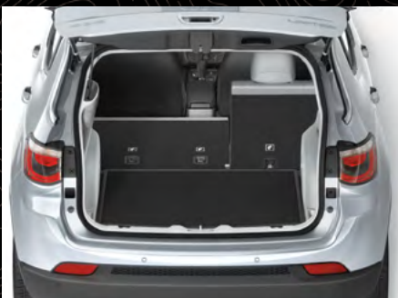
Versatilidad de asientos 60/40

Incluso antes de subirte podrás aprovechar su tecnología. El sistema de entrada pasiva Keyless Enter-N-Go® te permitirá entrar con sólo tocar la manija y ponerlo en marcha presionando el botón de encendido. O incluso, en los días de invierno, podrás aprovechar el encendido remoto y climatizar previamente para que cuando subas encuentres una atmósfera agradable y el motor listo para tu viaje.