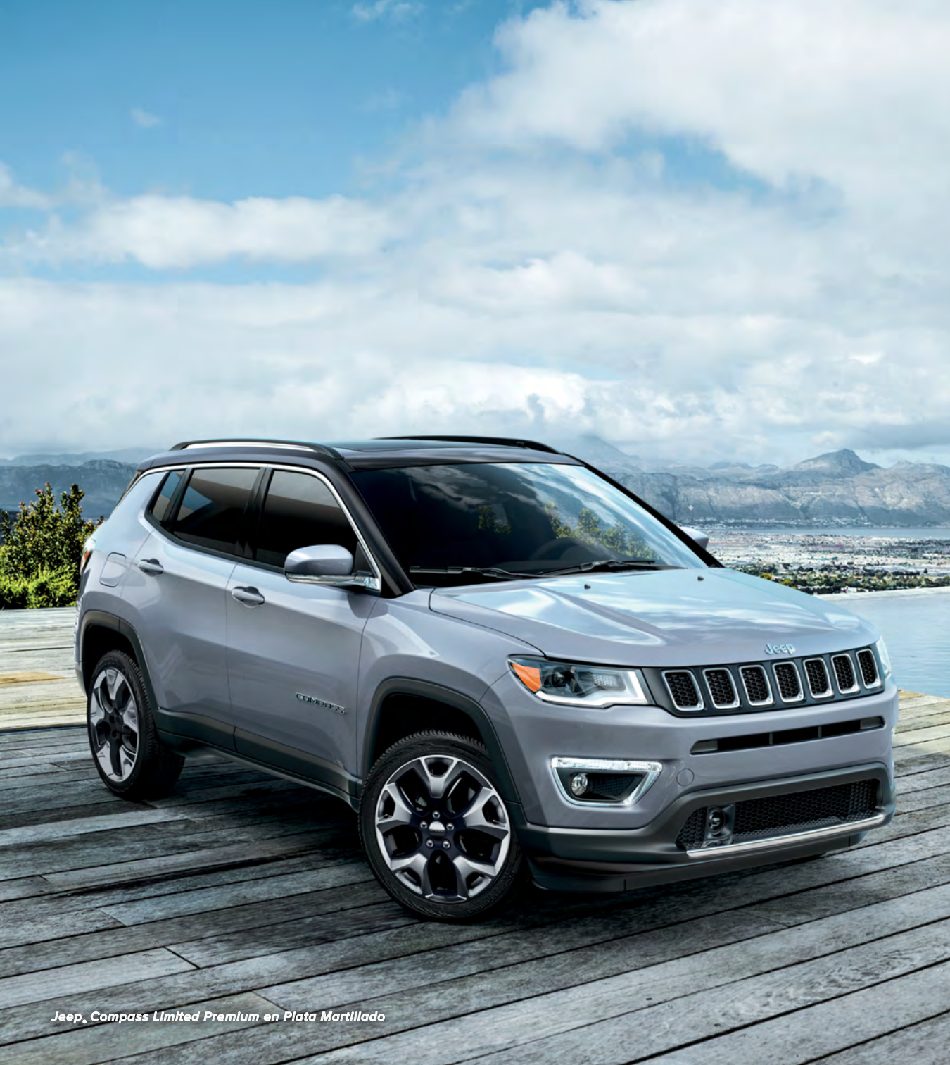
Jeep, Compass Limited Premium en Plata Martillado