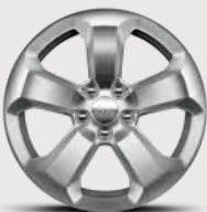
Rines de aluminio de 17"