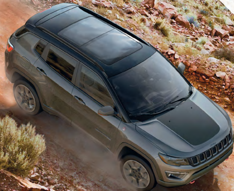
Jeep Compass Trailhawk en Rino con bitono negro