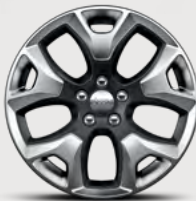
Rines de aluminio de 18" con acentos en negro