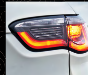
Luces traseras de LED