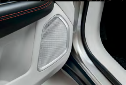
Sistema de audio premium Beats® con 9 bocinas