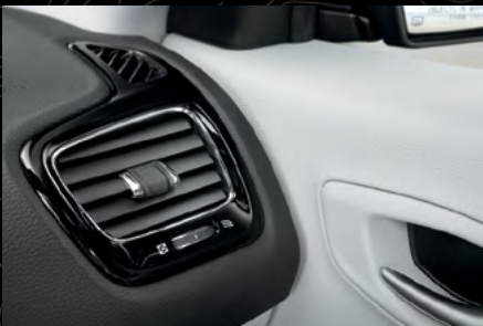
Detalles en acabado Plano Black