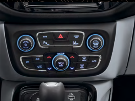
Aire acondicionado de doble zona