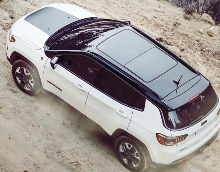
Jeep Compass Trailhawk en Blanco con bitono negro