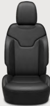
Asientos con piel negra