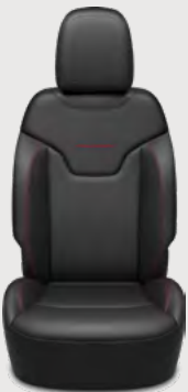
Asientos con piel negra y costuras en color rojo