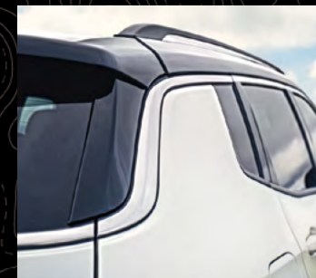
Techo bitono en color negro

Jeep, Compass Limited Premium en Plata Martillado con bitono negro y Jeep, Compass Trailhawk en Naranja Dragón con bitono negro