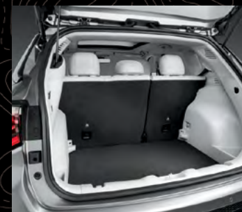
Compuerta trasera eléctrica