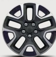
Rines de aluminio de 17"