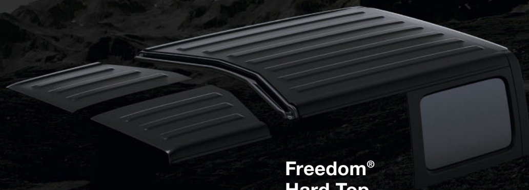
Freedom® Hard Top