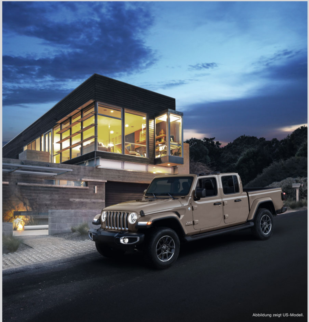
Abbildung zeigt US-Modell.