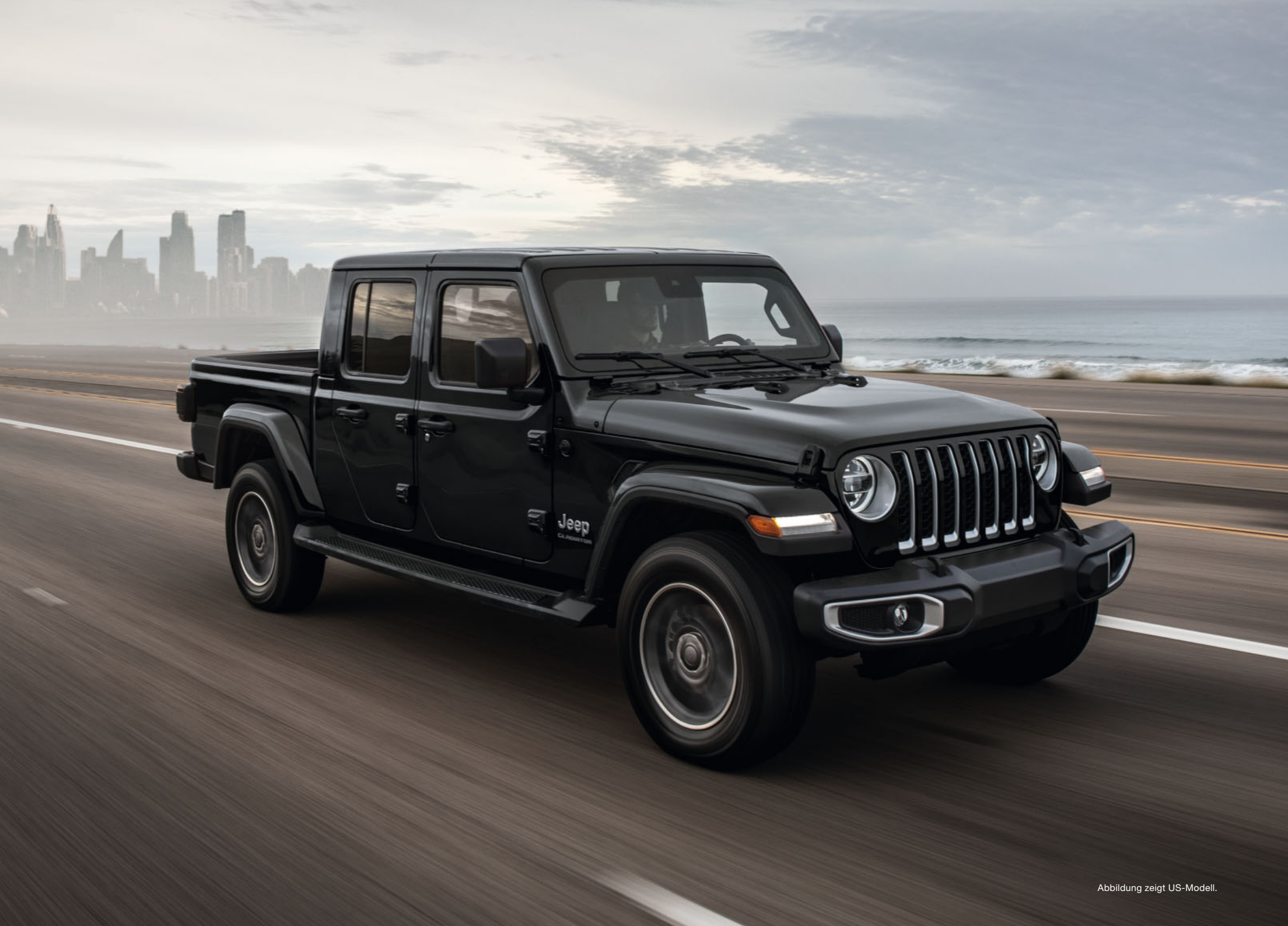
Abbildung zeigt US-Modell.