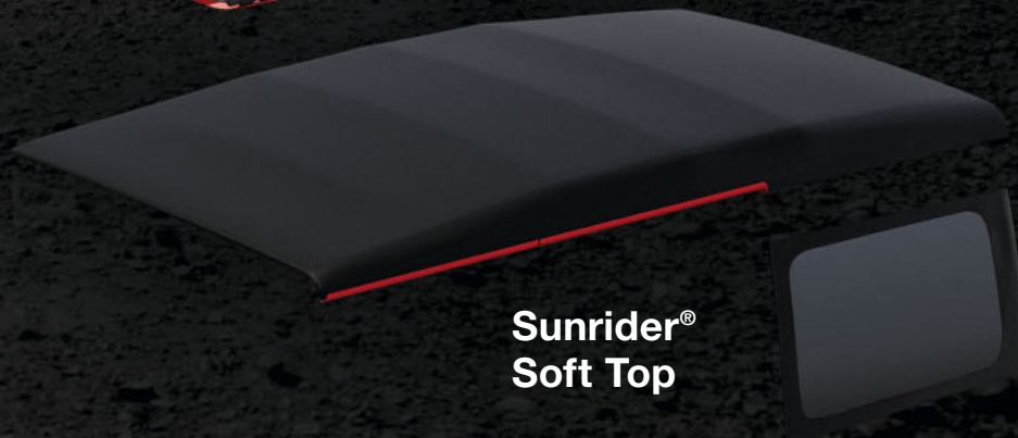
Sunrider® Soft Top