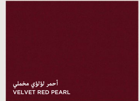
أحمر لؤلؤي مخملي VELVET RED PEARL