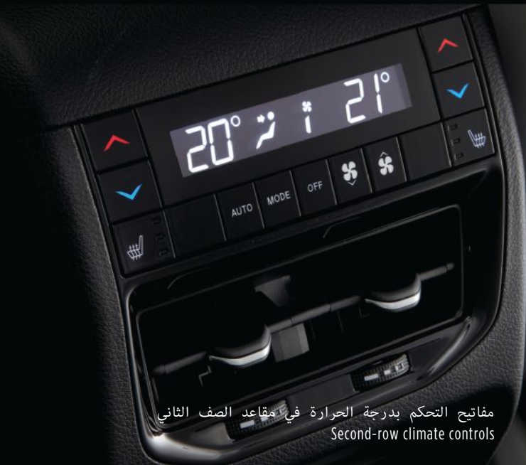
مفاتيح التحكم بدرجة الحرارة في مقاعد الصف الثاني Second-row climate controls