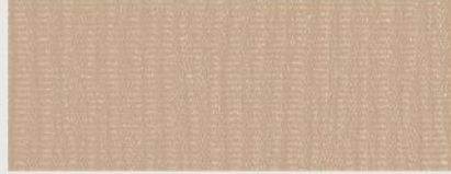
Essence Cloth — Wicker Laredo (Standard)

قماش إسانس - بلون الخيزران ويكر لاريدو (قياسي)