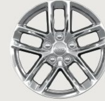
18-Inch Aluminum Laredo (Standard) (WBA)

جلد باليرمو قابل للتهوية مع مساند من جلد باليرمو مبطن وخياطة بارزة بلون كونيكا - بلون أصفر برتقالي توبيلو ساميت ريزرف (قياسي)