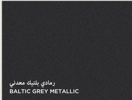
رمادي بلتيك معدني BALTIC GREY METALLIC