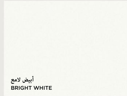
أبيض لامع BRIGHT WHITE