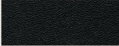
Leather with Light Tungsten accent stitching — Black Altitude (Standard)

قماش إسانس - بلون الخيزران ويكر لاريدو (قياسي)