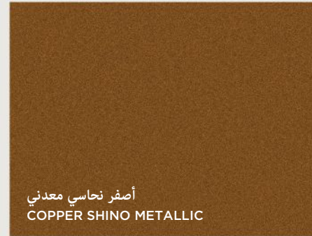
أصفر نحاسي معدني COPPER SHINO METALLIC