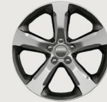
20-Inch Polished / Painted Aluminum Limited (Available) (WHC)

من الألومينيوم المطلي بلون أسود لامع قياس ٢٠ إنش ألتيتود (قياسي) (WHF)