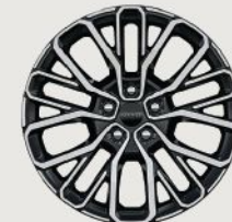
21-Inch Polished / Painted Aluminum Summit Reserve (Standard) (WJE)

من الألومينيوم الملمّع / المطلي قياس ٢٠ إنش ليميتد (قياسي) (WHC)