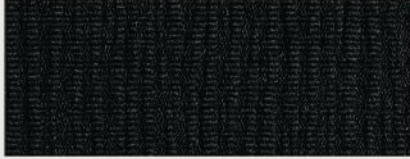
Essence Cloth — Black Laredo (Standard)