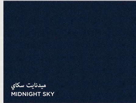
ميدنايت سكاى MIDNIGHT SKY