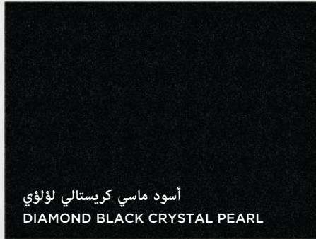
أسود ماسي كريستالي لؤلؤي DIAMOND BLACK CRYSTAL PEARL