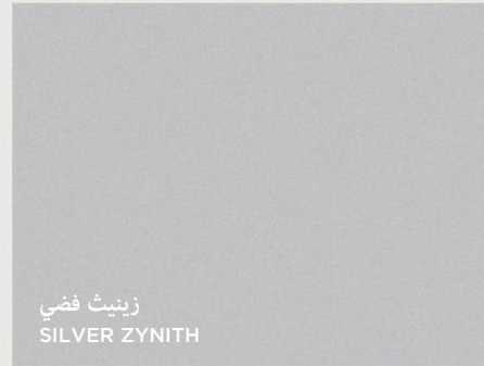
زينيث فضي SILVER ZYNITH