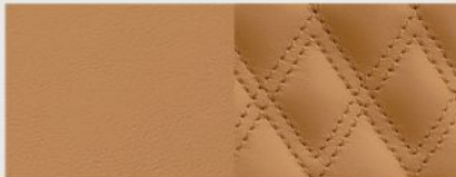
Ventilated Palermo Leather with Quilted Palermo Leather Bolsters and Cognac accent stitching — Tupelo Summit Reserve (Standard)

جلد باليرمو قابل للتهوية مع مساند من جلد باليرمو مبطن وخياطة بارزة بلون كونيكا - بلون أسود ساميت ريزرف (قياسي)