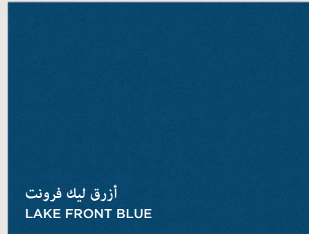
أزرق ليك فرونت LAKE FRONT BLUE