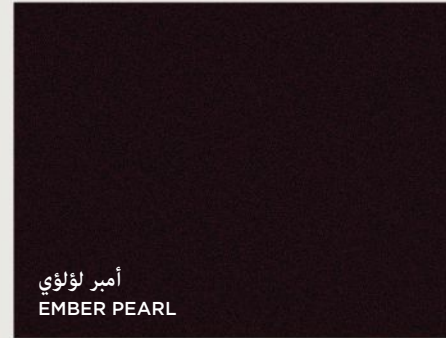
أمبر لؤلؤي EMBER PEARL