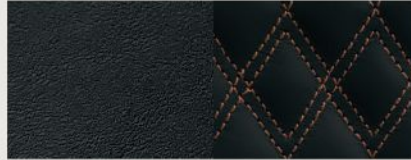
Ventilated Palermo Leather with Quilted Palermo Leather Bolsters and Cognac accent stitching — Black Summit Reserve (Standard)

جلد كابري وجلد سويد مخرم مع خياطة بارزة بلون تنجستين فاتح - بلون بيج خيزران ويكر ليميتد (قياسي)