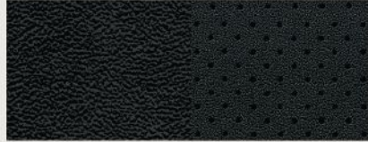
Leather and Perforated Suede with Light Tungsten accent stitching — Black Limited (Standard)

جلد مع خياطة بارزة بلون تنجستين فاتح - بلون أسود ألتيتود (قياسي)