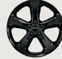
20-Inch Gloss Black- Painted Aluminum Altitude (Standard) (WHF)

الألومينيوم قياس ١٨ إنش لاريدو (قياسي) (WBA)