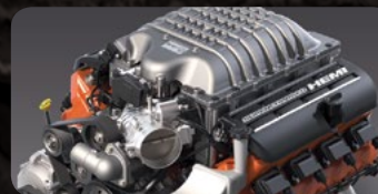
707 C.F. HEMI® SUPERCARGADO