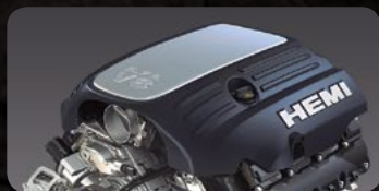
360 C.F. HEMI® 5.7 L V8 MDS VVT