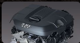
295 C.F. PENTASTAR® 3.6 L V6 24V VVT