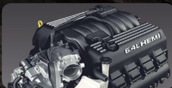
475 C.F. HEMI® 6.4 L V8 MDS VVT