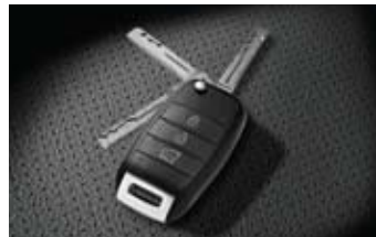
폴딩타입 무선도어 리모컨 키