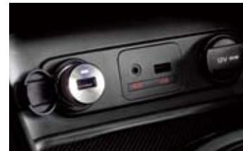
AUX & USB(iPod) 단자 & 충전용 USB