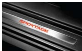
LED 도어 스커프 (1열)