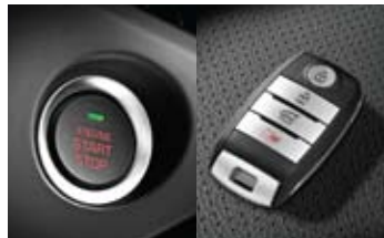
버튼 시동 스마트 키 시스템