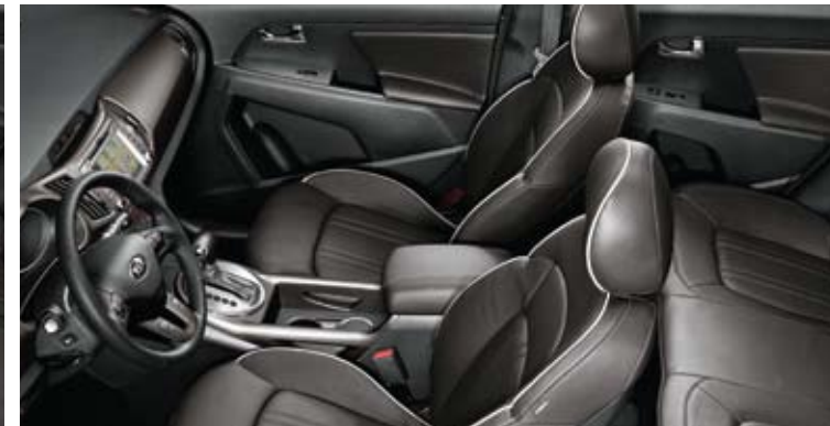
브라운 컬러 패키지 (가족 시트)