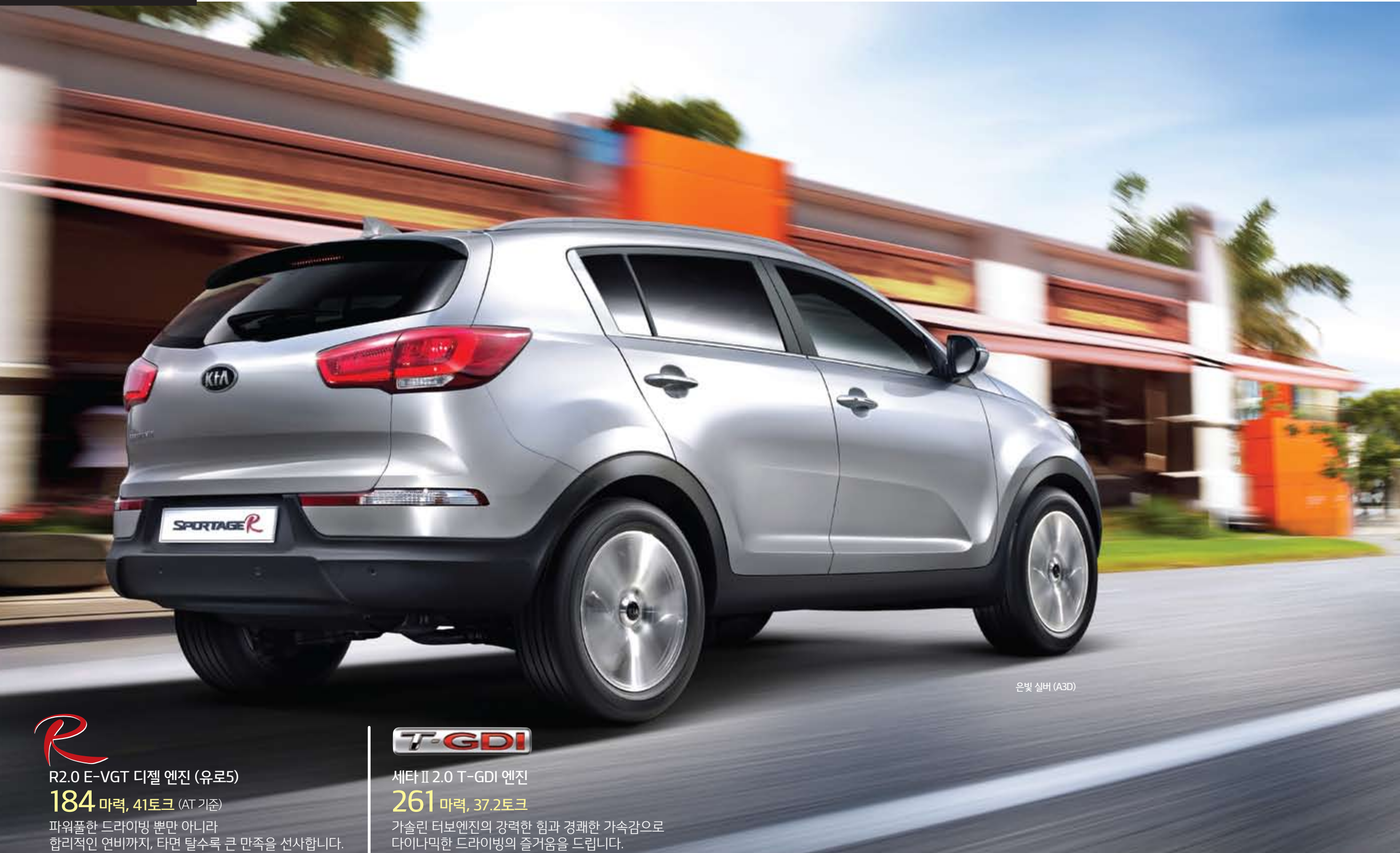
은빛 실버 (A3D)

R R2.0 E-VGT 디젤 엔진 (유로5) 184 마력, 41토크 (AT 기준) 파워풀한 드라이빙 뿐만 아니라 합리적인 연비까지, 타면 탈수록 큰 만족을 선사합니다.