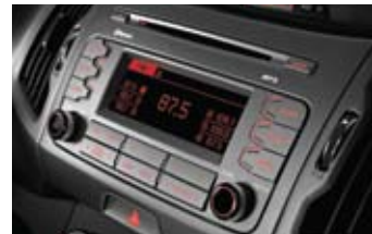
CDP 오디오 (MP3 재생)