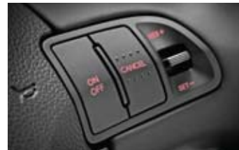
크루즈 컨트롤 (정속주행장치)