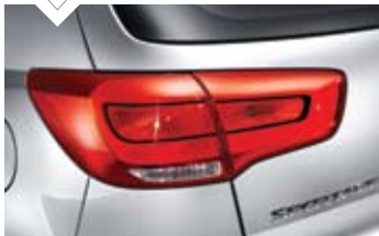
일반형 리어 콤비네이션 램프