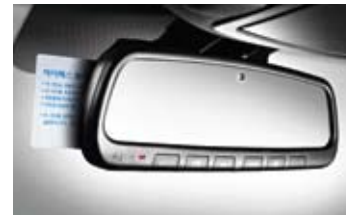
전자식 롭미러 (ECM) / 자동요금정수시스템 (ETCS) ※ 상기 롭미러는 UVO 기능 적용 사양임 ※ ETCS는 장애인등 통행로 자동 확인 기능 미적용