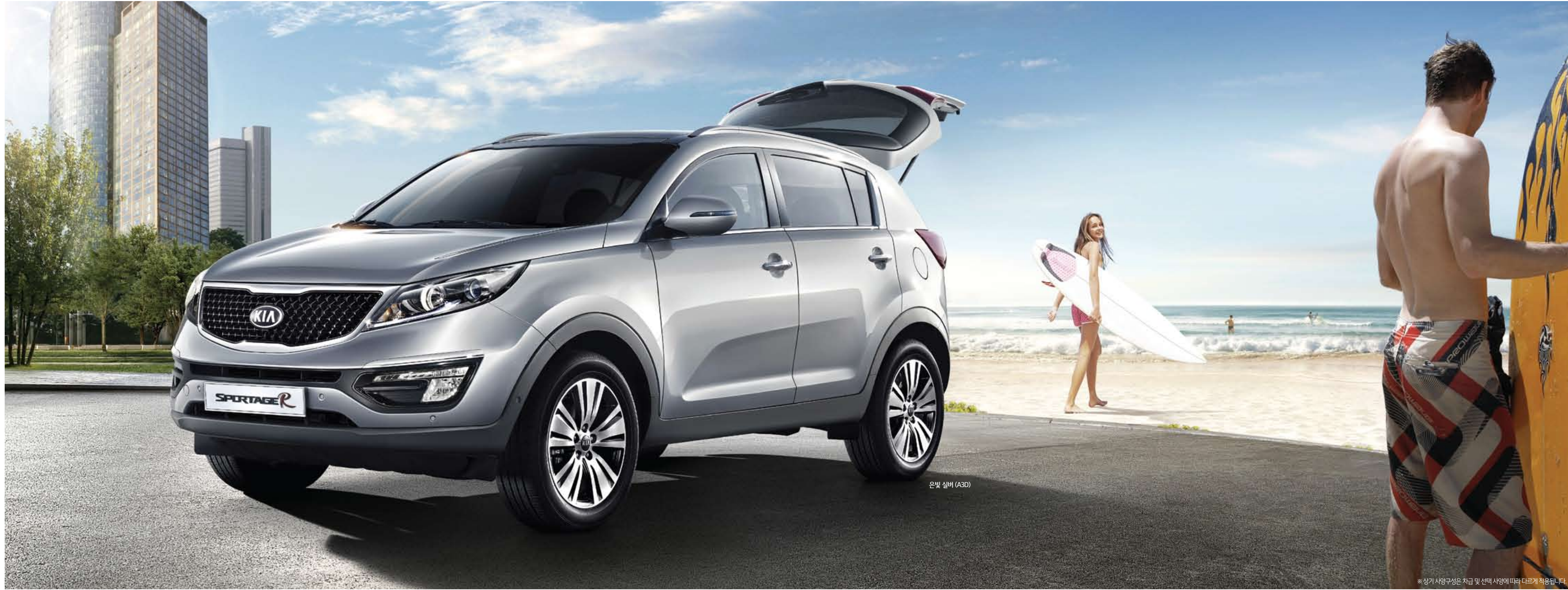
은빛 실버 (A3D)