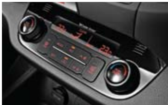
독립제어 풀 오토 에어컨 (운전석 / 동승석)