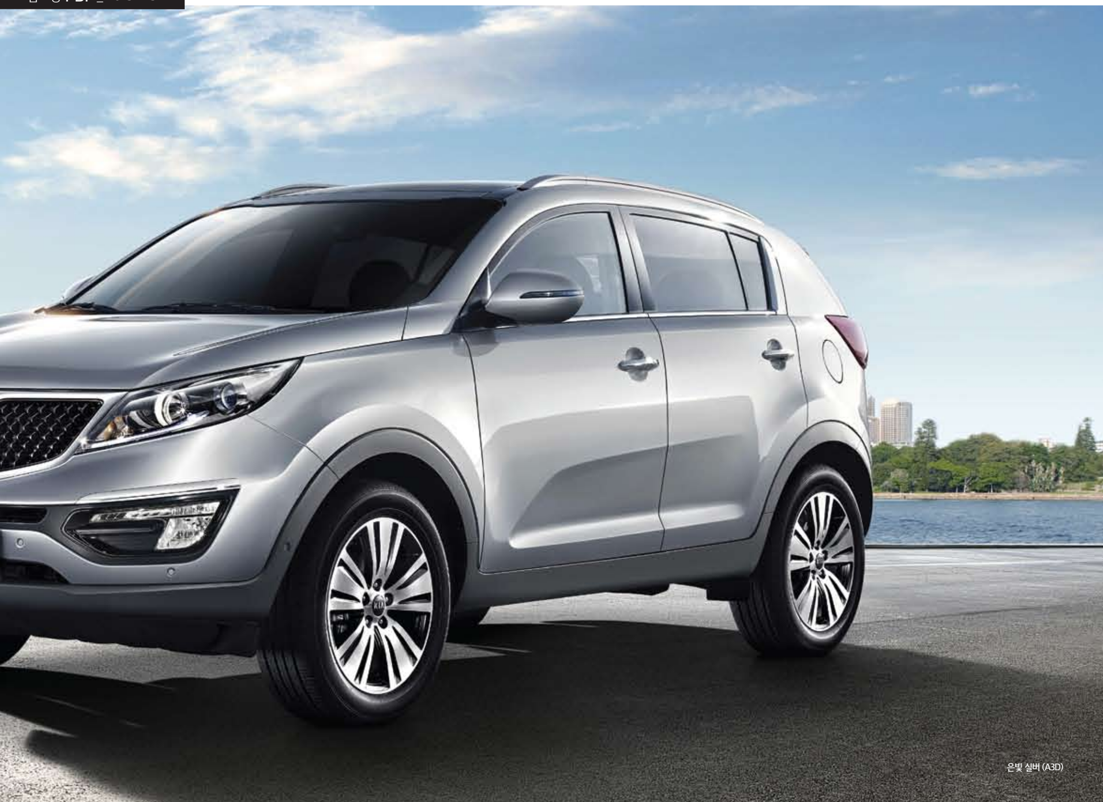
은빛 실버 (A3D)