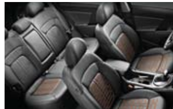
히트드 시트 (1열 / 2열)