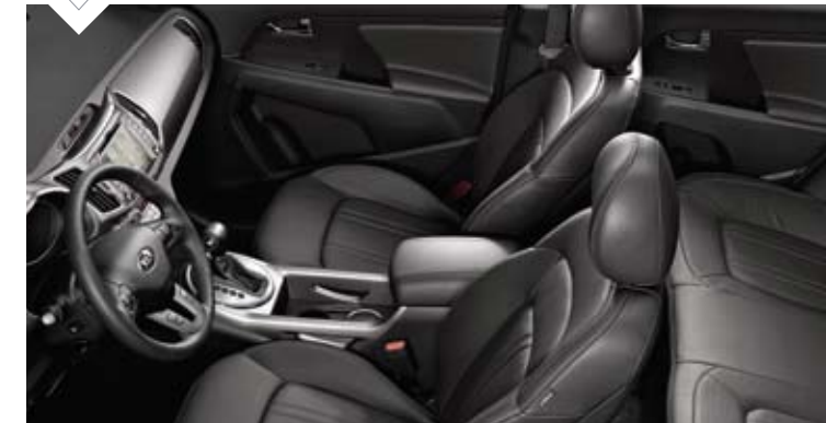
블랙 원톤 인테리어 (가족/인조가죽 시트)

※ 가족시트는 가족 및 인조 가죽이 혼용되어 있습니다. ※ 블랙 컬러(가족 / 인조가죽 시트) 이미지는 가족시트를 기준으로 촬영되었으며, 인조가죽 시트의 경우 사양에 따라 재질 및 형태에 차이가 있습니다.