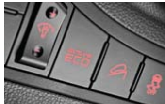
액티브 에코 시스템