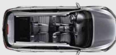
3ª fila totalmente plegada