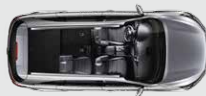
2ª fila parcialmente plegada