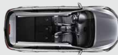
2ª fila totalmente plegada