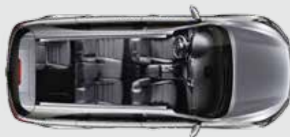
3ª fila parcialmente plegada

Pliega los asientos traseros parcial o totalmente para crear combinaciones de plazas y espacio para el equipaje.