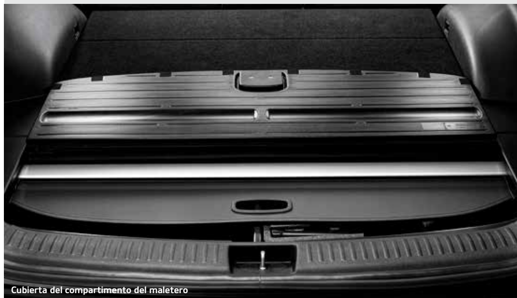
Cubierta del compartimento del maletero

Guarda los objetos de valor más grandes bajo la cubierta retráctil en un compartimento independiente.