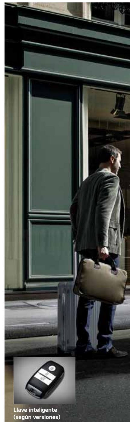
Llave inteligente (según versiones)

Las fotografías son de carácter orientativo, y con ellas los accesorios, y sólo podrán ser solicitados por escrito por parte del cliente.