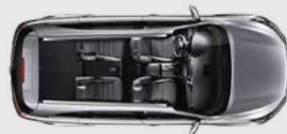
2ª fila parcialmente plegada