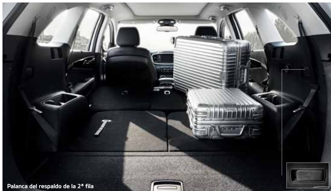
Palanca del respaldo de la 2ª fila