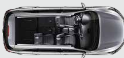
3ª fila totalmente plegada y 2ª fila parcialmente plegada