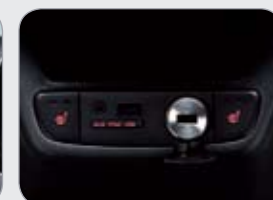
AUX & USB(iPod) 단자 / USB 충전기