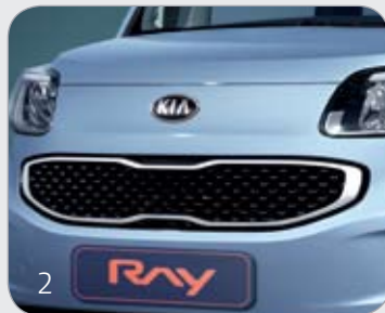
화이트 라디에이터 그릴