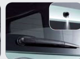
뒷유리 와이퍼 & 와셔 노즐 *