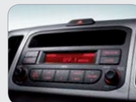
컴팩트 오디오 (MP3 재생)