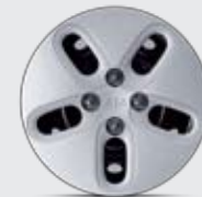
14인치 스틸휠 & 휠커버