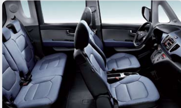
네이비 인조가죽 시트

※ 블랙 원톤 인테리어 컬러 이미지는 블랙 인조가죽 시트 기준으로 제작되었습니다.