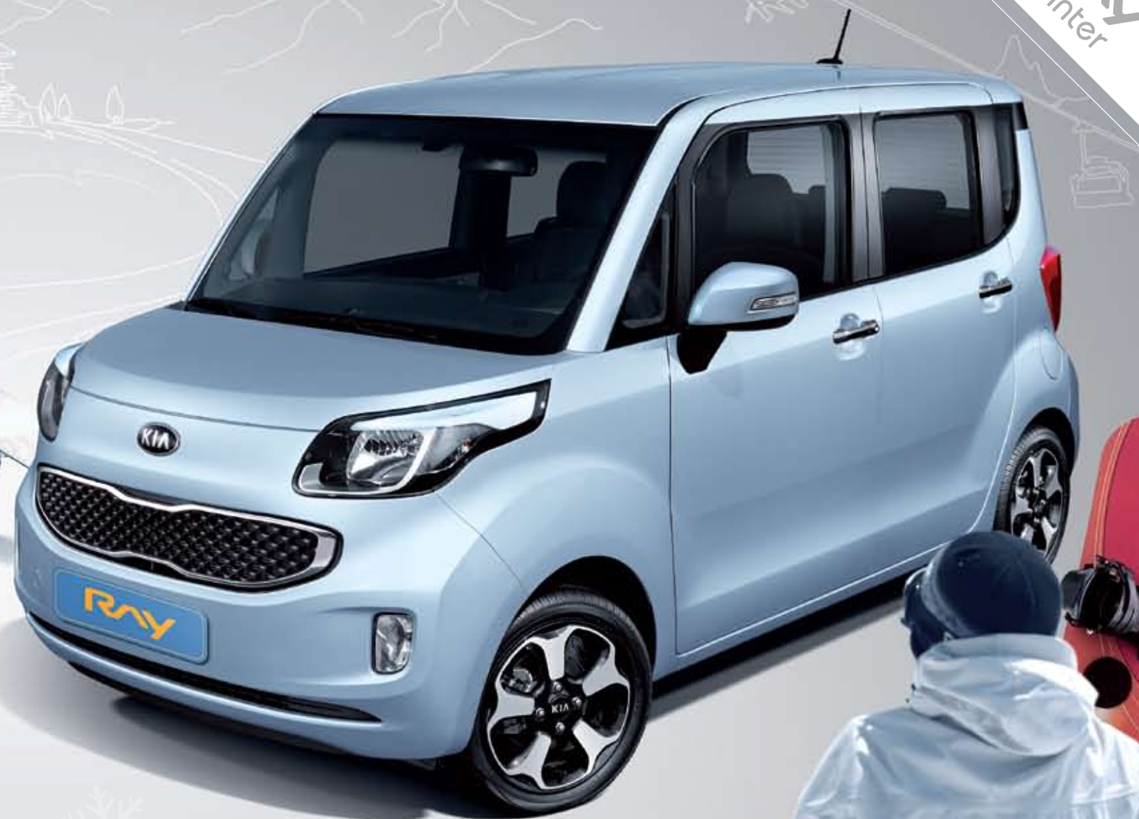
셀레스티얼 블루 (CU3)