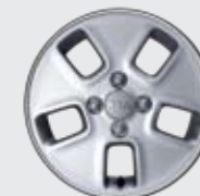
14인치 알로이 휠