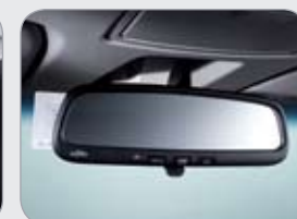
자동요금정수 시스템 (ETCS) ※ 장애인 등 통행료 자동할인 기능 미적용