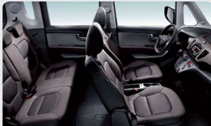
브라운 인조가죽 시트