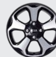
15인치 블랙 럭셔리 알로이 휠