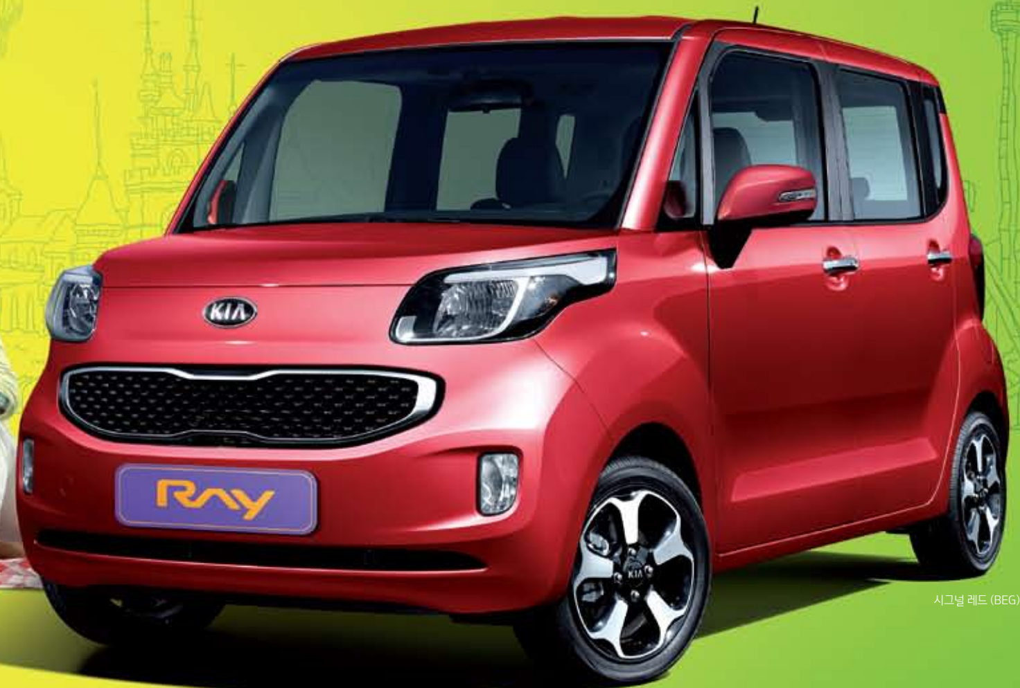
시그널 레드 (BEG)

상기 차량 이미지와 사양 구성은 차종, 차급 및 선택사양에 따라 다르게 적용됩니다.