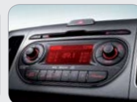
CDP 오디오 (MP3 재생)