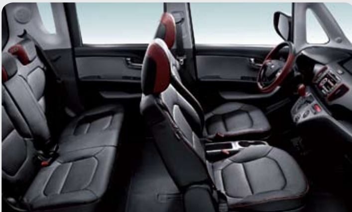
블랙 인조가죽 시트 (레드 스티치)