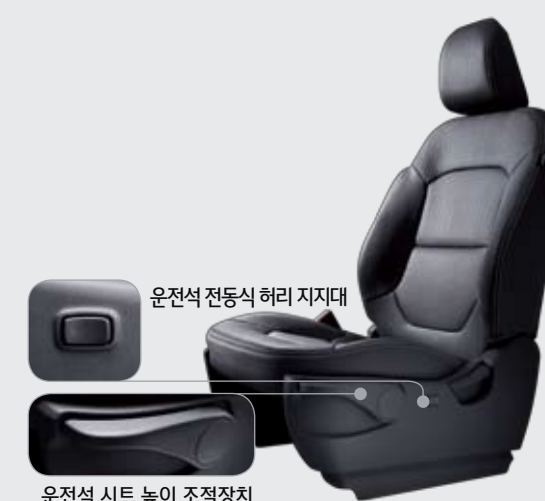
운전석 전동식 허리 지지대