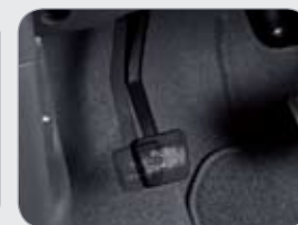
풋파킹 브레이크 *