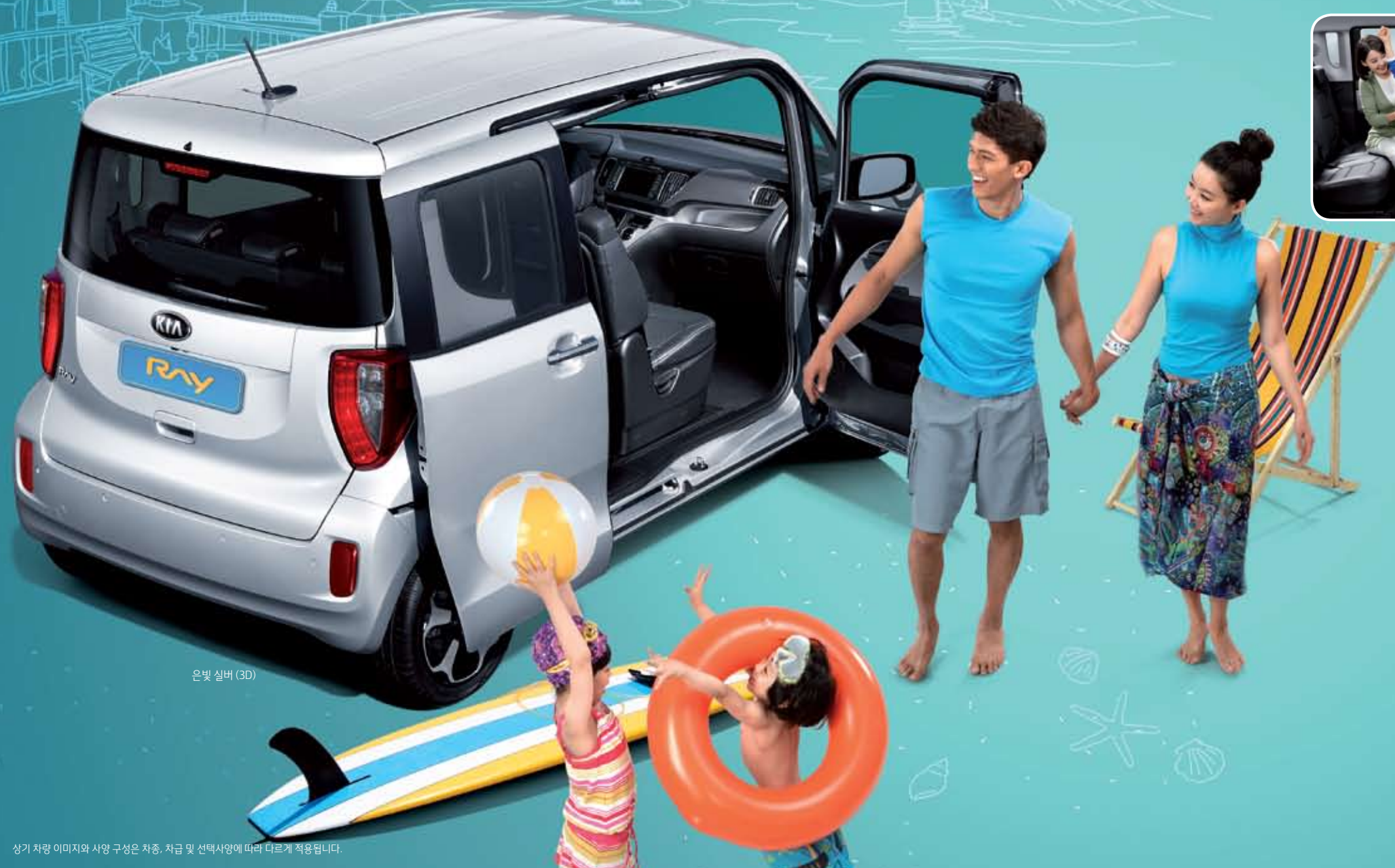
은빛 실버 (3D)

상기 차량 이미지와 사양 구성은 차종, 차급 및 선택사양에 따라 다르게 적용됩니다.