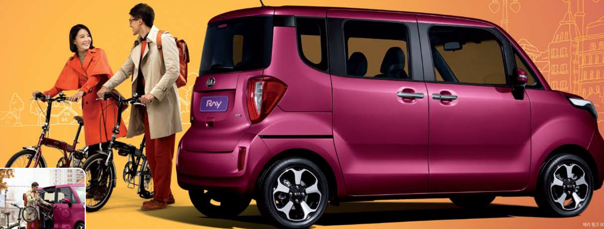
체리 핑크 (K1P)

상기 차량 이미지와 사양 구성은 차종, 차급 및 선택사양에 따라 다르게 적용됩니다.