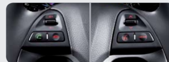
음성인식 블루투스 핸드프리 & 스티어링 휠 오디오 리모컨