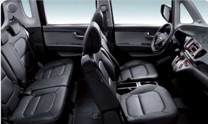
블랙 인조가죽 시트