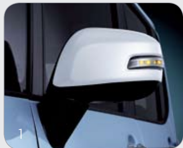
화이트 아웃사이드 미러