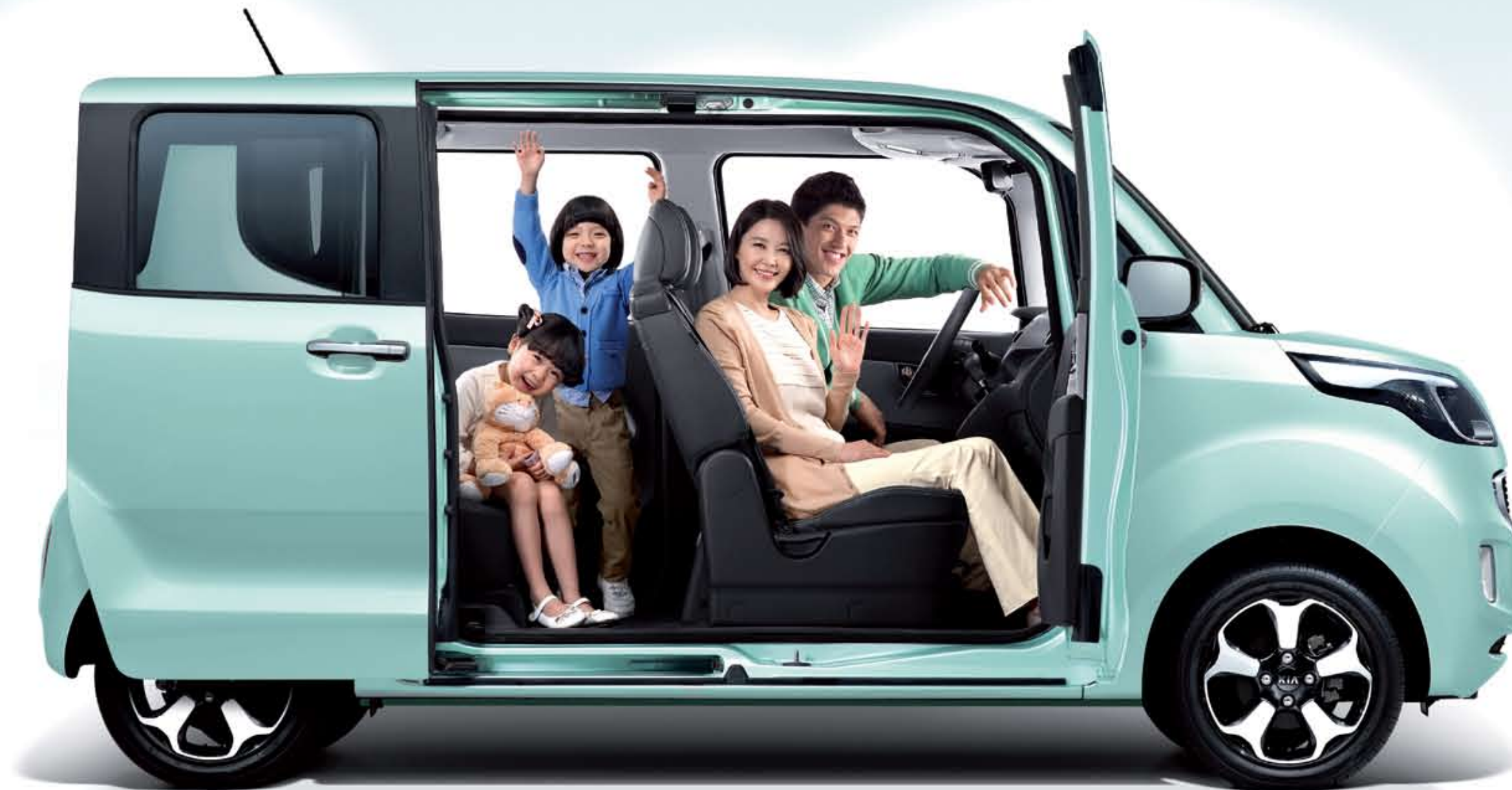
아쿠아 민트 (AEQ)

상기 차량 이미지와 사양 구성은 차종, 차급 및 선택사양에 따라 다르게 적용됩니다.