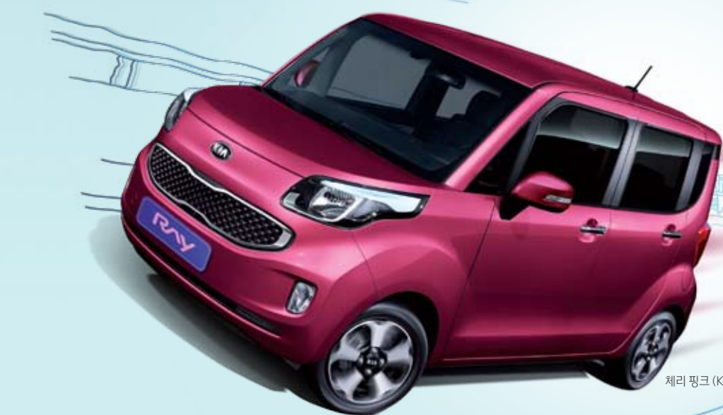
체리 핑크 (KIP)