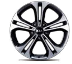
17인치 알로이 휠