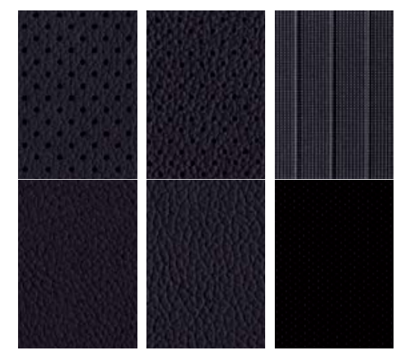
블랙 가죽 시트 블랙 인조가죽 시트 블랙 직물 시트 ※ 가죽시트는 가죽 및 인조가죽이 혼용되어 있습니다.