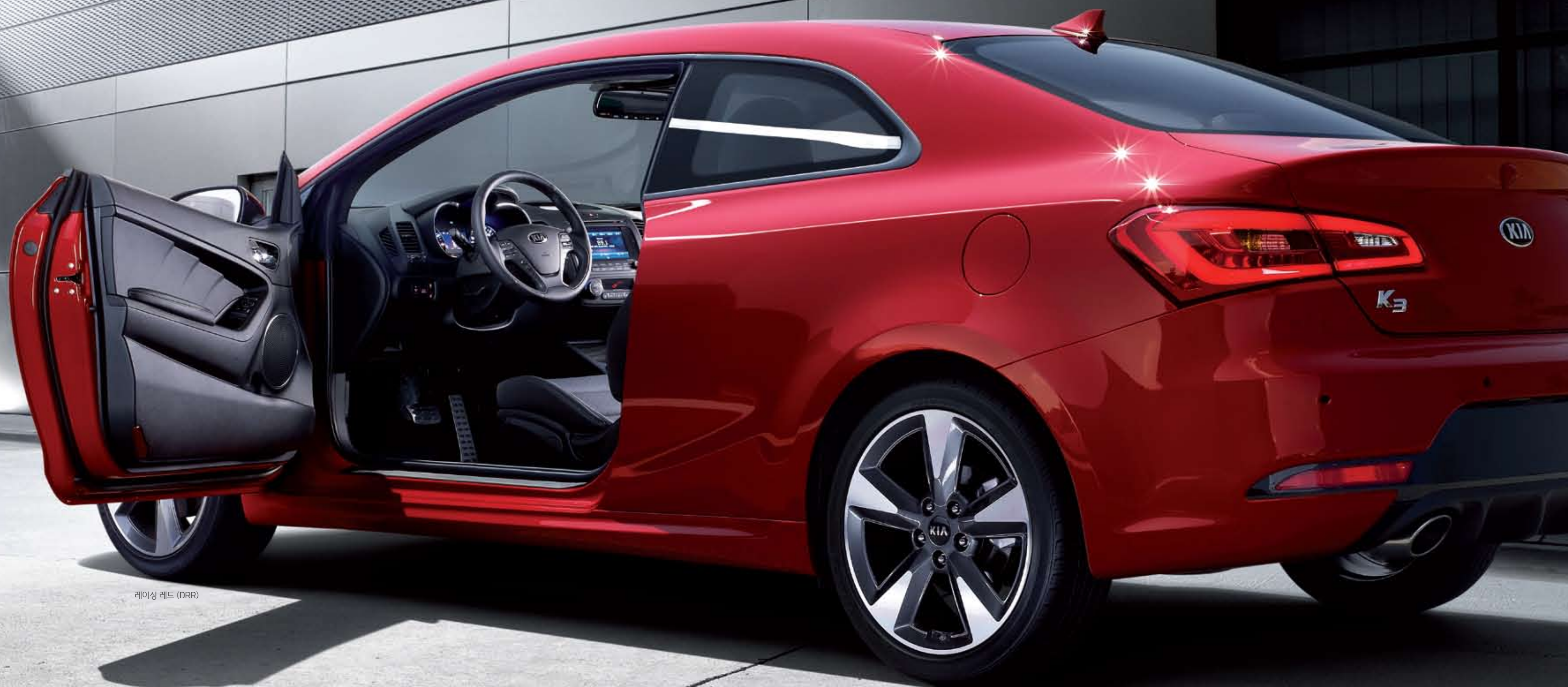
레이싱 레드 (DRR)