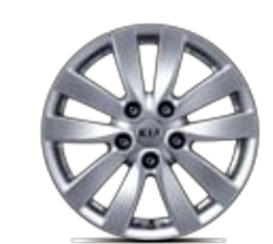
16인치 알로이 휠