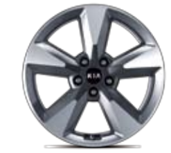
18인치 알로이 휠