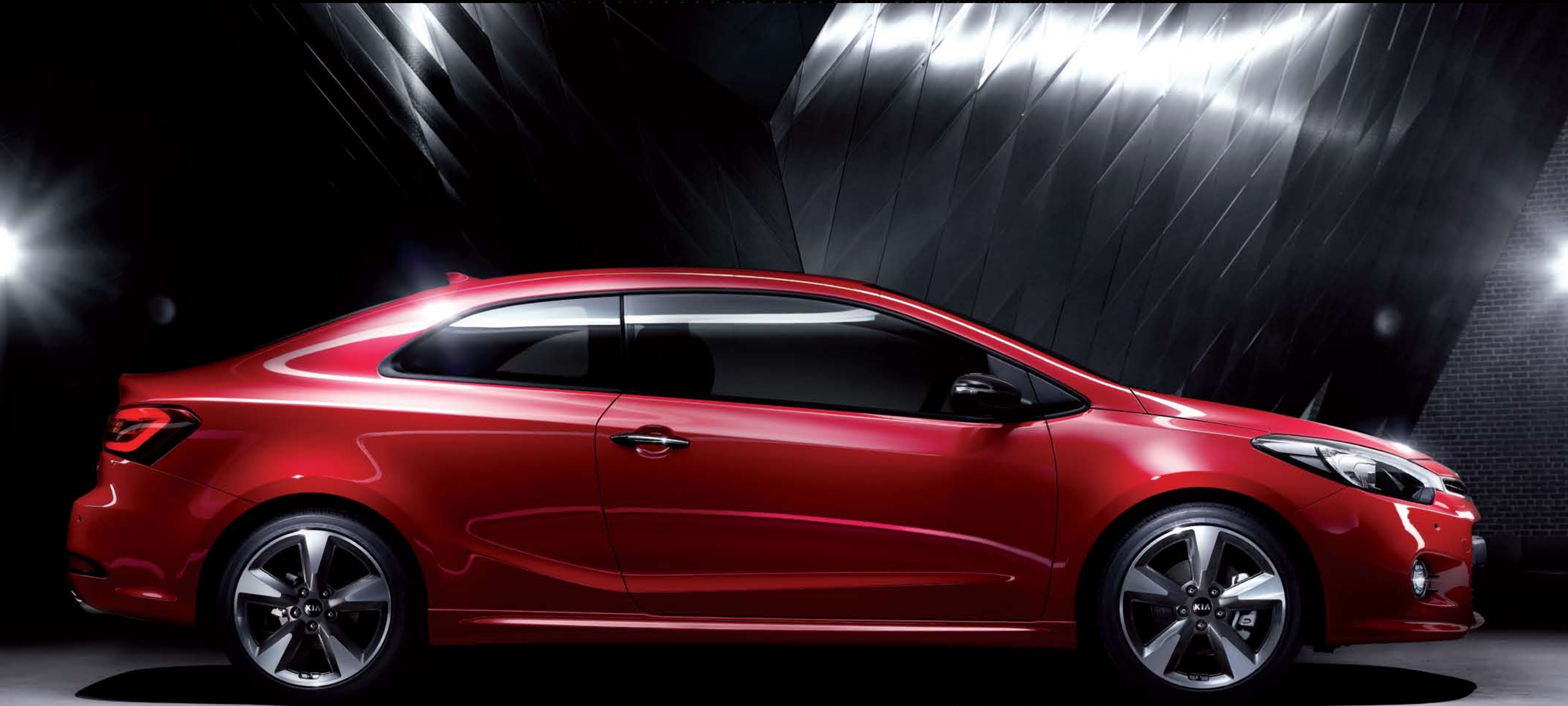
레이싱 레드 (DRR)