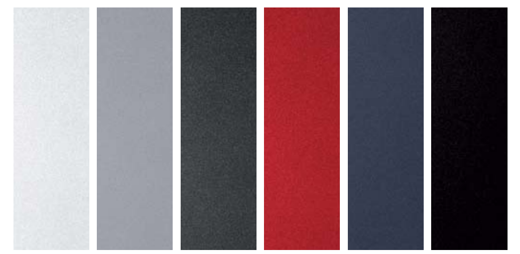
스노우 화이트 펄 (SWP) 실버 실버 (4SS) 메탈 스트림 (MST) 레이싱 레드 (DRR) 플래닛 블루 (D7U) 오로라 블랙 펄 (ABP)