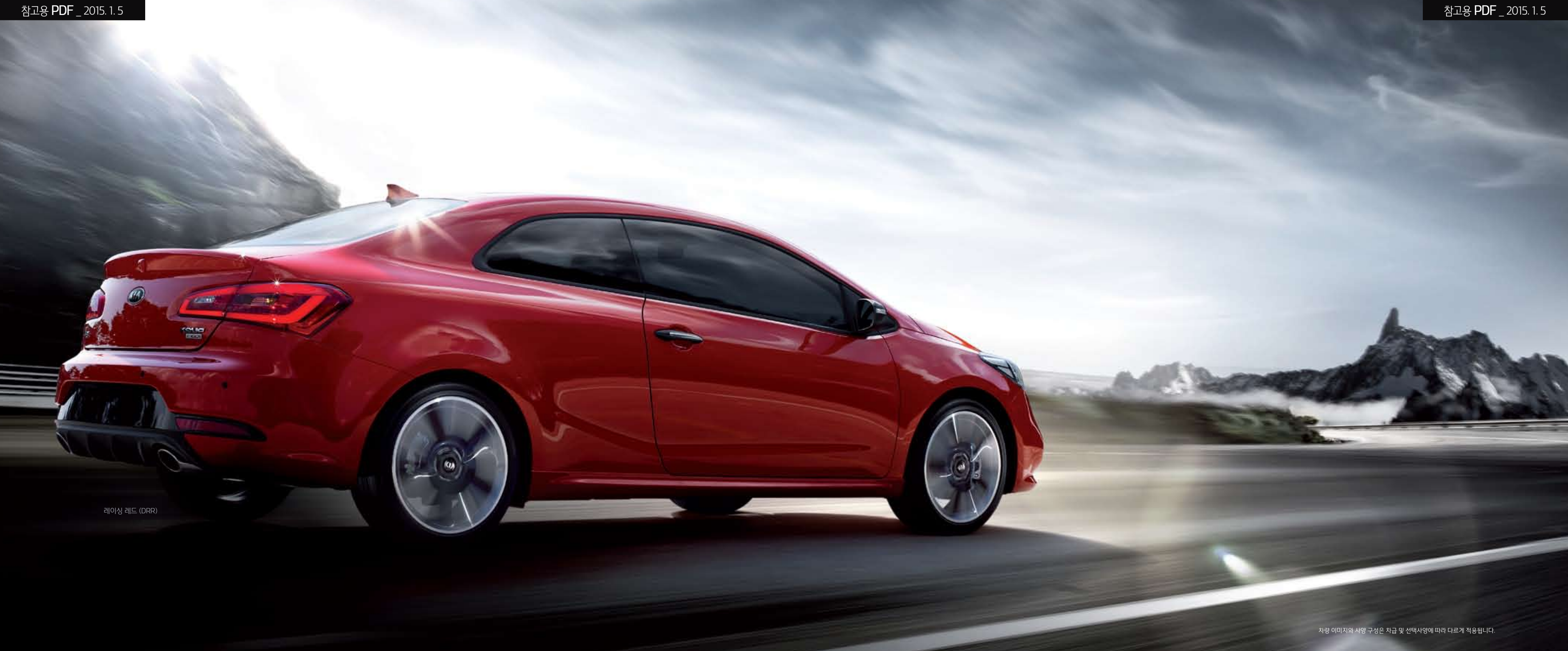
레이싱 레드 (DRR)