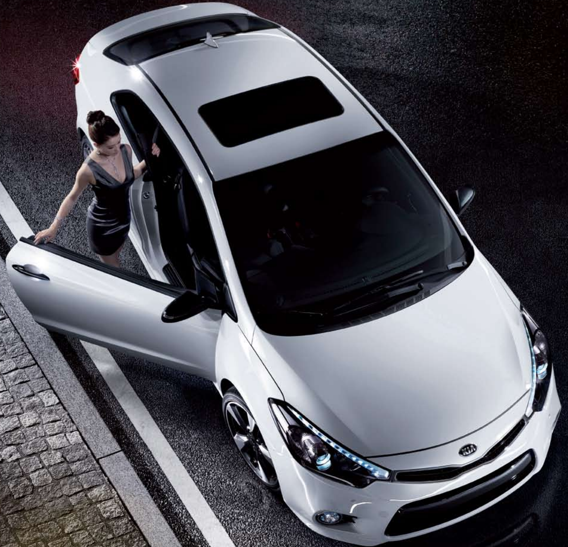
스노우 화이트 펄 (SWP)