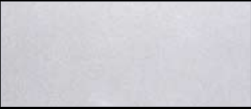
스노우 화이트 펄(SWP)