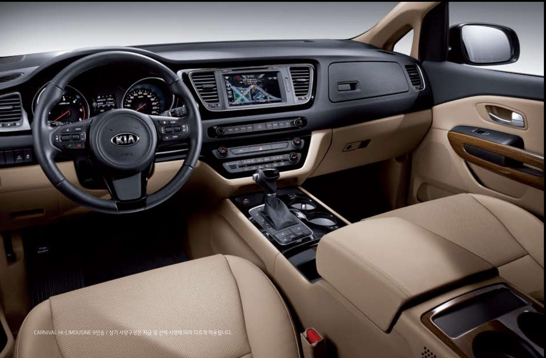
CARNIVAL HI-LIMOUSINE 9인승 / 상기 사양구성은 차급 및 선택 사양에 따라 다르게 적용됩니다.