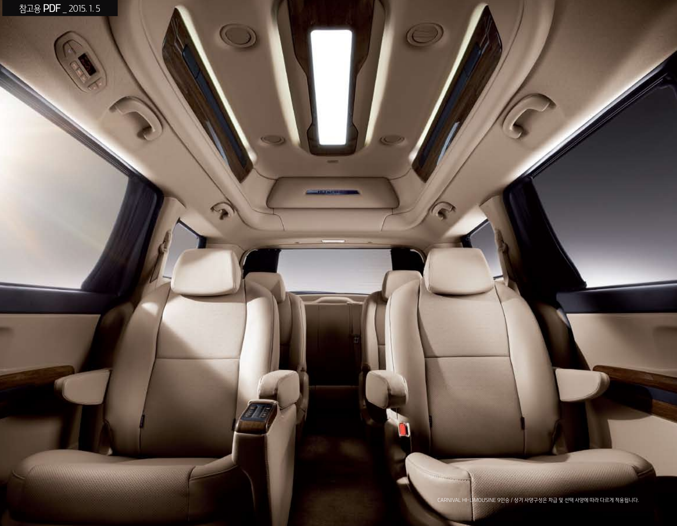
CARNIVAL HI-LIMOUSINE 9인승 / 상기 사양구성은 차급 및 선택 사양에 따라 다르게 적용됩니다.