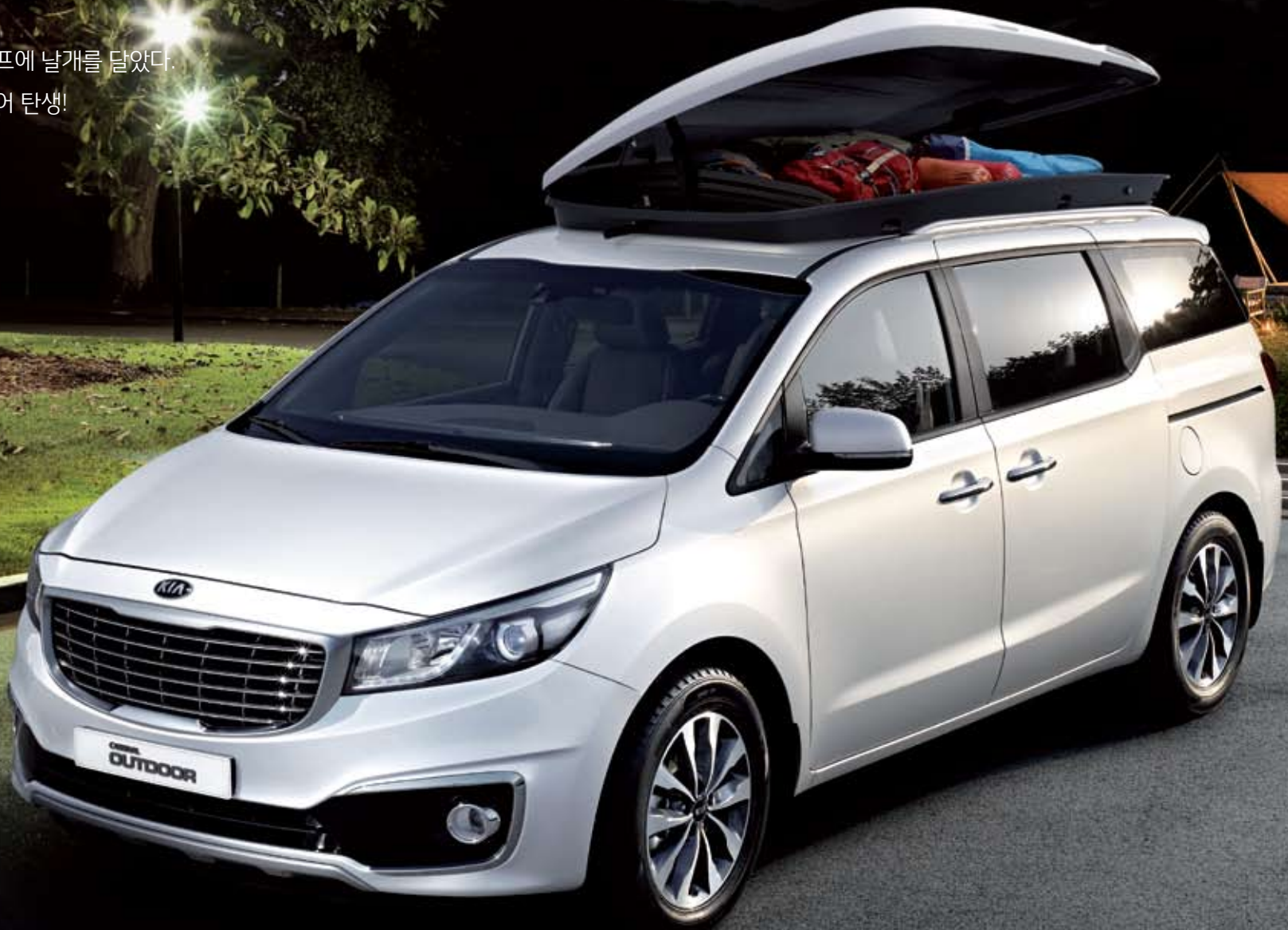
CARNIVAL OUTDOOR 9인승_ 스노우 화이트 펄(SWP) / 상기 사양구성은 차급 및 선택 사양에 따라 다르게 적용됩니다.