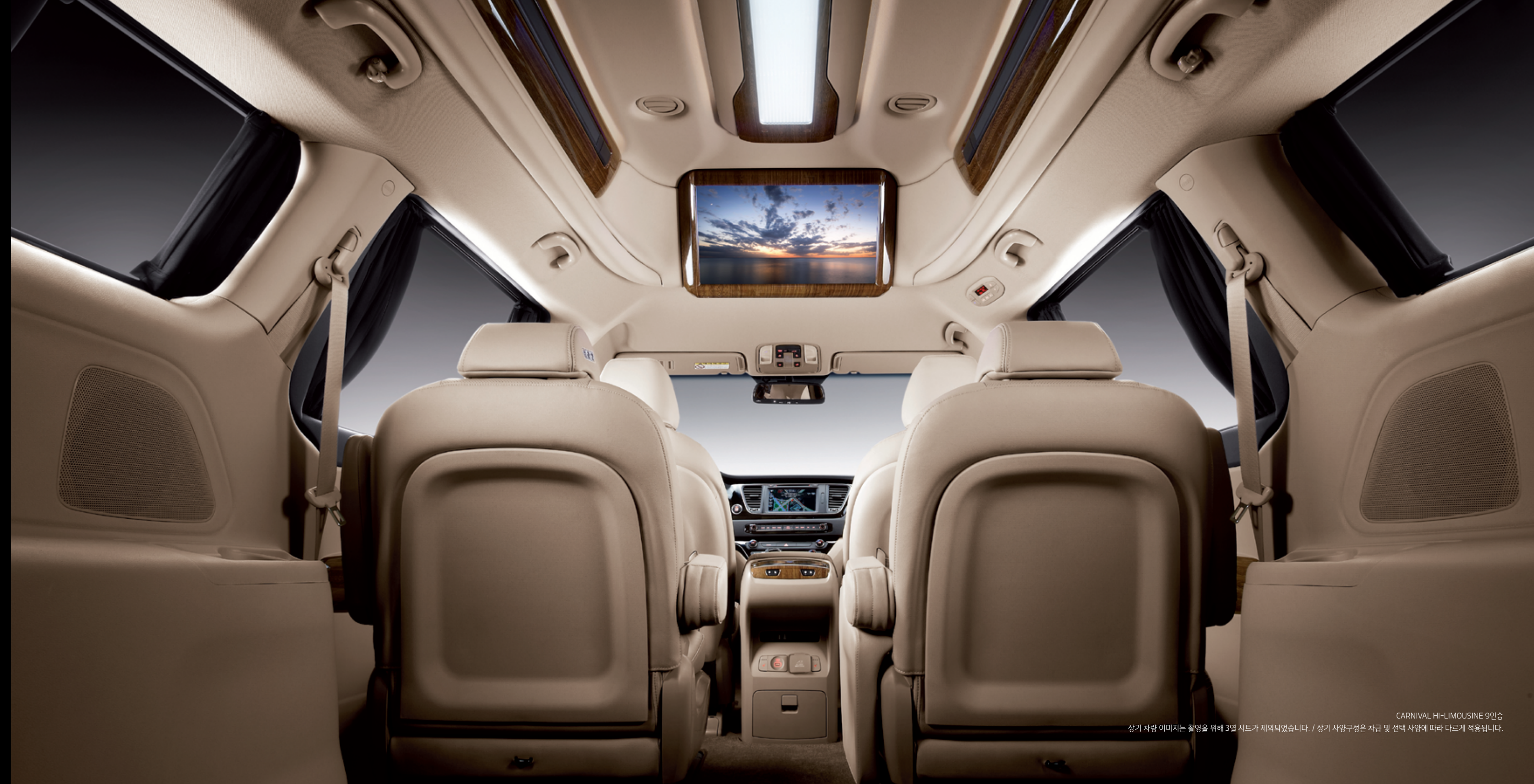
CARNIVAL HI-LIMOUSINE 9인승 상기 차량 이미지는 촬영을 위해 3열 시트가 제외되었습니다. / 상기 사양구성은 차급 및 선택 사양에 따라 다르게 적용됩니다.