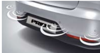
후방 주차 보조 시스템*