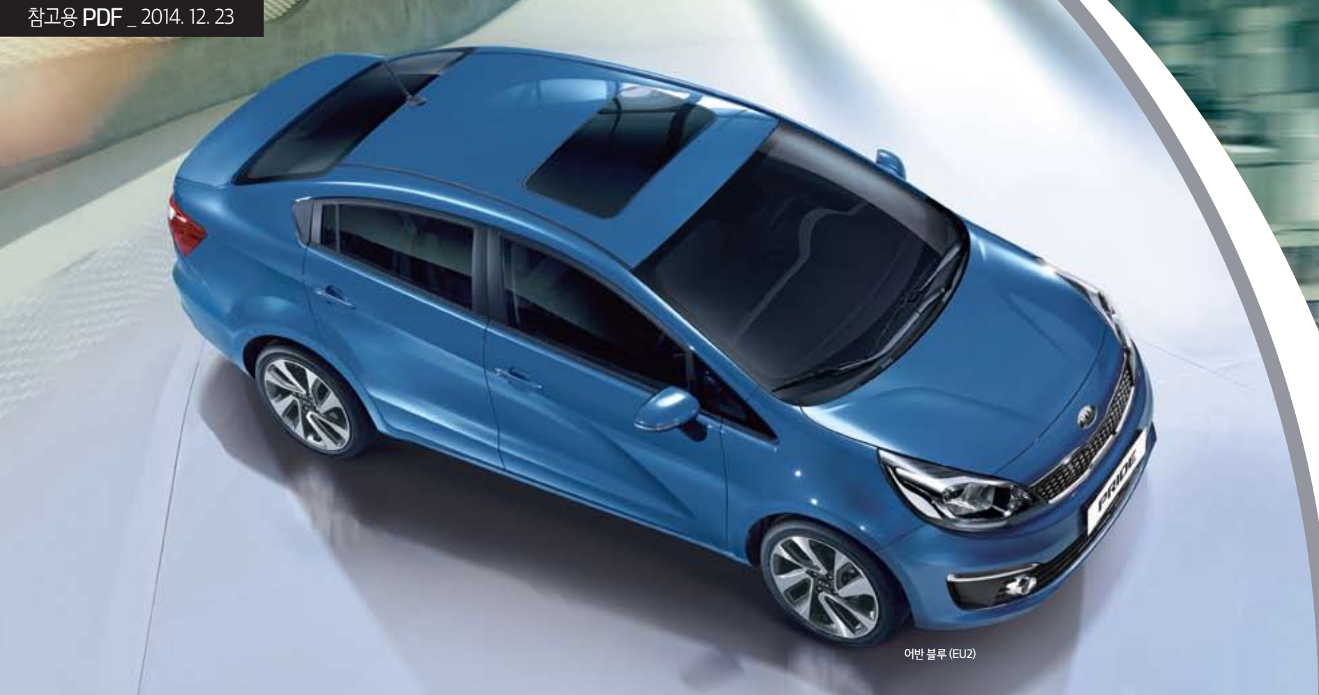
어반 블루 (EU2)