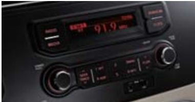
컴팩트 오디오 (MP3 재생)