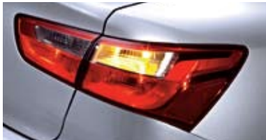
일반형 리어 콤비네이션 램프 (세단)