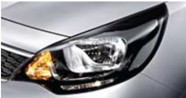
일반형 헤드램프 (세단)