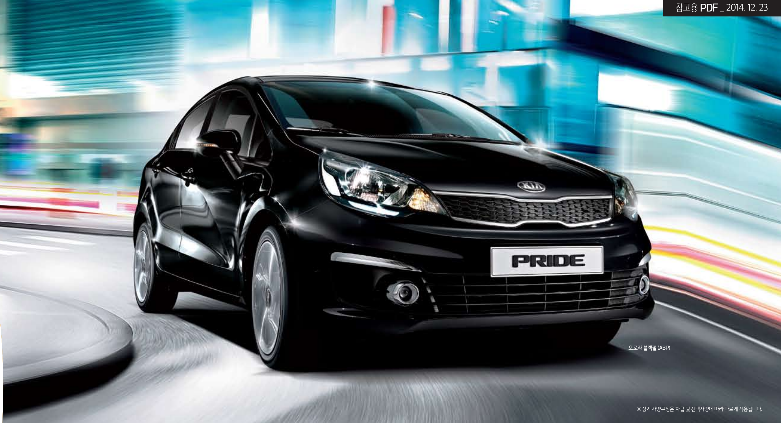
오로라 블랙필 (ABP)