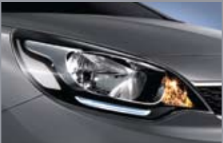
LED 포지션 램프