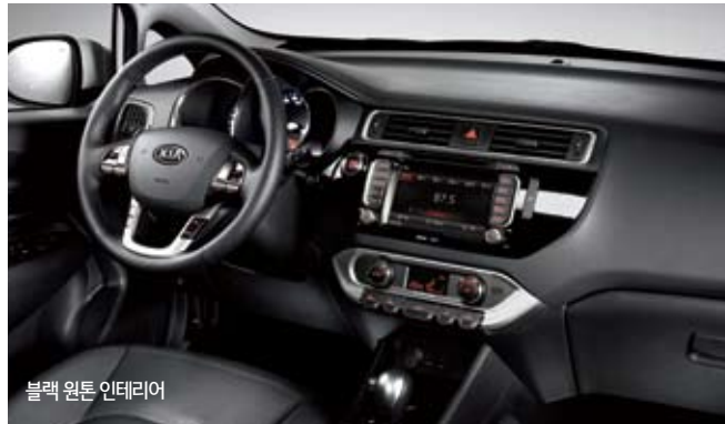
블랙 원톤 인테리어