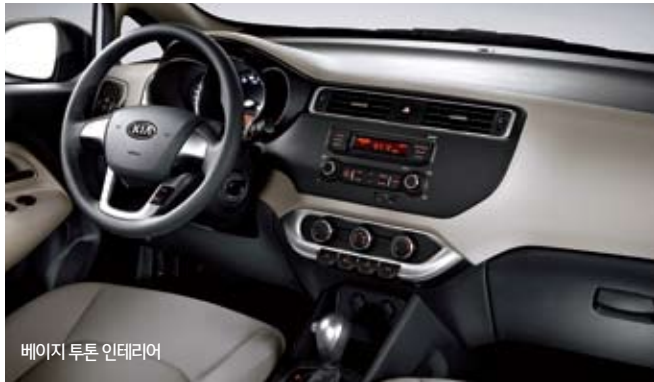
베이지 투톤 인테리어