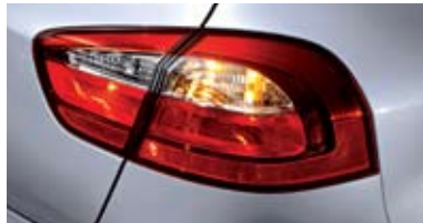
일반형 리어 콤비네이션 램프 (해치백)