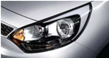
일반형 헤드램프 (해치백)