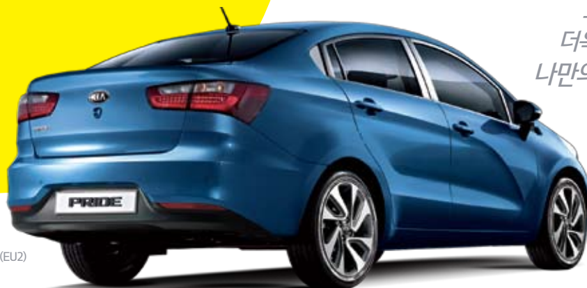
어반 블루 (EU2)

도시적인 개성으로 더욱 새로워진 프라이드, 나만의 일, 나다운 길을 향한 즐거운 질주에 스타일을 더하다!