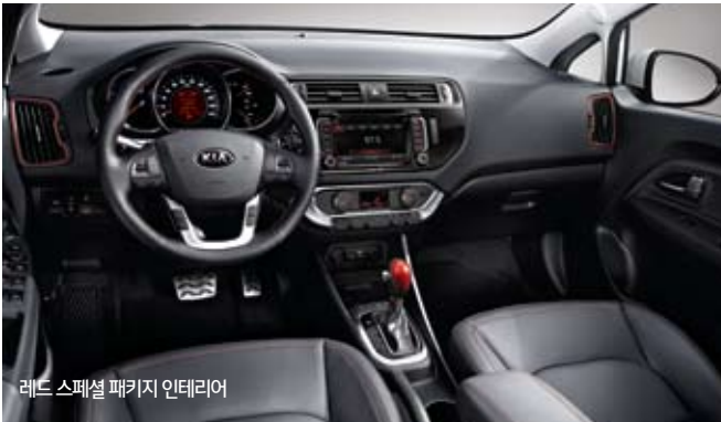
레드 스페셜 패키지 인테리어