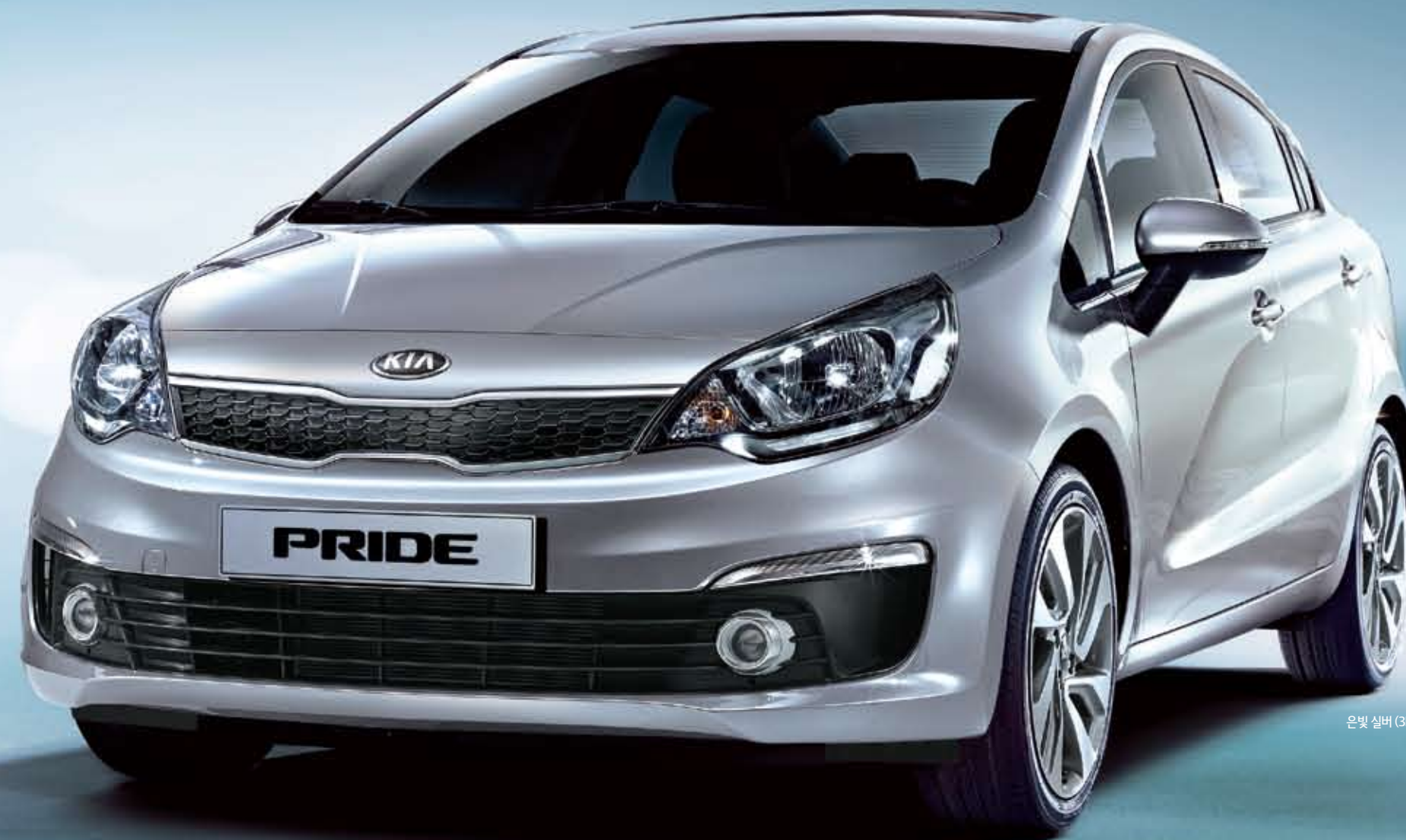
은빛 실버 (3D)