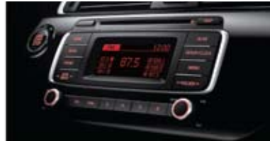
CDP 오디오 (MP3 재생)