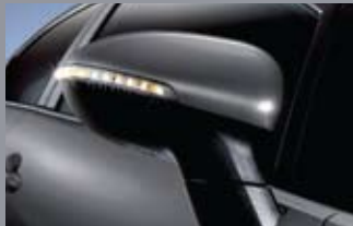
LED 리피터 일체형 아웃사이드 미러