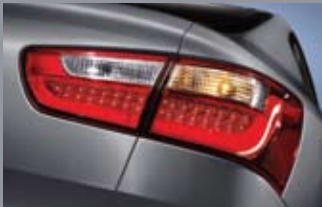
LED 리어 콤비네이션 램프