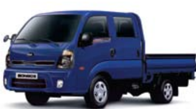
1톤 초장축 더블캡 _ 진감청(MA)