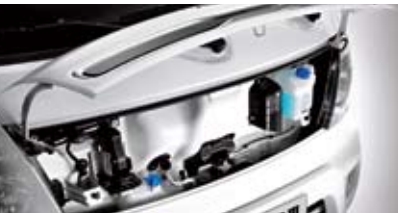
프런트 오픈 패널