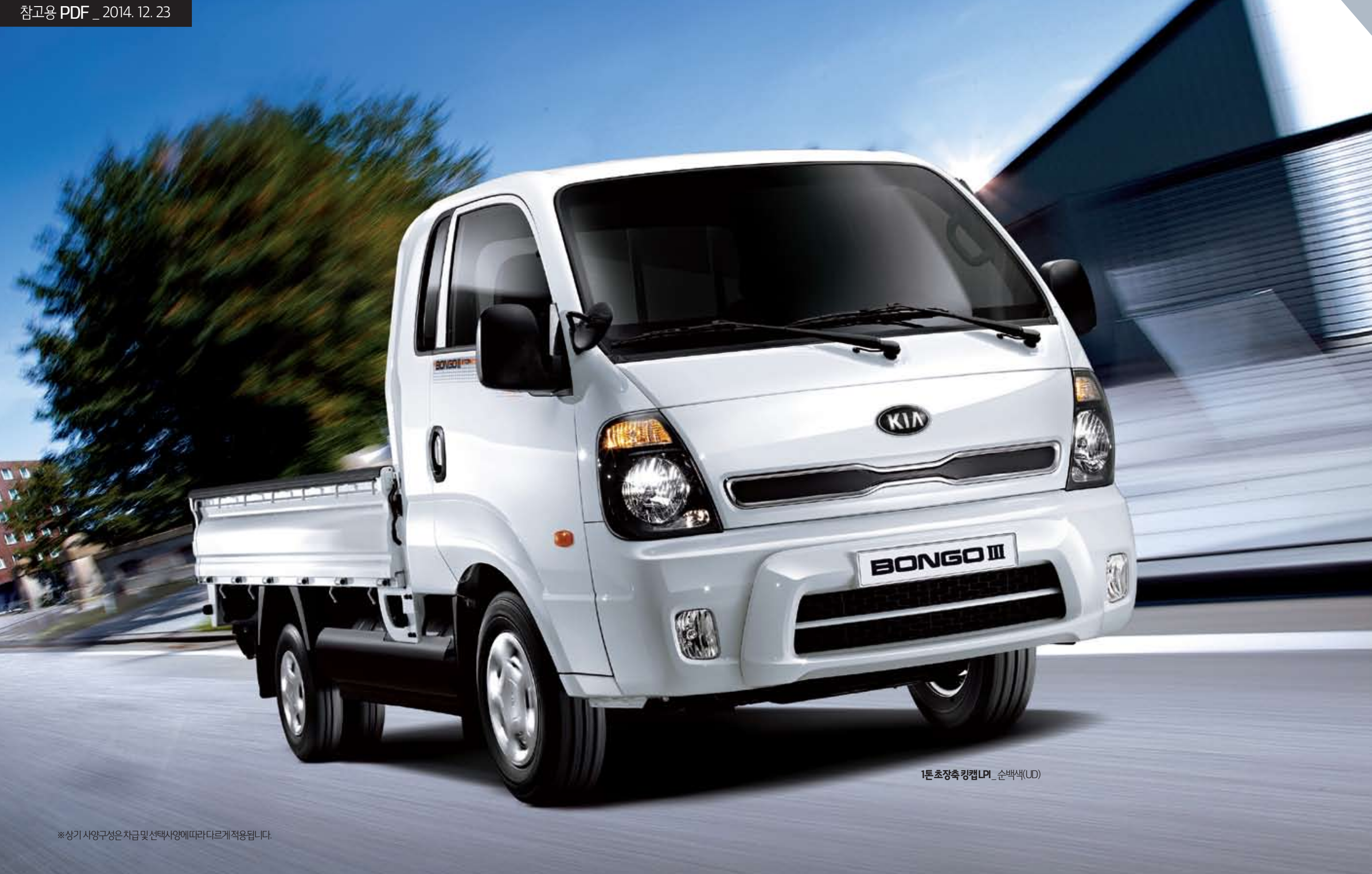
1톤 초장축 킹캡 LPI_순백색(UD)