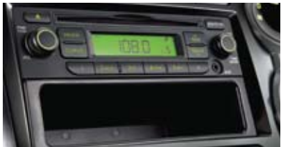
1단 CDP 오디오