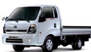
1톤 초장축 킹캡 _ 순백색(UD)