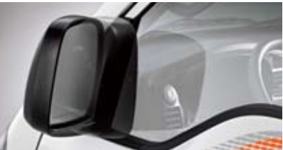
전동접이 아웃사이드 미러 *