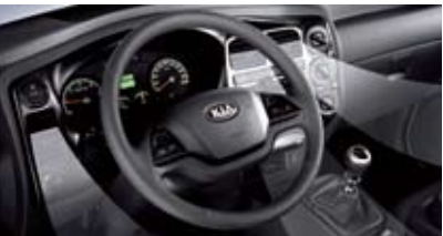
PTC 히터 *