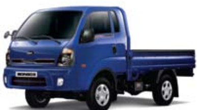
1톤 4WD 장축 킹캡 _ 진감청(MA)