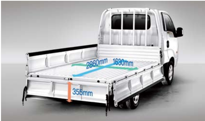
적재함 * 1톤 초장축 킹캡 기준