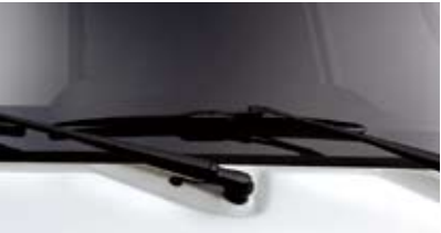
에어로 타입 와이퍼