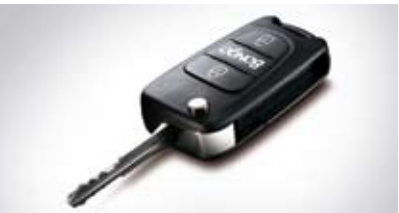
폴딩타입 무선도어 리모컨 키