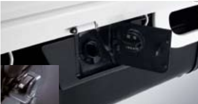
승용형 연료 주입구