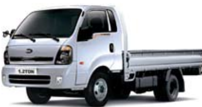
1.2톤 초장축 킹캡 _ 순백색(UD)