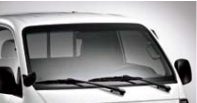
자외선 차단 글라스 (윈드실드)