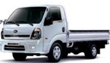
1톤 초장축 표준캡 _ 순백색(UD)