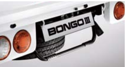
스텝 겸용 리어 가이드