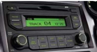
2단 CDP 오디오 (MP3 재생)