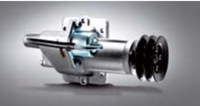
PTO (동력인출장치 _ Power Take Off)