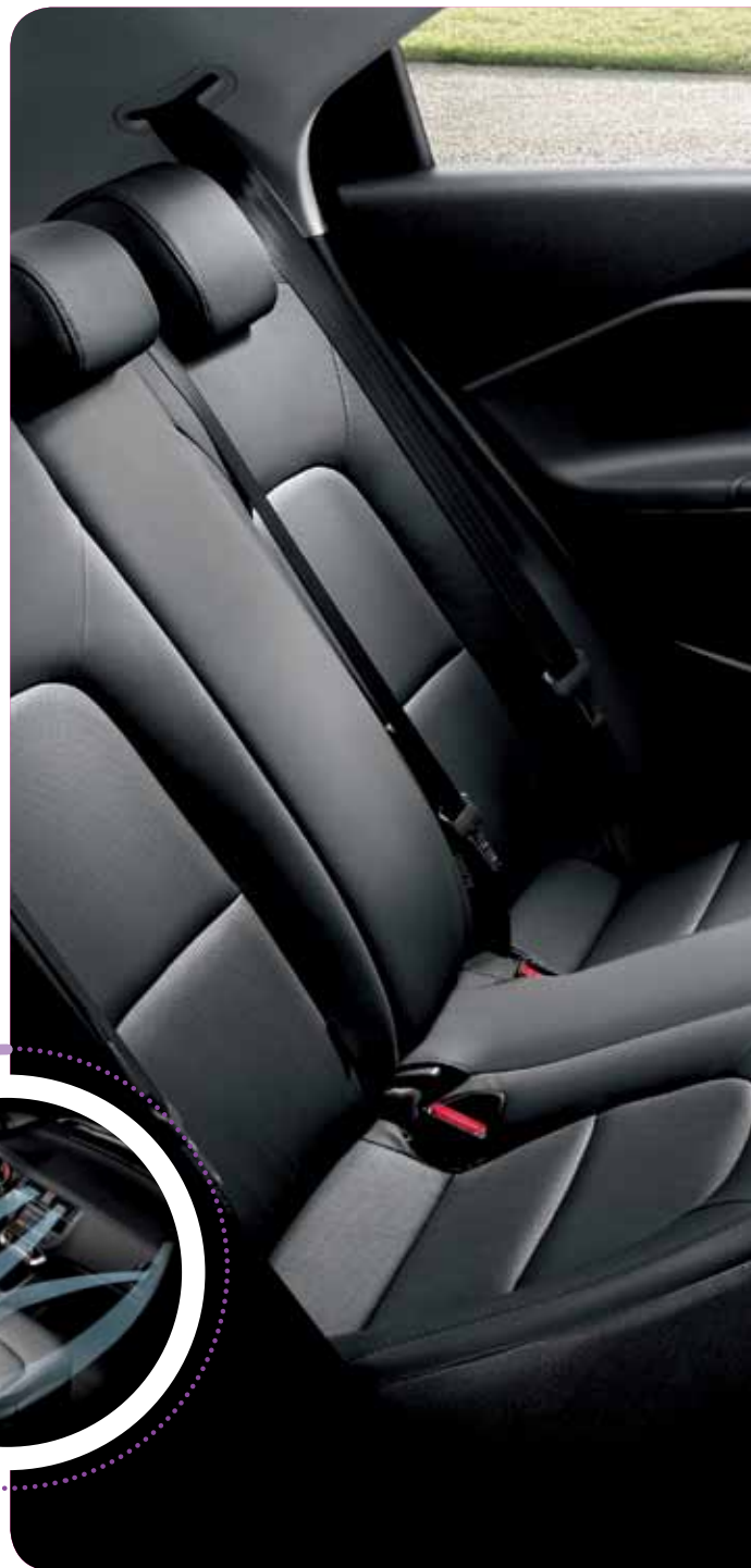
Version Premium équipée du pack V.I.P. et du système de navigation