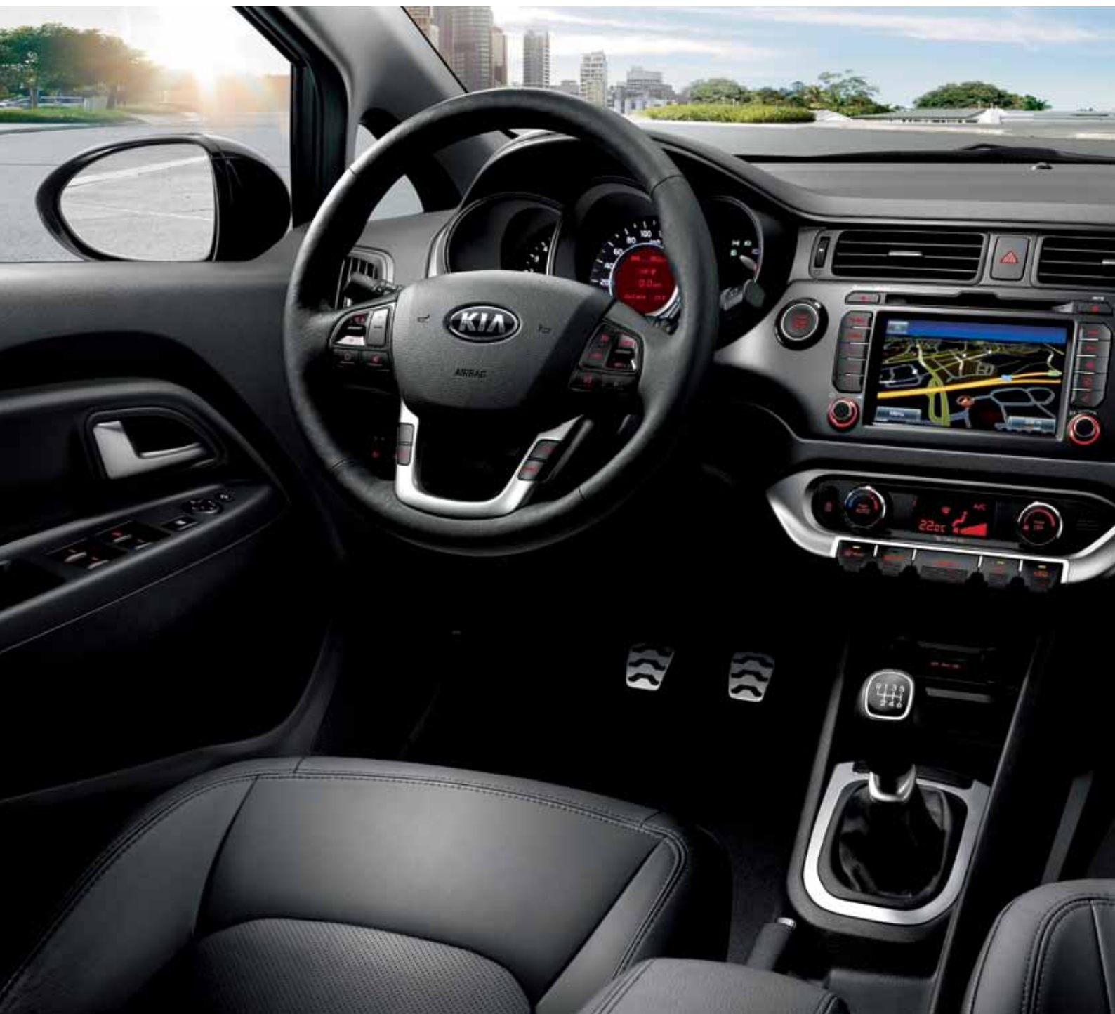
Version Premium équipée du pack V.I.P. et du système de navigation.