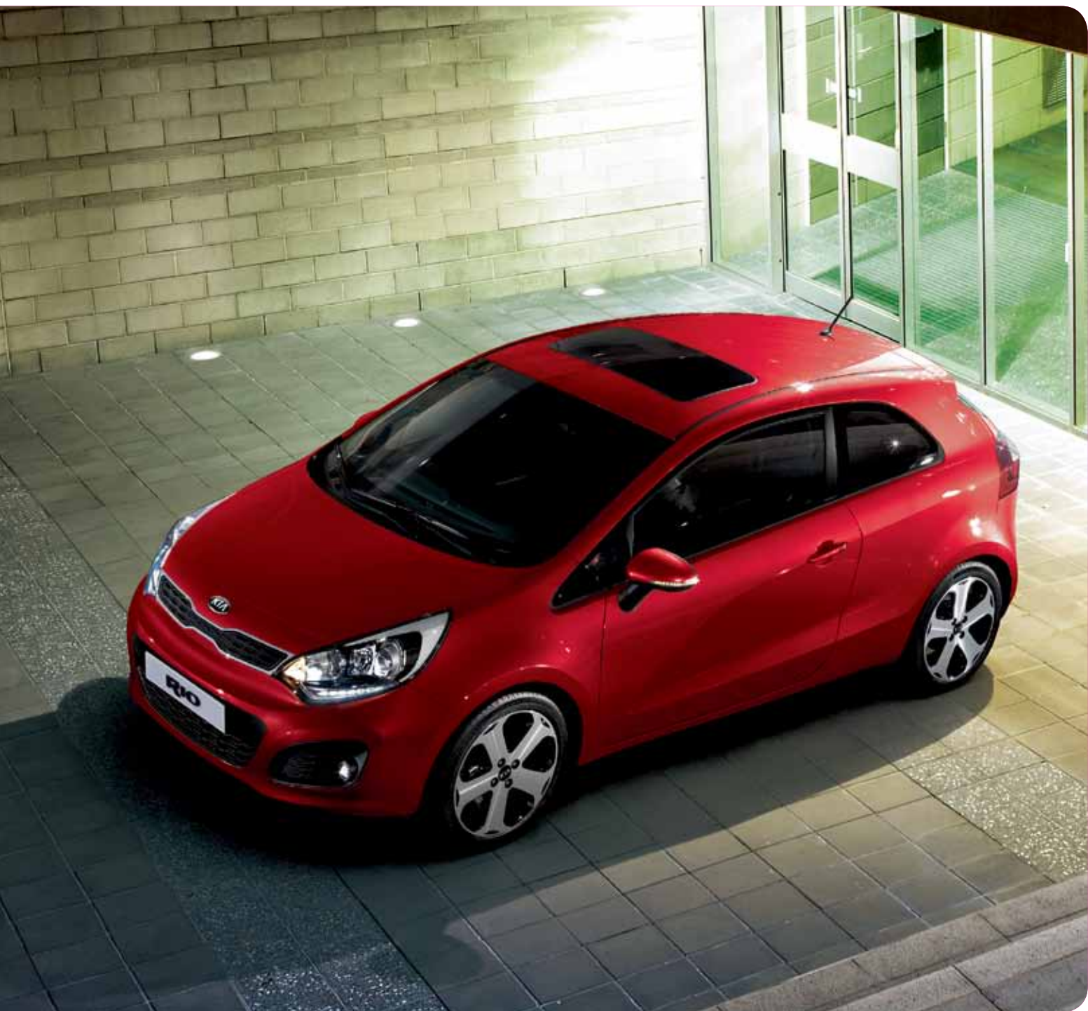
Version Sport équipée du pack V.I.P.