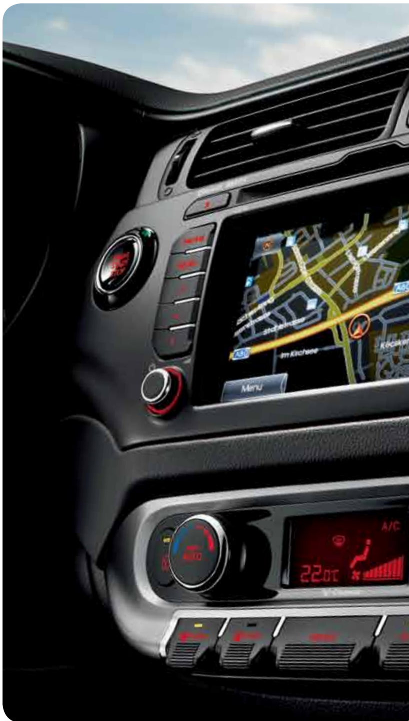
Version Premium (ou Sport) équipée du système de navigation.