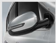
리미터 일체형 아웃사이드 미러