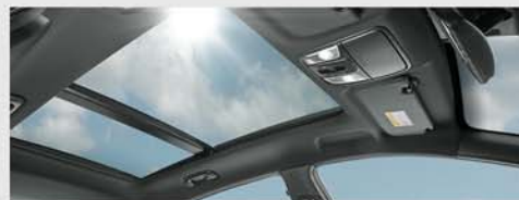
와이드 파노라마 선루프