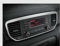
캠팩트 오디오 (MP3 재생)