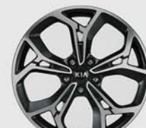
19인치 럭셔리 알로이 휠