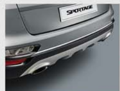
듀얼 탭 데코 가니쉬