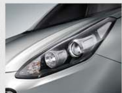
프로텍션 헤드램프 & 벌브 DRL