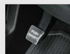
풋 파킹 브레이크