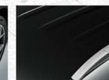
루프 스킨 (블랙)