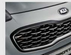
핫 스템핑 라디에이터 그릴