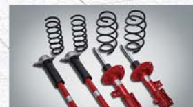
숙염스퍼 & 스프링