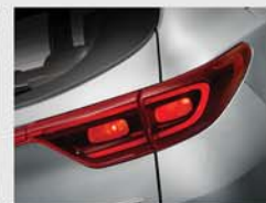
일반형 리어 콤비네이션 램프