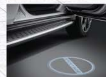
도어 스텍 램프