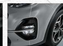
차량 보호 필름*