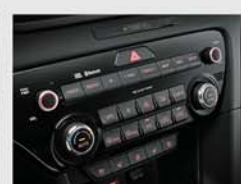
풀 오토 에어컨