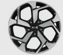
17인치 럭셔리 알로이 휠