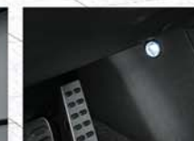
풋 우드 램프