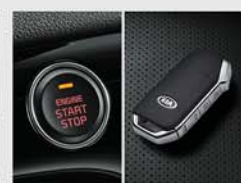
버튼시동 스마트키 시스템