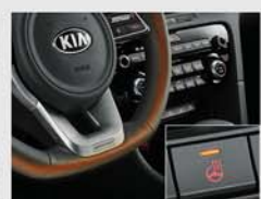
히트드 스티어링 휠*