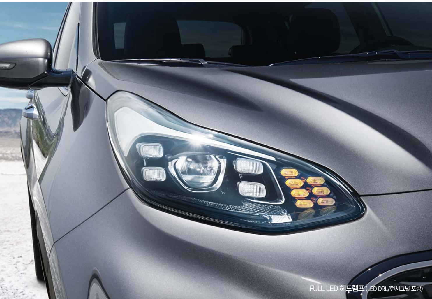
FULL LED 헤드램프 (LED DRL/턴시그널 포함)

스틸 그레이 (KLG) * 상기 사양구성은 트림, 엔진 및 선택 사양에 따라 다르게 적용됩니다.