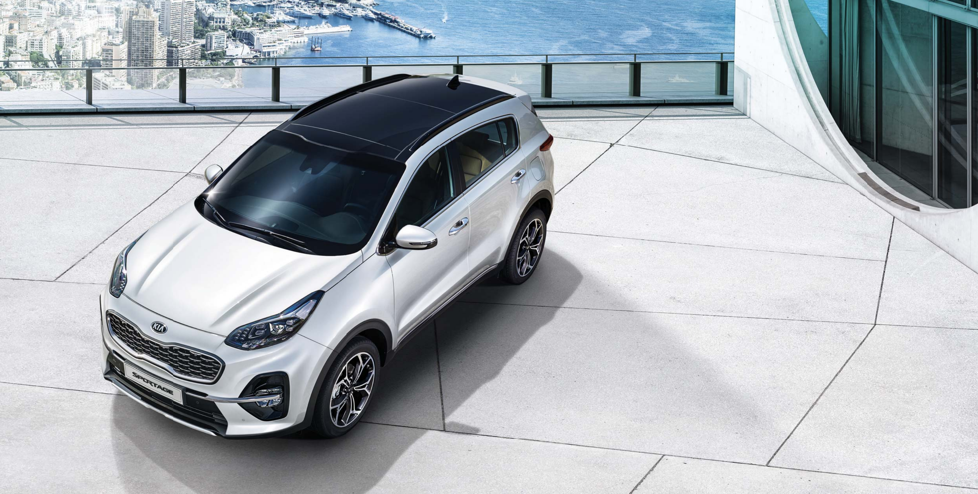
스노우 화이트 펄 (SWP) * 상기 사양구성은 트림, 엔진 및 선택 사양에 따라 다르게 적용됩니다.