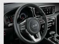
라운드 스티어링 휠