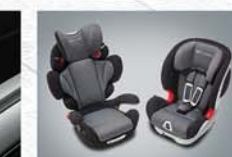
카시트 2종 (좌: 아동용 / 우: 유아용)

* T-ON 상품에 대한 안내 사항은 홈페이지나 가격표를 참고해주시기 바랍니다.