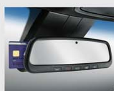
전자식 룸미러 (ECM) & 자동요금 징수시스템 (ETCS) ※ LVC* 사양 기준