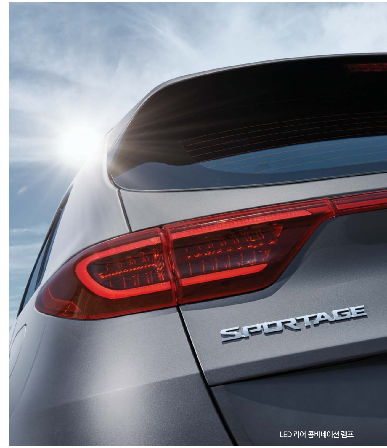
LED 리어 콤비네이션 램프