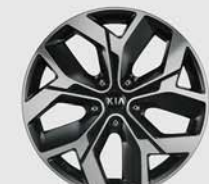
18인치 럭셔리 알로이 휠