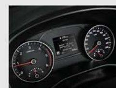
고급형 클러스터 (3.5인치 모노 TFT LCD)