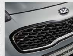
다크그레이 펠 라디에이터 그릴