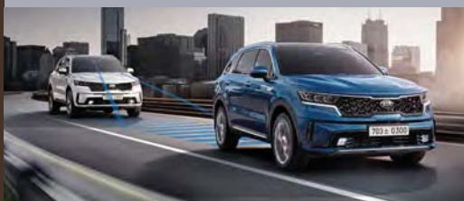
차로 유지 보조 & 고속도로 주행 보조