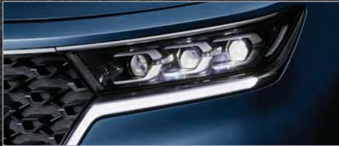
프로젝션 LED 헤드램프