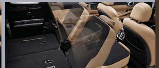
스마트 원터치 폴딩