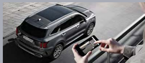
리모트 360° 뷰(내 차 주변 영상)