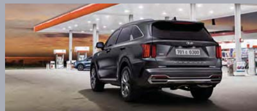
KIA PAY(차량 내 간편 결제)