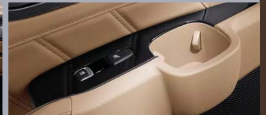
도어 암레스트 컵홀더