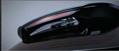
히든 리어 와이퍼