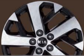
18인치 전면가공 휠