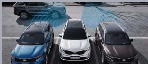
주차 충돌방지보조 & 후방 교차 충돌방지보조