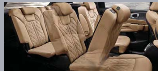
스마트 원터치 워크인