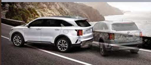
다중 충돌방지 자동 제동 시스템