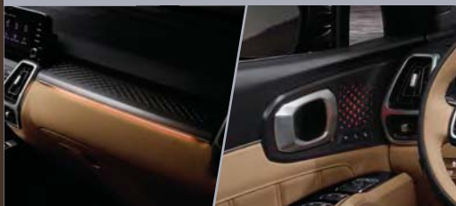
크리스탈 라인 무드 라이팅