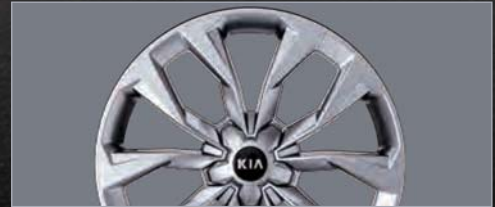
20인치 스피터링 휠