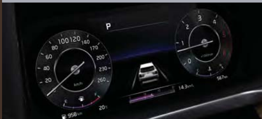
12.3인치 풀 사이즈 칼라 TFTLCD 클러스터