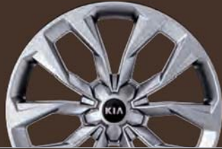
20인치 스퍼터링 휠