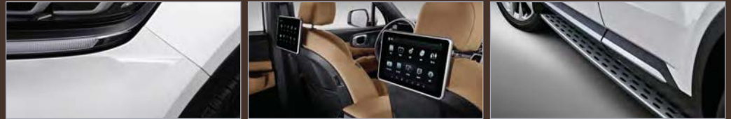
차량 보호 필름 _ 40만원