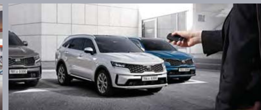
원격 스마트 주차 보조