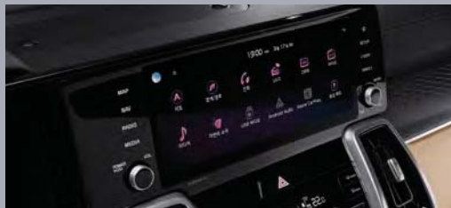
10.25인치 UVO 내비게이션