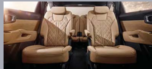
2열 독립 시트