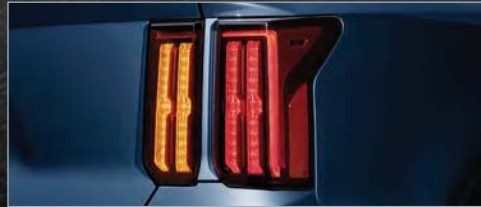
버티컬 타입 LED 리어 콤비네이션 램프