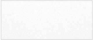
스노우 화이트 펄 (SWP)

세련된 외관 스타일과 인테리어, 첨단 편의 장비까지, K7 택시는 귀하의 비즈니스를 더욱 여유롭게 만들어드립니다.