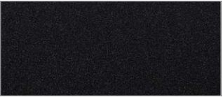
오로라 블랙 펄 (ABP)