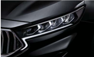
LED 헤드램프 & LED DRL