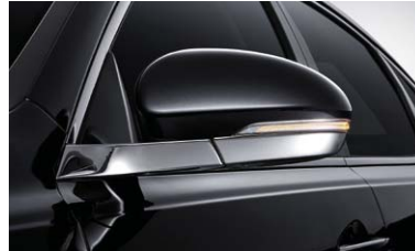
LED 리피터 일체형 크롬 아웃사이드 미러