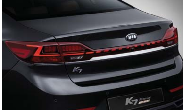
LED 리어 콤비네이션 램프