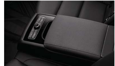
뒷좌석 다기능 센터 암레스트