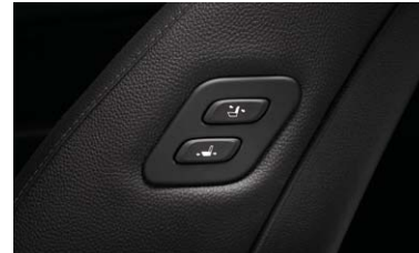
동승석 워크인 디바이스