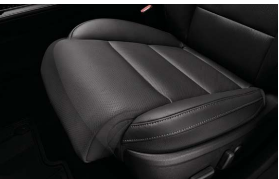
운전석 4WAY 전동식 허리지지대