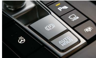
전자식 파킹 브레이크 (EPB)