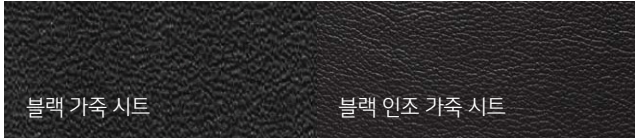
블랙 가죽 시트