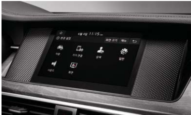
8인치 디스플레이 오디오