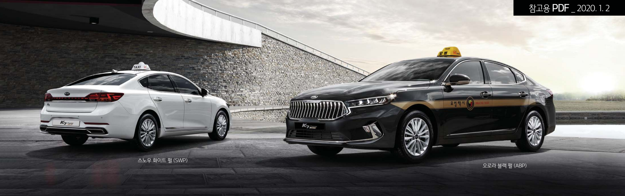
스노우 화이트 펄 (SWP)