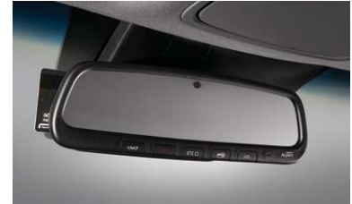
자동 요금징수 시스템 (ETCS)