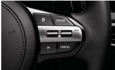
크루즈 컨트롤 (정속주행장치)