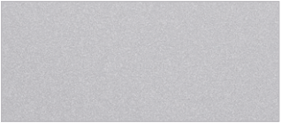
실키 실버 (4SS)