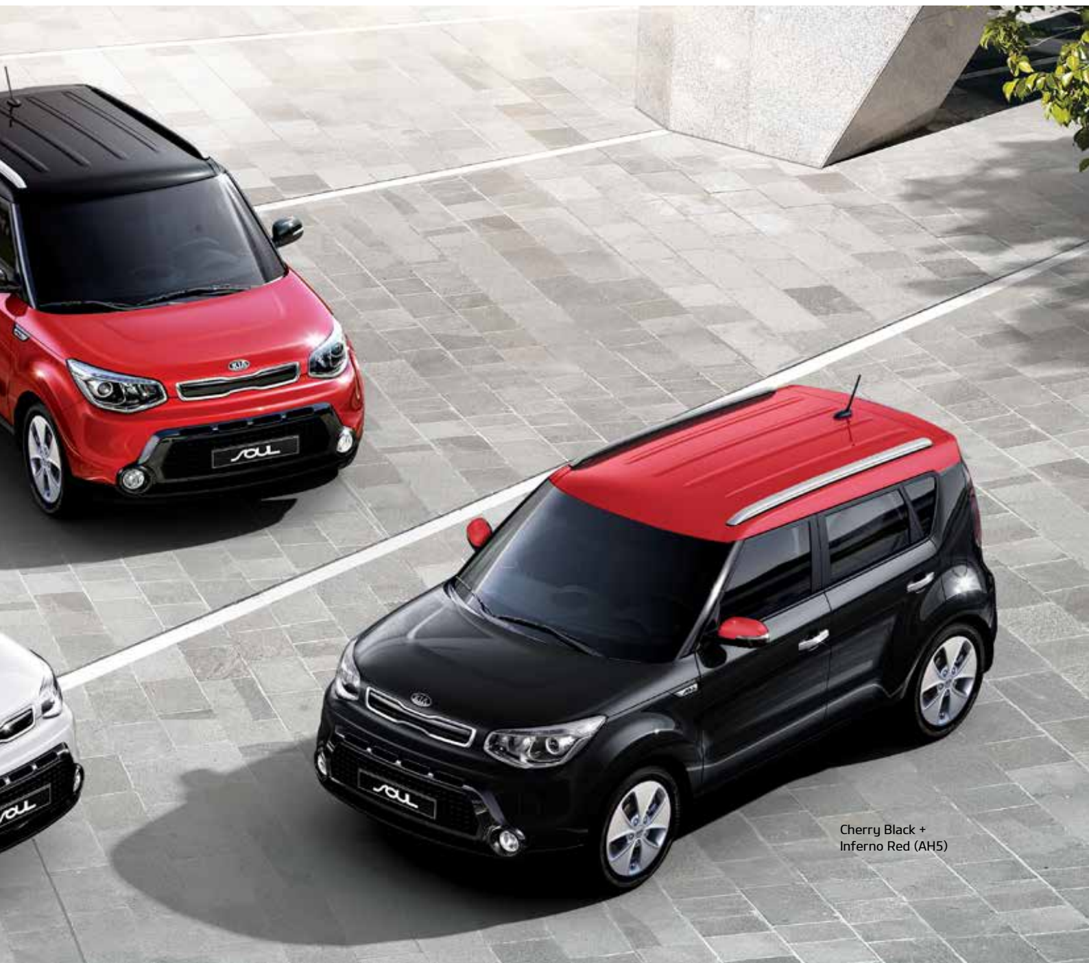
Cherry Black + Inferno Red (AH5)