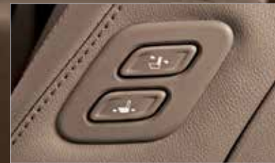
동승석 워크인 디바이스 운전자가 손쉽게 동승석의 위치와 각도를 조절하여 뒷좌석 및 동승석 탑승자에게 편의성을 제공합니다.