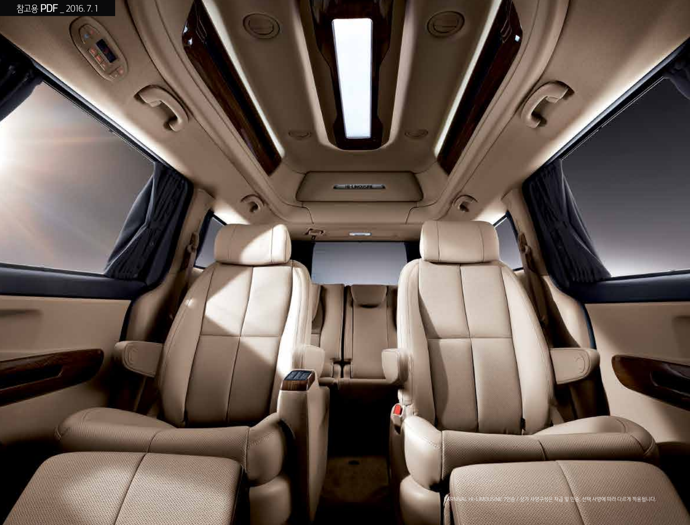
CARNIVAL HI-LIMOUSINE 2인승 / 상가 사양구성은 차급 및 인승, 선택 사양에 따라 다르게 적용됩니다.