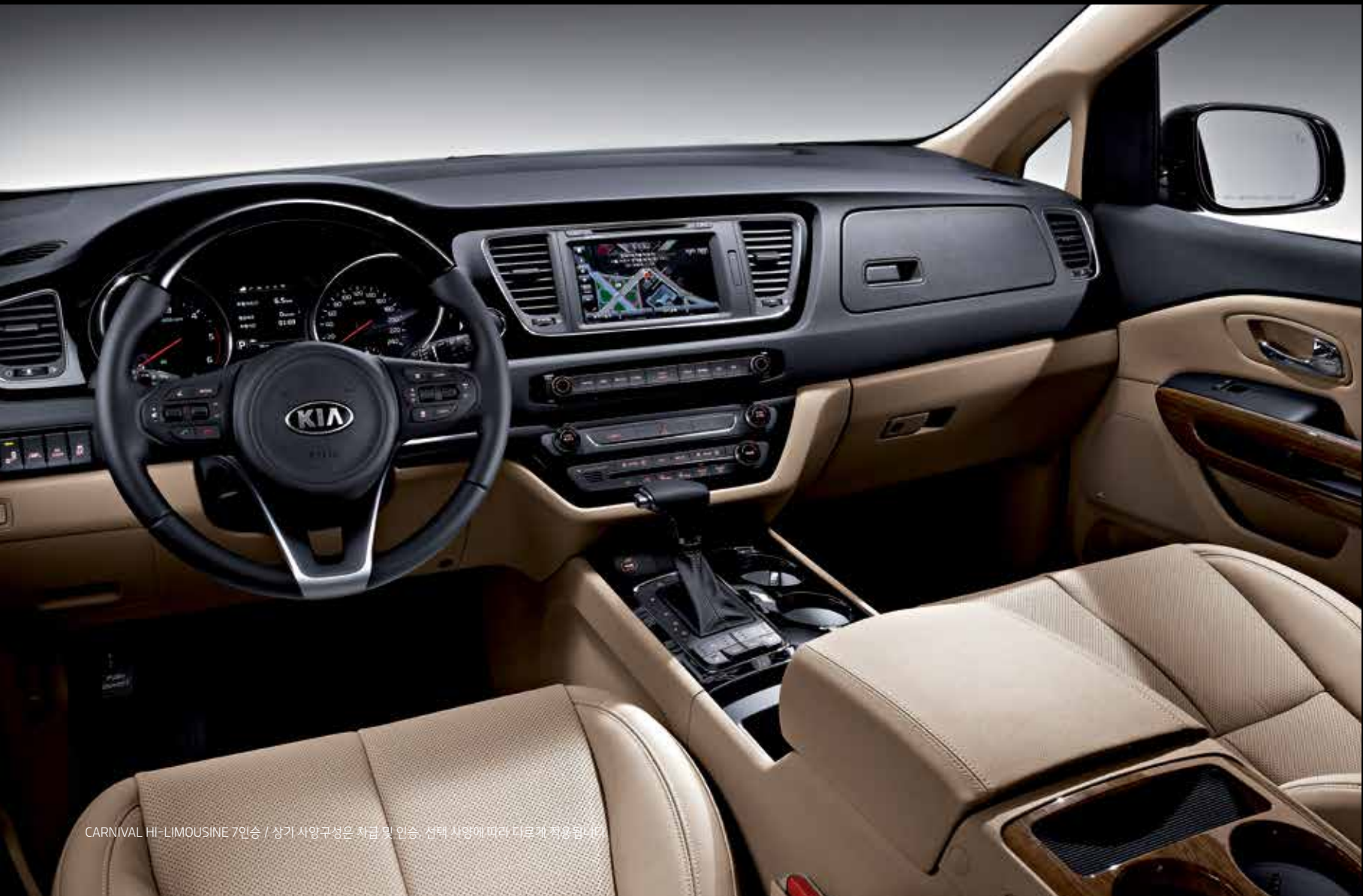
CARNIVAL HI-LIMOUSINE 7인승 / 상거 사양구성은 차급 및 인승, 선택 사양에 따라 다르게 적용됩니다.

넓은 공간 곳곳에 숨어있는 럭셔리한 편의 장비, 거실을 고스란히 옮겨온 듯 편안함을 느낄 수 있습니다.