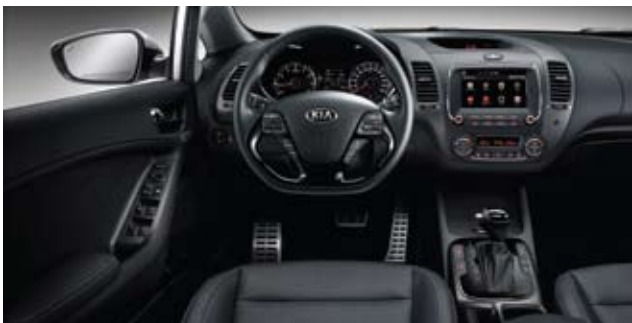
블랙 원톤 인테리어 (가죽 / 인조가죽 / 직물 시트) ※ 인조가죽 시트 쿵 미적용