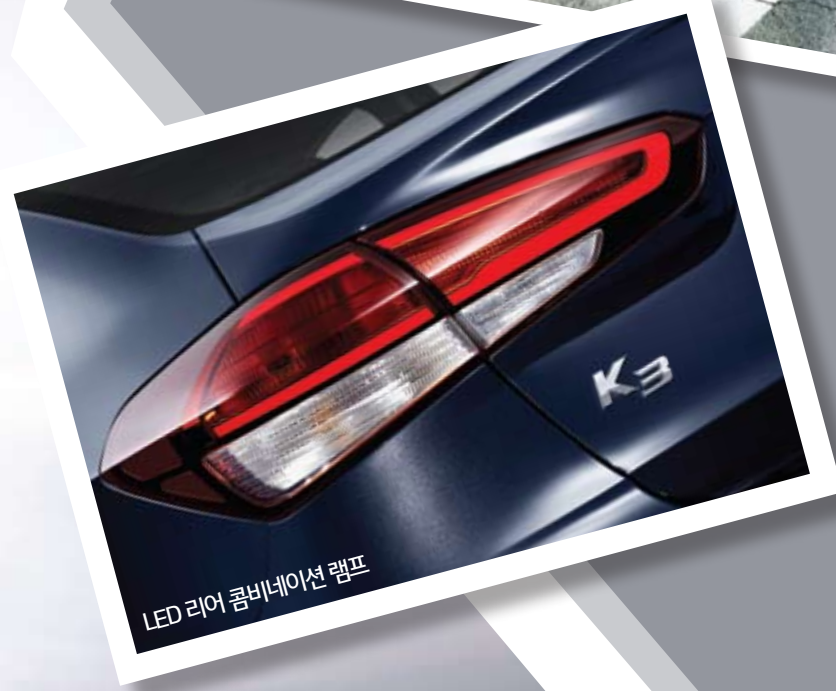
LED 리어 콤비네이션 램프