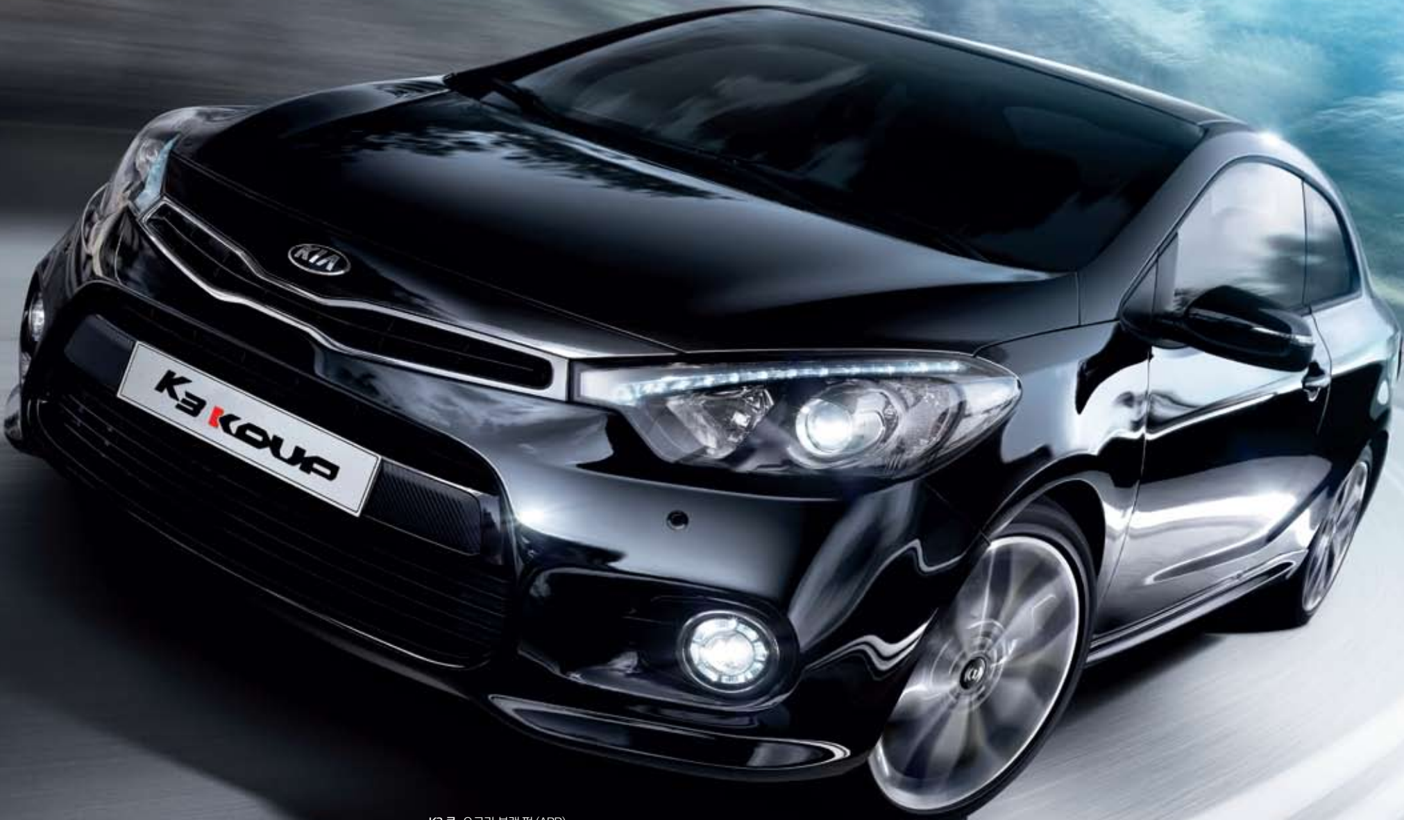
K3 쿵_오로라 블랙 펄 (ABP)