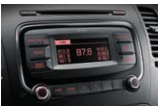
CDP 오디오 (MP3 재생)