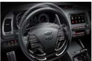
수동식 틸트 & 텔레스코픽 스티어링 휠