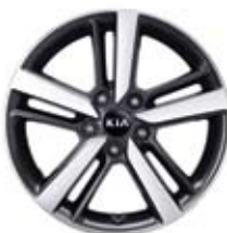
전면가공 17인치 알로이 휠