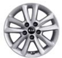
16인치 알로이 휠