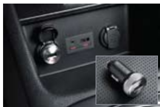
iPod 단자 & USB 충전기