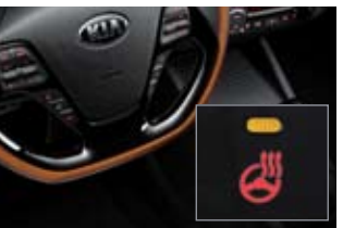
히팅 스티어링 휠