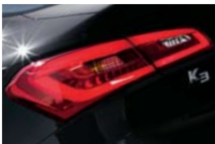
LED 리어콤비네이션 램프