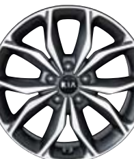
전면가공 18인치 알로이 휠 ※ 쿵 T-GDI 전용