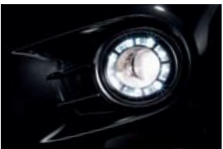
LED 라운딩 프로텍션 안개등