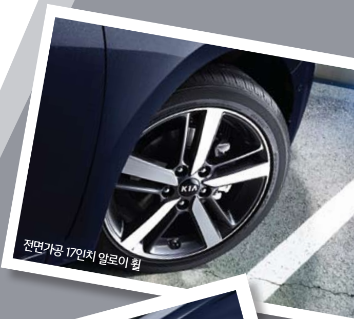
전면가공 17인치 알루미늄 휠