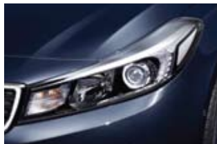
HID 헤드램프 & LED DRL