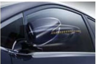
리퍼터 일체형 아웃사이드 미러 (전동접이)