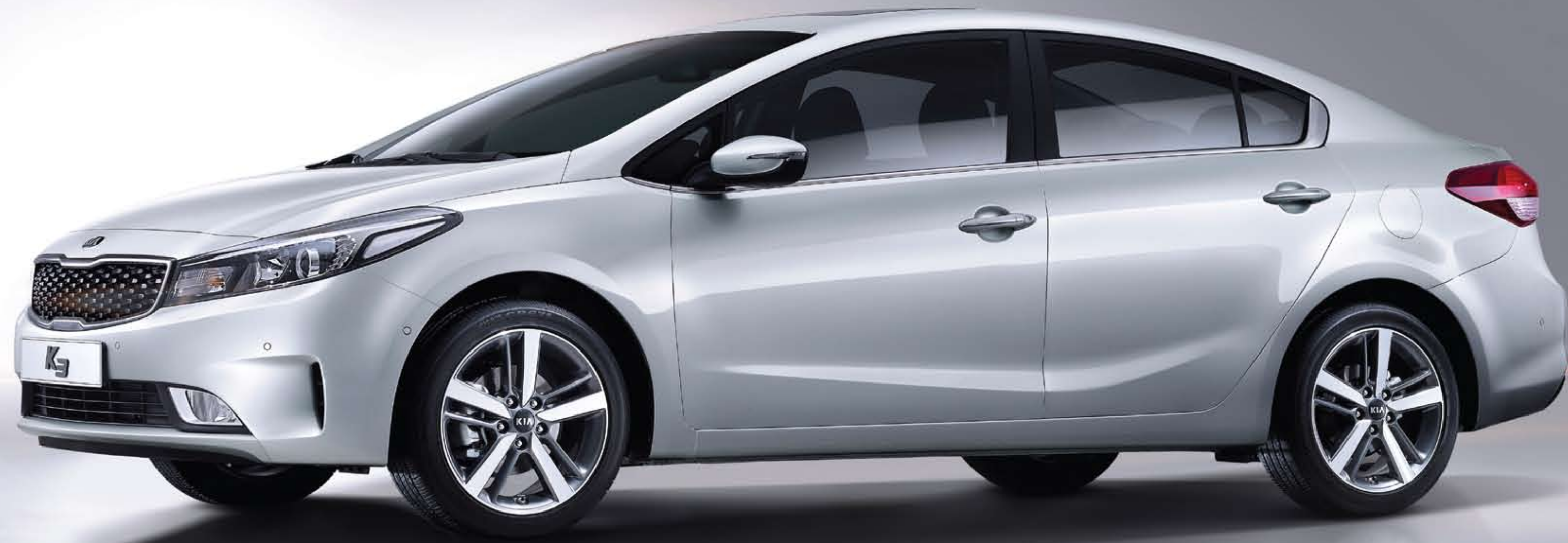
K3 세단_실키 실버 (4SS)