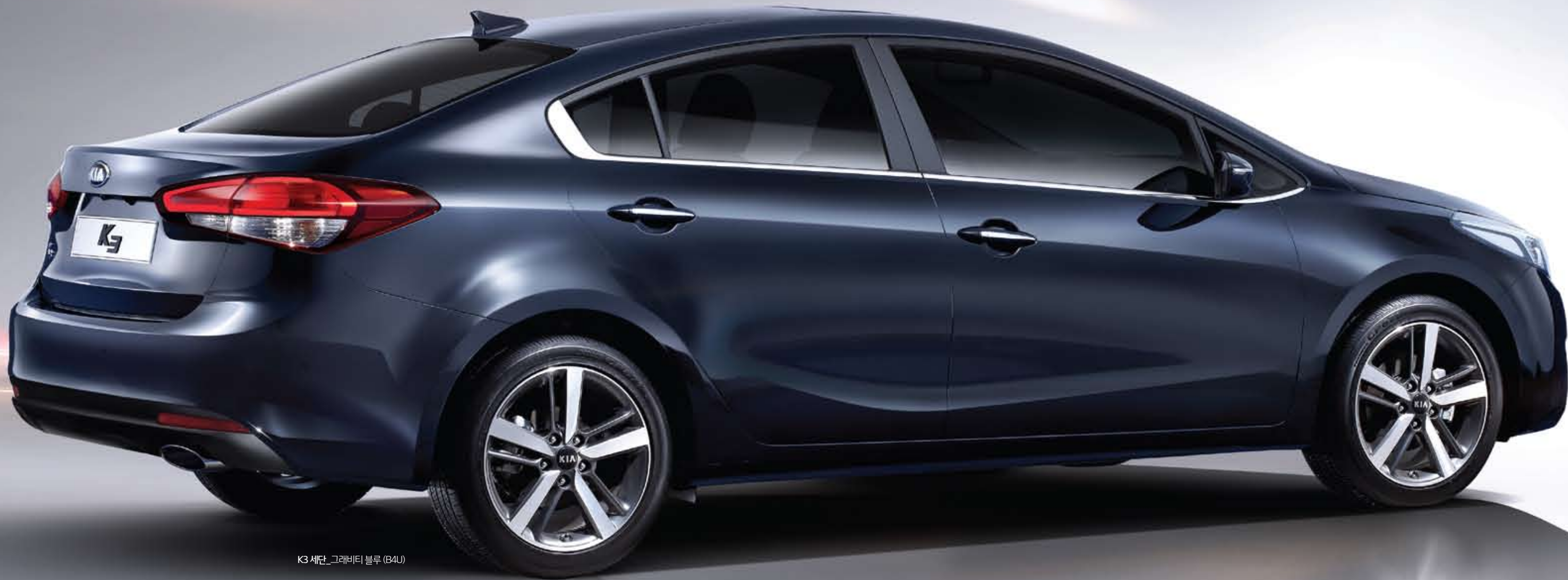
K3 세단_그래비티 블루 (B4U)