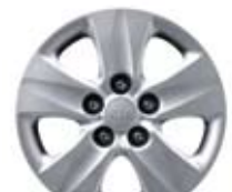
15인치 풀 사이즈 스틸 휠 커버