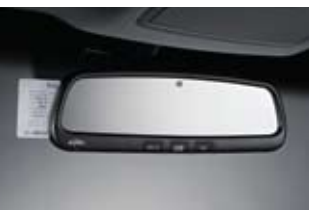
전자식 롱미러 (ECM) & 자동 요급정수 시스템 (ETCS)

※ 위 연비는 표준모드에 의한 연비로서 도로상태, 운전방법, 차량적재, 정비상태 및 외기온도에 따라 실 주행연비와 차이가 있습니다.