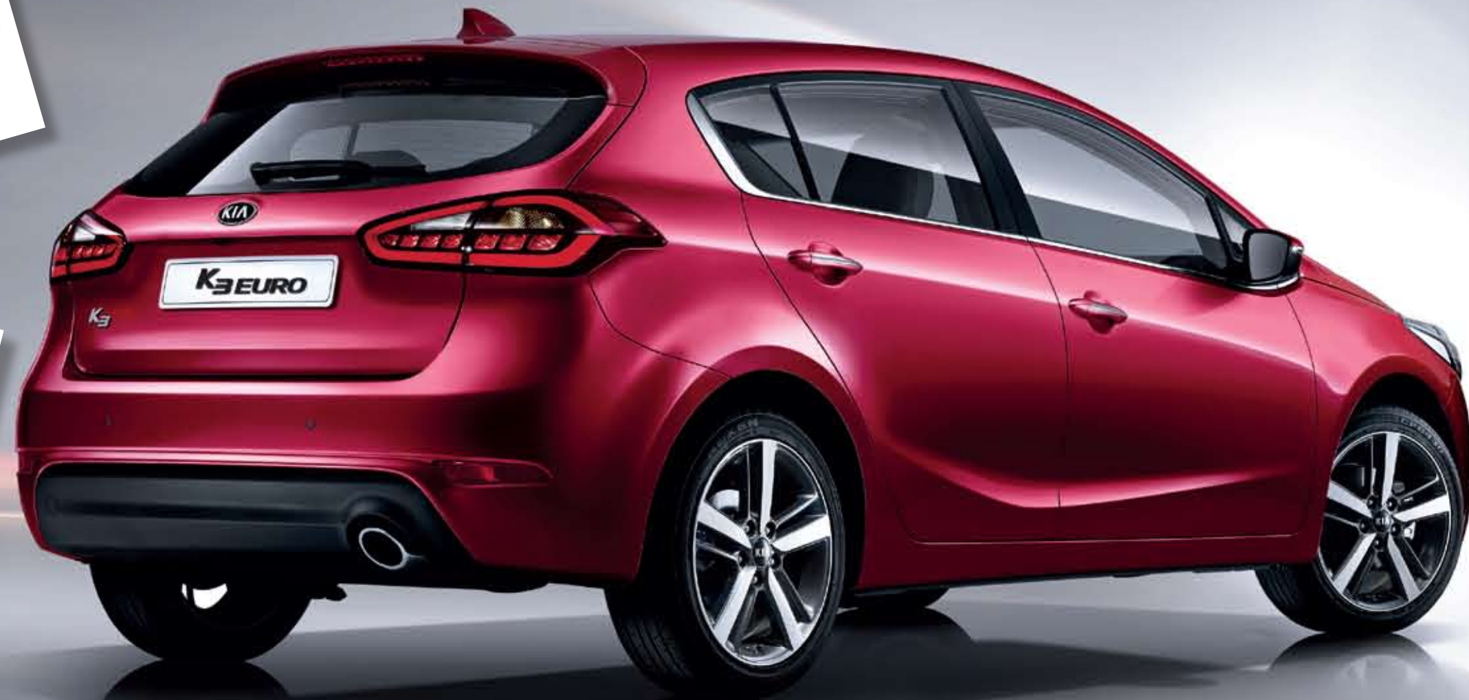
K3 유로_템테이션 레드 (K3R)

뒷좌석 6:4 분할 폴딩 시트 뒷좌석 분할 폴딩 등의 편리한 시트 기능은 승차 인원 수와 적재물의 양에 따라 공간을 자유롭게 활용할 수 있도록 해드립니다.