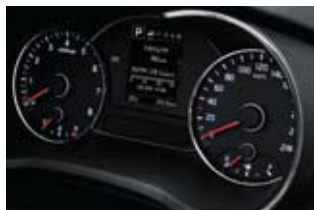
고급형 클러스터 (3.5인치 모노 TFT LCD)