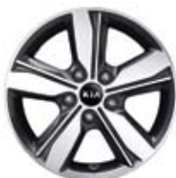
전면가공 16인치 알로이 휠