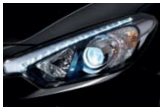
HID 헤드램프 & LED DRL