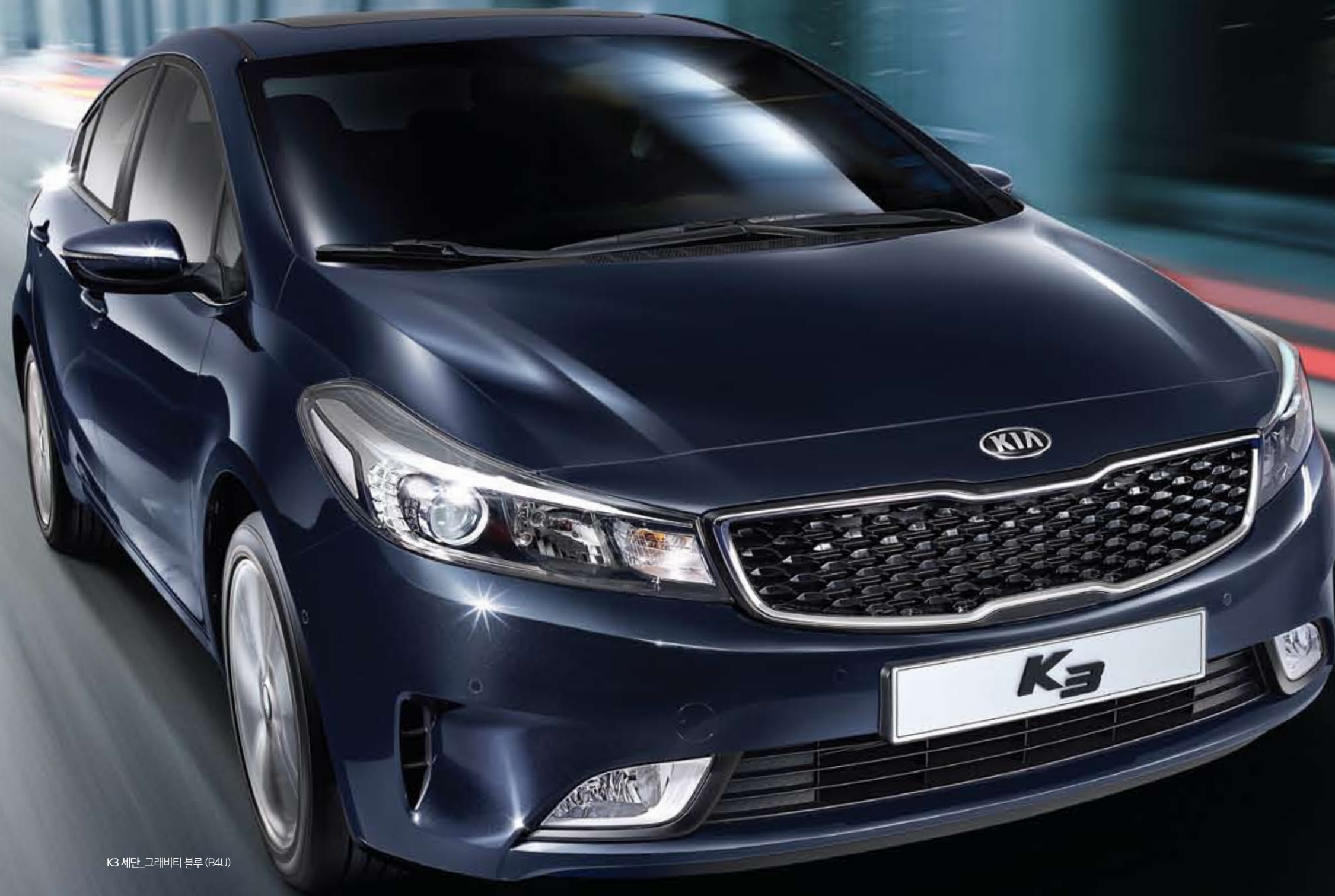
K3 세단_그래비티 블루 (B4U)