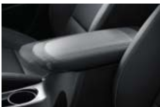
슬라이딩 콘솔 암레스트