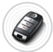
버튼 시동 스마트 키 & 스마트 트렁크