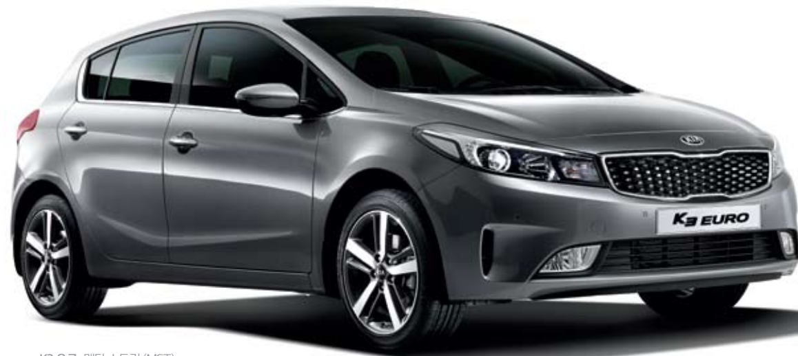
K3 유로_메탈 스트림 (MST)