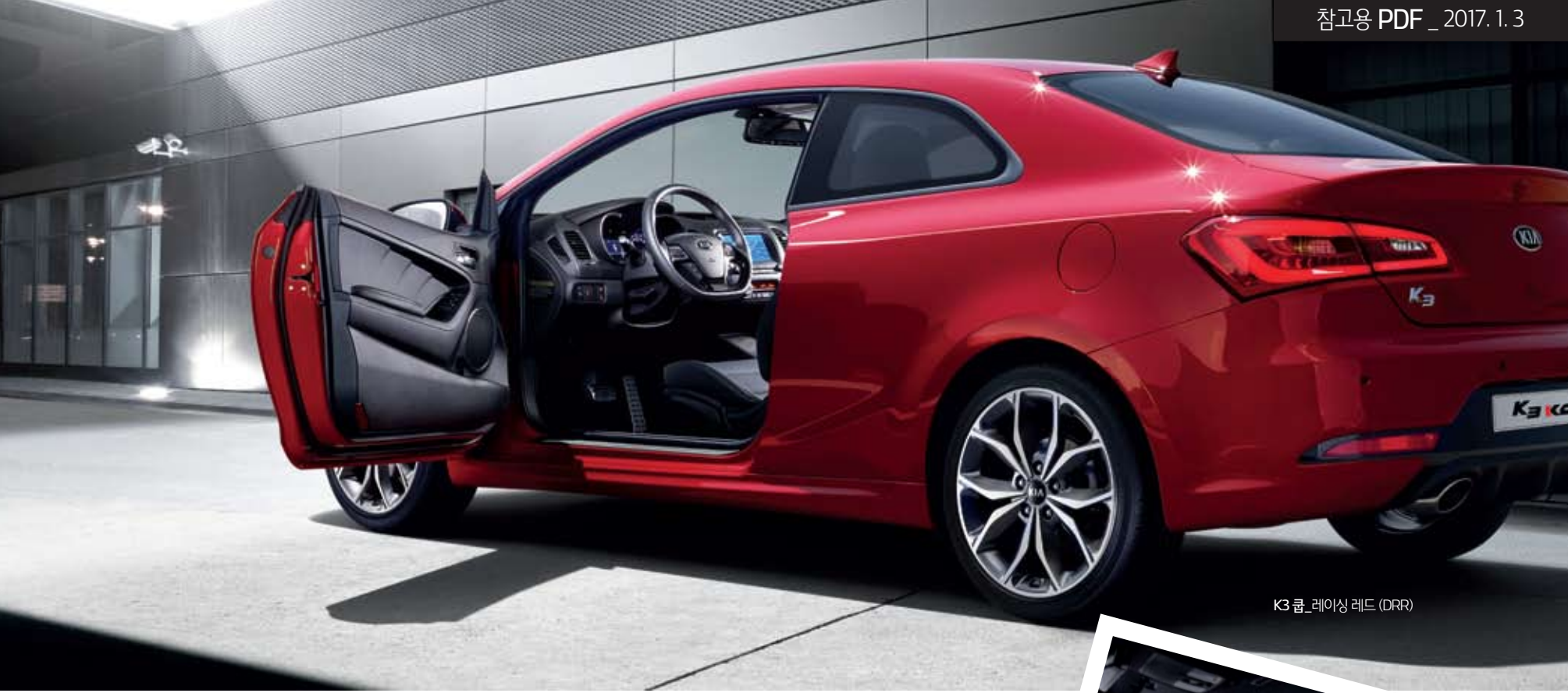
K3 쿵_레이싱 레드 (DRR)