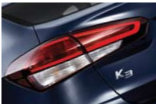
LED 리어콤비네이션 램프