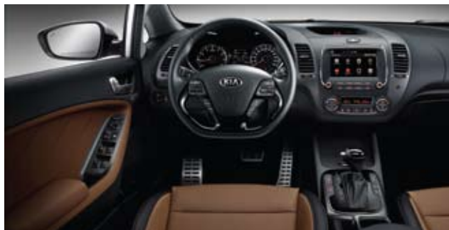
브라운 칼라 패키지 (가죽 시트) ※ 세단/유로 전용