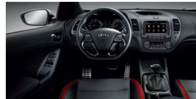
레드 오렌지 칼라 패키지 (가죽 시트) ※ 쿵 T-GDI 전용