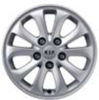
15인치 알로이 휠